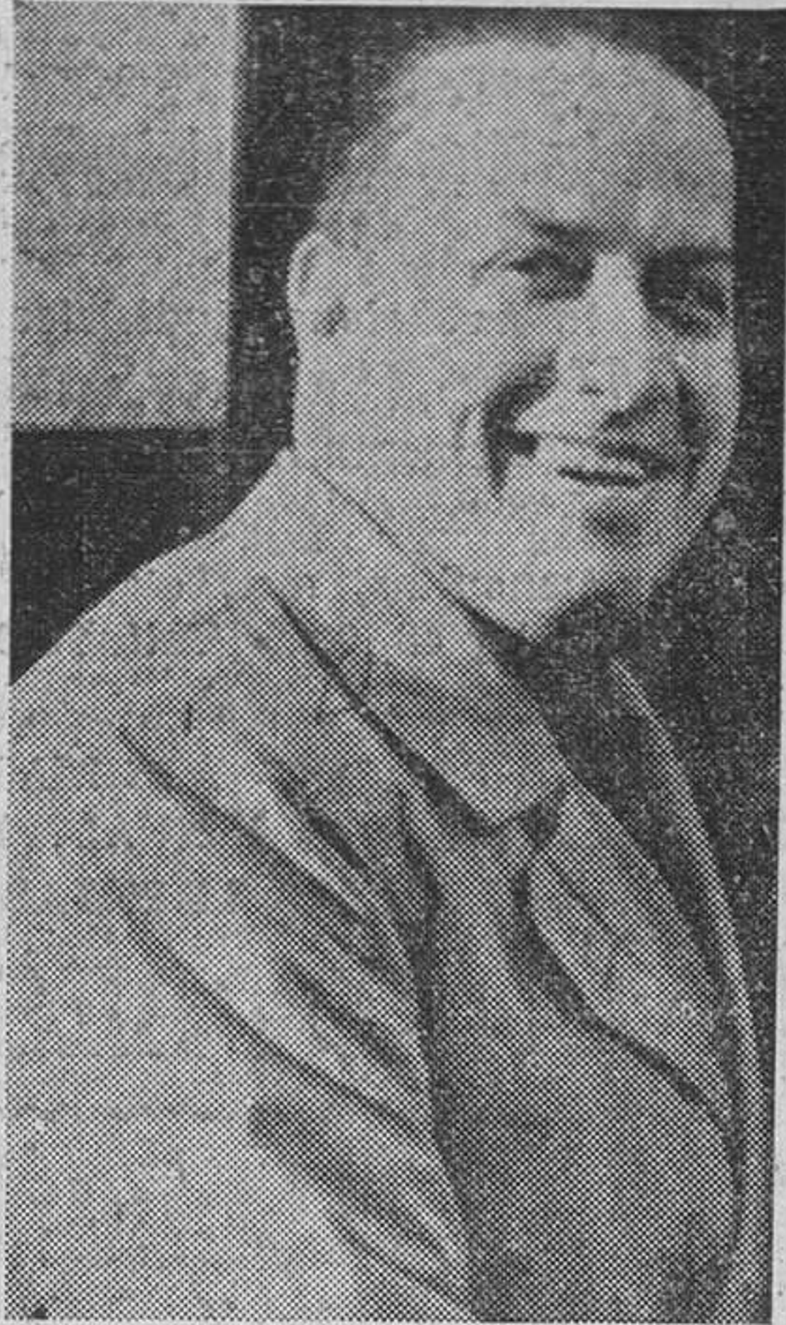
EL CONDE CIANO

A despedirlo de la base han acudido el embajador de Alemania, el ministro de Hungría, todo el personal de la embajada española, colectividades de la misma nación, todos los falangistas españoles residentes en Roma,