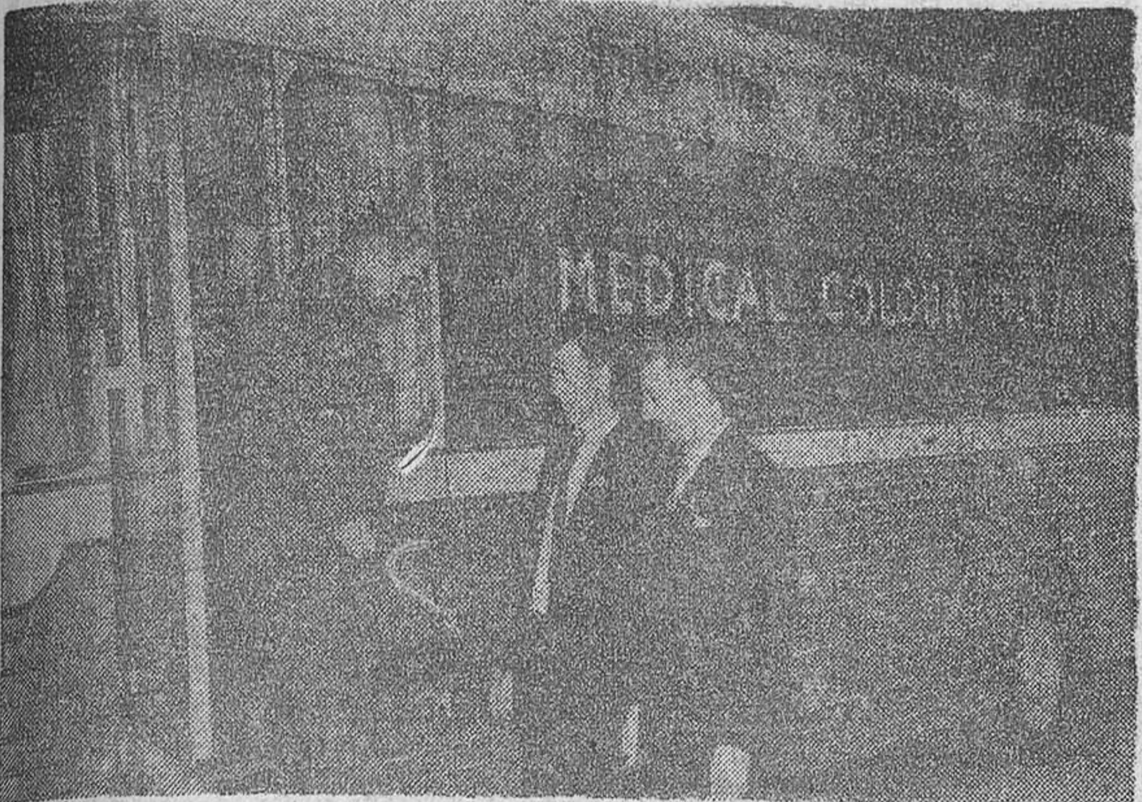
Acaba de hacerse entrega en Inglaterra, a una firma norteamericana de productos farmacéuticos, de la primera televisión policromática móvil para transmisión médica. La empresa, cuyo gerente general aparece aquí saliendo del vehículo televisor, tras de haberlo inspeccionado, había empleado hasta ahora equipo manufacturado en Norteamérica. La unidad móvil representa el más avanzado diseño del mundo. Se usará para televisar operaciones quirúrgicas en Congresos de Medicina, funcionando como cámara normal de transmisión exterior, en circuito cerrado.