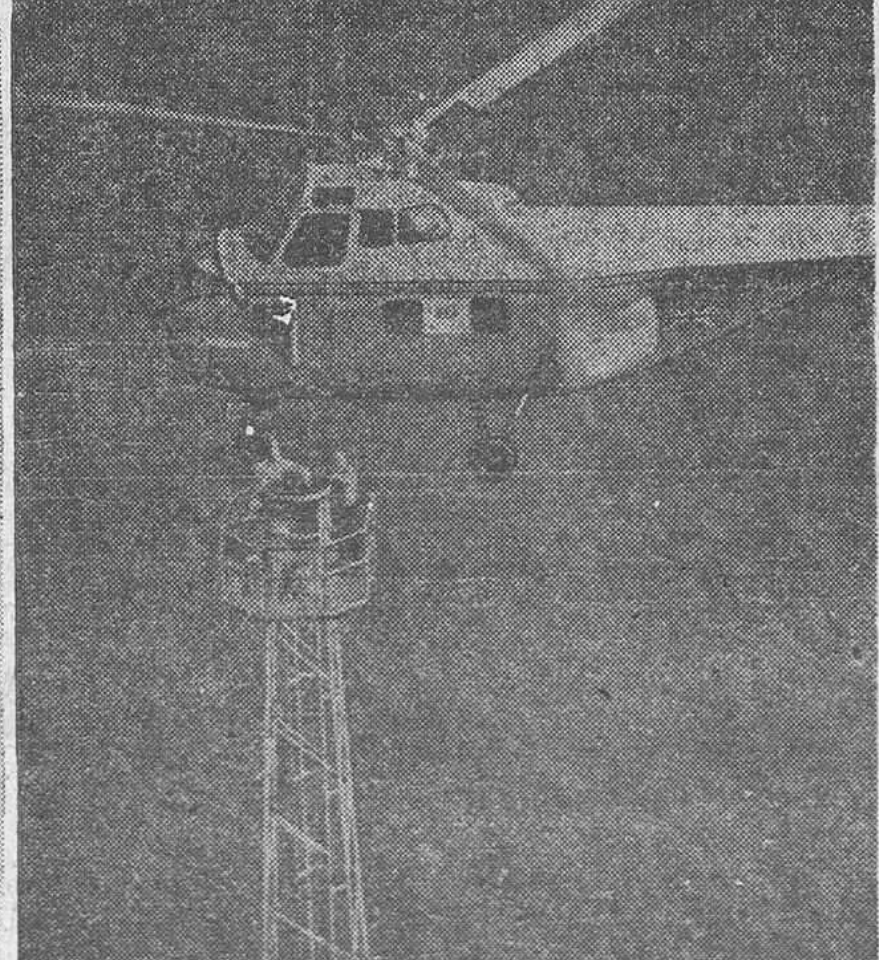
En la fotografía de la izquierda se ve cómo ayuda la Marina británica al Ejército transportando sus vehículos por helicóptero durante las operaciones anfibas efectuadas recientemente en la costa meridional de Inglaterra. Y en la fotografía de la derecha se aprecia la utilidad del helicóptero al instalar sobre una torre de veinticinco metros y medio, sin emplear ninguna grúa, una baliza de aproximación que pesa media tonelada, en el nuevo aeropuerto de Gatwick, al sur de Londres

Ahora, a los veintidós años de esta fecha, el juicio de la historia ha revelado a España y al mundo la verdad de una actitud gallarda, insobornable, casi profética. Porque la lucha iniciada por Franco el 18 de julio rebasa con mucho nuestras fronteras, rebasa también y por lo mismo el ámbito del tiempo, para revestirse de la dimensión universal, que está más allá del aquí y del ahora. Contra los capitalismo y totalitarismos, en el área social, la bandera que levantó Franco representaba el símbolo de la justicia y de las reivindicaciones obreras. Contra turbias maquinaciones de trasnochados partidismos, la bandera de Franco simbolizaba el espíritu de la unidad nacional. Contra la asechanza orientalista y absorbente de la URSS, Franco simbolizaba el europeísmo, la tradición milenaria que forjó el espíritu de un continente con el troquel fundamental y fundamentante del cristianismo que abroquelara el Sacro Imperio