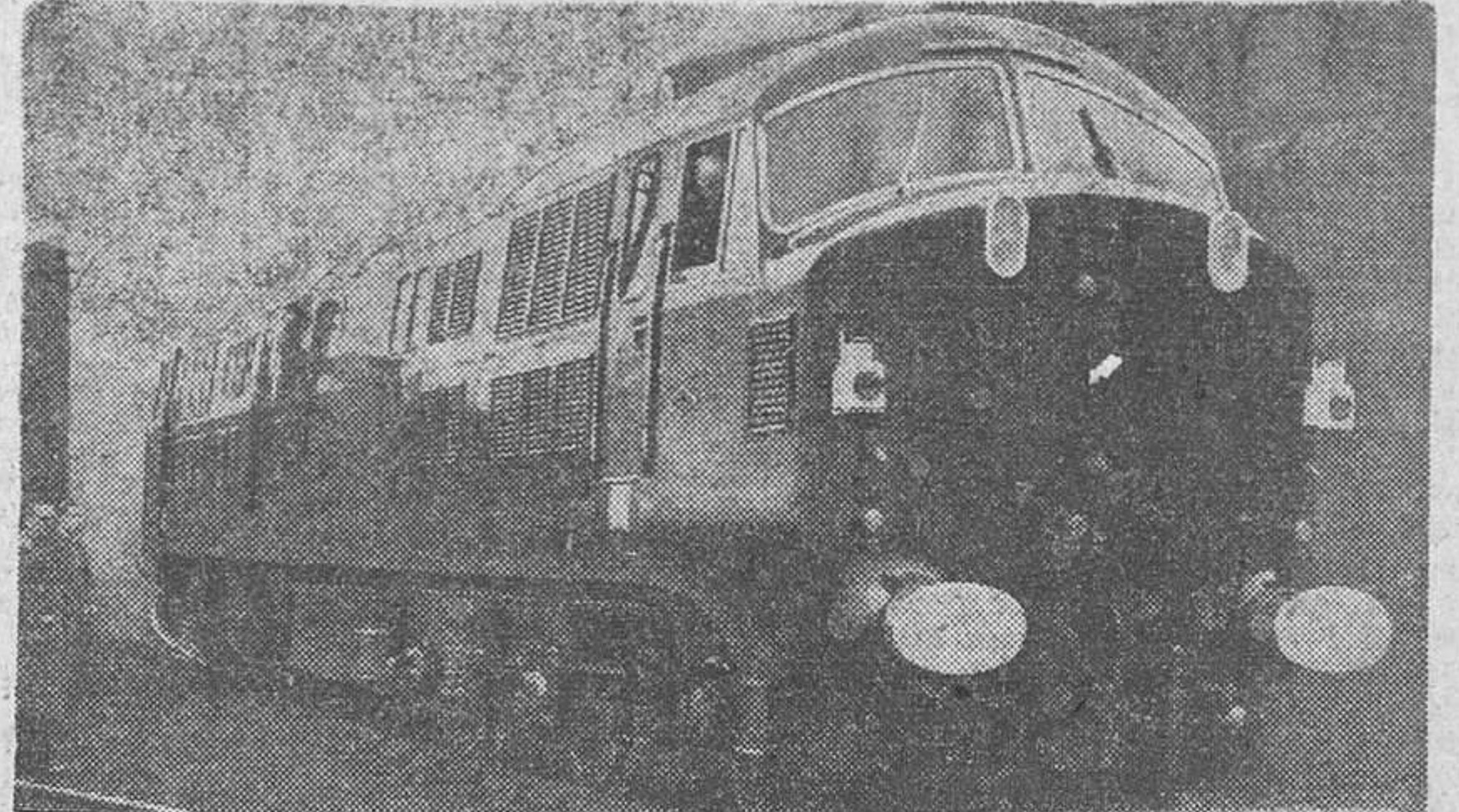
La primera locomotora británica de transmisión hidráulica, para vías principales, sale de los talleres de construcción en Glasgow (Escocia) para comenzar las pruebas. Esta máquina de líneas aerodinámicas, desarrolla 2.000 HP, y pesa 116 toneladas. Es la primera locomotora de las 174 de alta potencia, para vías principales, encargadas por los ferrocarriles británicos en virtud del plan de modernización.