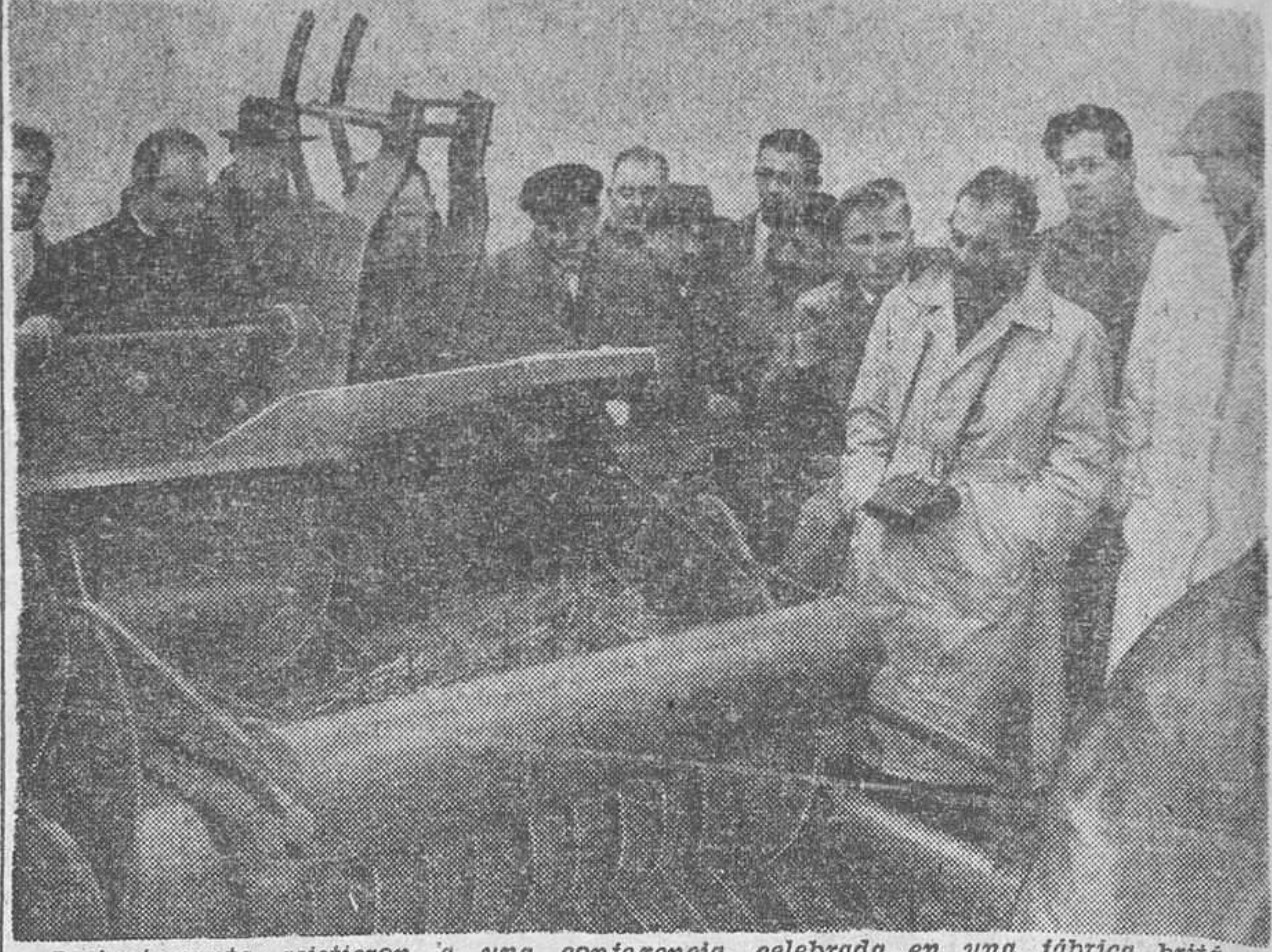
Recientemente asistieron a una conferencia, celebrada en una fábrica británica de tractores, veintidós gerentes de empresas extranjeras dedicadas al mantenimiento y reparación de tractores agrícolas e industriales. En esta fotografía aparecen varios miembros del grupo visitante examinando una empacadora, una de las cinco máquinas presentadas por la compañía en la Exposición de Smithfield, efectuada en Londres.