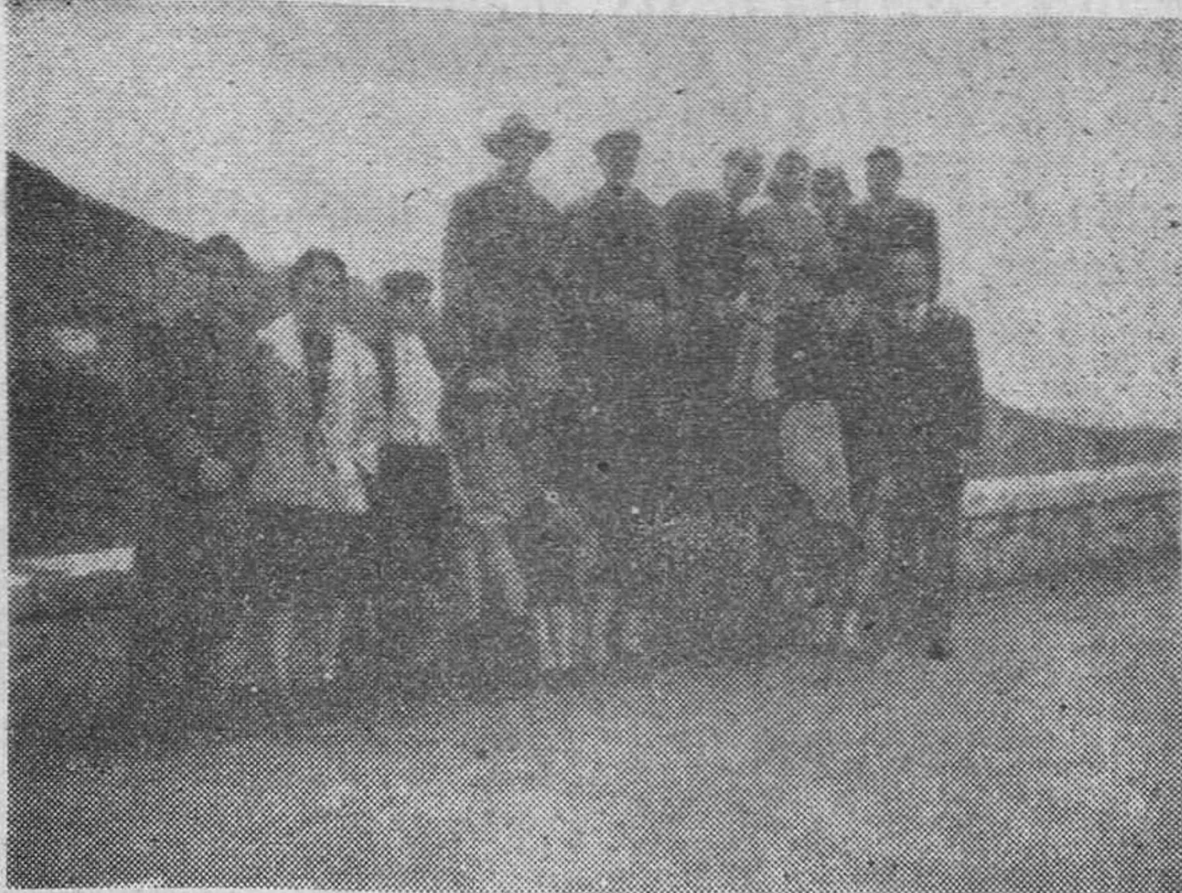
Con tiempo acuden los agüistas a Lanjarón (la localidad del buen clima), para preparar su alojamiento durante la próxima temporada veraniega

Este año, que, como los anteriores, hemos tenido la fortuna de presenciar en Lanjarón la llamada Fiesta de la Infancia, en homenaje a sor Joaquina, fiesta de la que nos ocupamos en otro lugar de este número, hemos comprobado como la iniciativa privada se muestra activa en grado sumo para que cada día el pueblo progresa en todos los aspectos y siga siendo un lugar de la máxima atracción por su situación privilegiada, además de sus famosas aguas.