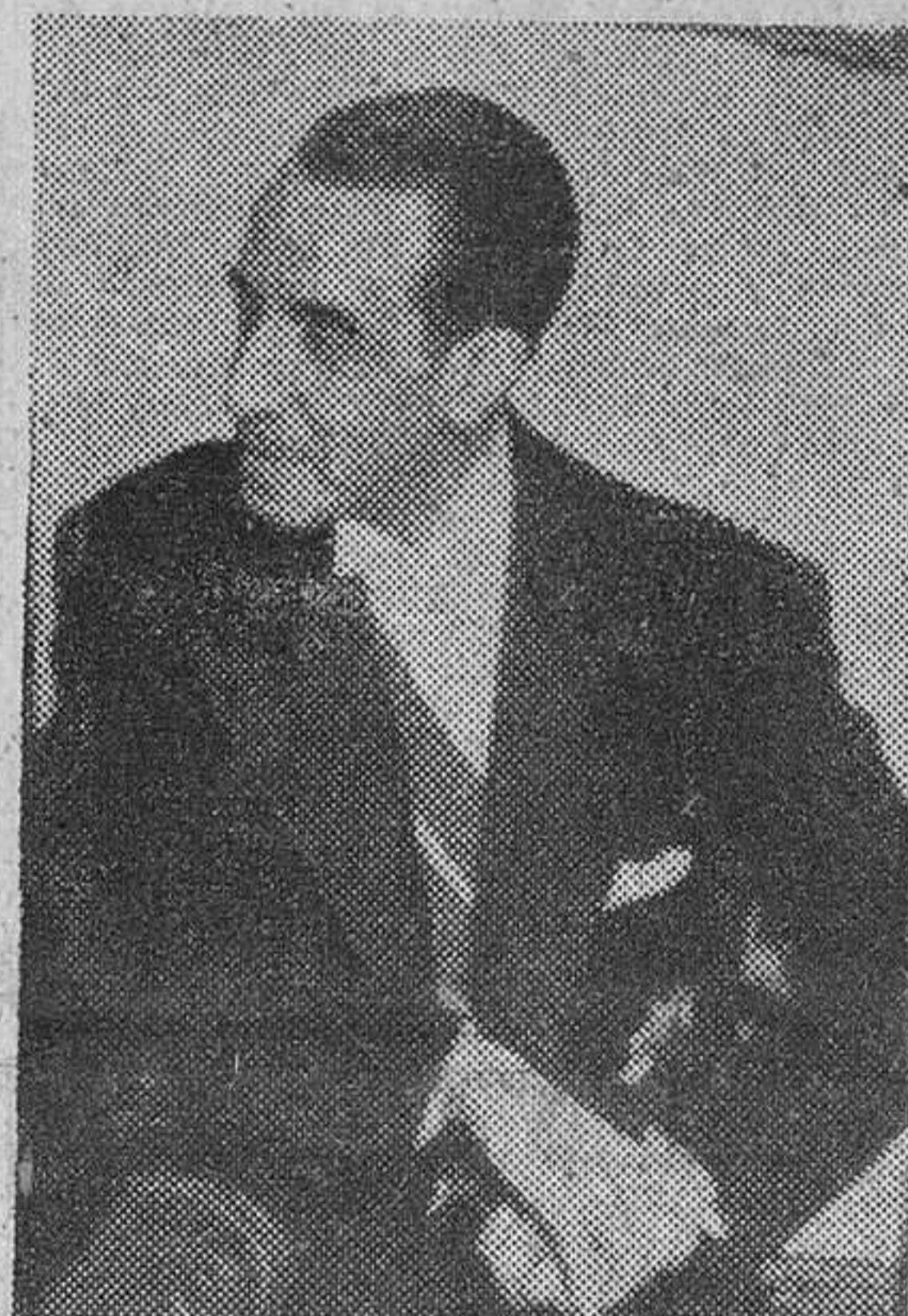
Don Antonio Gallego y Burtin, director general de Bellas Artes, artífice de los Festivales de Granada.