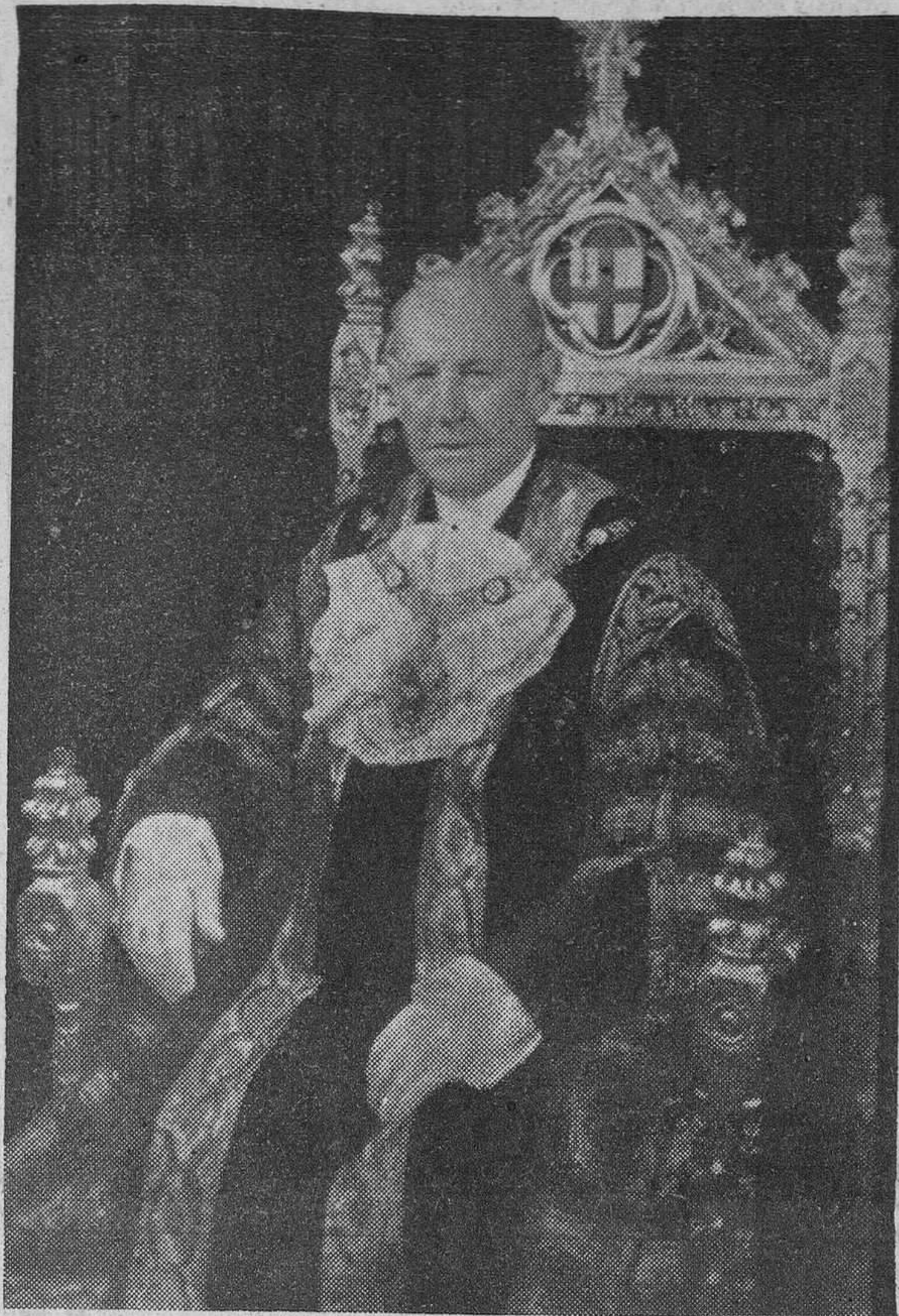
Sir Harold Gillet, lord mayor de Londres.