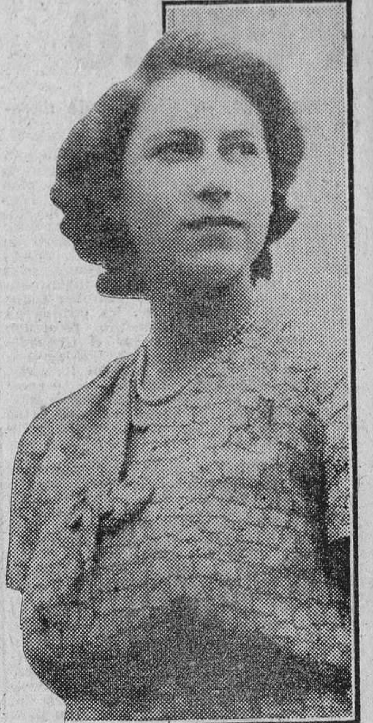
ISABEL II DE INGLATERRA

Ahora los empleados de palacio tienen que firmar un papel comprometiéndose a no publicar en vida lo que oyen y ven allí.