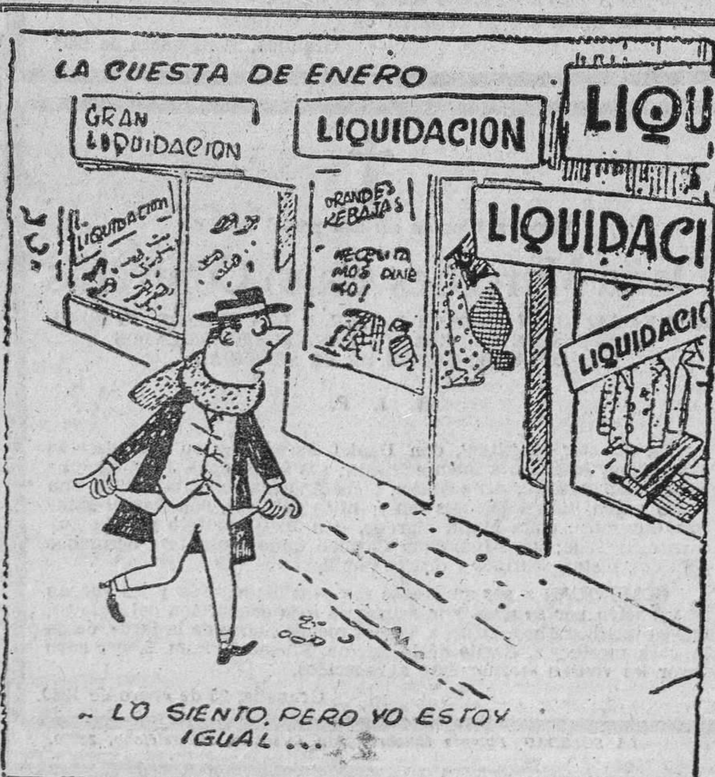
LO SIENTO, PERO YO ESTOY IGUAL...

PARIS, 24. — El Instituto Pasteur ha anunciado que la gripe asiática afecta a varias regiones de Francia y que ya se han registrado algunas muertes. La región más afectada es la del valle de Frohne. En el ministerio de Sanidad se ha declarado que los hospitales se hallan casi llenos en todo el país, debido a la gripe, y por falta de personal médico no se pueden abrir nuevos centros, aunque se hayan establecido ya algunos. —(Efe).