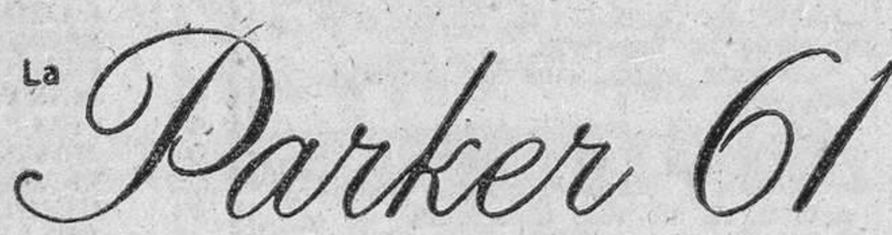
la pluma de acción capil

Un Nuevo Concepto en Escritura Inspirado por la Naturaleza!