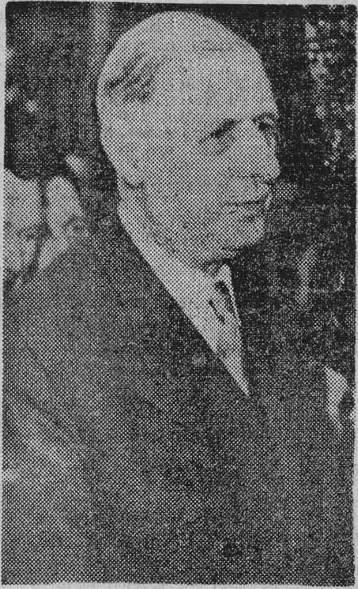
PRESIDENTE DE GAULLE