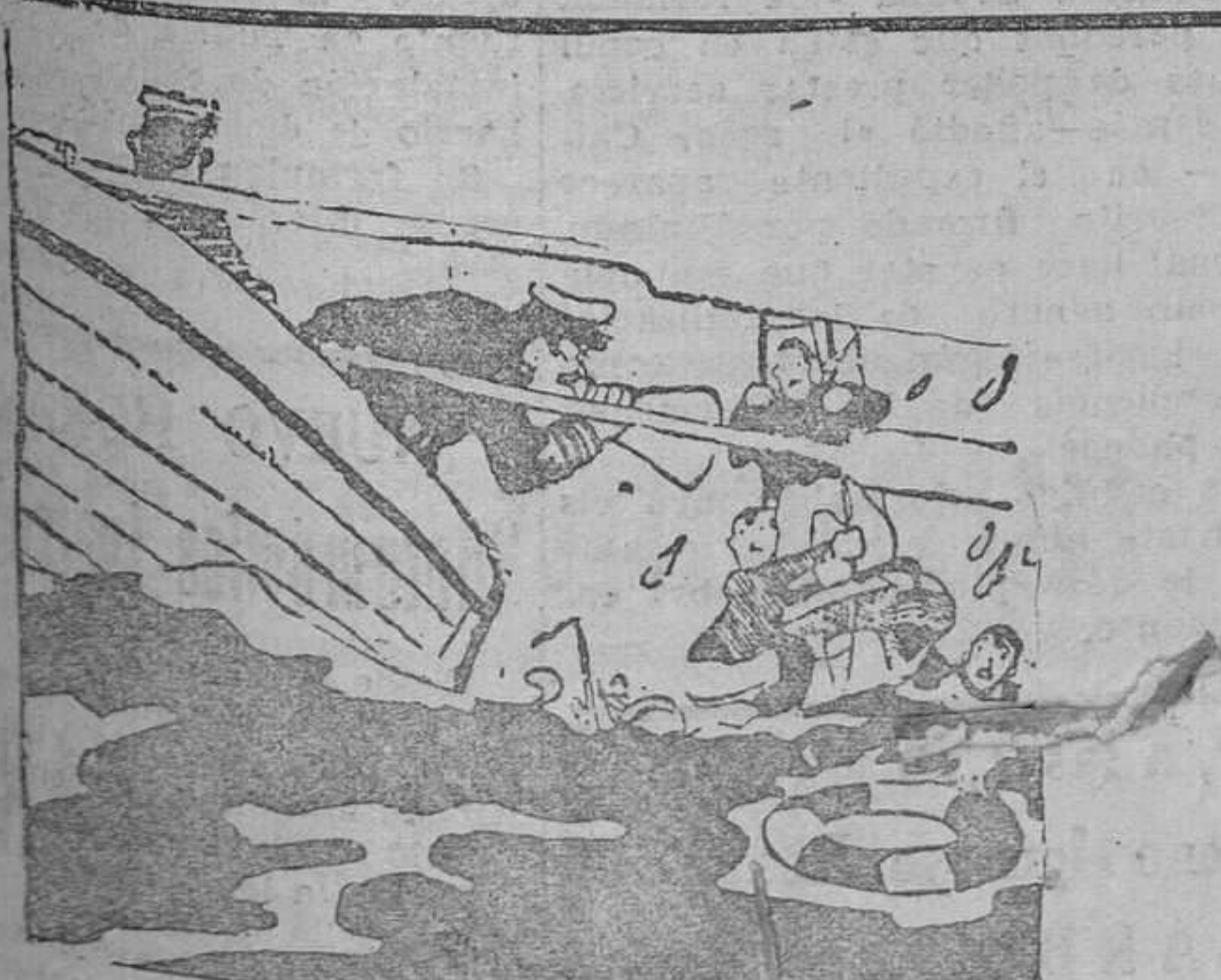
—¡Socorro! ¡Me ahogo! —No sea usted exagerado. Para ahogarse tiene usted que estar más tiempo con la cabeza debajo del agua.