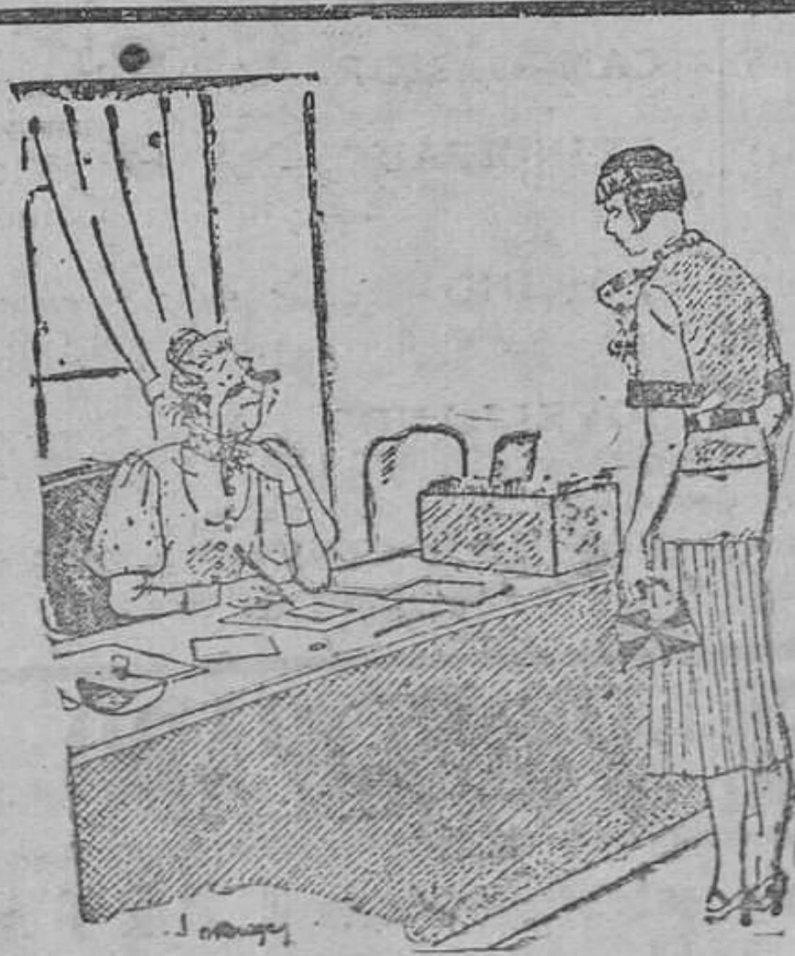
En el estanco.— Me ha dado usted un sello que no se pega, por más que lo he humedecido con la lengua. —¡Es curioso! Esta es la quinta vez que me lo devuelven por el mismo motivo.