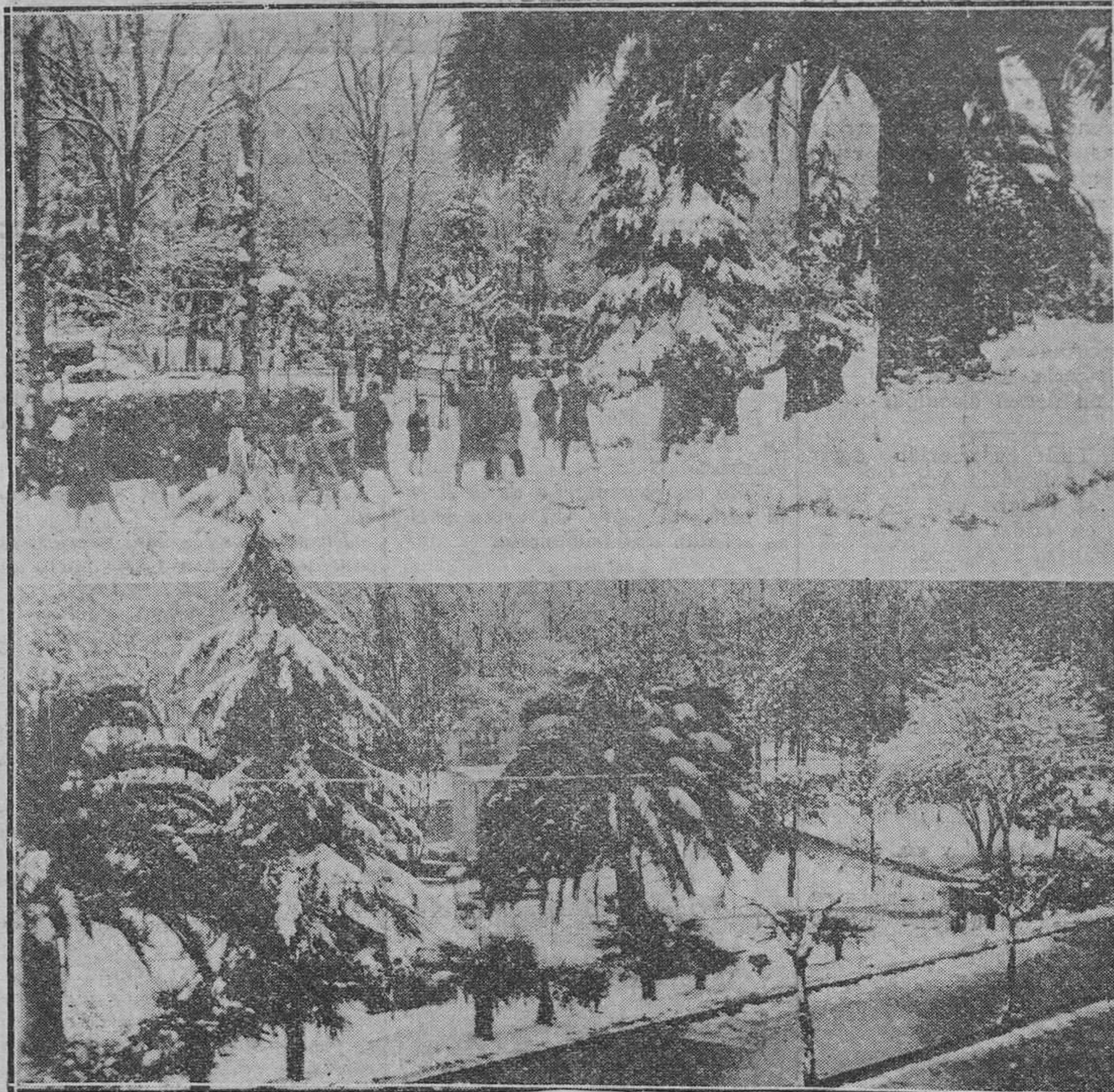
La capital, como muchos pueblos de la provincia aparecieron ayer nevados. Ofrecemos dos aspectos del Campo de San Francisco que ofrecen la sensación de dos bellos paisajes suizos.

TRAJES A MEDIDA: Azul marino, garantizado el color y la hechura, a 110 pesetas