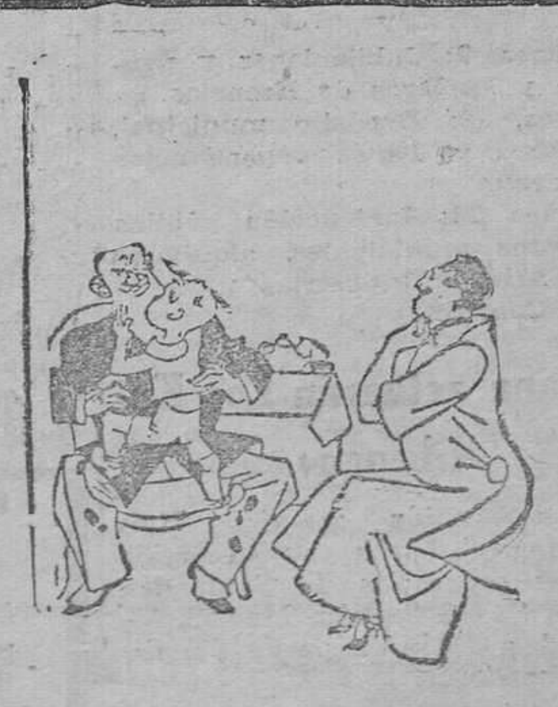
—¿Haces muchos progresos en los estudios? —¡Ya lo creo! Al principio apenas me atrevía a mirar al maestro y ahora ya le tiro bolitas de papel mascada a la calva.