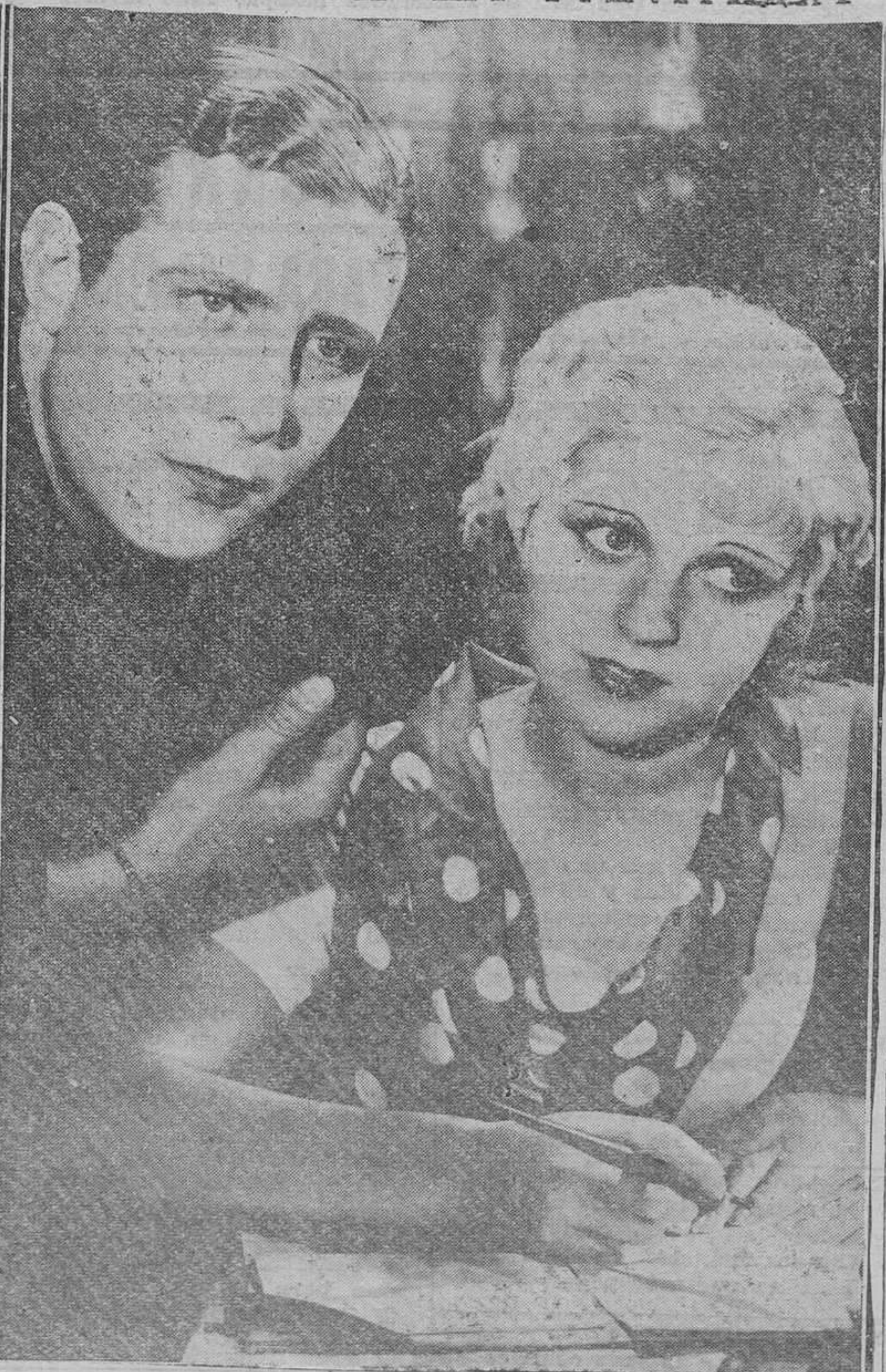
A la gracia y la belleza de Meg Lemmoner, sirve de complemento la simpática de Henry Garat, con lo que esta gentil pareja ha llegado a ser una de las más famosas del mundo cinematográfico.