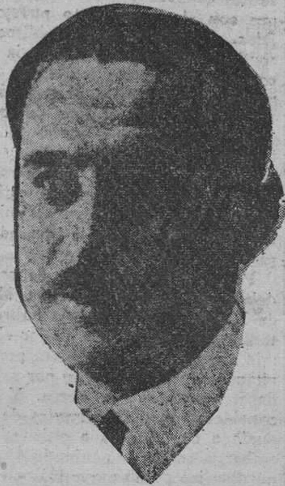
Maura que hasta ahora no hay sino coincidencias programáticas.

—Eso es otra cosa porque hay que reconocer que ellos fueron a las elecciones con un programa en el que figuraba esta cuestión de la amnistía y es natural que la cumplan.