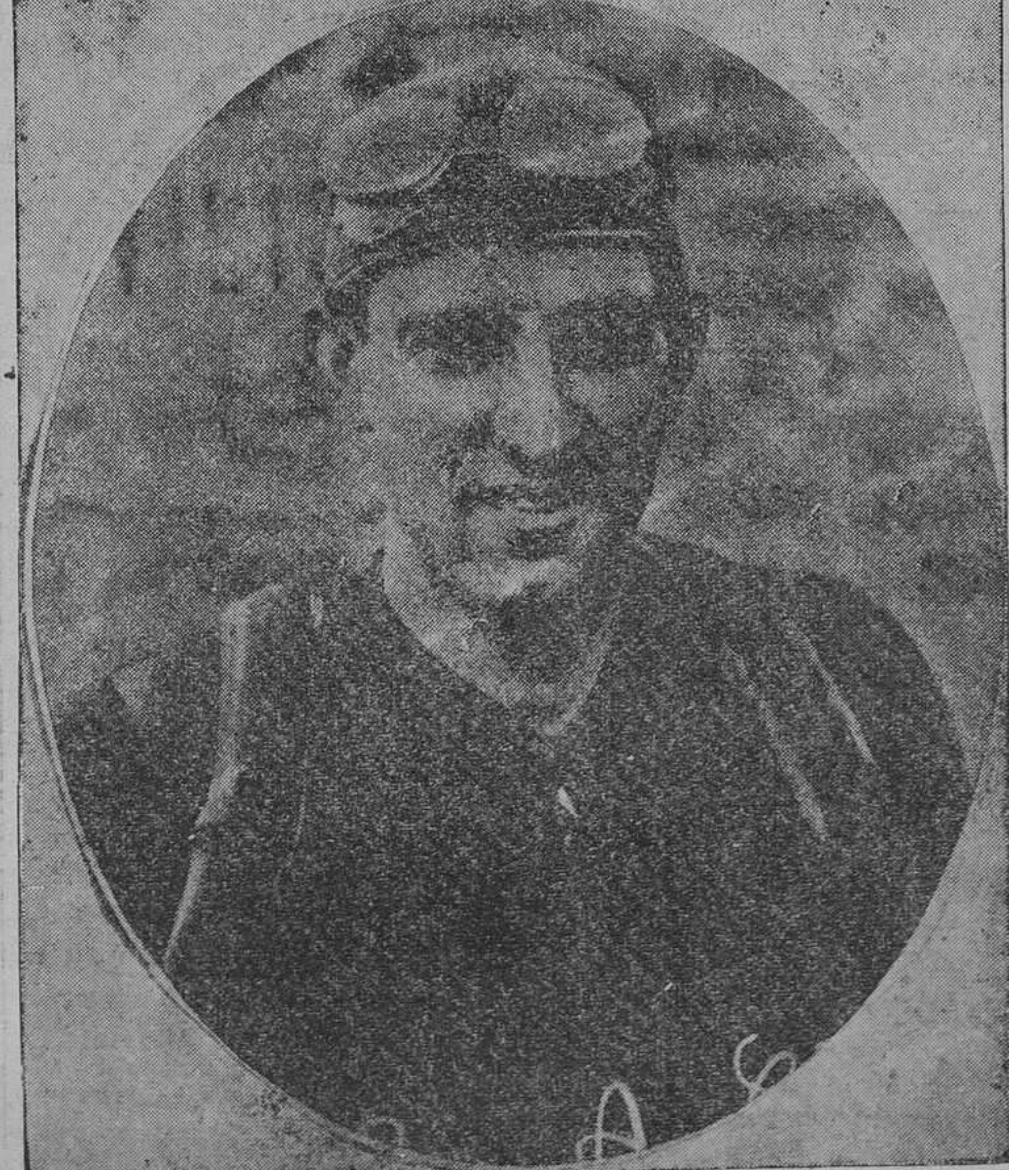
El gran ciclista bilbaíno que firmó el contrato para tomar parte en la próxima Vuelta a Francia.