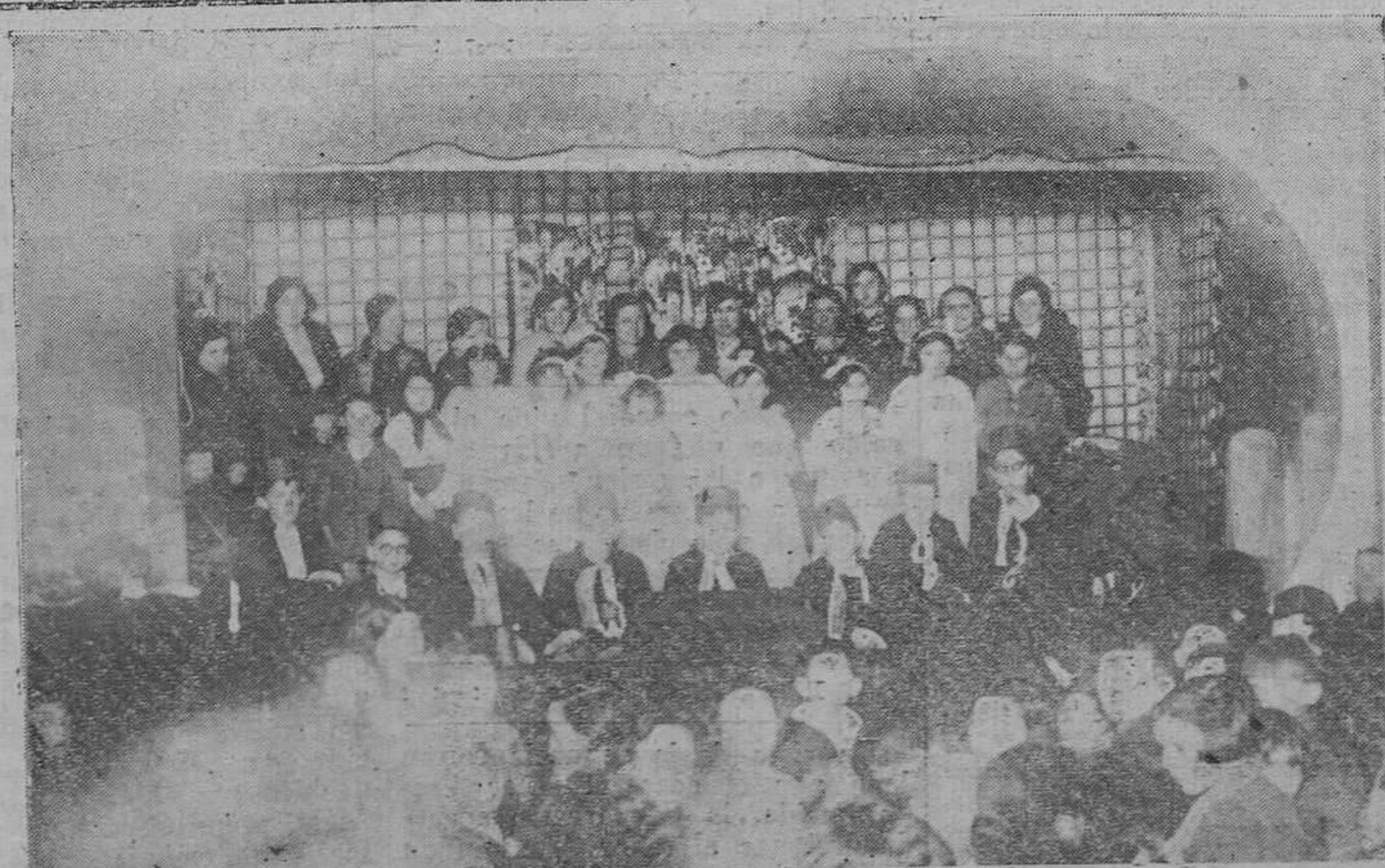
Una simpática nota gráfica de la fiesta infantil celebrada en Acción Católica de la Mujer.