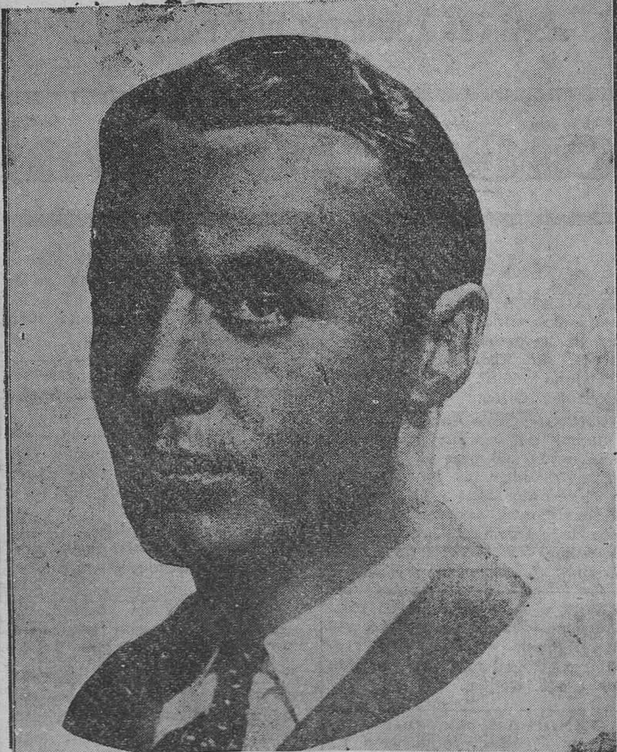
Charles Boyer, uno de los más prestigiosos entre los nuevos galanes jóvenes franceses.