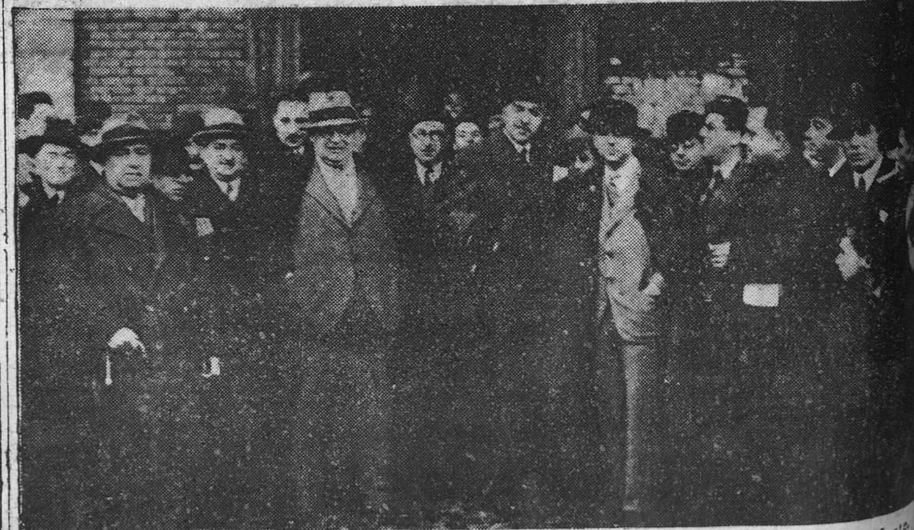
Las representaciones de distintas Corporaciones y entidades, a su llegada a la estación del Norte.

vivas la ostentaban el presidente de la Diputación, el alcalde de Oviedo, varios alcaldes de la provincia, la directiva de la Federación Patronal, el secretario del Sindicato Carbonero y otros.