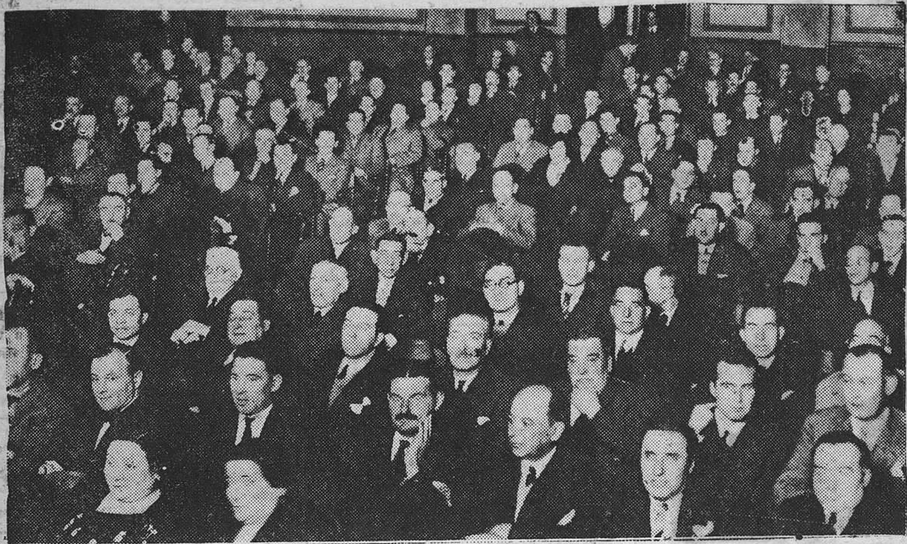
Un aspecto del teatro Principado, durante la celebración de la Asamblea Patronal Asturiana.