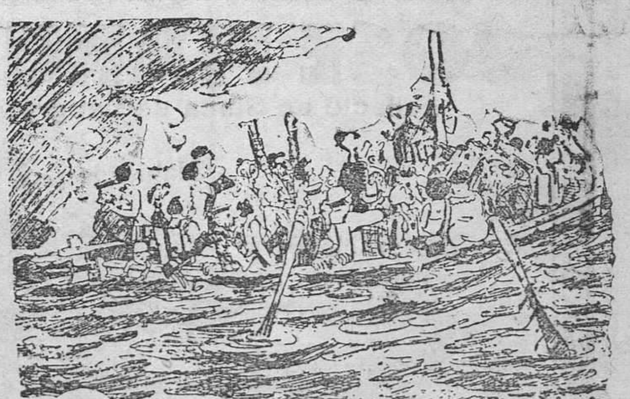
UNO DE LOS NAUFRAGOS. —¡Nos hemos dejado la baraja!