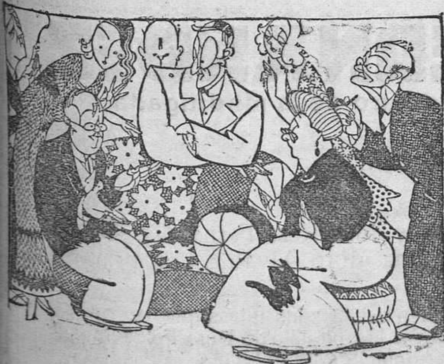
—Entre mi novio y yo hay diez años de diferencia. —Pues no es agradable casarse con un hombre al que se lleva tanta edad.

—El Gobierno, ¿está satisfecho? —En medio de su amargura an