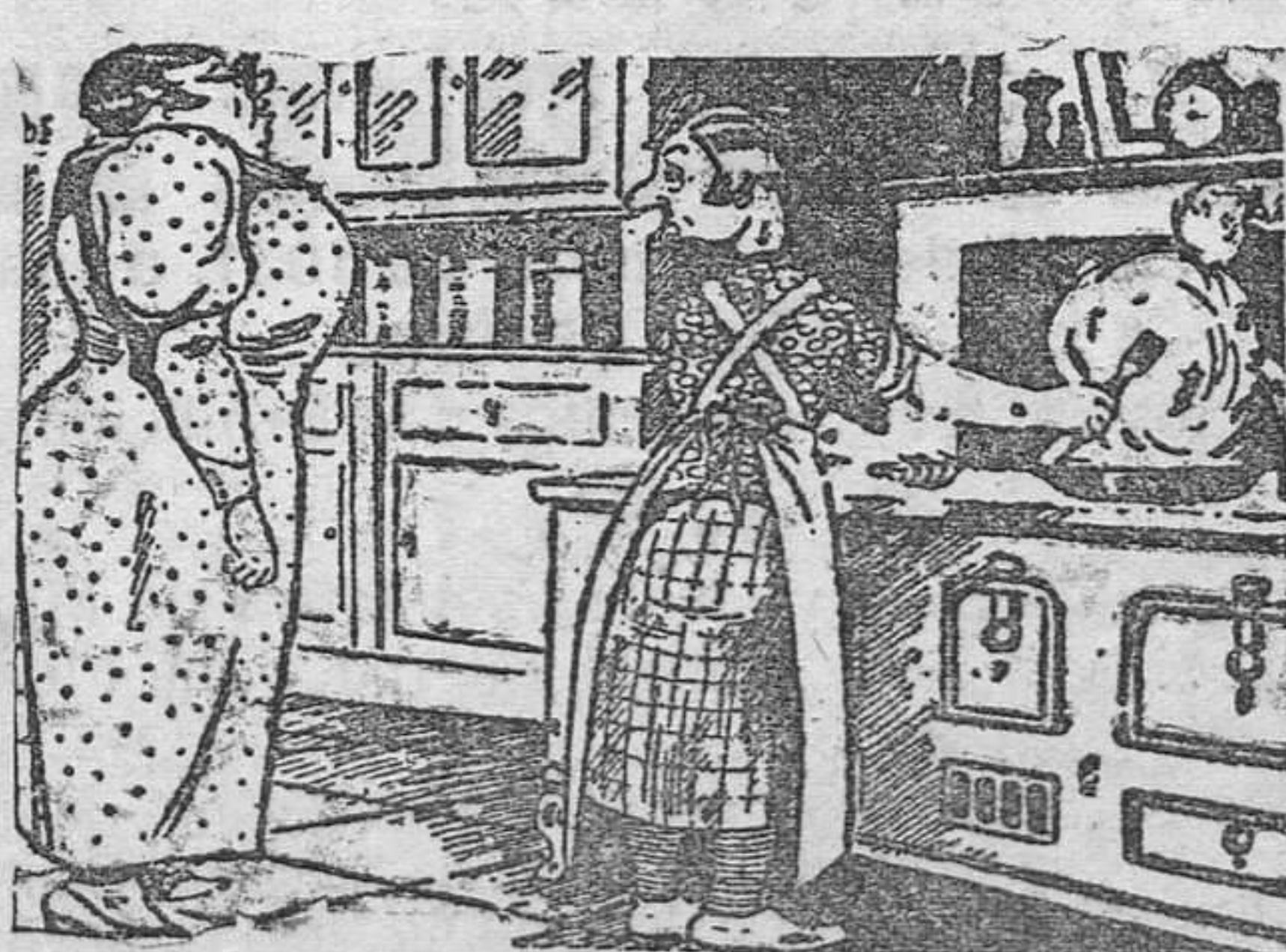
—Aquí tiene usted un libro en el que se explica el origen de todos los productos comestibles que acaba usted de comprar. —Muchas gracias. Las obras de misterio me gustan mucho.