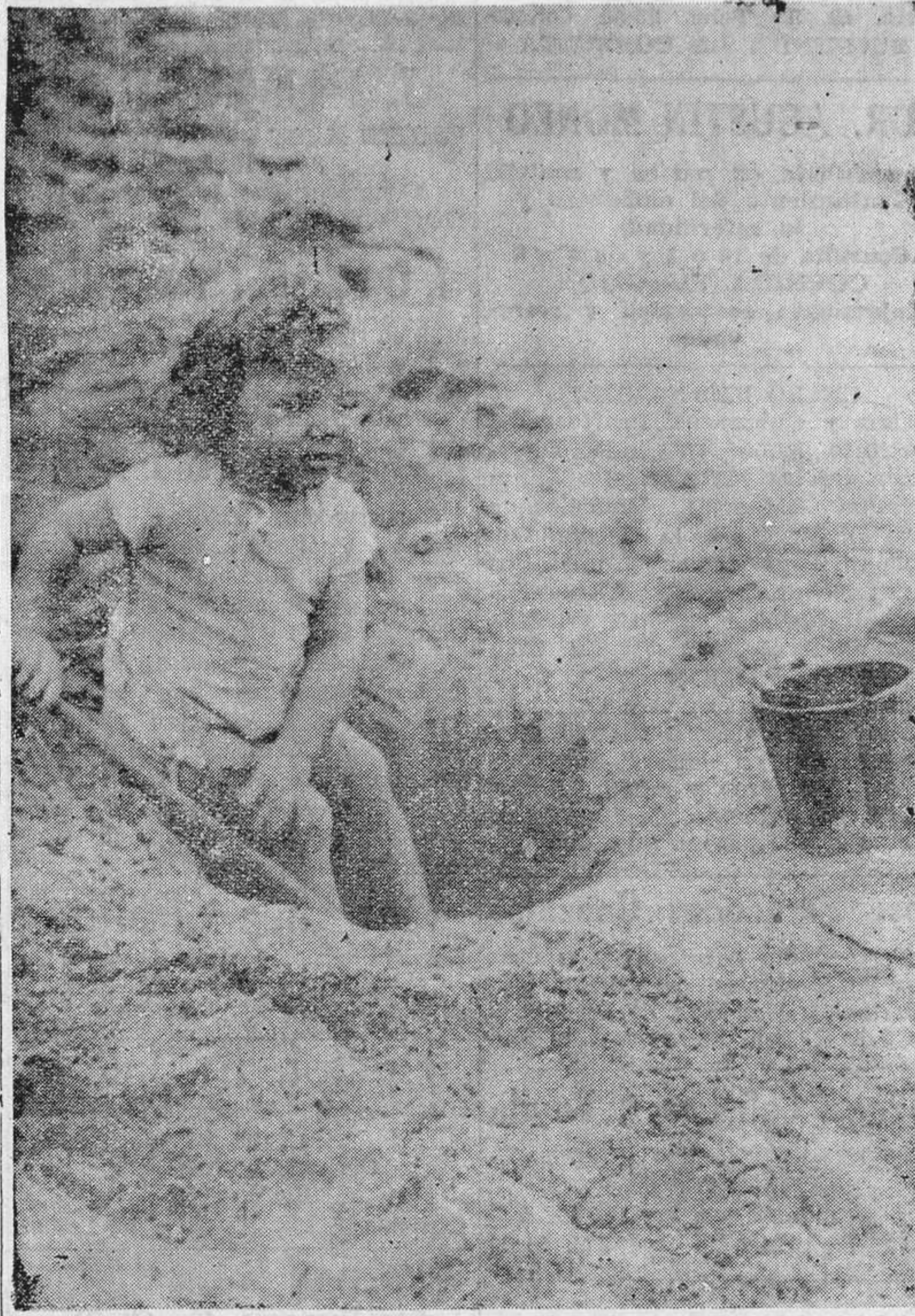
La playa es el paraíso de los "p eques". Allí pueden tumbarse a sus anchas sin que haya el peligro de que la mamá riña u "obsequie" al "bebé" con un azote.