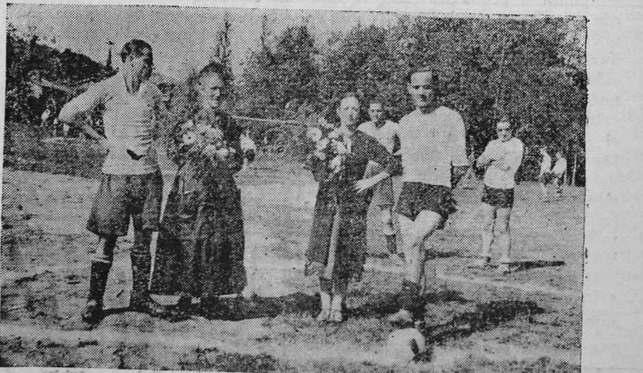
SAN MARTIN DE ANES.—De izquierda a derecha, los ca... pitanes del Amandi de Villaviciosa y del local, el Arenas de... San Pedro, con sus respectivas marlinas.