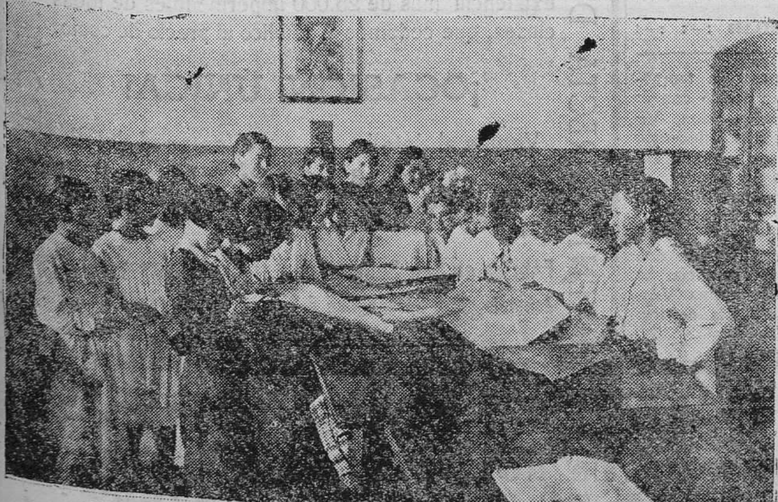
Taller de costura.—Las alumnas aprenden a cortar.—Primera- mente, lo hacen en papeles; pero luego ya se colocan en sus manos piezas de tela y de la aula salen preciosos vestidos.