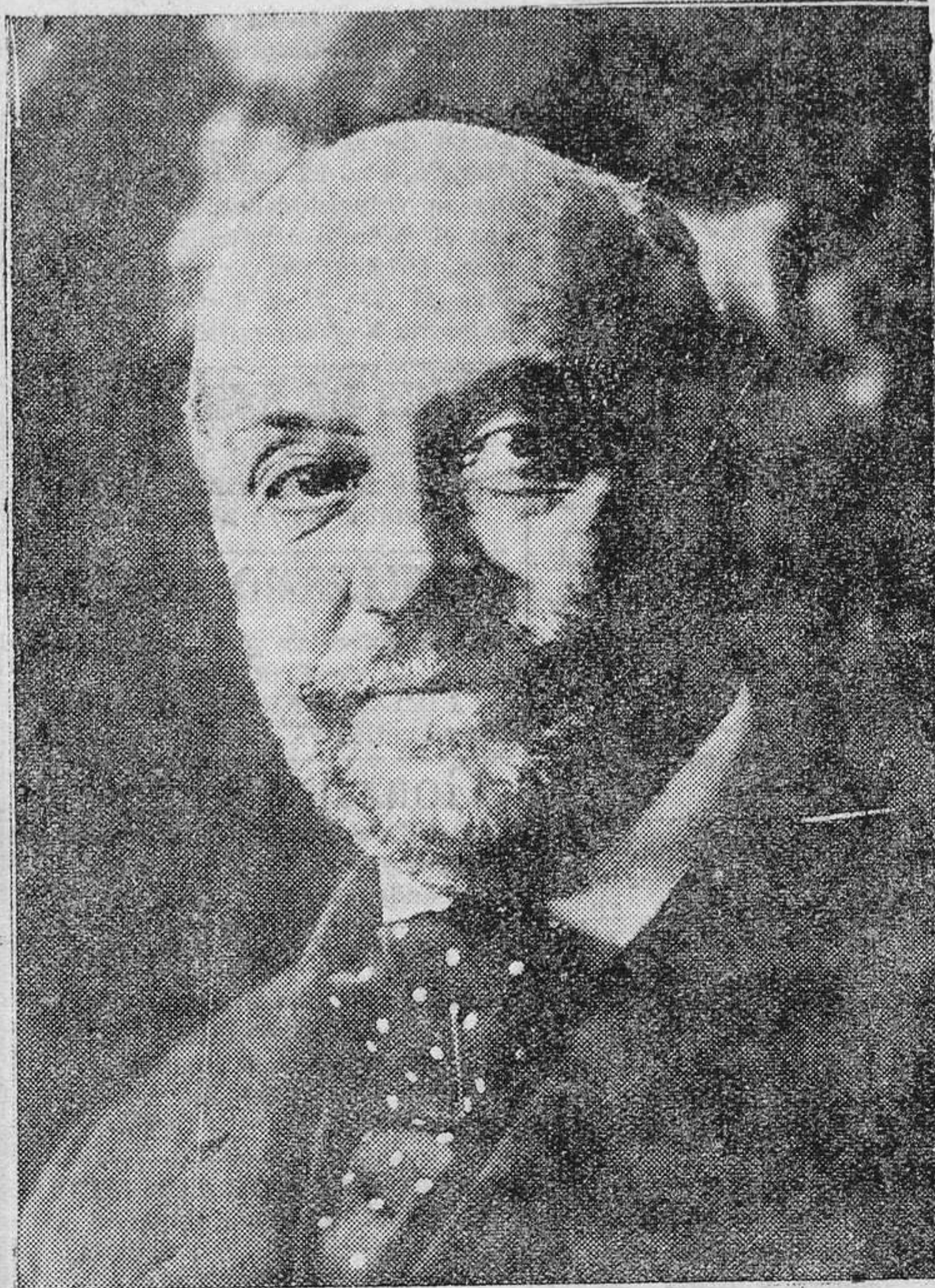
El eminente pintor don José María Sert, que ha sido designado por España para decorar uno de los salones del nuevo palacio de la Sociedad de Naciones de Ginebra.