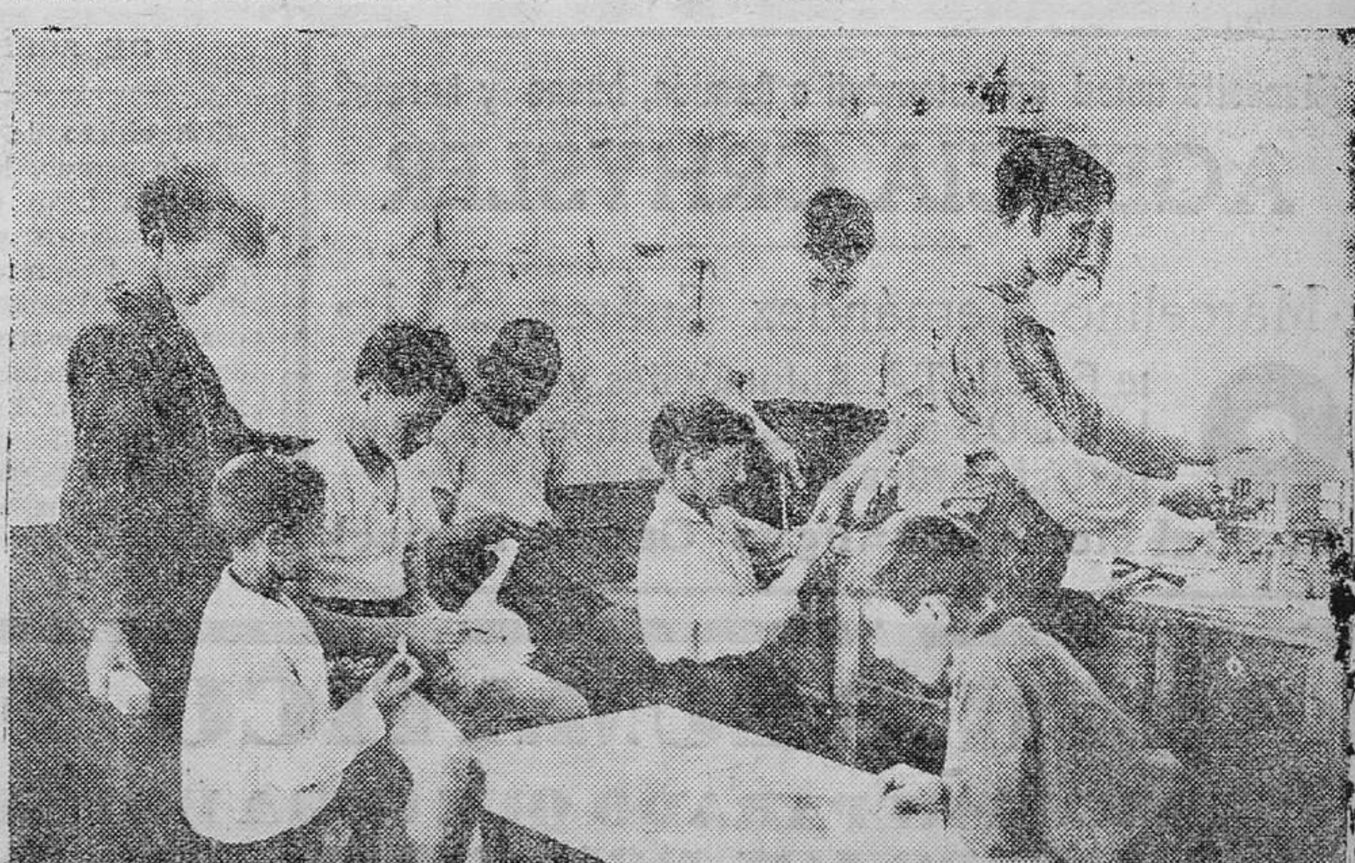
Clase-taller de trabajos manuales. Los alumnos adquieren en ella mucha habilidad y destreza en el recortado y pintado de siluetas de madera, en construcciones, etc., etc.