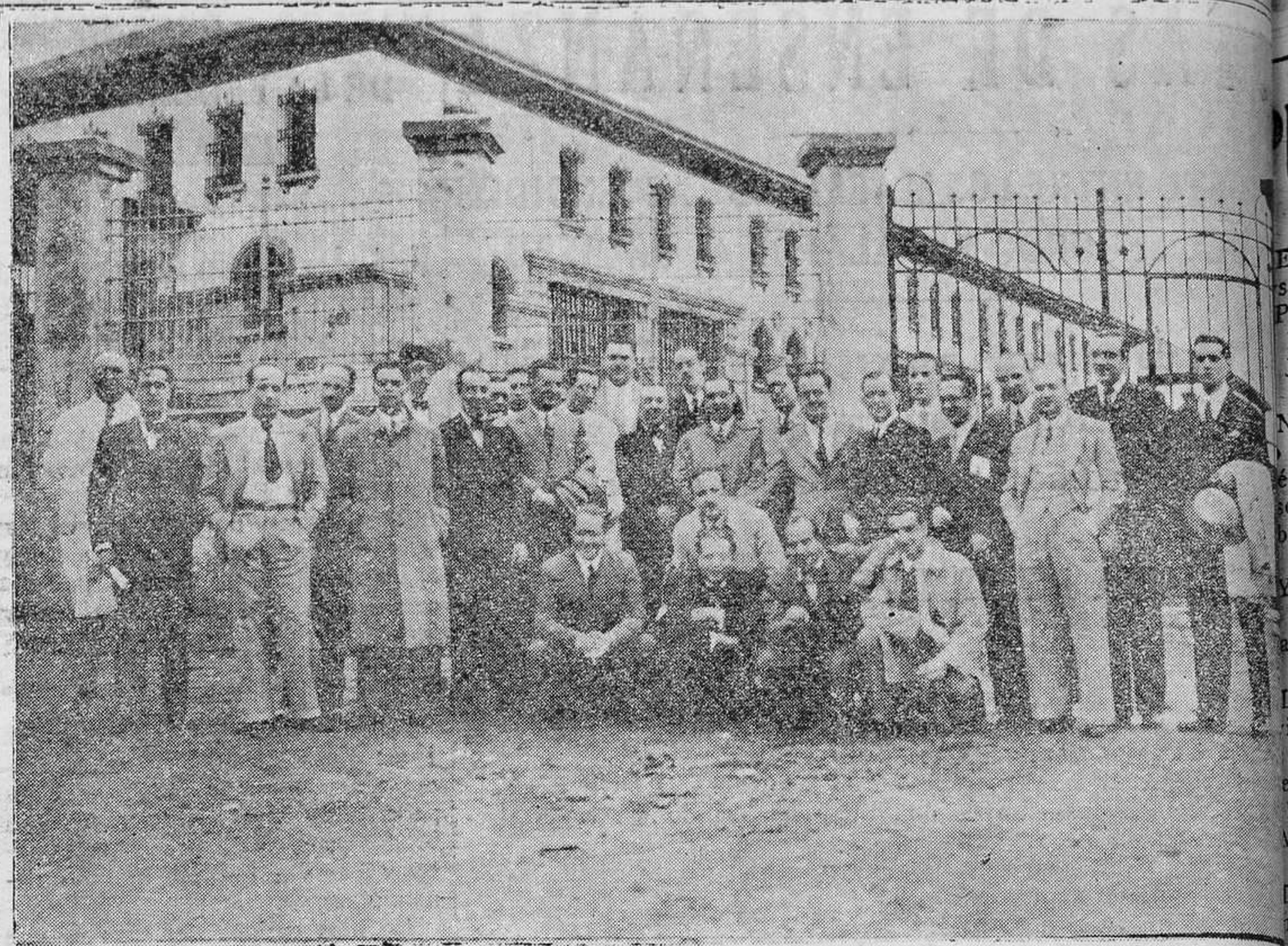
OVIEDO. Los alumnos de la Escuela sanitaria de Madrid desués de haber visitado el Manicomio de la Cadellada.

La sección rural de quintas del Ayuntamiento de esta capital, cuyas dependencias se hallan instaladas en los bajos de la casa número 18 de la calle de Campo-