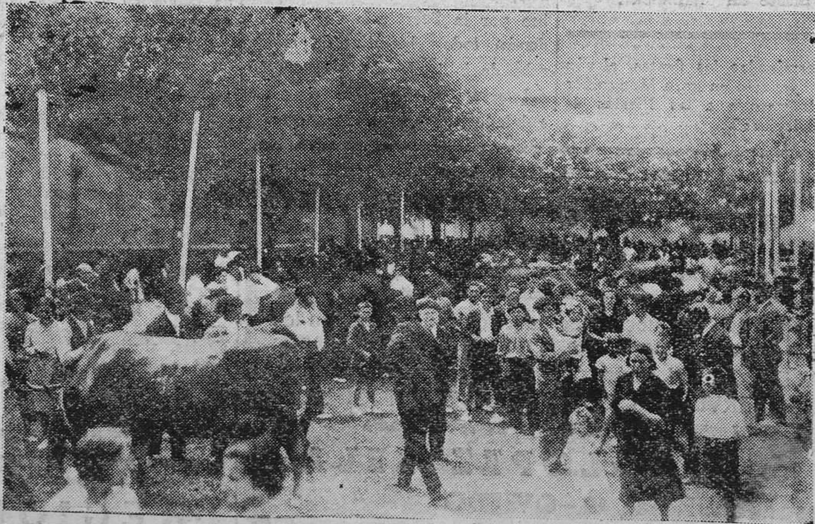
LUANCO.—Animado aspecto que ofrecía el campo en que se celebró el reciente concurso de ganado.