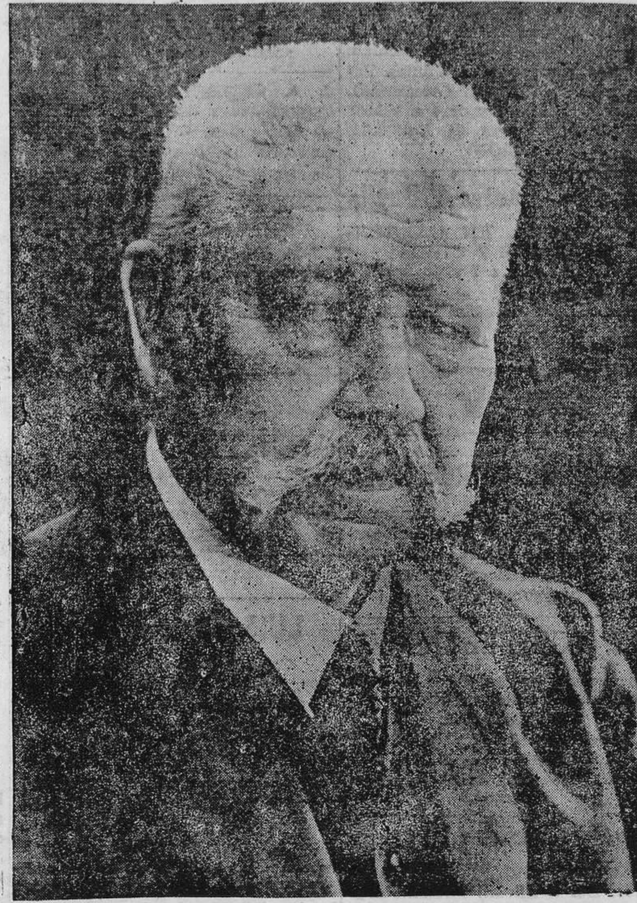
El Mariscal Hindenburg, cuyo fallecimiento, acaecido ayer, constituye el suceso más importante de la actualidad mundial.