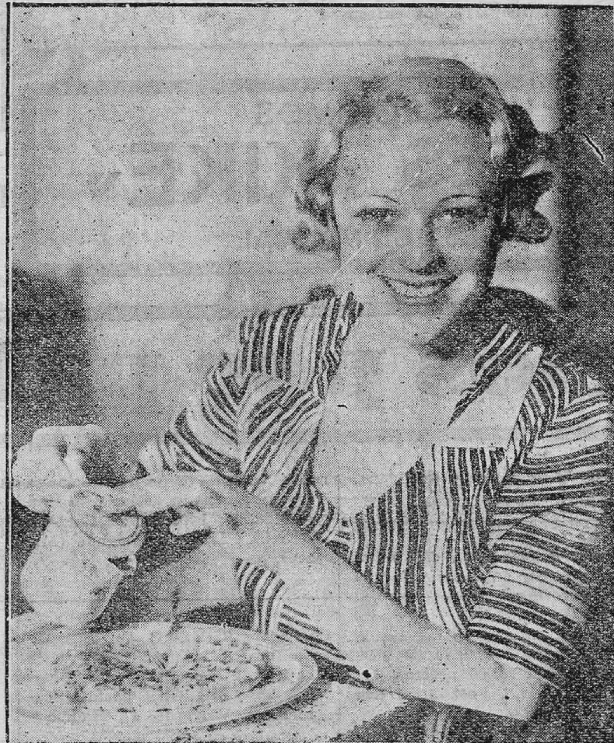
Tan bonita como hacendosa, la rubia Sally Eilers se prepara por sí misma su desayuno, muy satisfecha de ser tan excelente actriz como perfecta ama de casa.