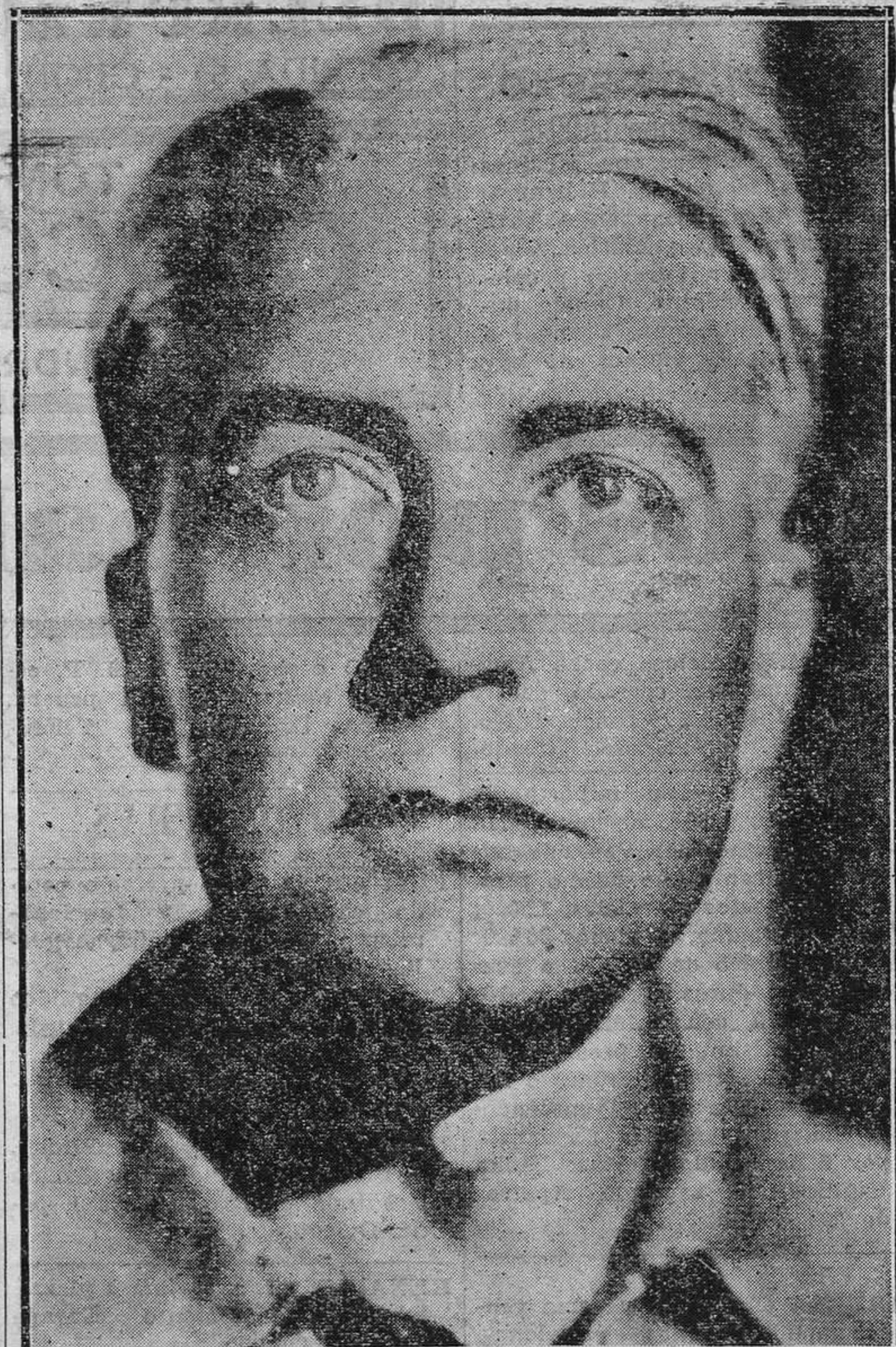
Clive Brook, el genial intérprete de "Una aventura de Sherlock Holmes".