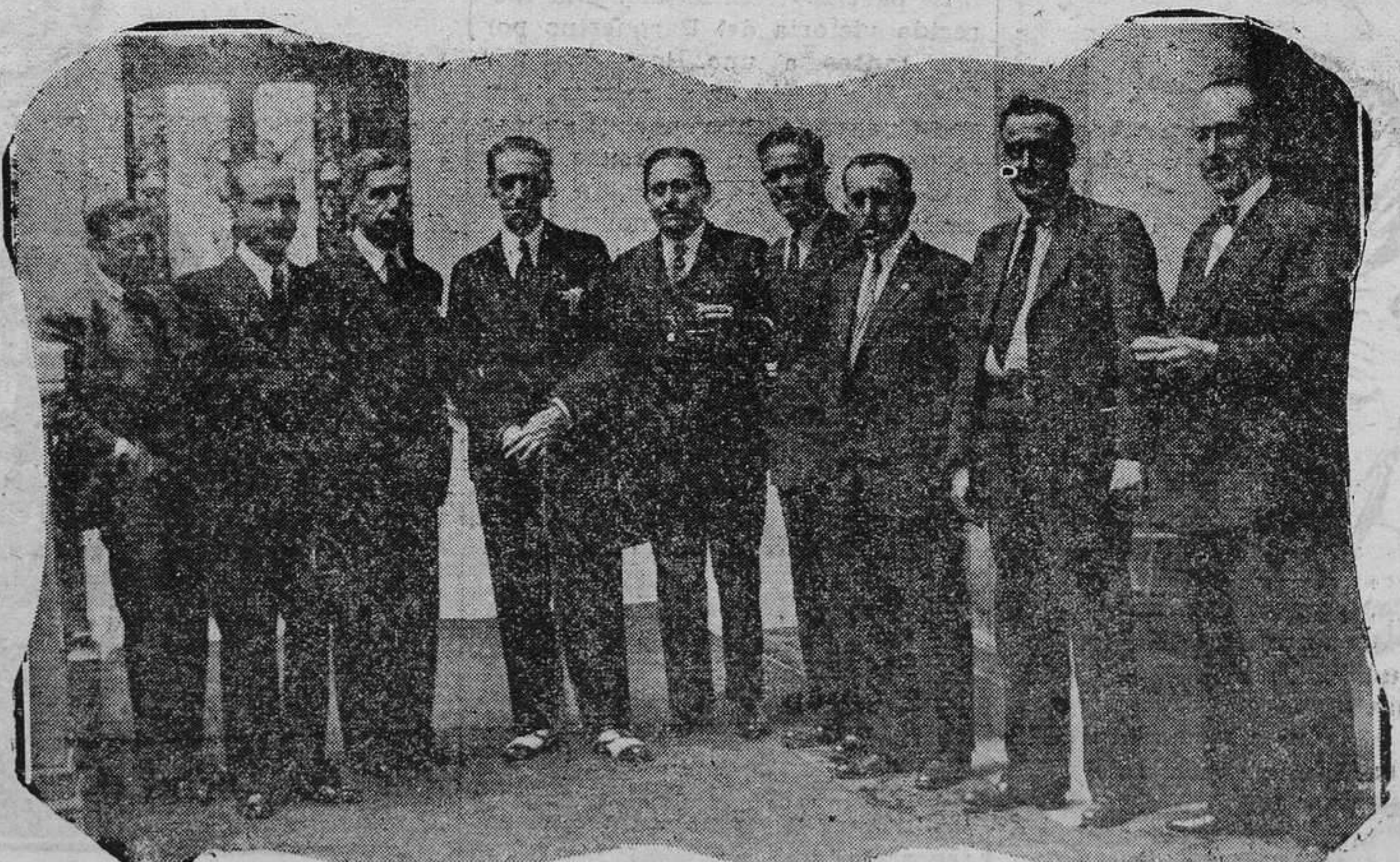
OVIEDO.— Comisión ejecutiva que se reunió ayer en la Diputación para tratar de la degradación de los vinos en Asturias

Este tren solo tendrá un minuto de parada en Noreña, Siero, Nava,