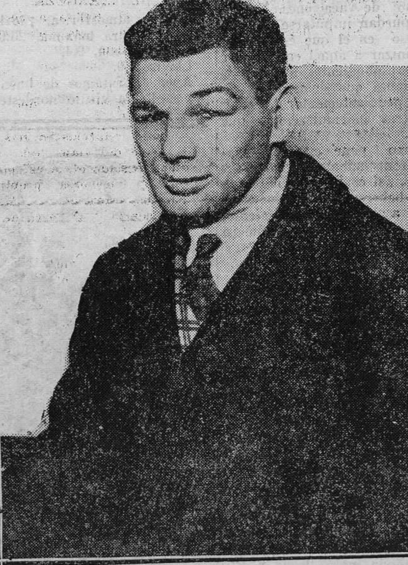
Marcel Thil, el campeón del mundo de los pesos medios, a quien le será retirada la cartilla de boxeador en vista de las graves lesiones que padece