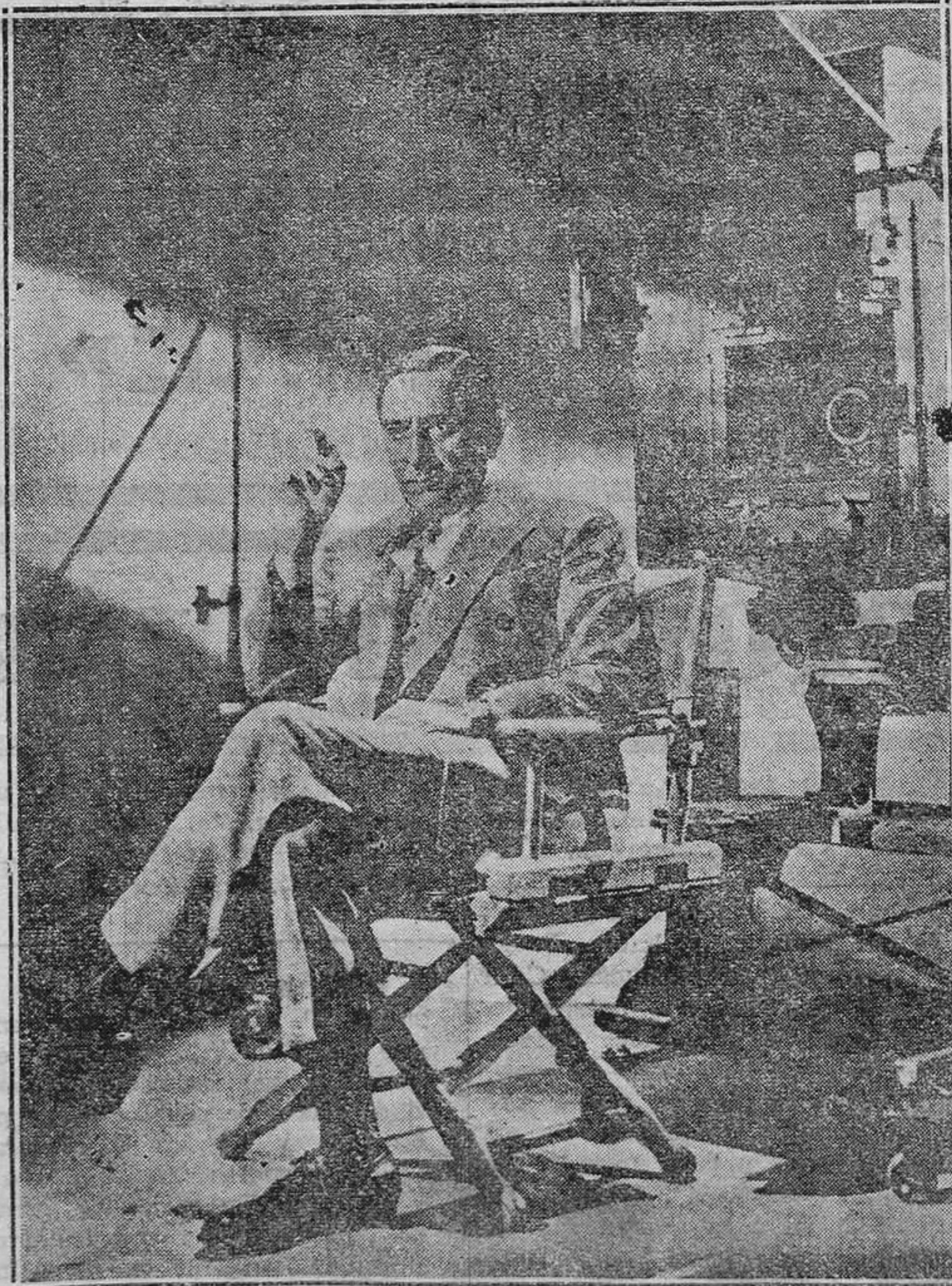
Ernest Lubisch, el genial director de "El desfile del amor", "Monte Carlo", "El teniente seductor", "Una hora contigo" y otras tantas películas inolvidables, con las que, sobre todo con "Remordimiento", se ha elevado a las mayores alturas cinematográficas y ha elevado también a artistas de la talla de Jeanette Mac Donald, Maurice Chevalier y Lionel Barrymore.