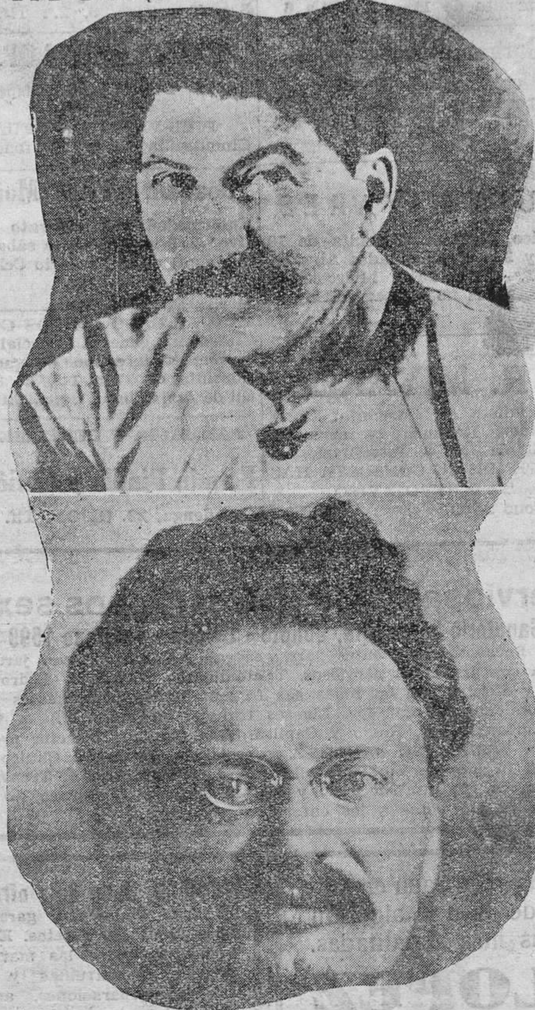
Arriba Stalin y debajo Trozky, figuras destacadas de la Rusia soviética cuyas discusiones políticas se procura actualmente vender a cuyo objeto se señala a Litvinof como intermediario.