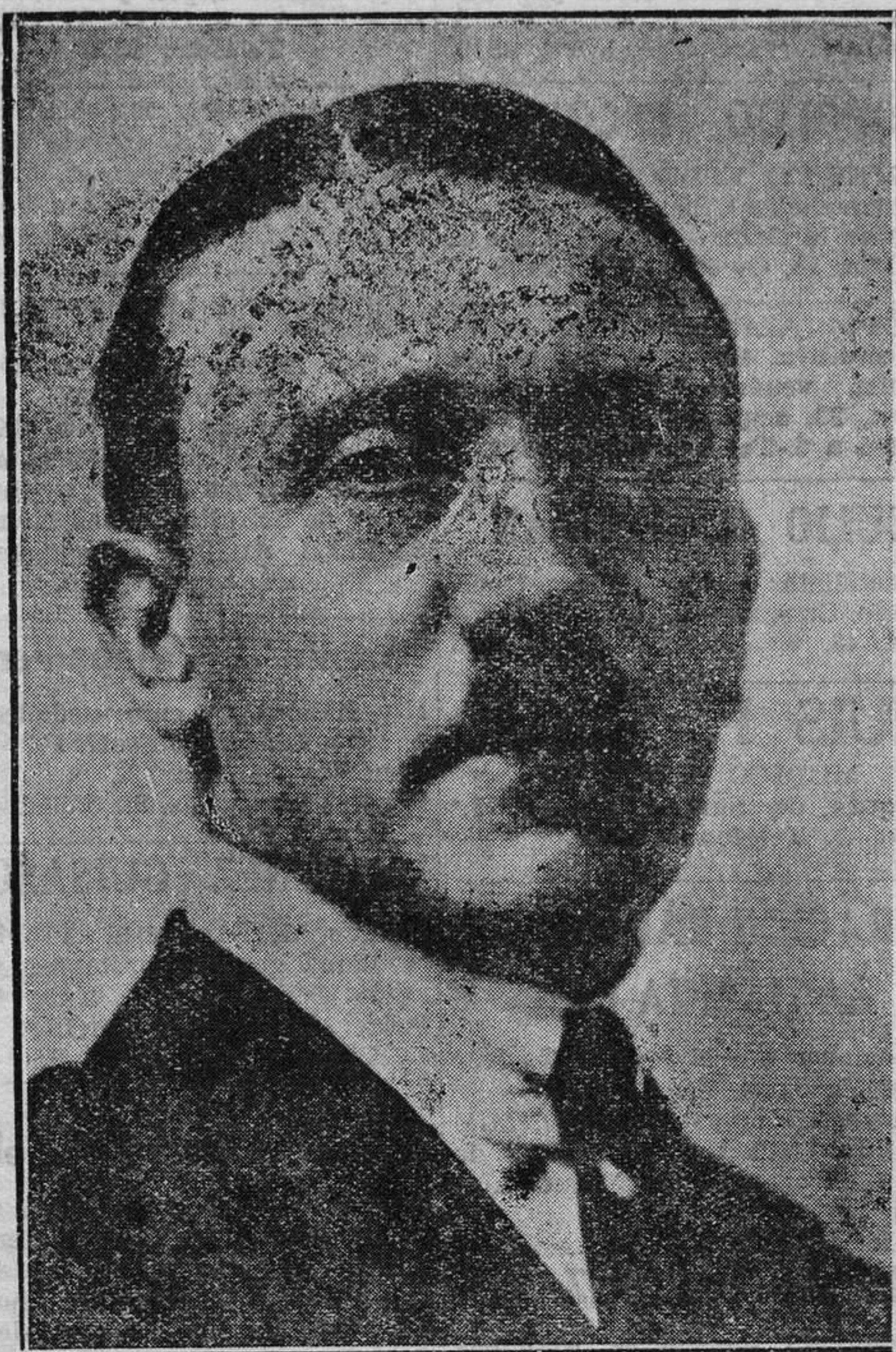
Vuelve a ser figura de actualidad el canciller alemán Hitler, de quien se dice será el sustituto de Hindenburg