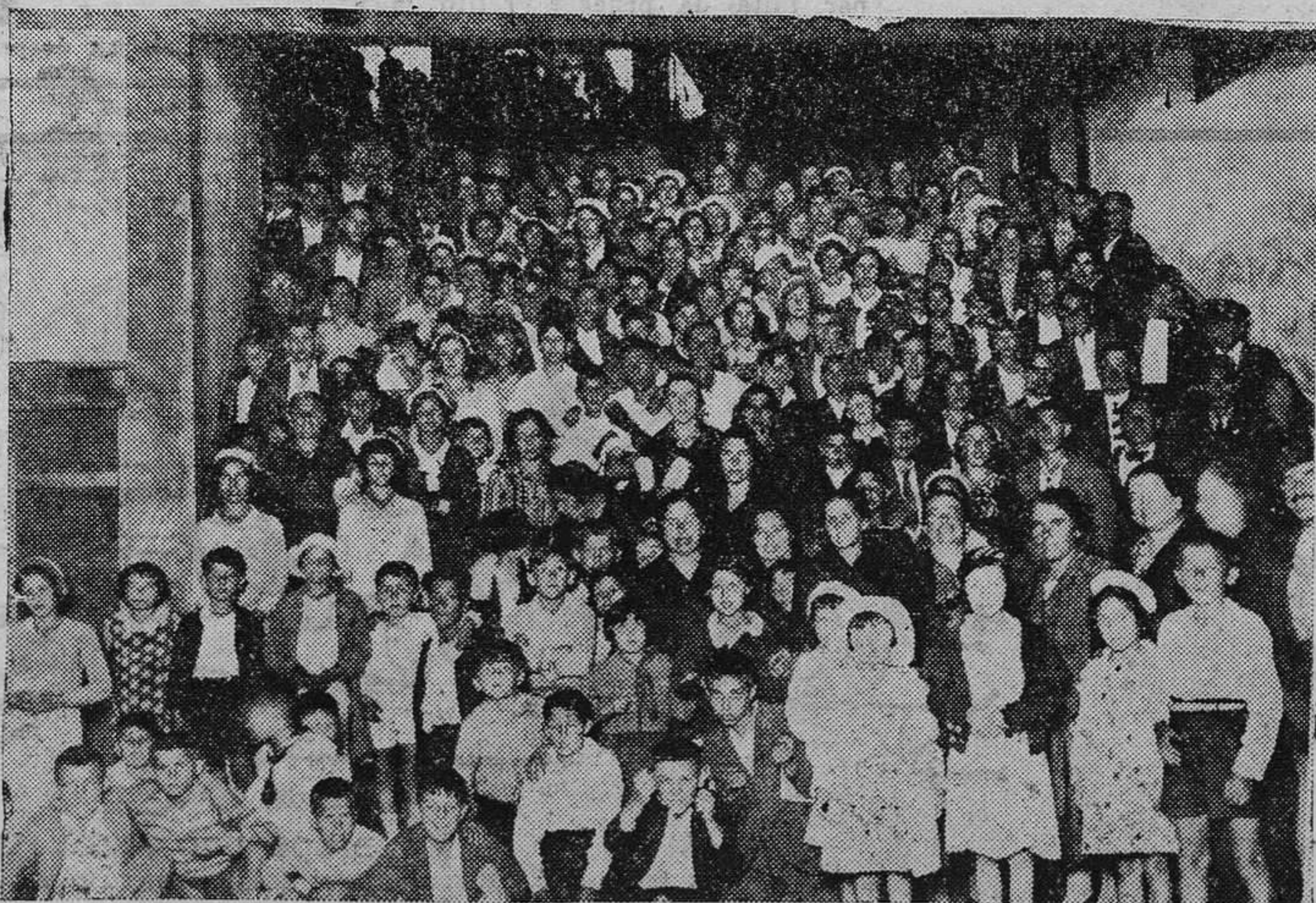
OVIEDO.—Un grupo de la gran excursión celebrada ayer a la cumbre del Naranco, organizada por la Catequesis de Pravia

Las demás condiciones se ajustarán a lo que preceptúa el Reglamento de 2 de Julio de 1926 y el expediente se halla de manifiesto en la Sección de Fomento a disposición de los que deseen examinarlo.