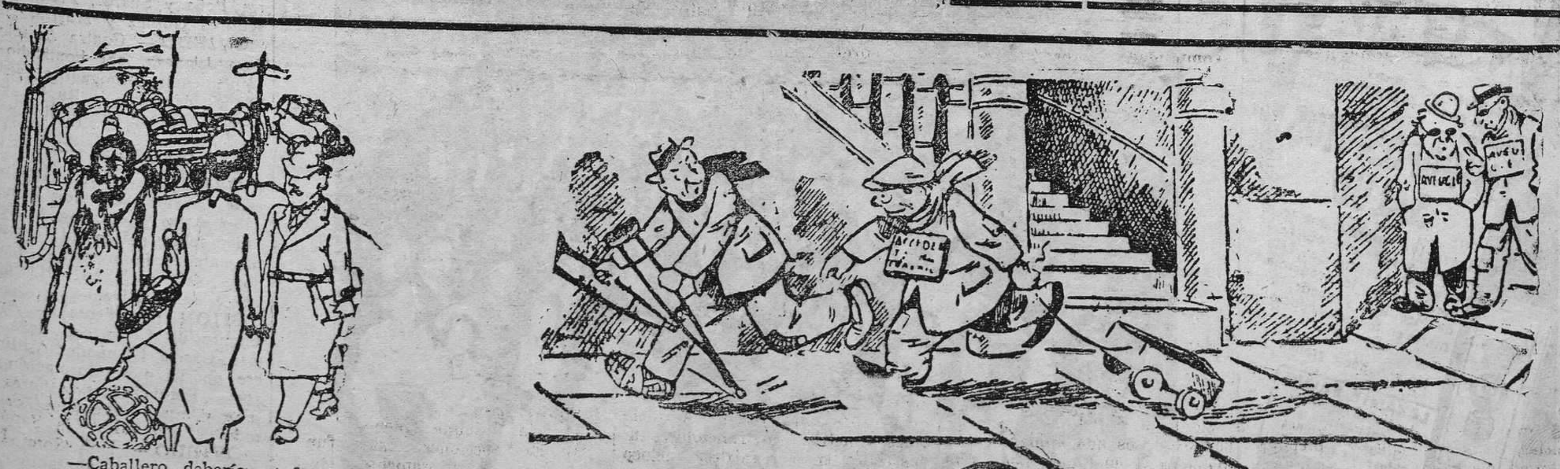
—Caballero, debería usted saber que no se aborda a una señora en la calle... —Le pido mil perdones —...sin descubrirse.

ha trasladado su despacho a la calle Noval n.º 5, 1.º derecha