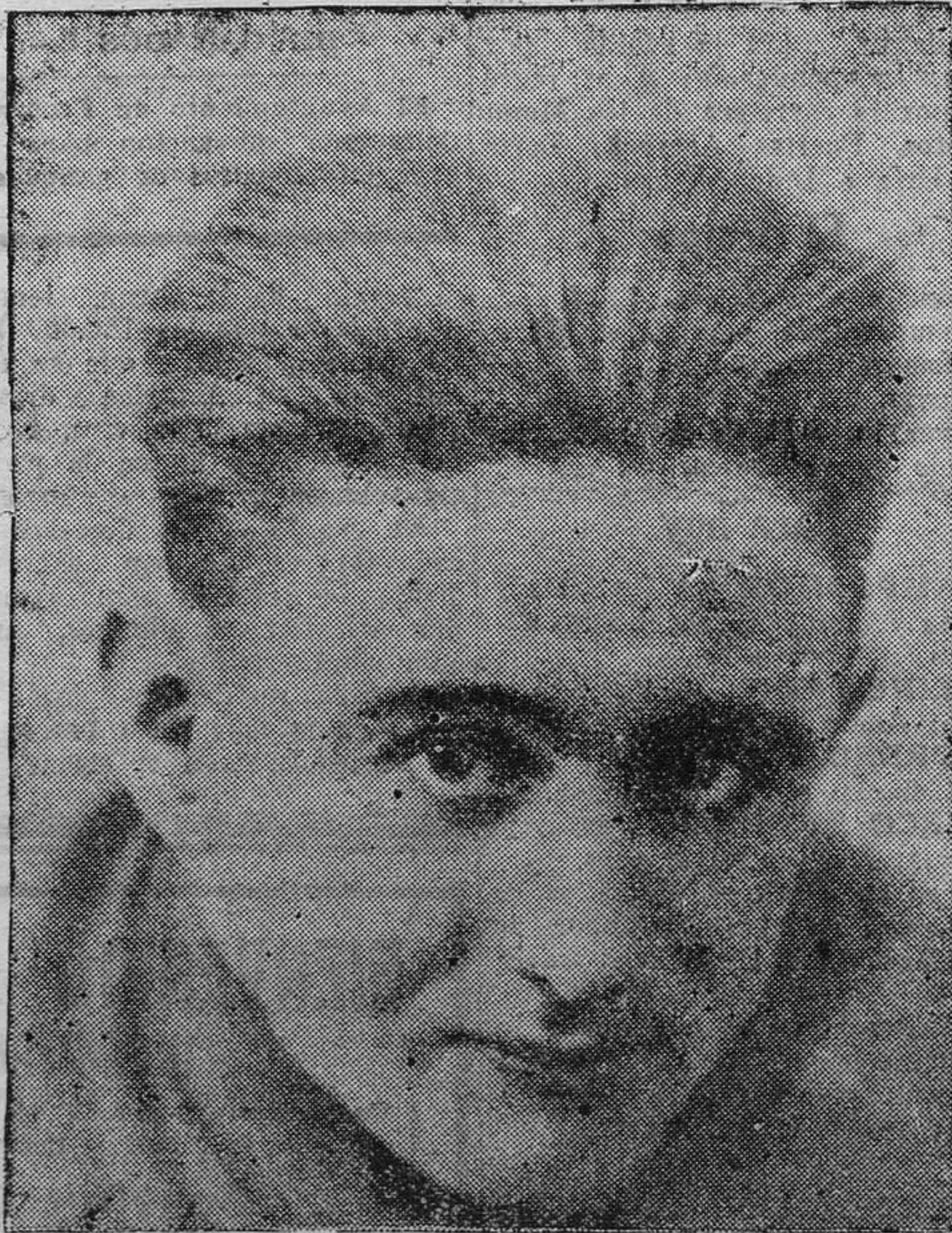
Vicente Trueba, el gran corredor santanderino clasificado en la Vuelta a Francia como el mejor escalador de la Montaña. La "pulga" de Torrelavega ocupa un lugar envidiable en la clasificación general de la agotadora prueba.