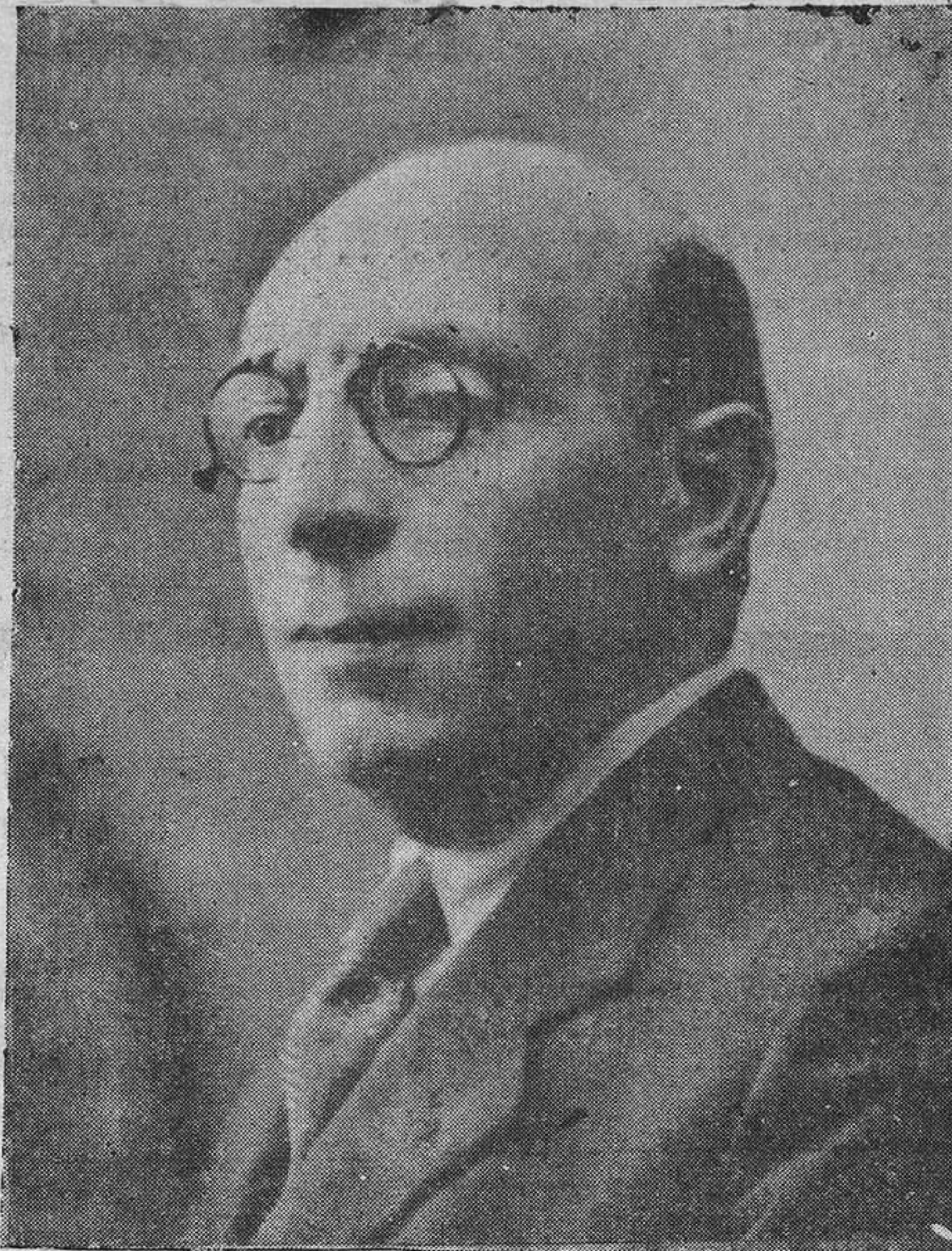
El ministro dimisionario de Industria y Comercio, don Ricardo Samper (radical), a quien el Jefe del Estado encomendó la formación de un nuevo Gobierno.

en lo fundamental de la que les dije a ustedes.