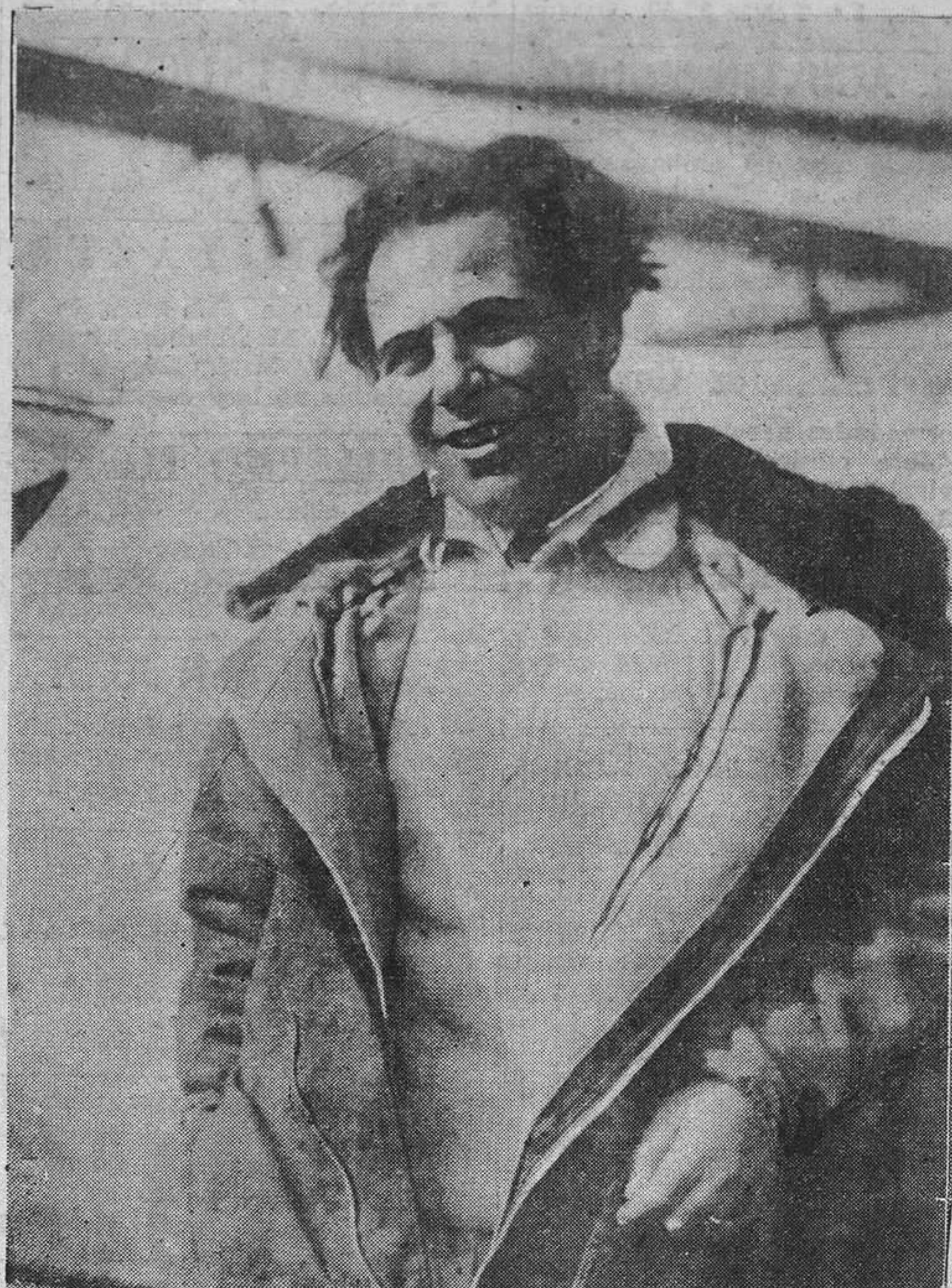
El aviador italiano Donati, que ha batido el "record" mundial de altura, consiguiendo elevarse a 14.435 metros.