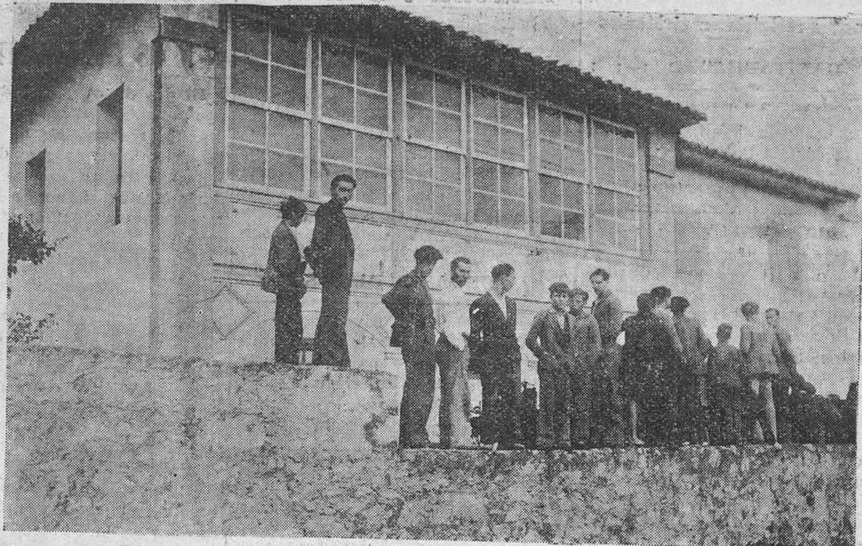
La casa rectoral en el interior de la cual fué asesinada el ama de llaves del párroco.

La acción de la autoridad no hace falta encarecerla. Sabemos que encomendada a la Beneficencia el descubrimiento de los autores, éstos no han de tardar en caer en manos de la Justicia. Y la Justicia en todo caso debe con serenidad imponer una sanción ejemplar a los autores de tan miserable crimen que ha producido en los nobles sentimientos de todos los asturianos, una vibrante protesta de execración.