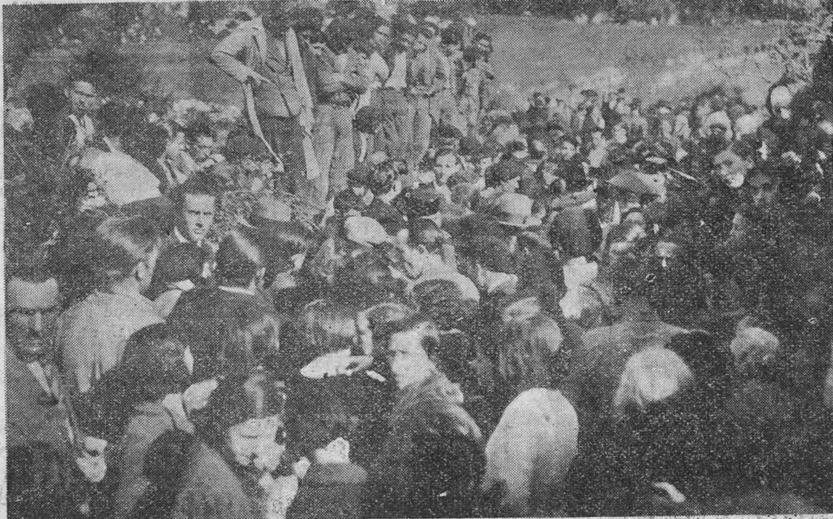
El vecindario de Posada rodeando a las autoridades que practican las primeras diligencias junto al cadáver del infortunado párroco, una hora después de haber sido encontrado éste.