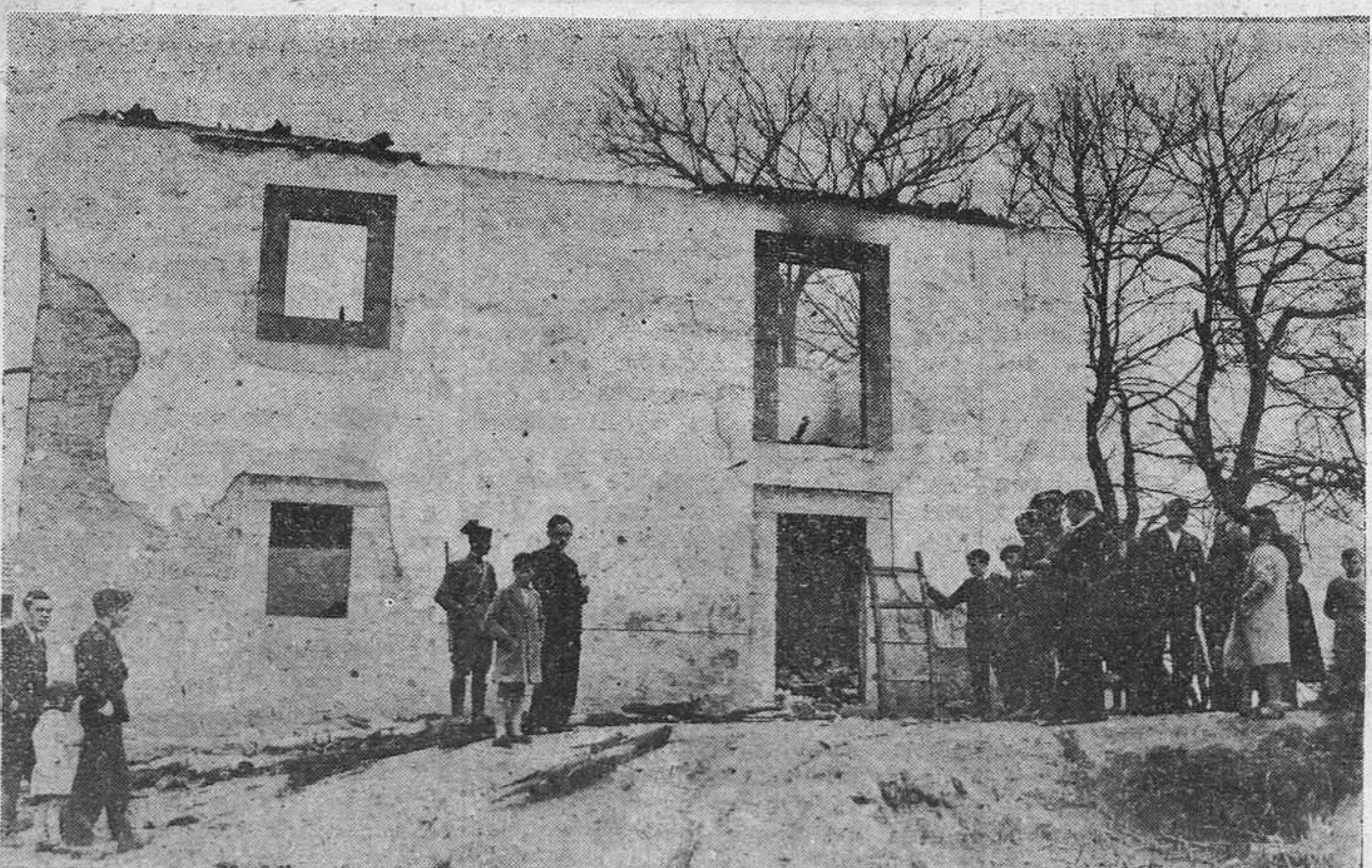
Ventana que da al despacho que guardaba el archivo del Ayuntamiento, donde se inició el fuego. Por esa ventana se supone penetraron los incendiarios, valiéndose de la escalera de mano que aparece en el grabado.

Entonces los concejales se reunieron en sesión extraordinaria