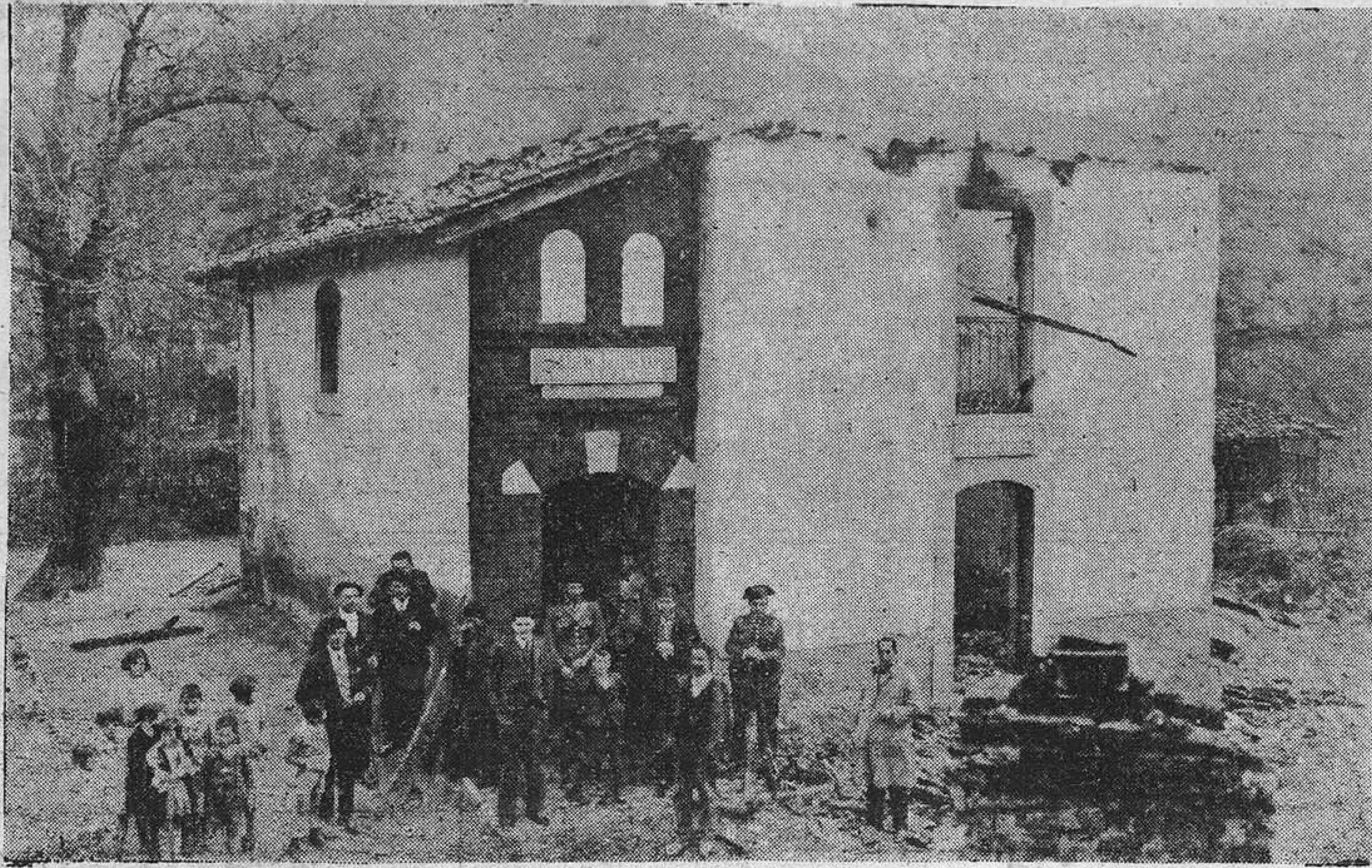
Estado en que quedó el edificio del Ayuntamiento de Ribera de Arriba, después del incendio. La Guardia civil lo custodia.

galmente, ya que no se ha instruído expediente, y contra el señor Ulloa no ha aparecido cargo alguno. Por lo tanto debía volver a ocupar su antiguo puesto.