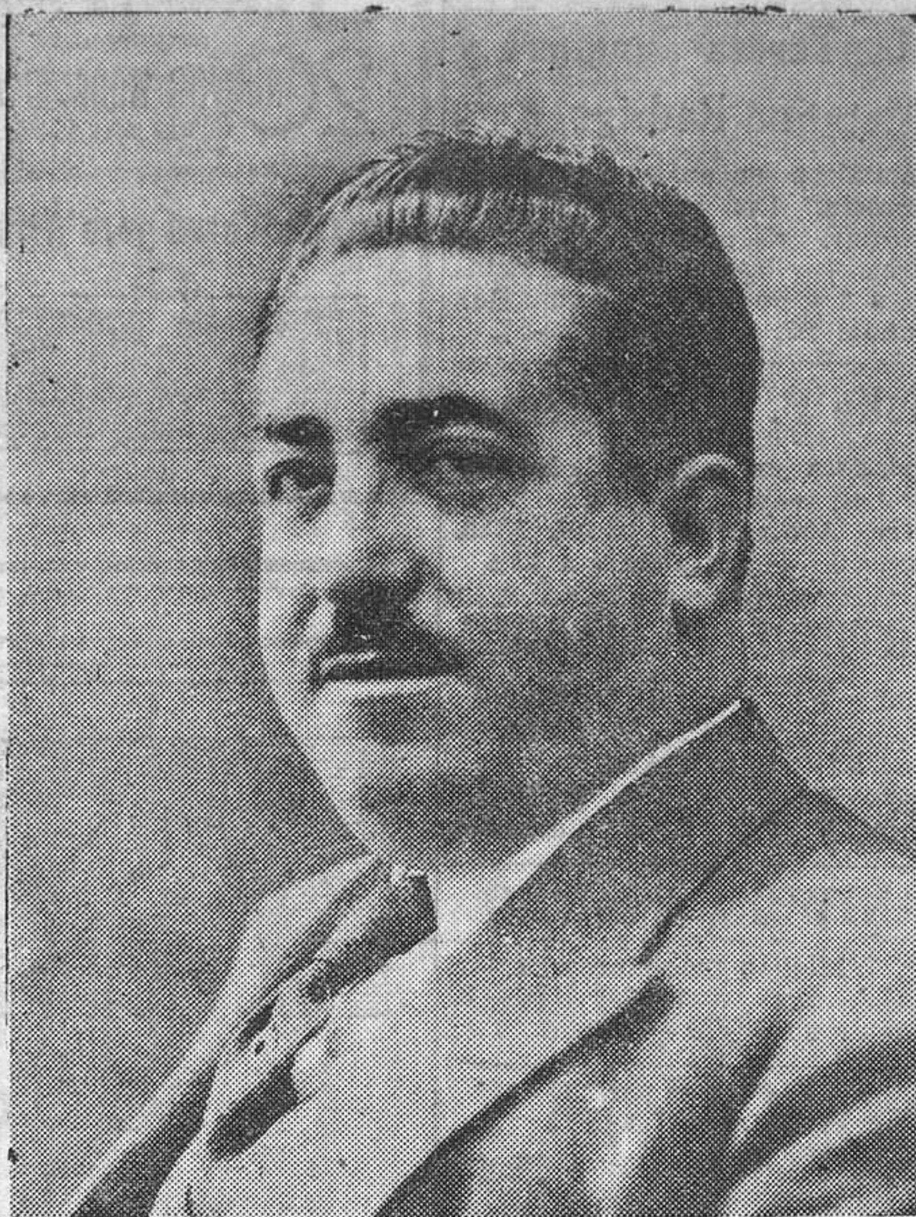
D. Rafael Salazar Alonso, otro de los tres nuevos ministros que entraron en el nuevo gobierno. Es radical y pasa a desempeñar la cartera de Gobernación.

LAVAD CON JABON "VETUSTA", QUE ES EL MAS FINO Y EL DE MAYOR RENDIMIENTO