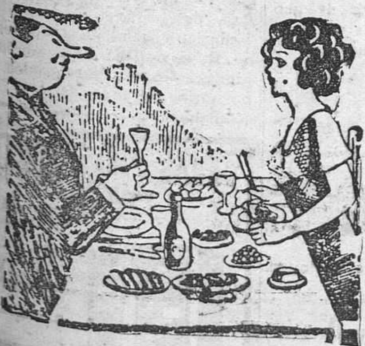
—Te he dicho, María, que no me gustan las criadas rubias. Quiero que se vean los pelos en la sopa.