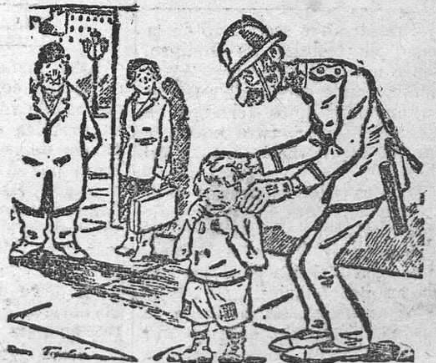
—¿Me hace el favor, guardia? Se me ha escapado mi globo. ¿Dónde está la oficina de objetos perdidos?