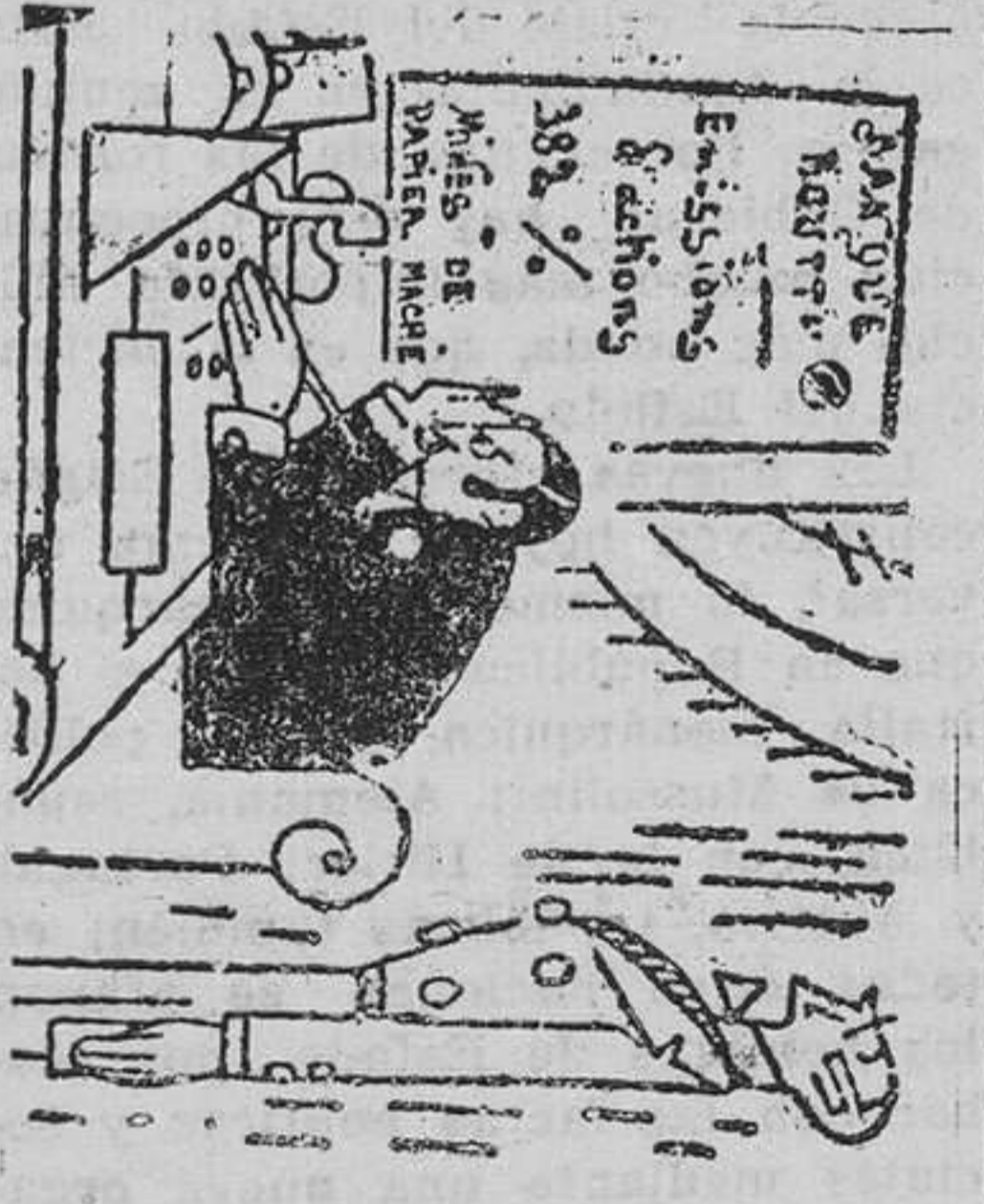
Las pérdidas cuantiosas