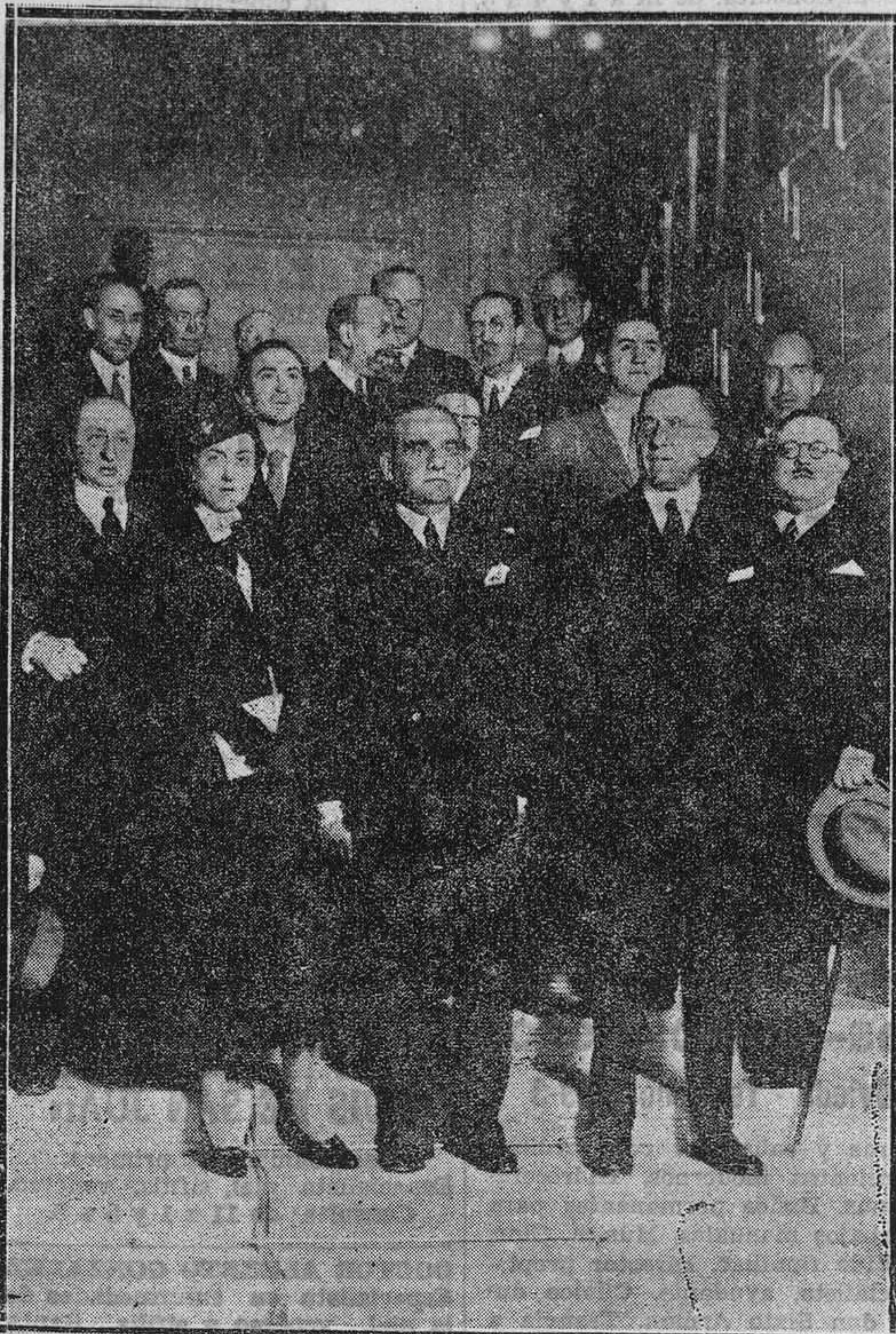
El presidente de la Academia Nacional de Jurisprudencia, con los oradores que han tomado parte en la solemne velada necrológica en conmemoración del XXI aniversario de la muerte de Menéndez y Pelayo.