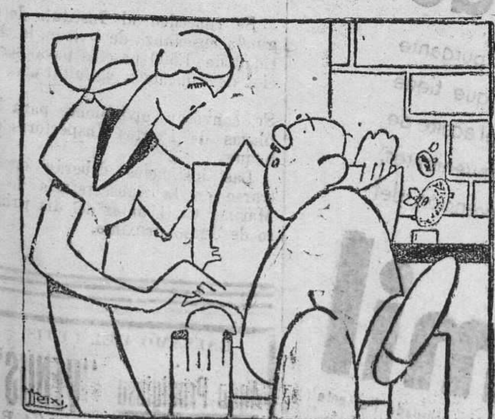
—No se enfades, maridito mío, pero tendrás que darme quinientas pesetas para la modista. —No me sorprenda. ¡Está tan de moda eso de los atracos...!