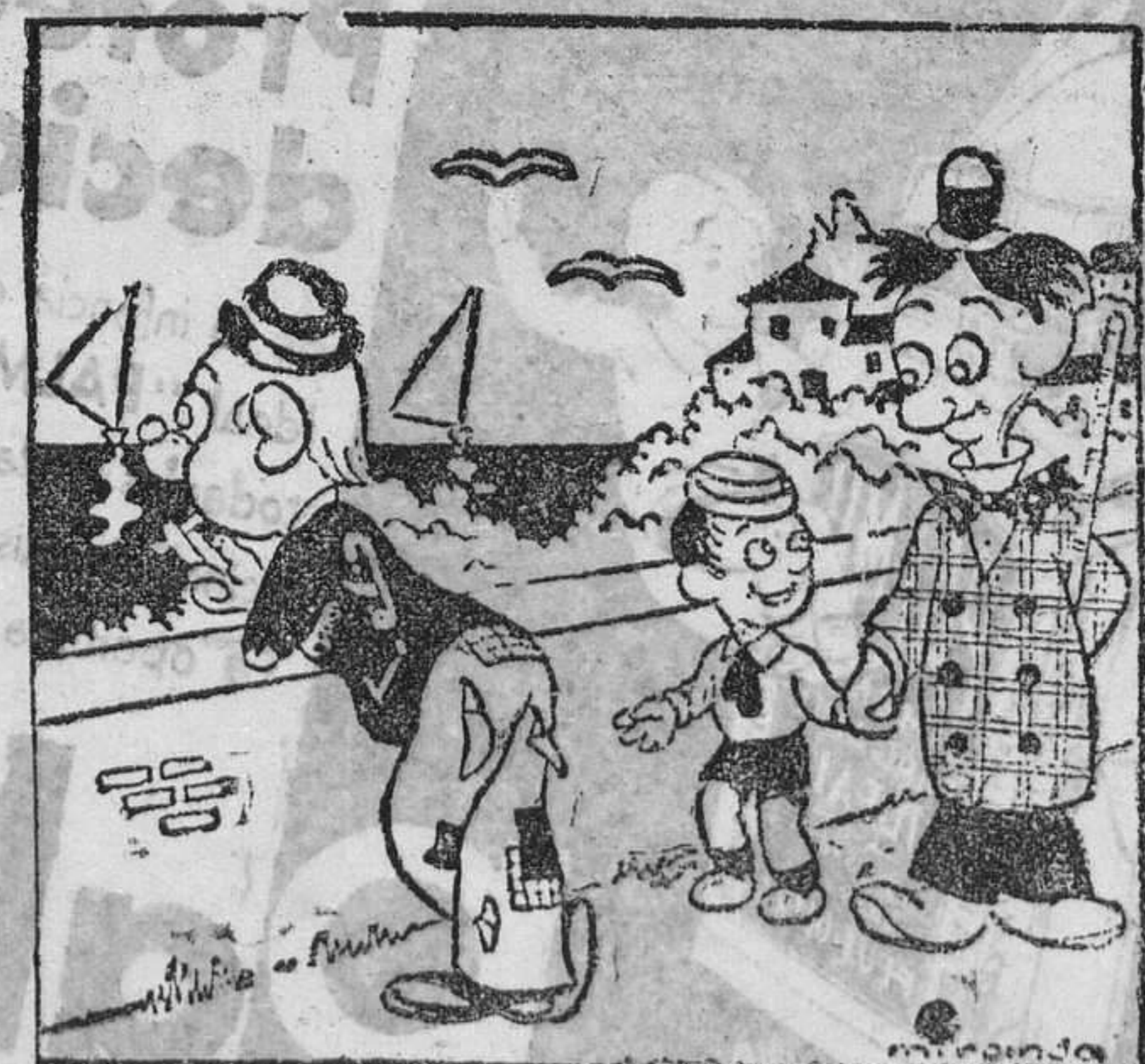
—Dime, papá, a ese señor pudieron denunciarlo, ¿verdad? —No sé, hijo mío; ¿por qué? —¡Por su traje de vanguardia!