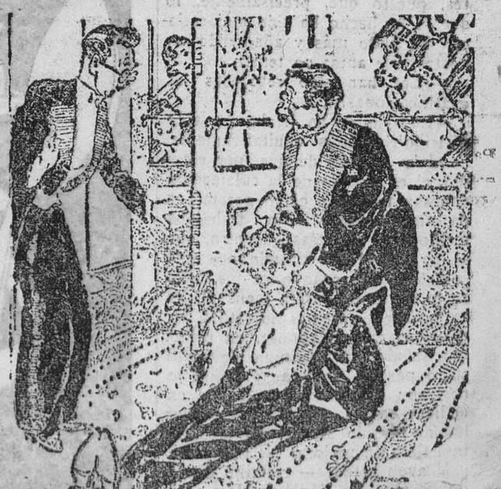
—¿Qué le ha ocurrido? Nada, que quiso cerrar tras de sí la puerta, dando un portazo.