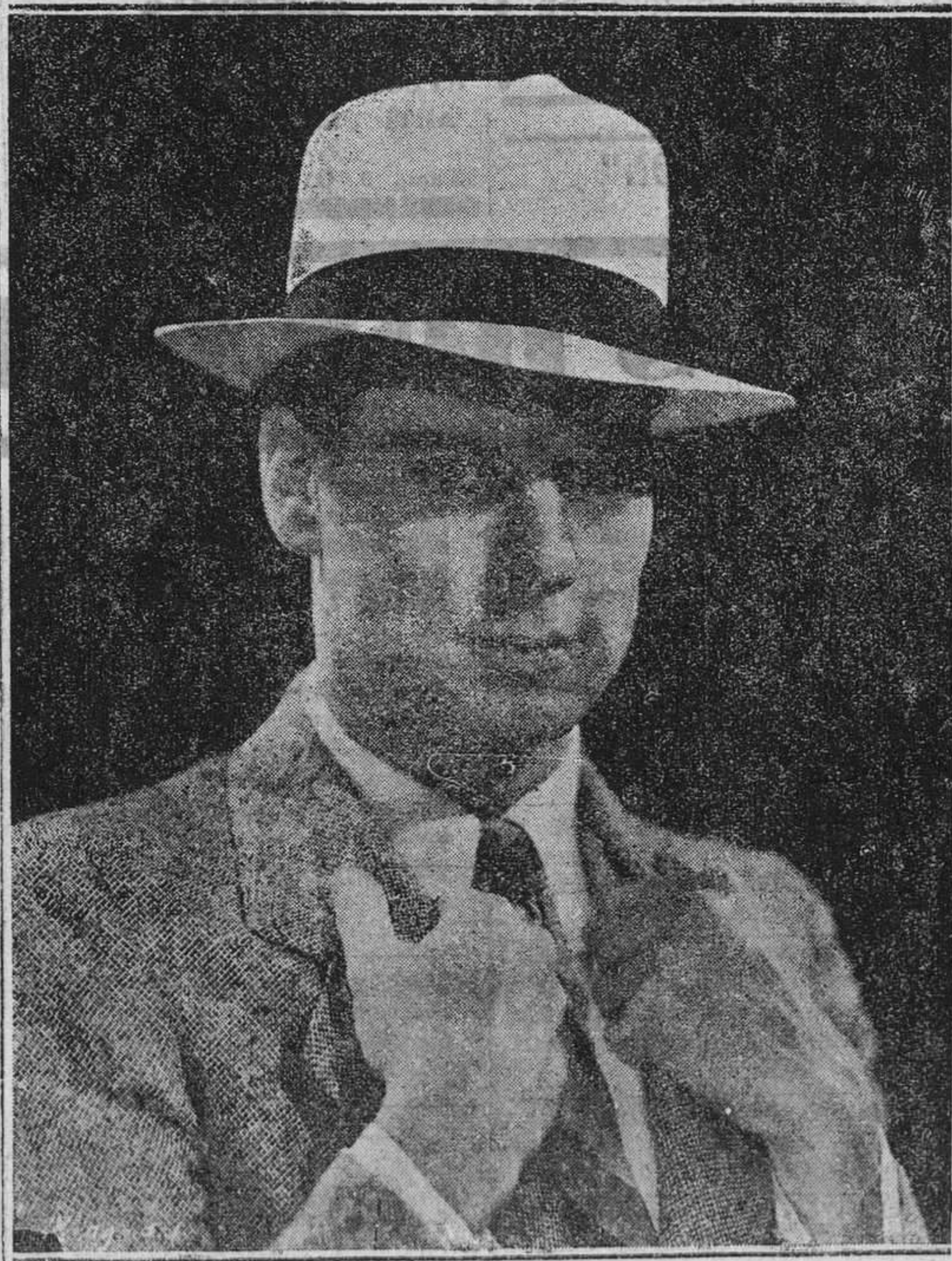
Norman Foster, galán joven de la Fox, que se revela en la superproducción de esta marca titulada "La Perla de la Vida" (State Fair), basada en la célebre novela premiada de Phil Stong. En dicha producción toman parte seis estrellas: Norman Foster, Janet Gaynor, Sally Eilers, Will Rogers, Louis Dresser y Lew Ayres.