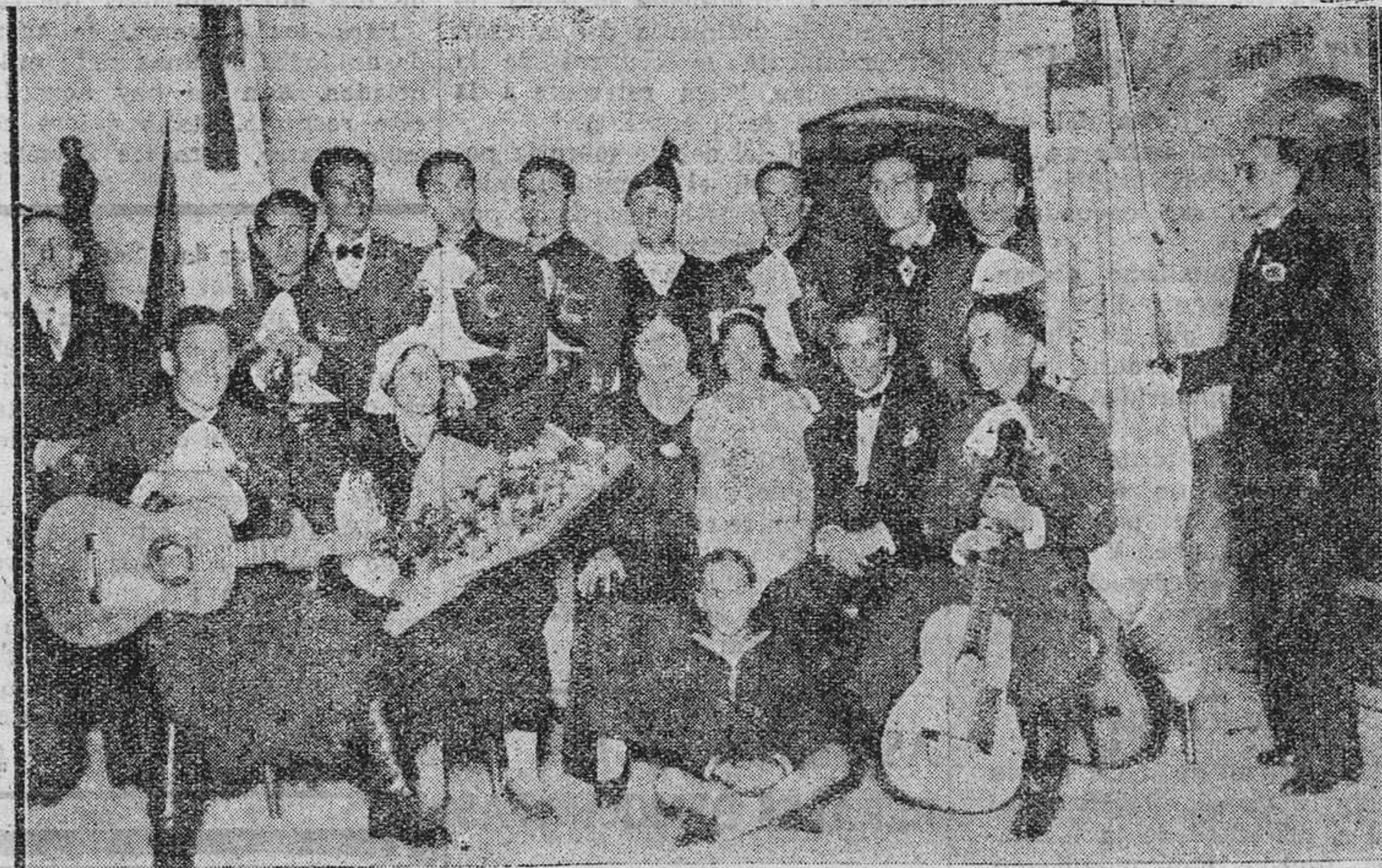
OVIEDO.— Representaciones de las distintas agrupaciones artísticas que tomaron parte en el beneficio celebrado el martes en el Campoamor.