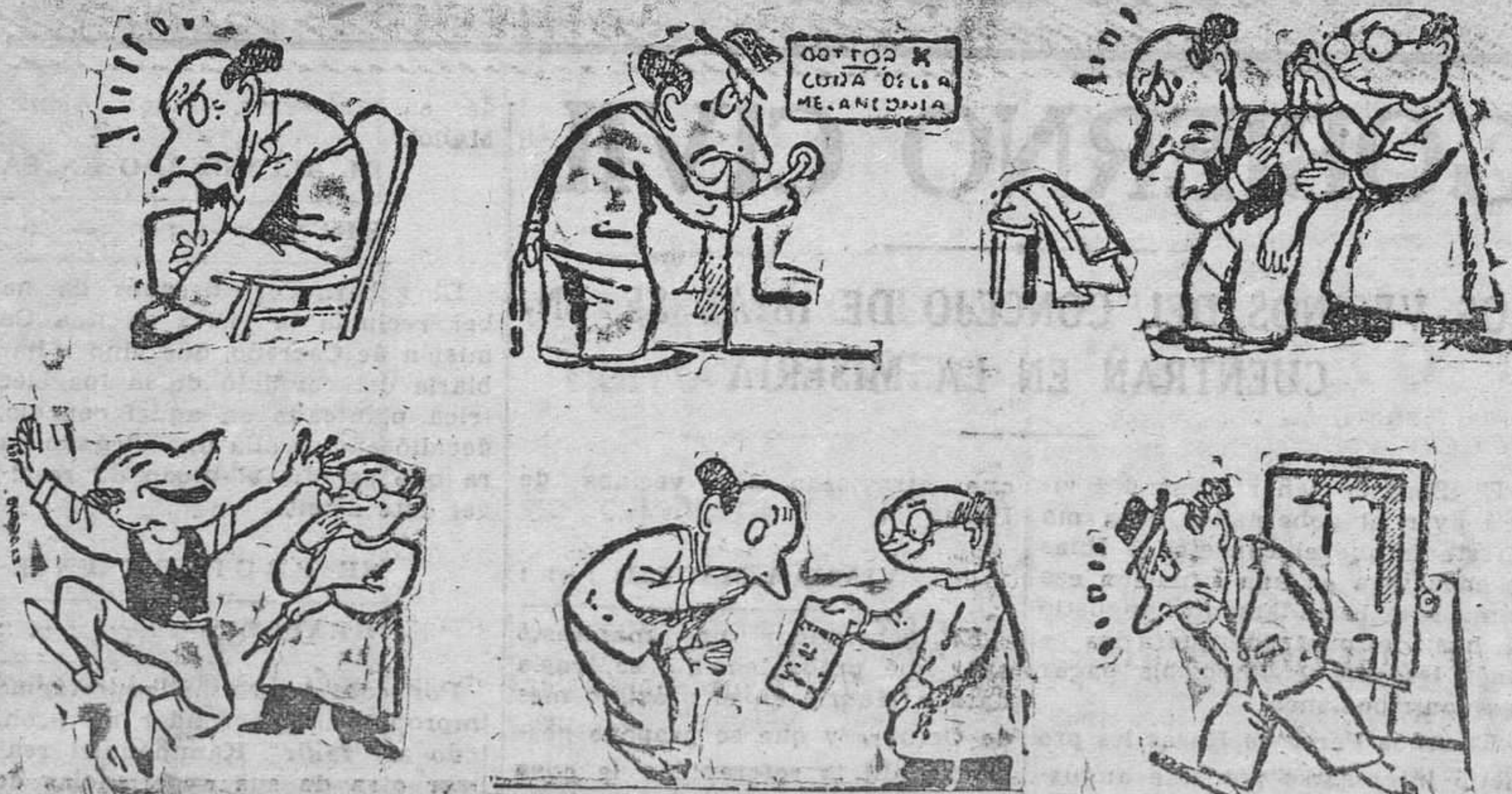
Historia del hombre avaro y melancólico que logró curarse hasta que lo presentaron la cuenta.