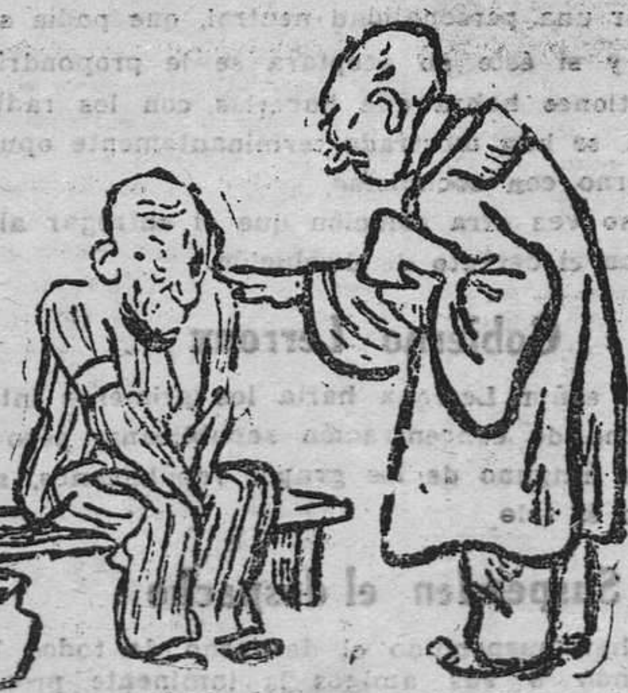
(En Praga ha sido condenado a treinta años de prisión un hombre de noventa y cuatro años. EL ABOGADO. —Demonio! Me hubiera gustado conseguir algunos años menos de sentencia. (De "Meschino", Milán.)

OCULISTA. HA REANUDADO SU CONSULTA DIARIA. Avenida Primero de Mayo, 27 SAMA DE LANGREO Teléfono 111