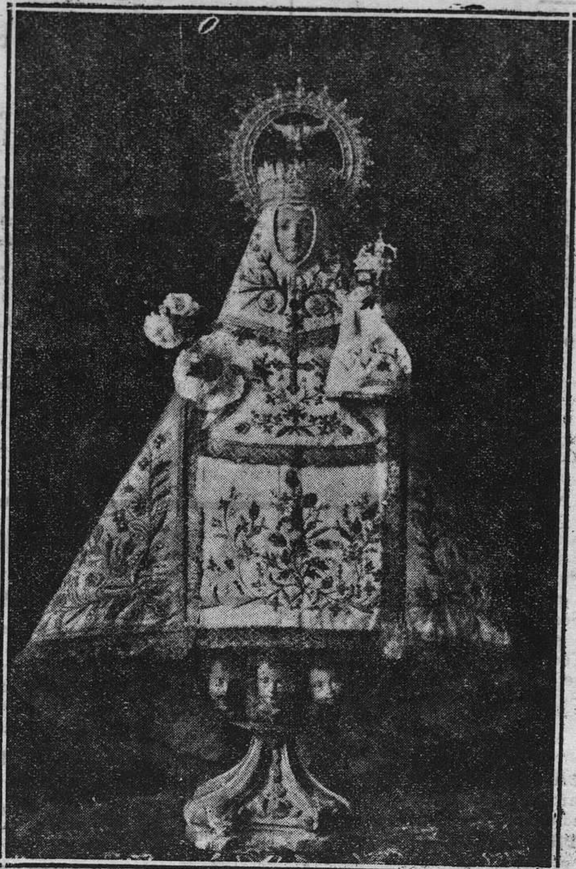
Es el día de traer a estas comarcas la imagen venerada de la Santina, de la Virgen de Covadonga, a cuyos pies rendirá Asturias un nuevo tributo de fe y de piedad. Y aquí está, luciendo las coronas que, en fecha solemne le fueron regaladas por el pueblo asturiano.