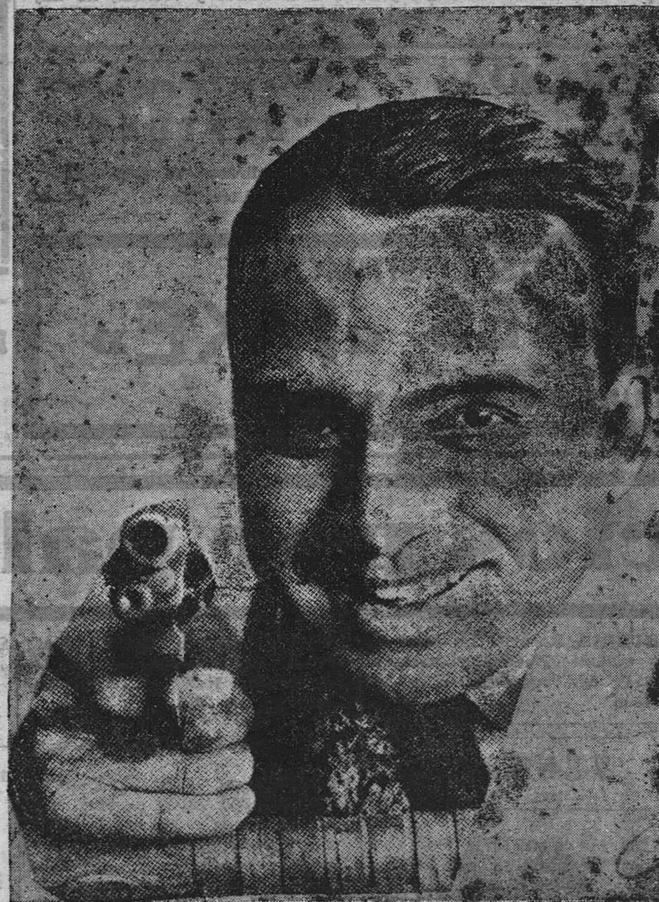
Douglas Fairbanks que, según parece, abandonará definitivamente el cinema.