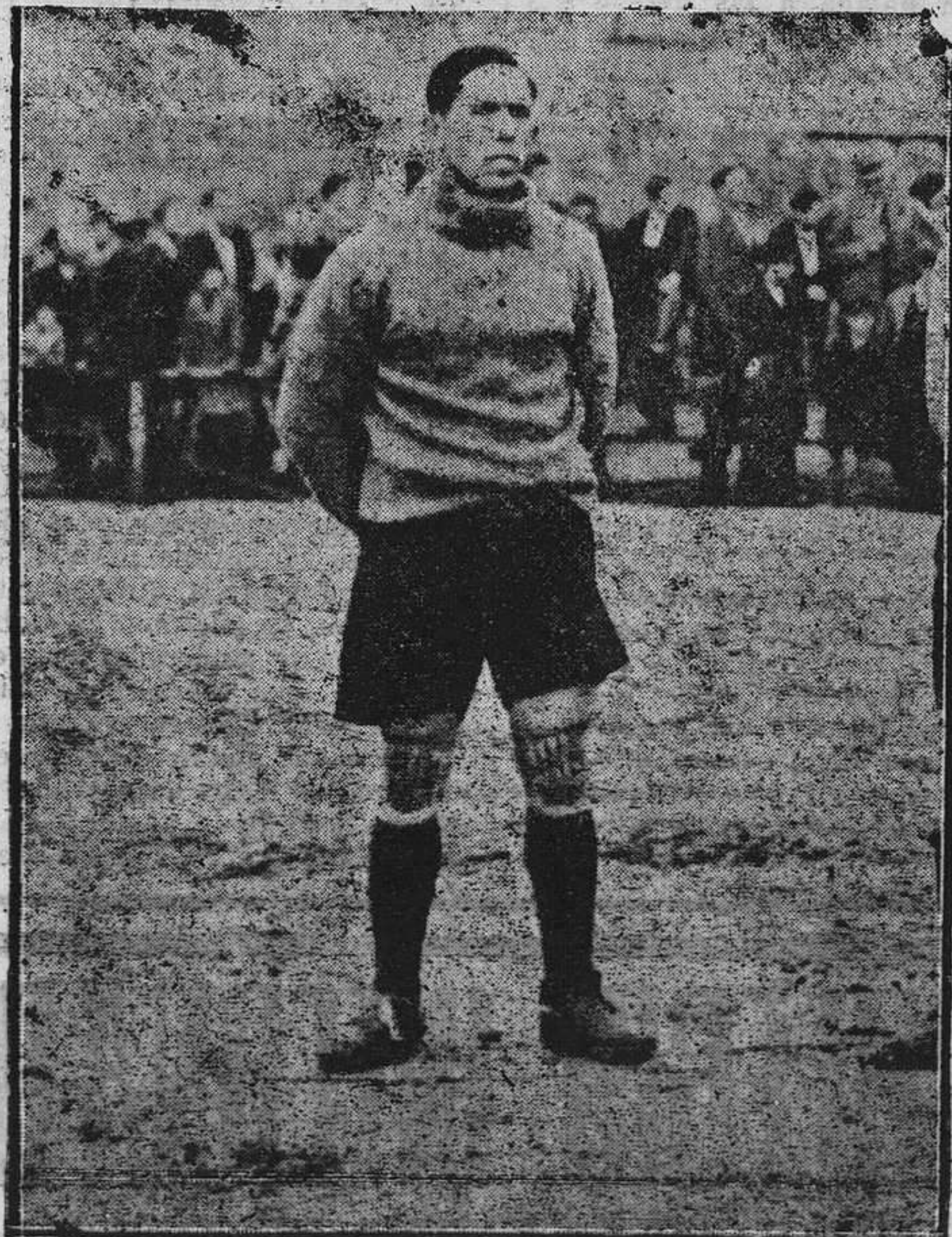
La Sportiva tendrá el domingo un enemigo peligroso en el Sporting de Gijón, pero este equipo habrá de luchar con alma si quiere forzar la puerta que bajo la custodia del Gordo, estará tenazmente defendida.