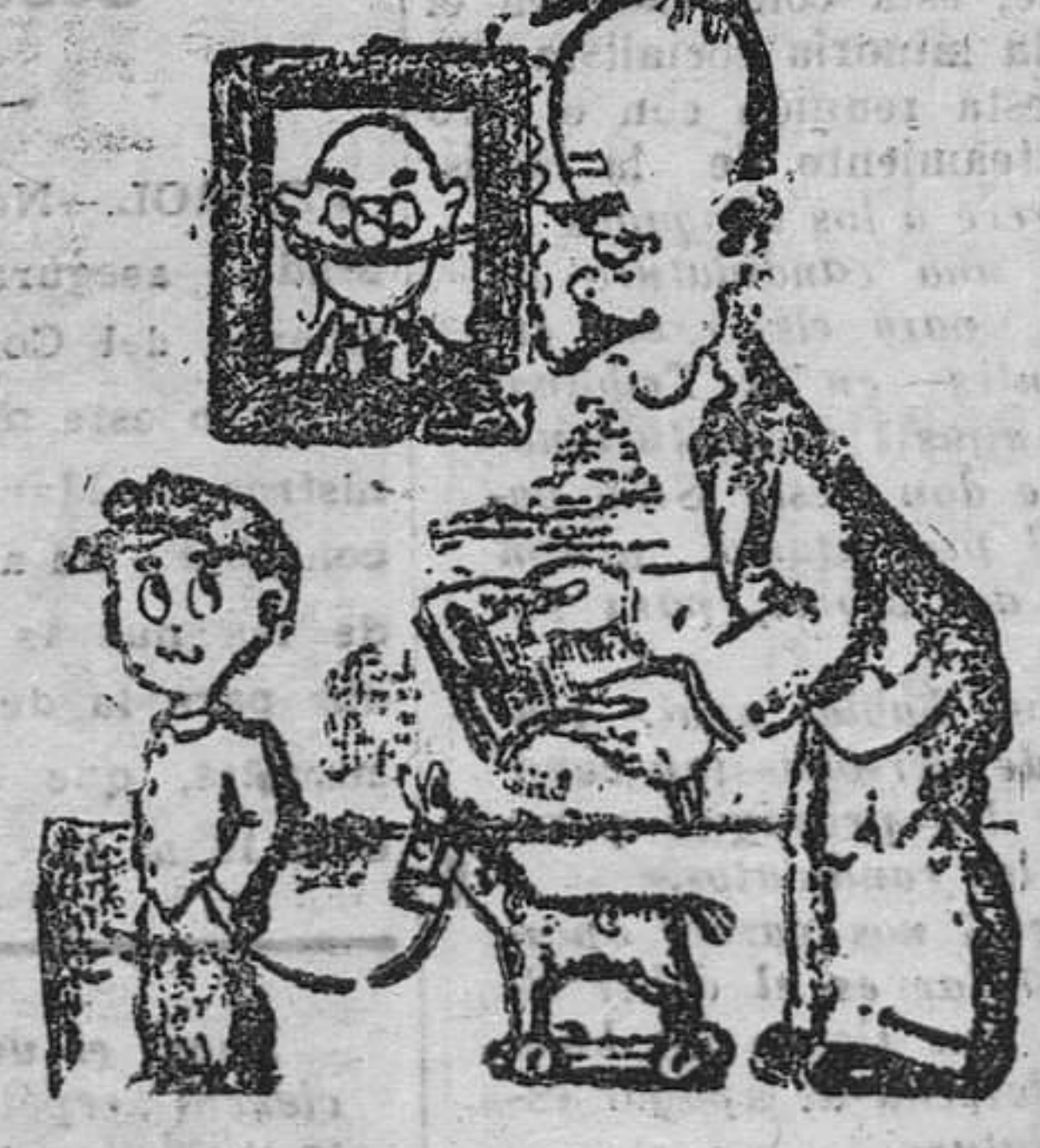
—Fritz, conformes crees te pareces más a tu padre. Va a ser lo mismo que él. —Eso es lo que teme mi madre (De "Kolner", Colonia.)