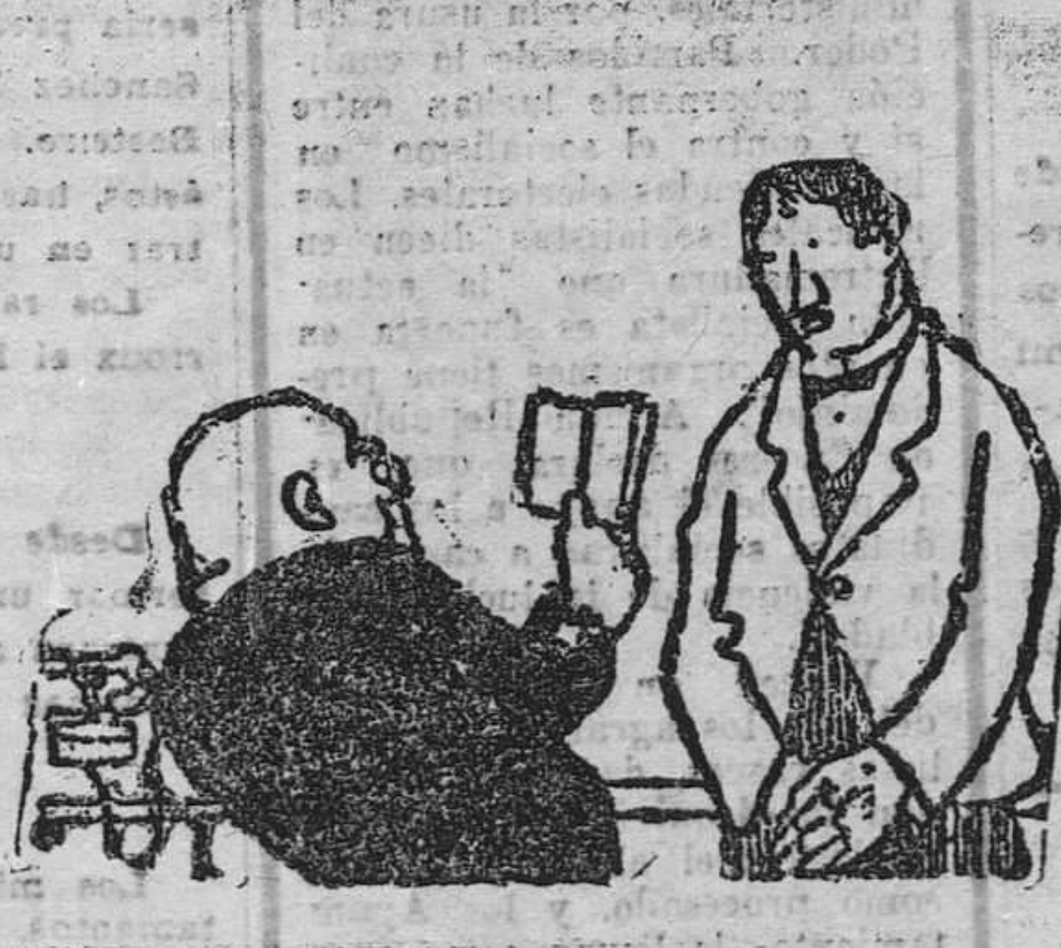
—Cambia usted de empleo como yo cambio de camisa. —Pues lo más que he estado en un mismo empleo han sido ocho meses. (De "Hummel", Hamburgo.)