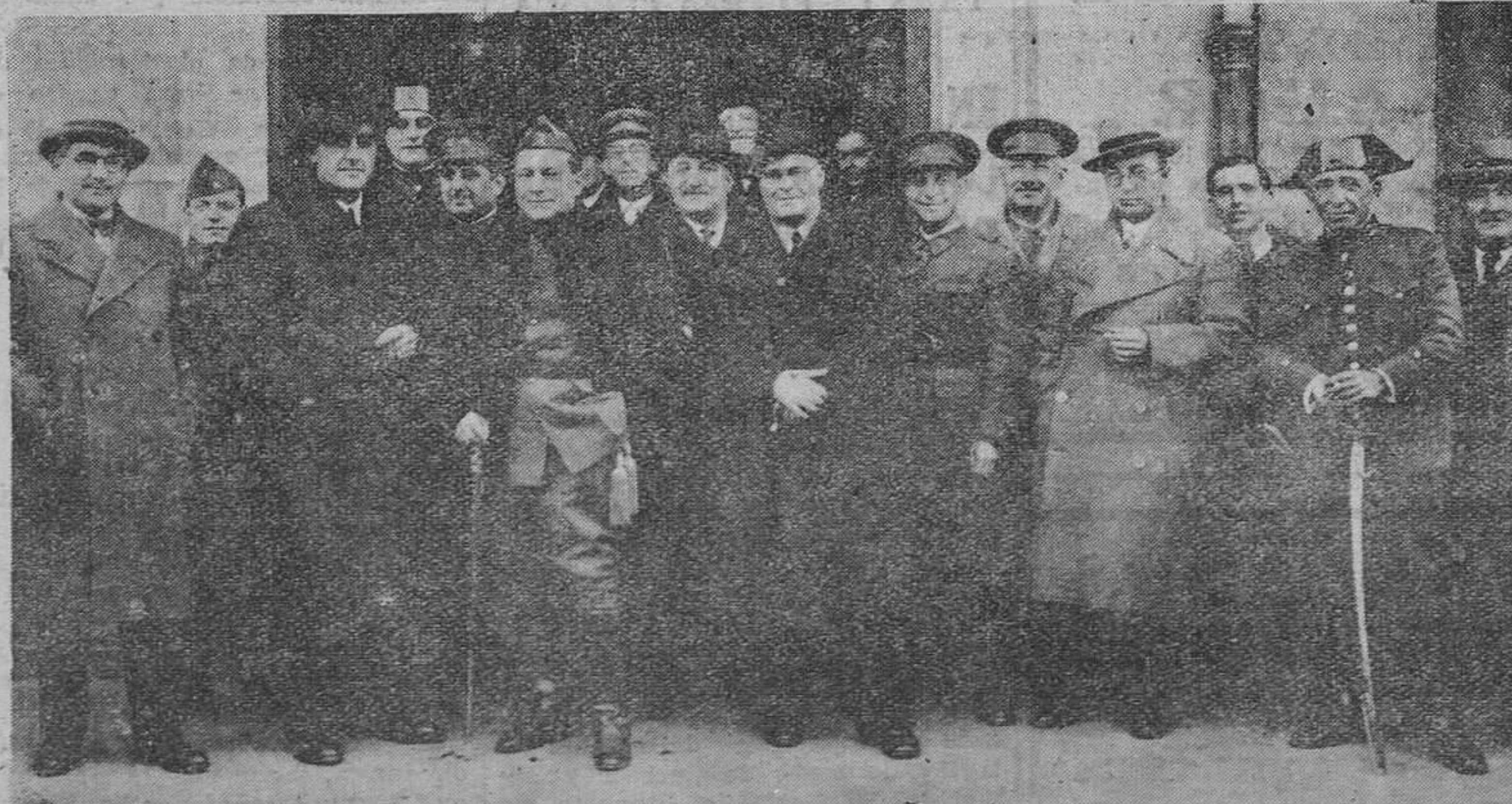
El general López Ochoa a la salida del banquete - homenaje con que fué obsequiado por el Ayuntamiento de Avilés.