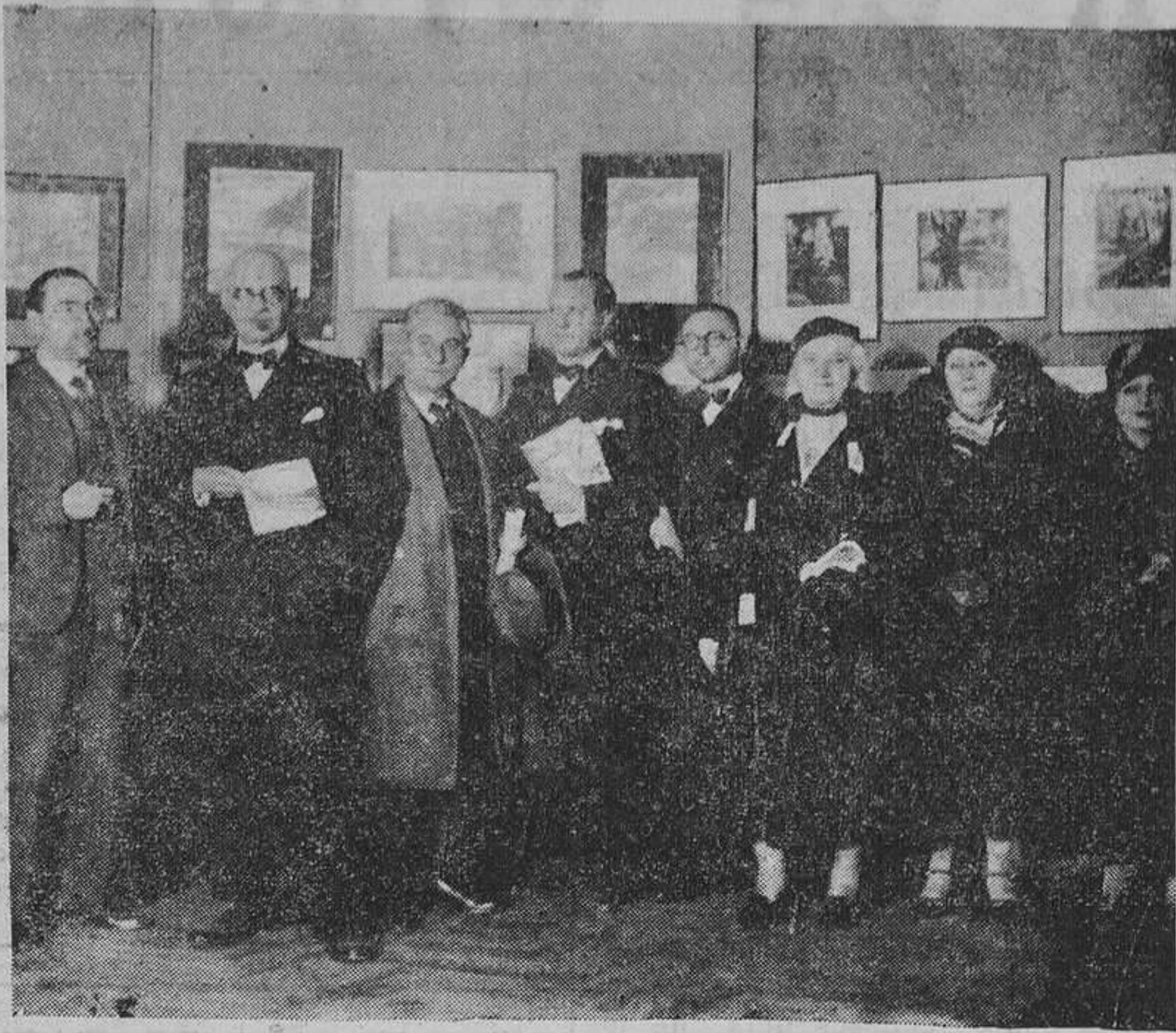
Grupo de asistentes a la inauguración del concurso de fotografías y pintura de Montaña, organizado por la Sociedad de Alpinismo "Peñalara".