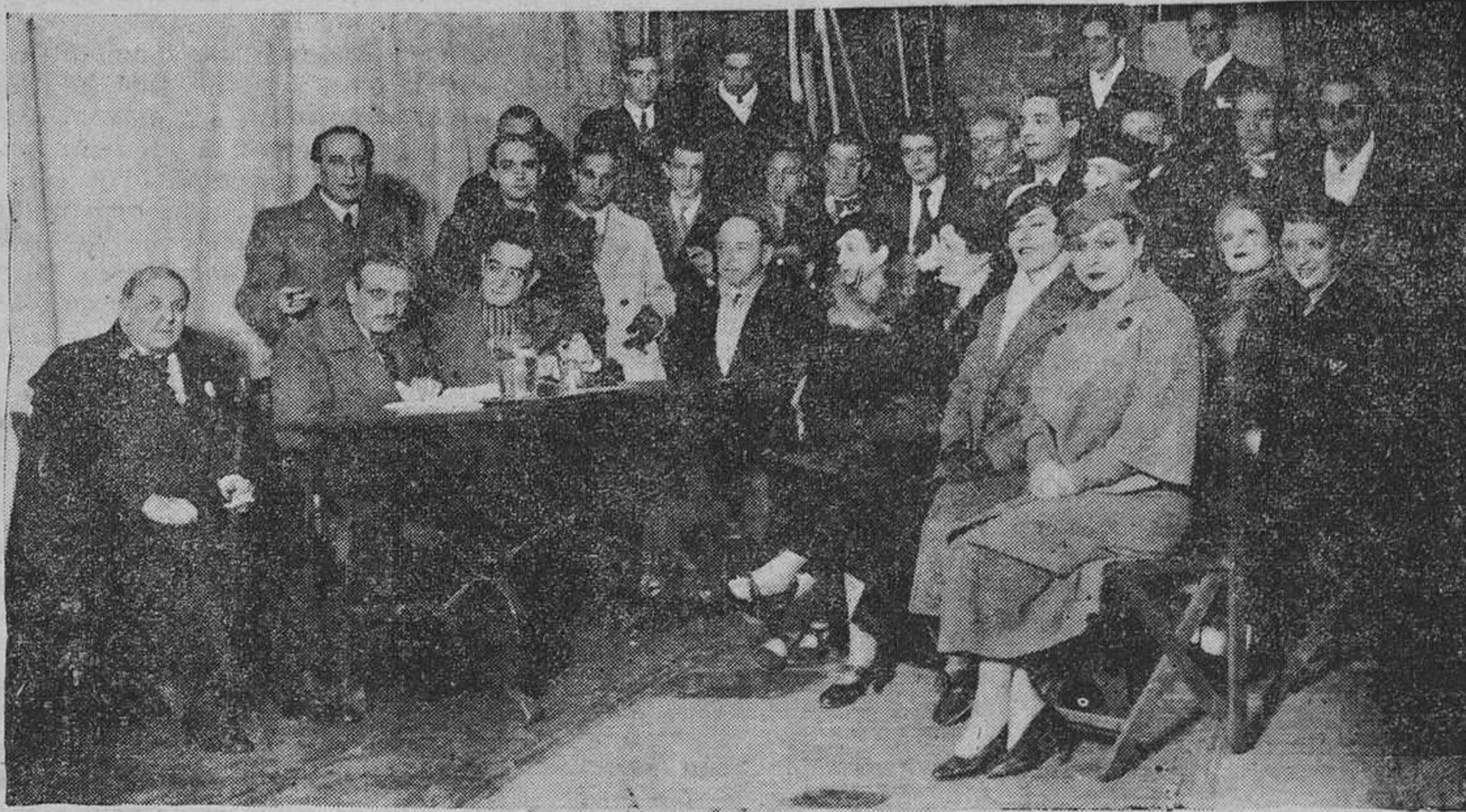
El ilustre poeta don José María Pemán, leyendo su última producción teatral "Cisneros" a la compañía del teatro Victoria, que estrenará en breve la obra.