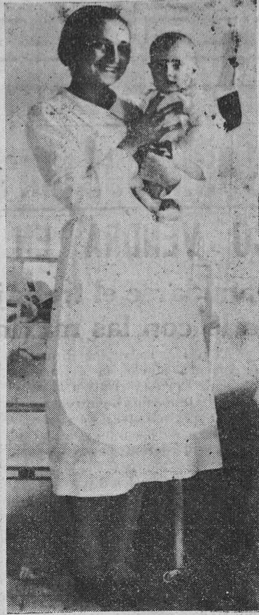
He aquí una bella y distinguida señorita de nuestra buena sociedad, dedicada a cuidar los hijos desamparados de uno de los rebeldes. (F. Mena)