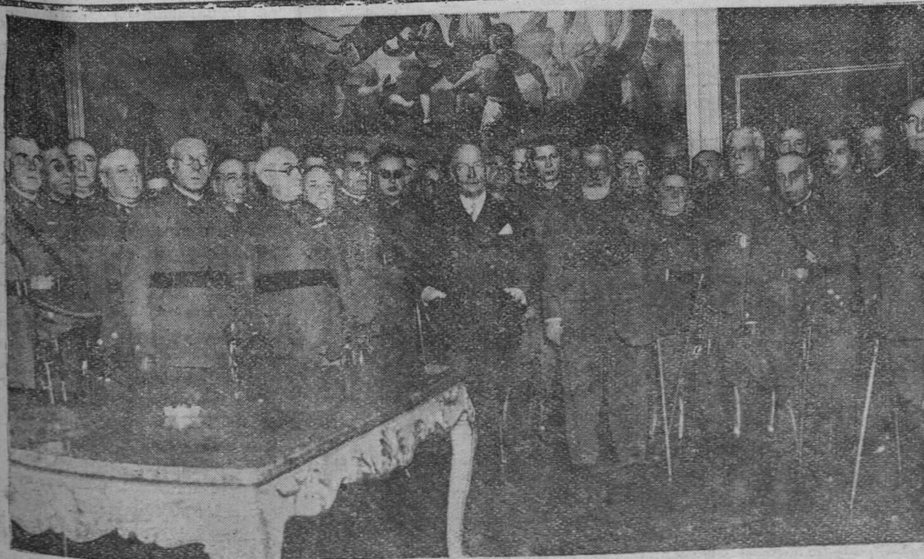
MADRID.— El jefe del Gobierno y ministro de la Guerra, señor Lerroux, con los generales, jefes y oficiales de la guarnición de Madrid, y alto personal del Ministerio de la Guerra, que le han visitado esta mañana.

Consulta diaria de 9 a 1 (lunes y jueves no hay consulta)