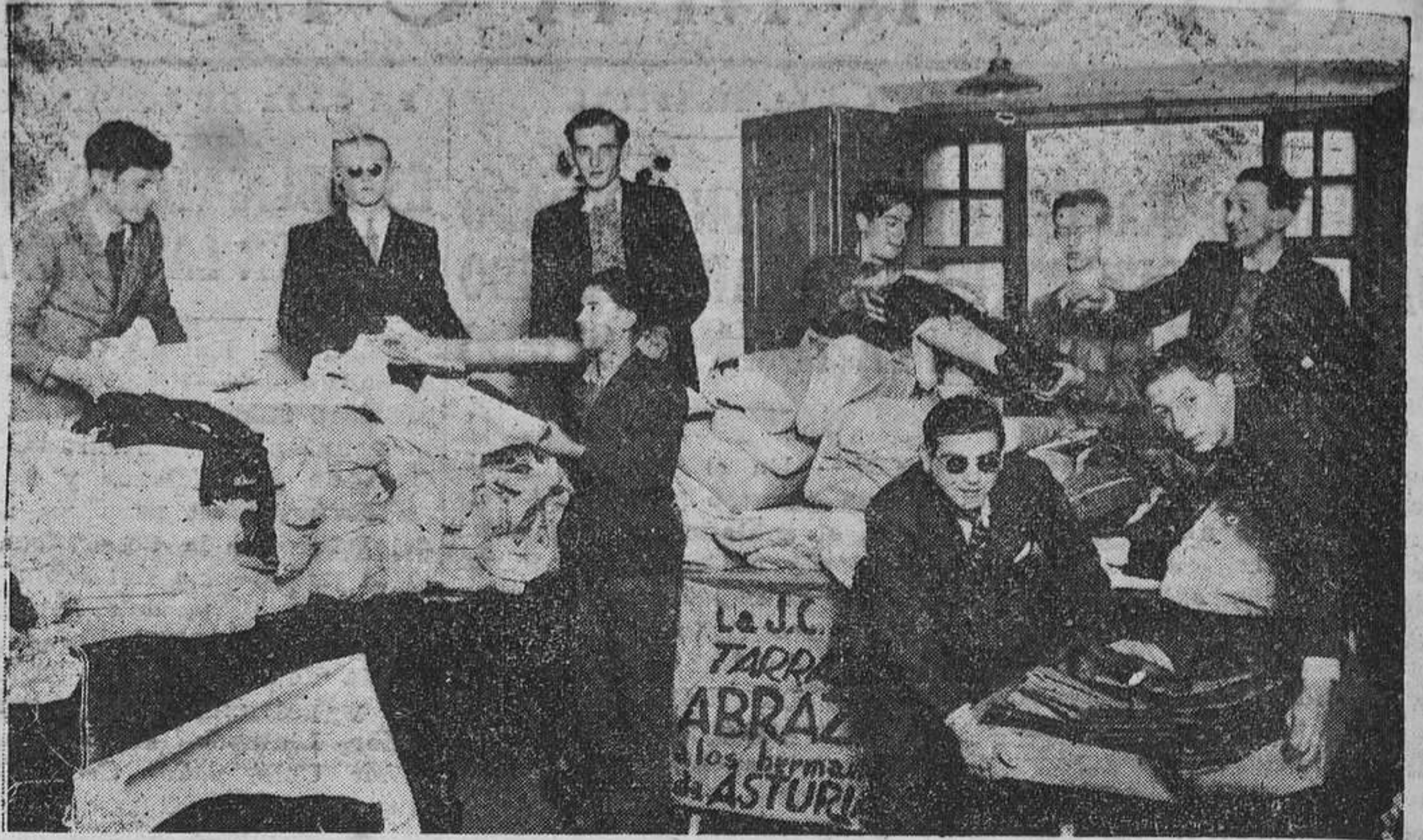
Continúan llegando a Oviedo grandes, enormes partidas de ropas, que la generosidad de otras provincias envía para socorrer a nuestros damnificados. Ayer vinieron varias de Madrid, enviadas por Acción Popular y por Renovación Española. Y vino también una, cuya es la presente fotografía, que envía la Juvenil Católica de Tarrasa. Consta de 5.000 kilogramos de telas de abrigo, paños para trajes, jerseys, bufandas, medias, zapatos, etc. etc. Todo ello ha sido depositado en los locales de diversas asociaciones, a disposición de la Junta de Asistencia social que se encargará de repartirlo.