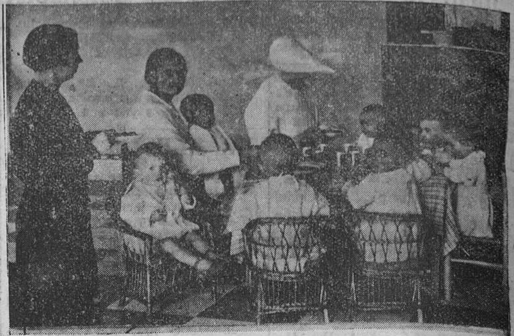
Simpatiquísima escena que se ve todos los días en la "colonia de niños desamparados", establecida en el Instituto de Puericultura; encantadoras señoritas de nuestra buena sociedad alternan con la hermana en el servicio de la mesa.

ría imposible realizar nada. Nuestros pobres niños irían muriendo poco a poco de abandono.