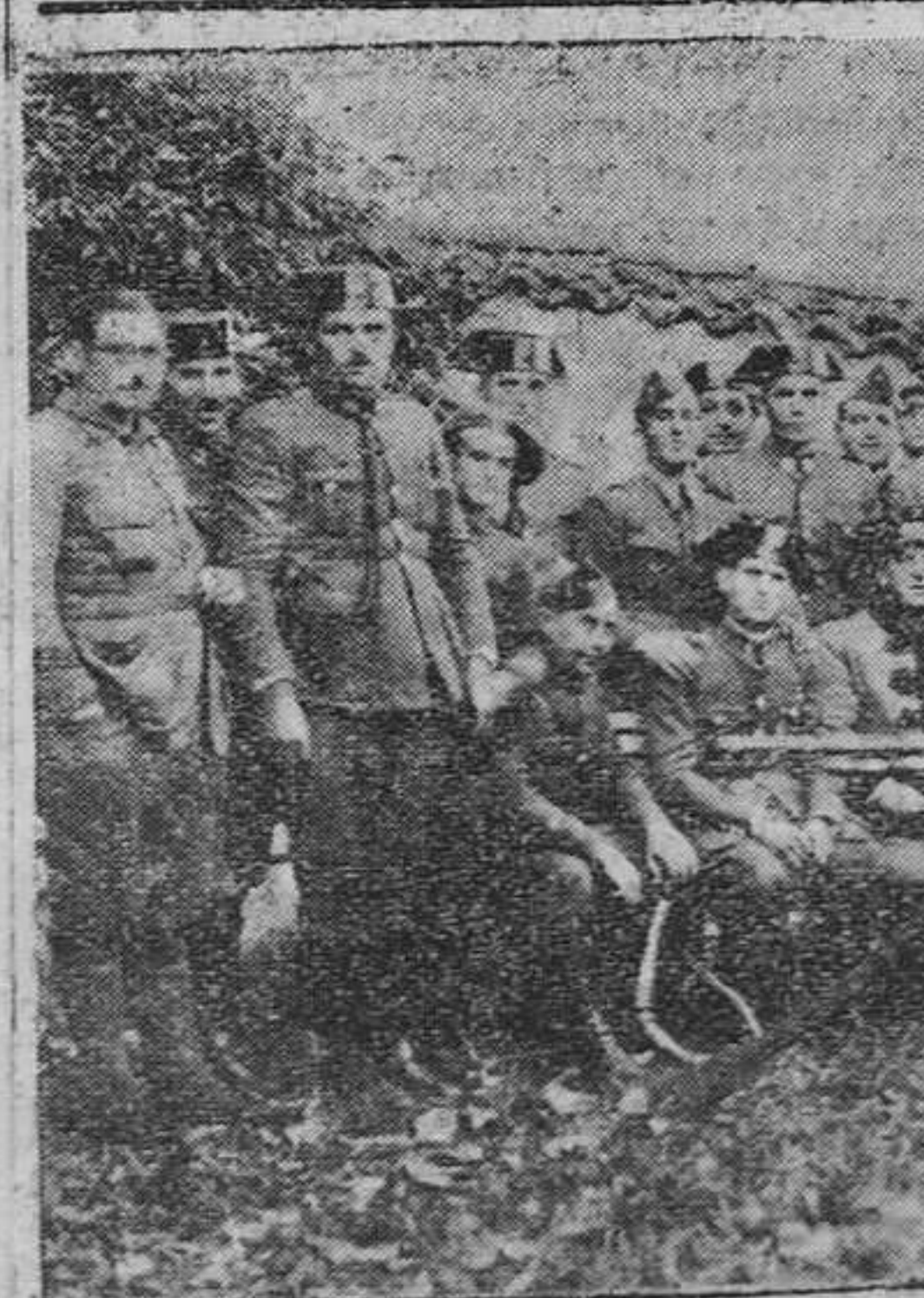
GRADO.— Ametralladora capturada a los rebeldes por las fuerzas de guarnición en la villa moseona

El telegrama del Observatorio Meteorológico de Madrid decía: "Bajas presiones entre Islandia y Noruega. Altas desde Polonia al Este Azores. Probable costas Cantábricas y Gallegas calmas o vientos flojos de dirección variable y cielo nuboso. Levante en el estrecho de Gibraltar. Resto litoral, vientos de tierra y buen tiempo."