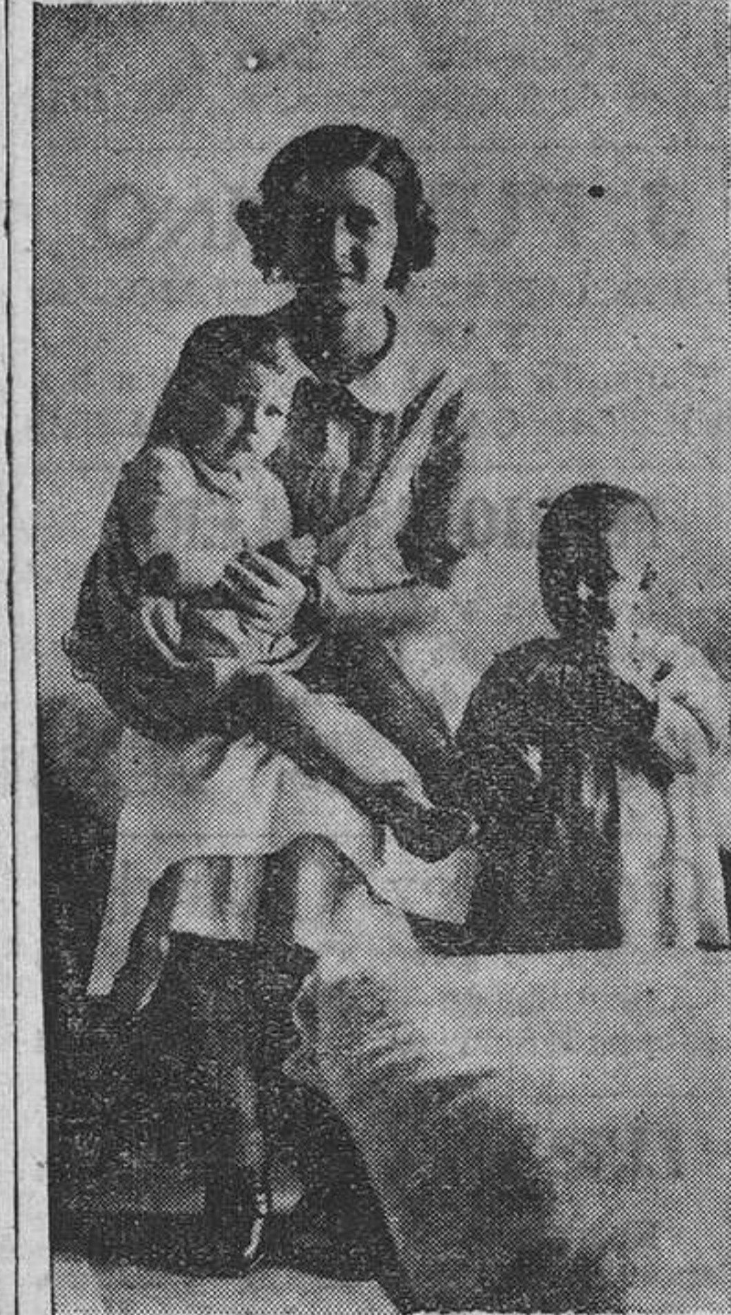
Madre por nacimiento y sentimientos, esta distinguida señorita, orgullo de nuestros salones, cuida del inocente arrapiezo que la locura de un padre ha dejado en el desamparo.

Pensamos también en este dolor, y, por derivación, vamos a pensar en el esfuerzo de todas las