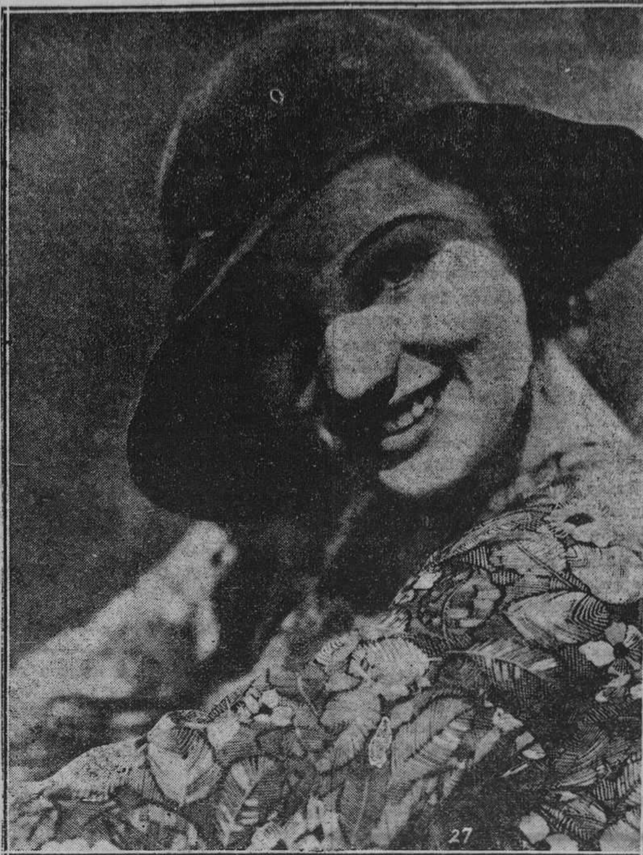
La arrogante belleza Marion Burns llena actualmente de encanto la tierra malaya, donde se encuentra filmando una película que será, sin duda, un triunfo más para ella..