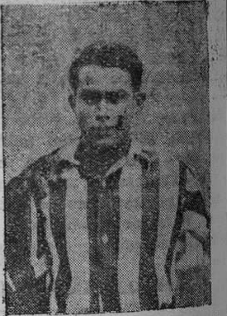
El Sporting de Gijón perdió estos últimos partidos su "borzogui" perforativo en la línea delantera. No hay duda que la causa principal de esa baja de forma es la ausencia de Herrero, jugador joven, a quien aseguran que llanto porvenir en el mundo del deporte.

tundamente en su primer partido con el equipo campeón de la Liga.