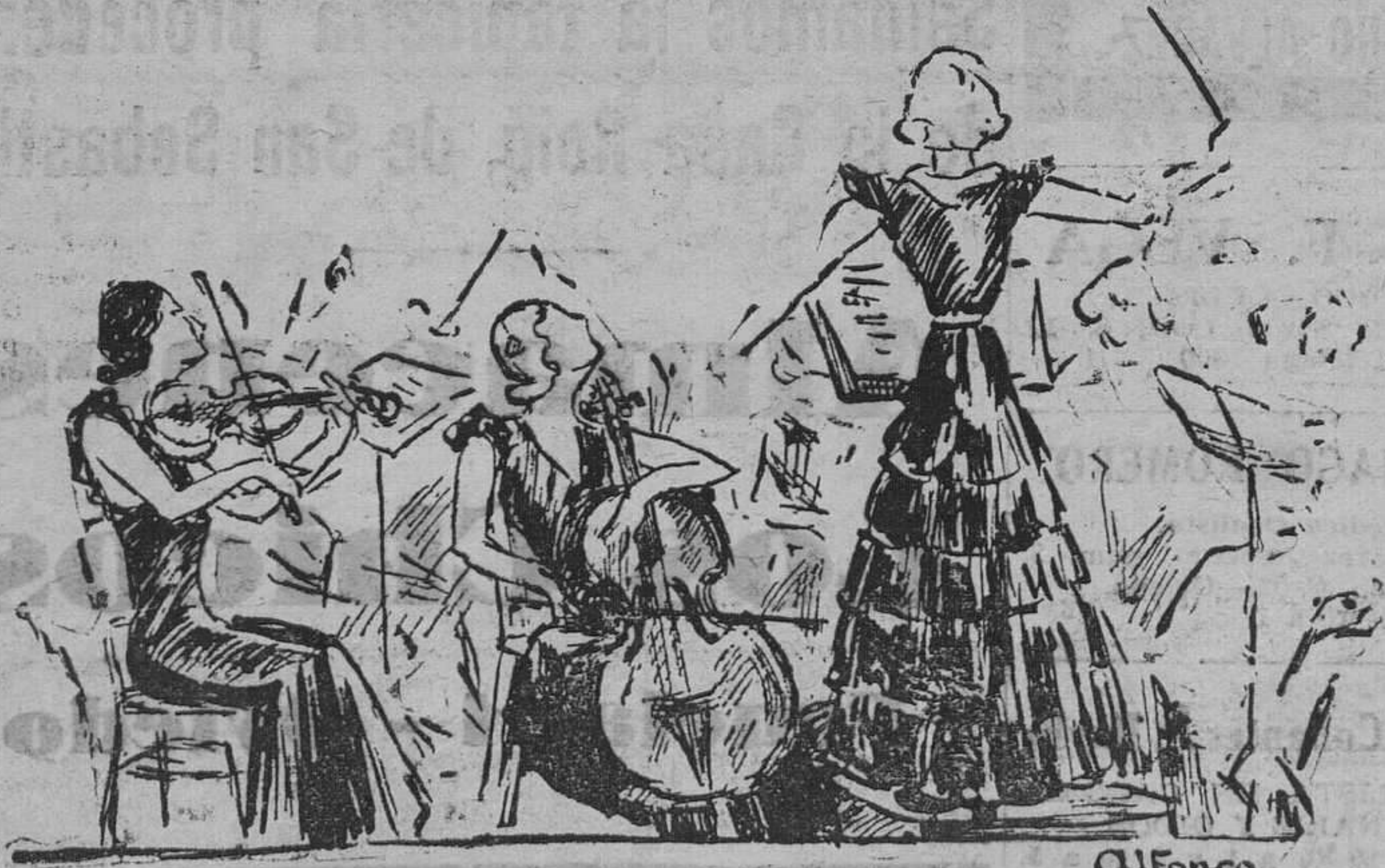
Apunte del concierto de ayer.