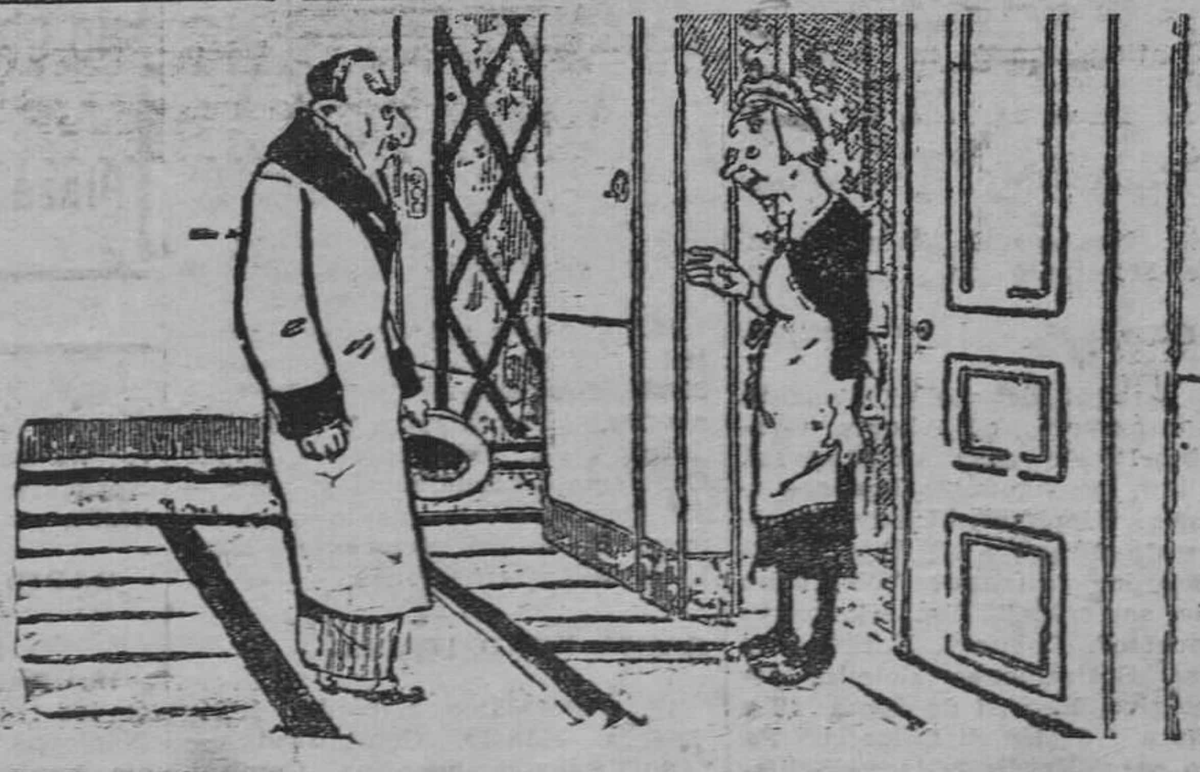
—Oh, señor, viene usted a tiempo. La señora me ha dicho: Somos trece en la mesa. ¿es que no va a venir ningún imbécil para hacer el catorce?