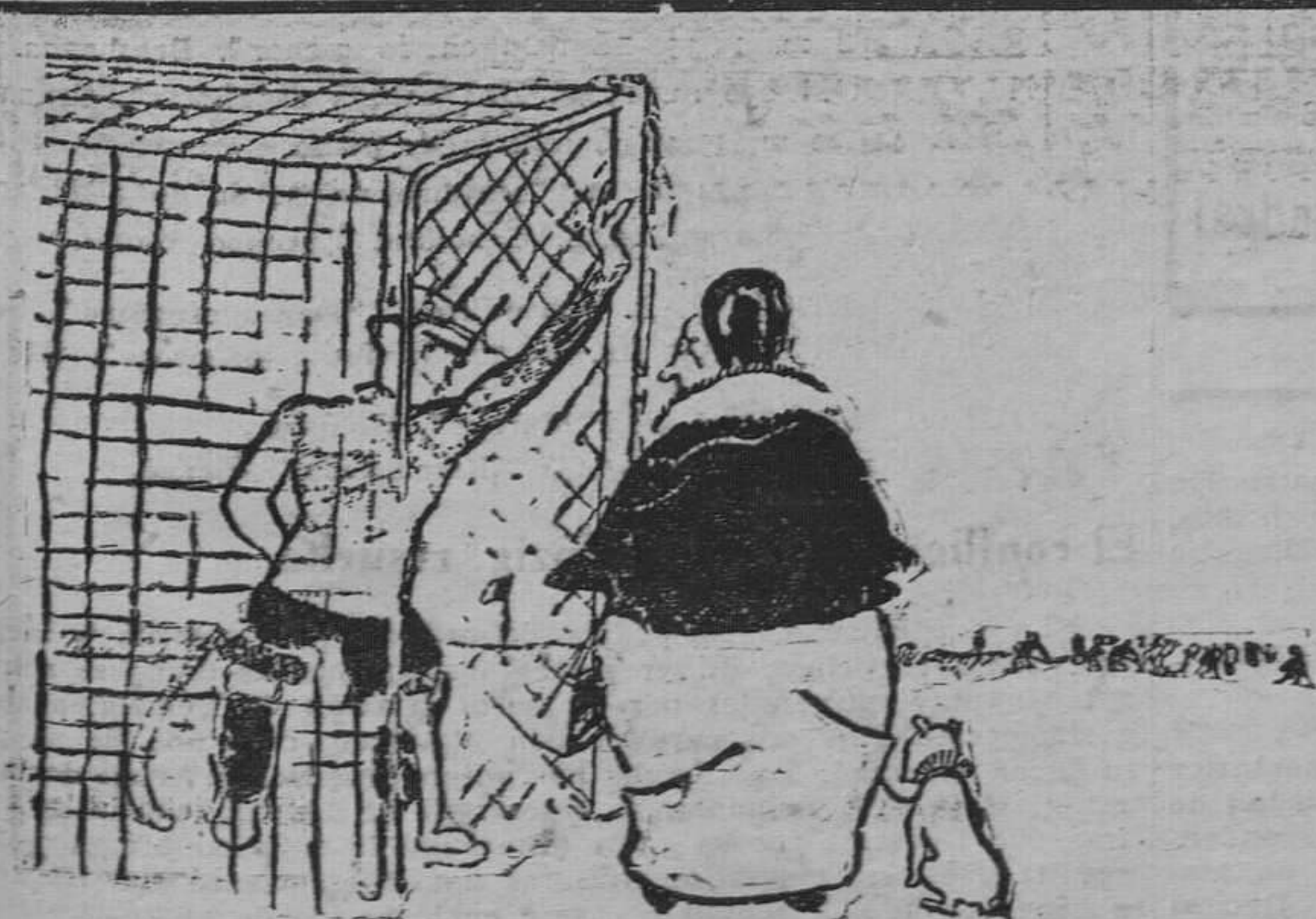
—La señora al portero del equipo.— Oiga, joven. ¿Por qué no juega y se divierte con los otros muchachos?

Para demostrar la extrema urgencia del restablecimiento financiero, Cherón ha dicho en la tribuna de la Cámara que cada hora de retraso costaba al Tesoro 1.311.000 francos, o sea, por veinticuatro horas, 31.464.000 francos, y por los 28 días del mes de febrero, suponiendo— lo que no está demostrado— que la votación final se celebre antes de fin de mes, 880.992.000 francos: más de mil millones de déficit para un mes de 31 días.