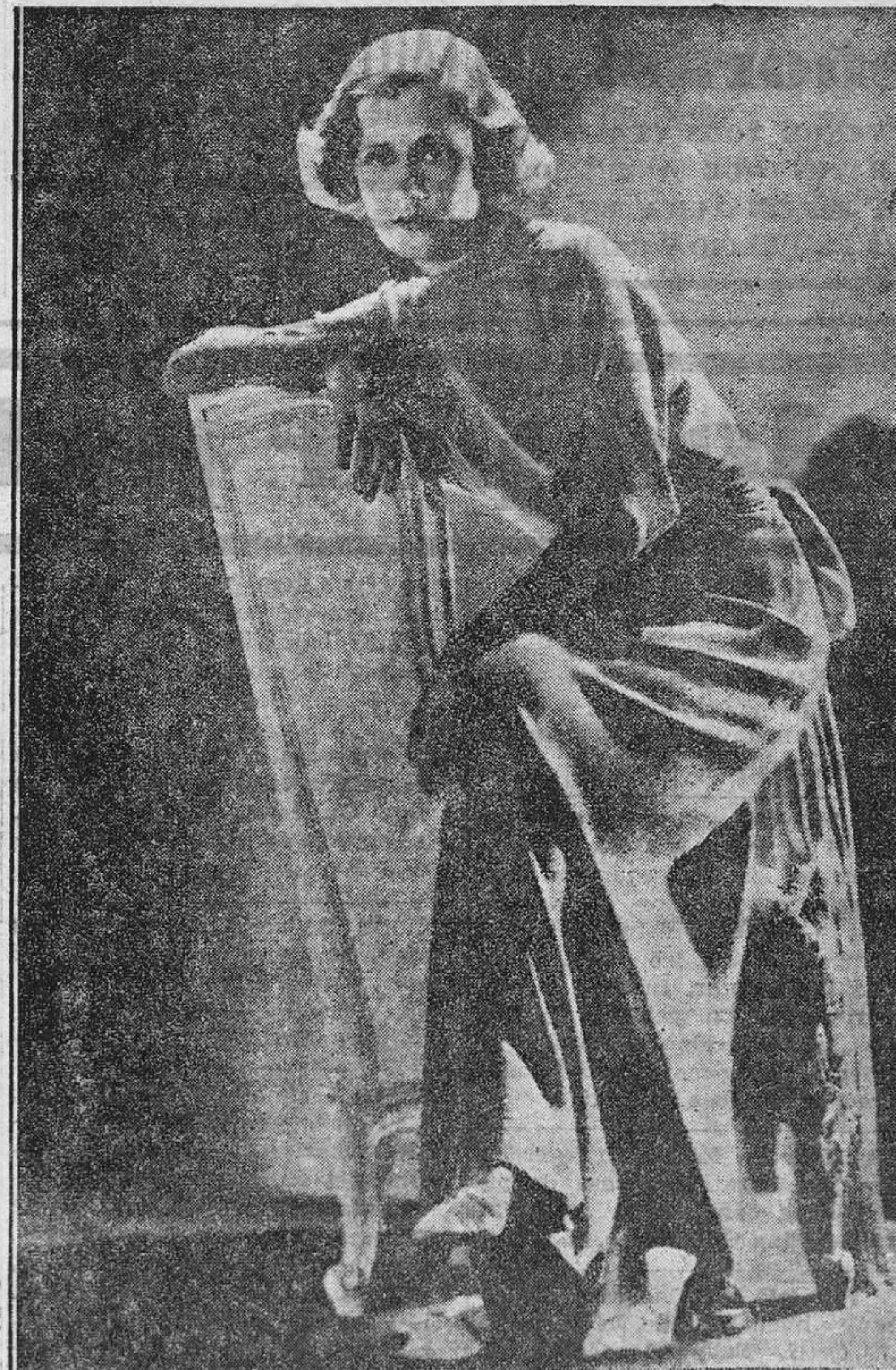
Irene Dunne es una de las más interesantes "estrellas" de Hollywood. Todavía es muy poco conocida en los periódicos y no lo es tampoco mucho en la Meca del cine. Es una muchacha fuerte y alegre, muy aficionada a los deportes: la mejor jugadora de "golf" de la costa californiana. Ha obtenido ya dos grandes éxitos, en "Cimarrón" y "Back Street". Dos memorables papeles en dos años, lo que es casi un "record". Probablemente, en "The Lady" obtendrá un triunfo más