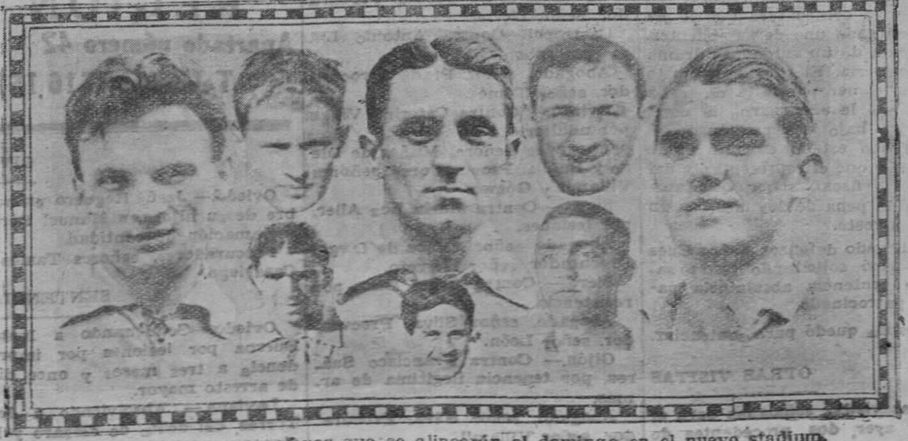
Algunos de los jugadores yugoeslavos que se alinearán el domingo en el nuevo stadium.

No se devuelven los originales ni se sostiene correspondencia sobre los mismos.