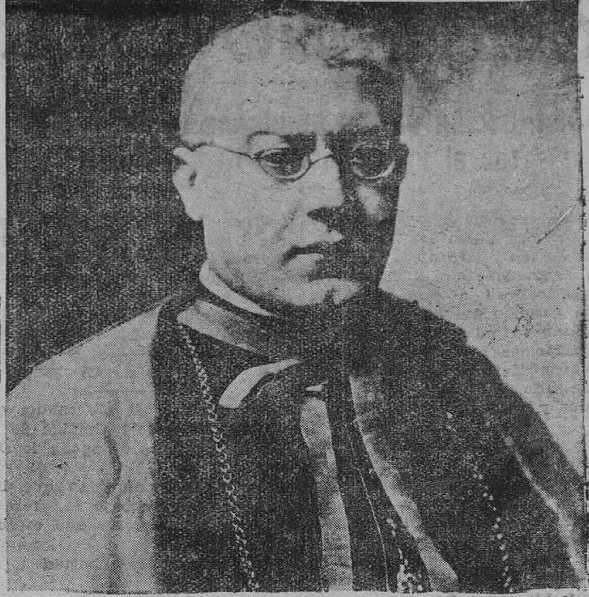
S. E. el cardenal Lauri, que ha sido nombrado legado pontificio en el Congreso Eucarístico de Dublin.

El tema para el Congreso aprobado por su Santidad el Papa Pío XI, es el siguiente: "La sagrada Eucaristía, fundamento de la piedad de Irlanda".