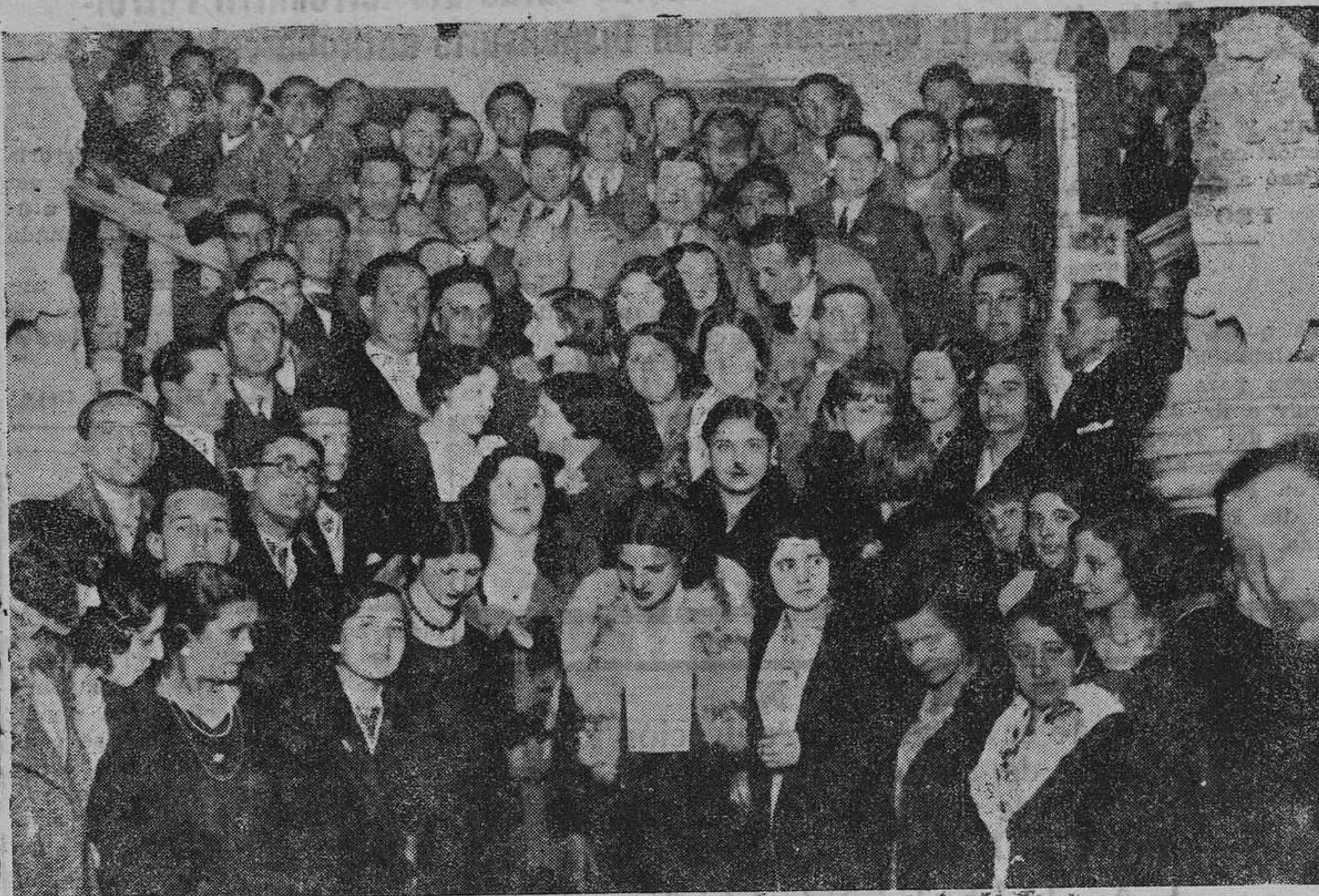
OVIEDO.—Grupo de concurrentes a la recepción que se celebró en el palacio de la Diputación.