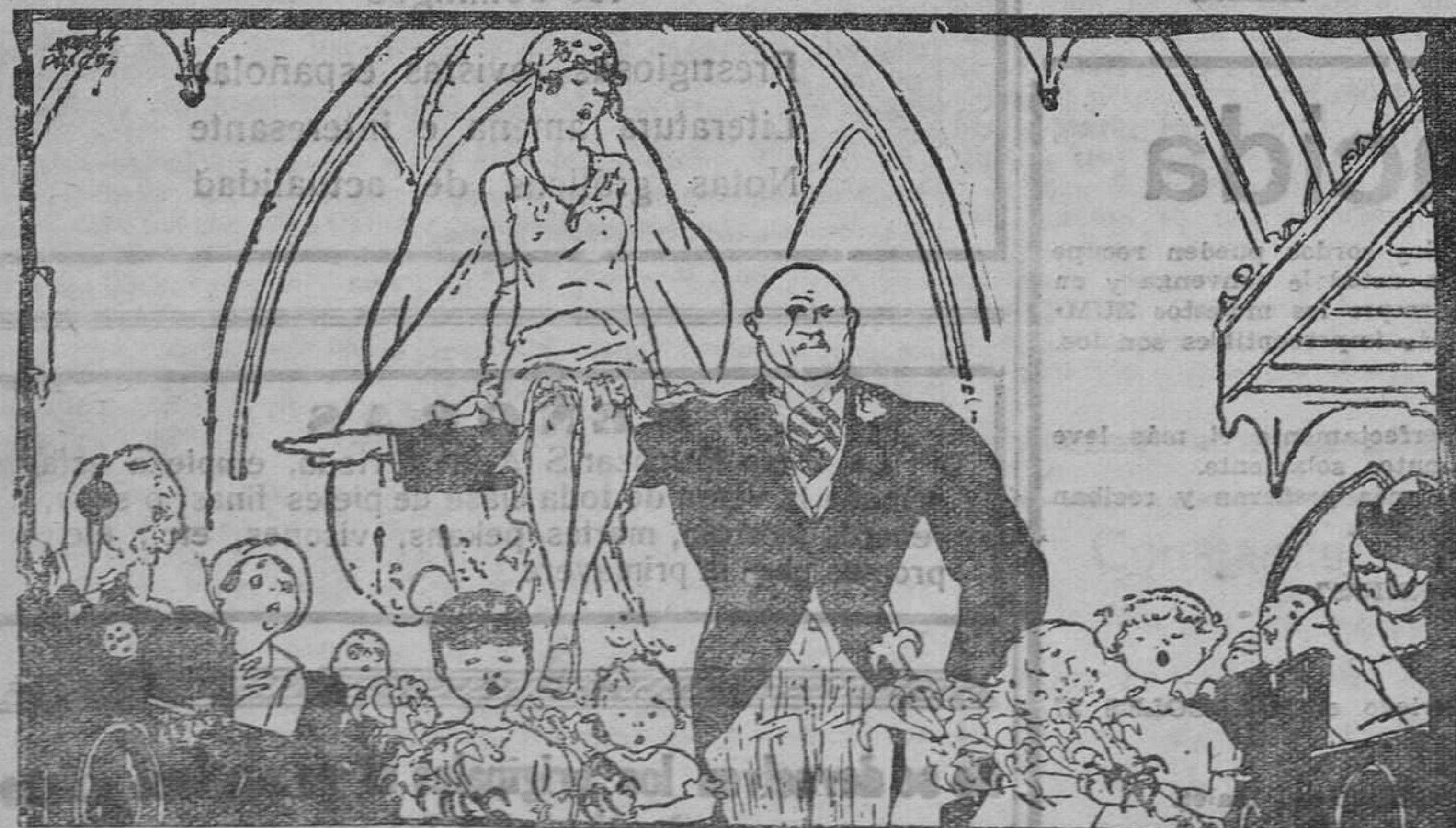
El campeón de todos los pesos se casa.