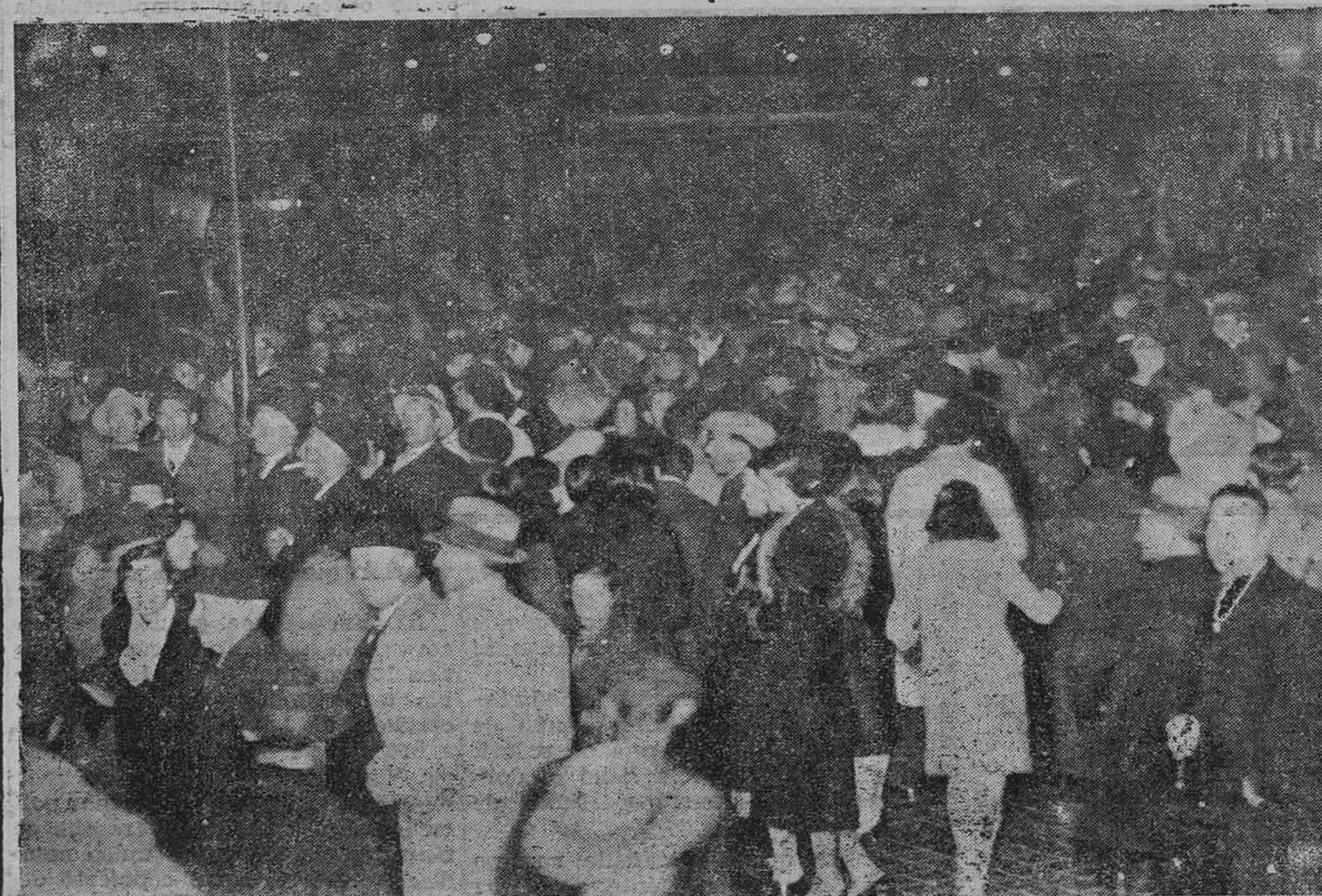
OVIEDO.—Los andenes de la estación a la llegada del rápido que conducía al equipo yugoeslavo. (Foto Mena).

terpretó el himno nacional de Yugoslavia, que fué aplaudidísimo por los jugadores, ganando también muchos aplausos una canción de la tierra que interpretaron después.