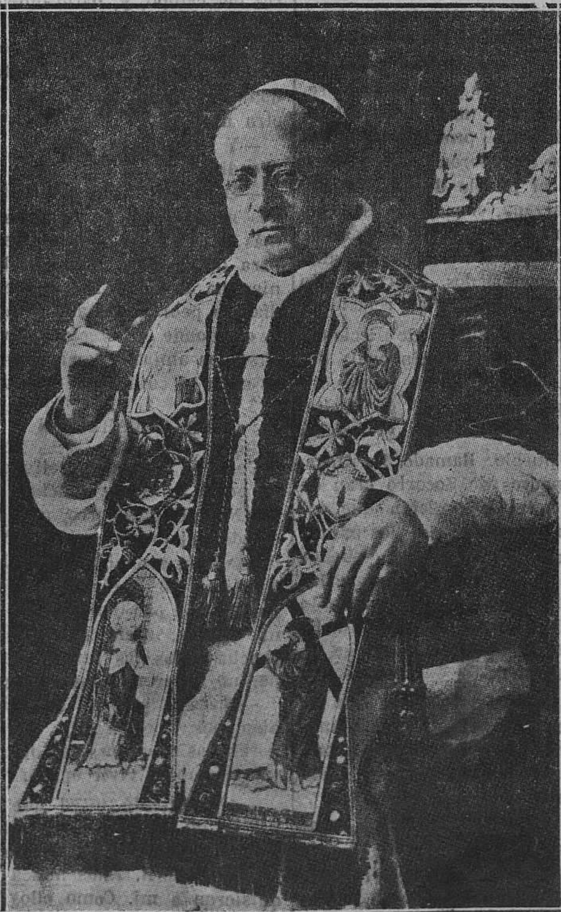
ROMA.— Su Santidad el Papa Pío XI, que con motivo de celebrar su jubileo sacerdotal, salió ayer por primera vez del Vaticano, para celebrar una misa en la Basílica de San Juan de Letrán