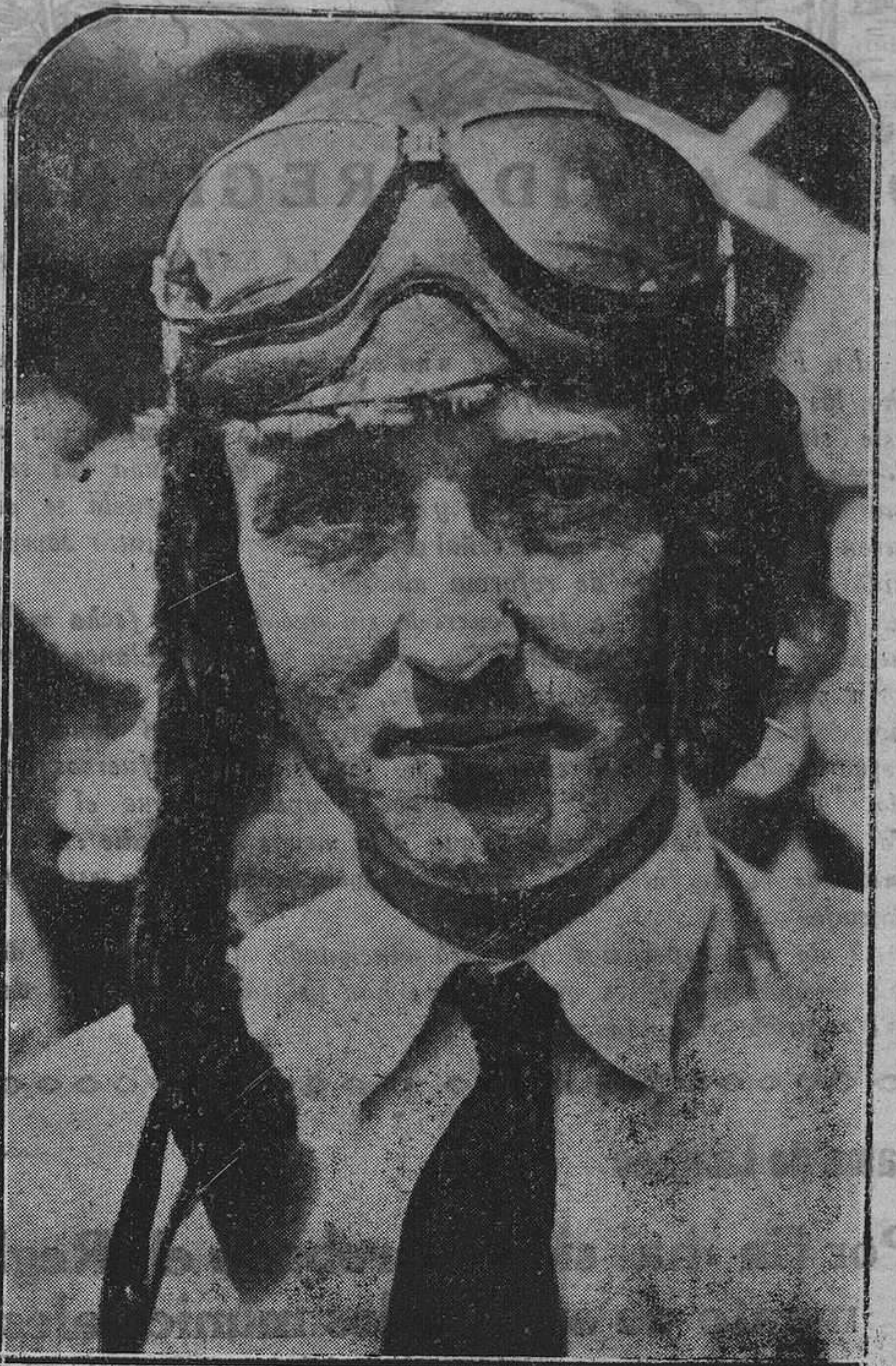
El comandante Byrd, que se halla dirigiendo en estos momentos la expedición antártica, va a ser promovido al cargo de contralmirante

Si quiere aumentar sus ventas, anuncie en REGION