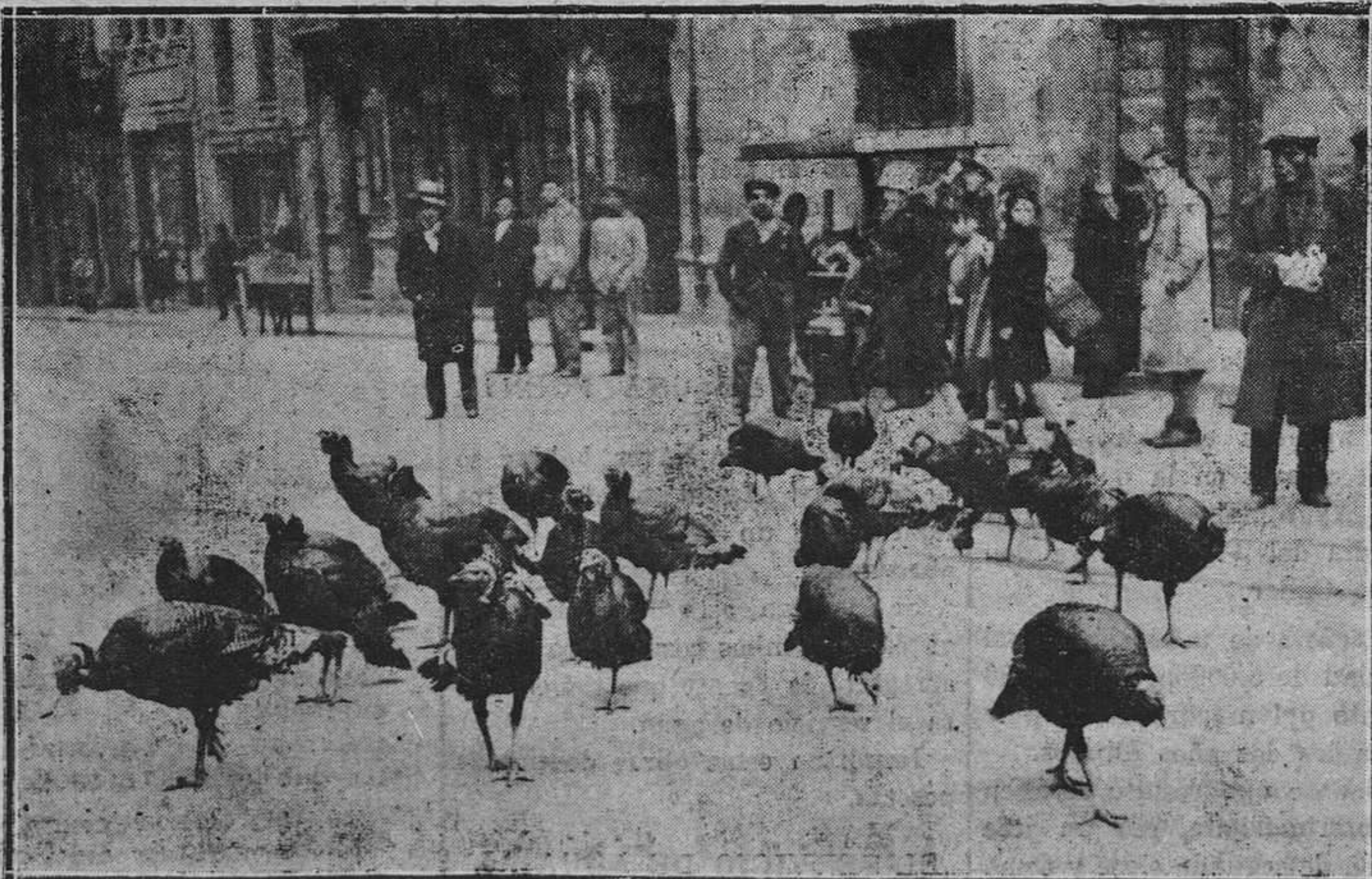
OVIEDO.— Los clásicos pavos, presuntas víctimas de personas y bolsillos pudientes