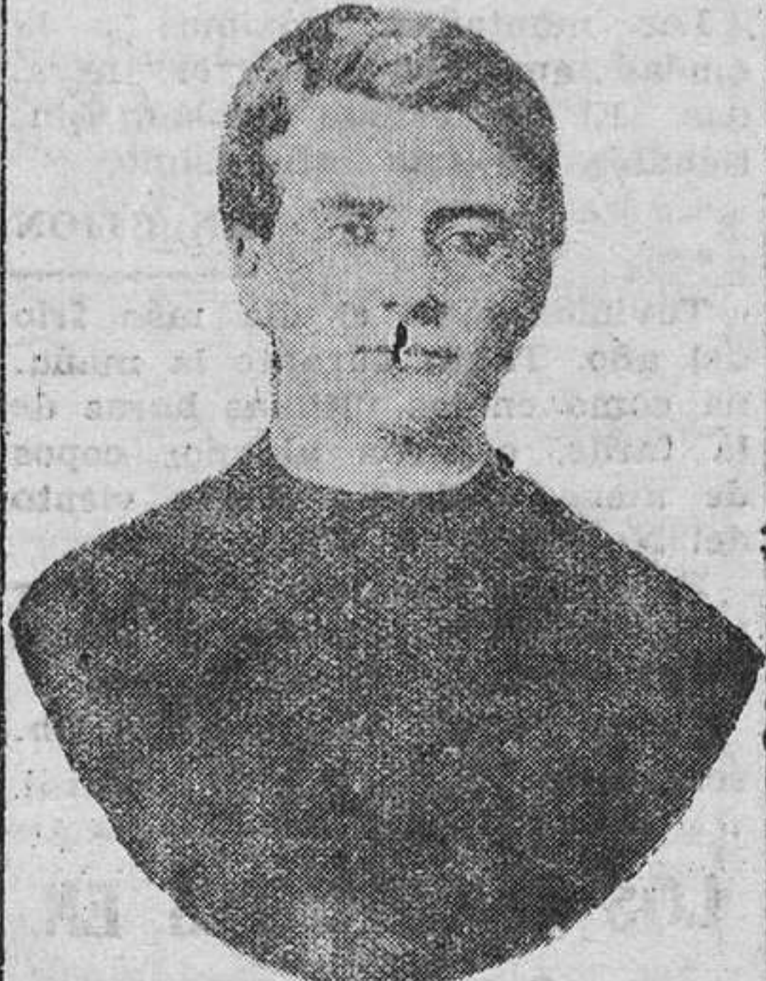
Aquiles Ratti ordenado sacerdote

1914.—14 de Septiembre: Canonigo de la Basílica de San Pedro. 28 de Octubre: Protonotario Apostólico Supernumerario. Benedicto XV ha descubierto en él al hombre que "por su piedad, su celo por la religión,