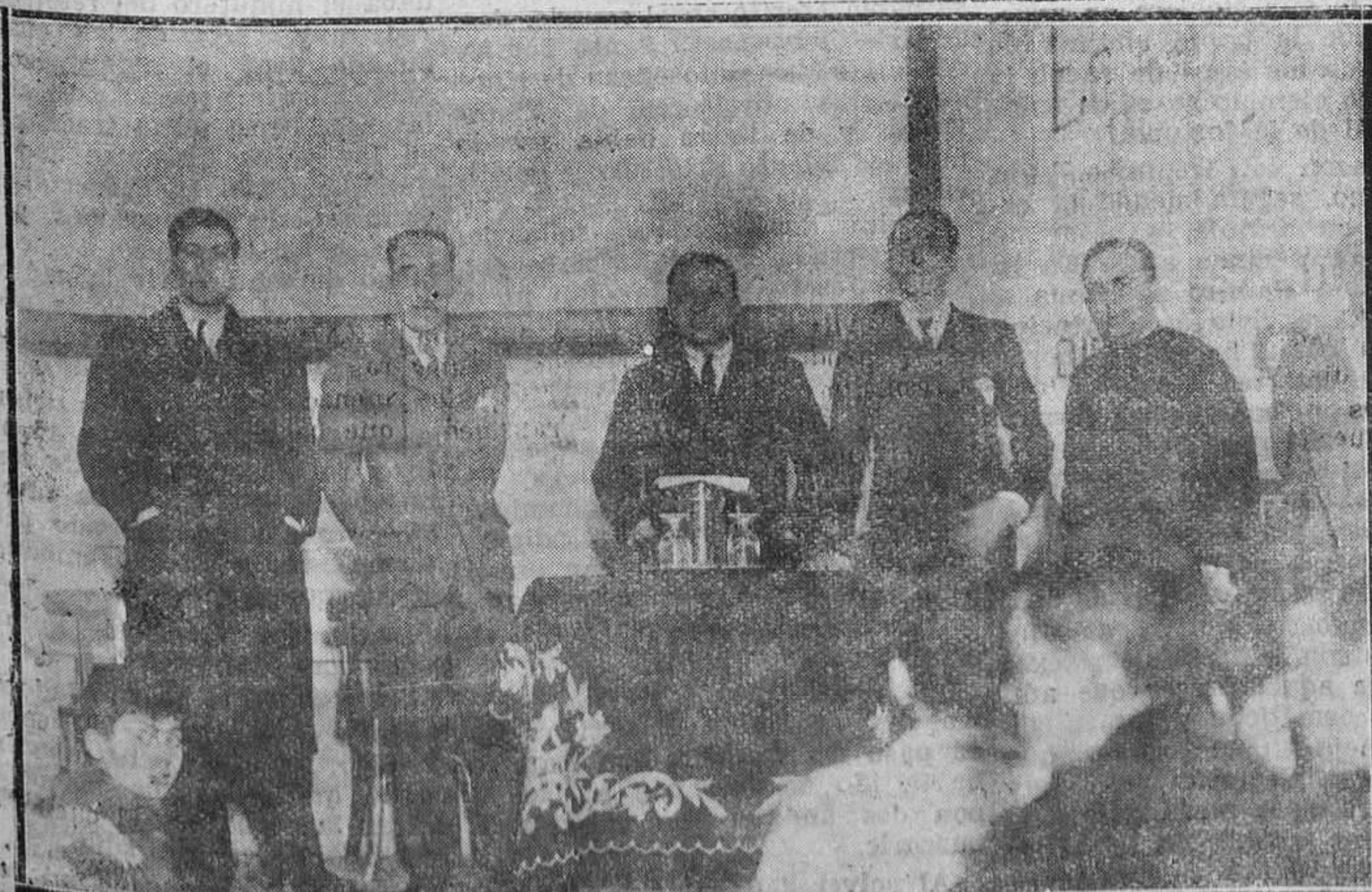
PRAVIA.— Los oradores que tomaron parte en el mitin del pasado domingo.