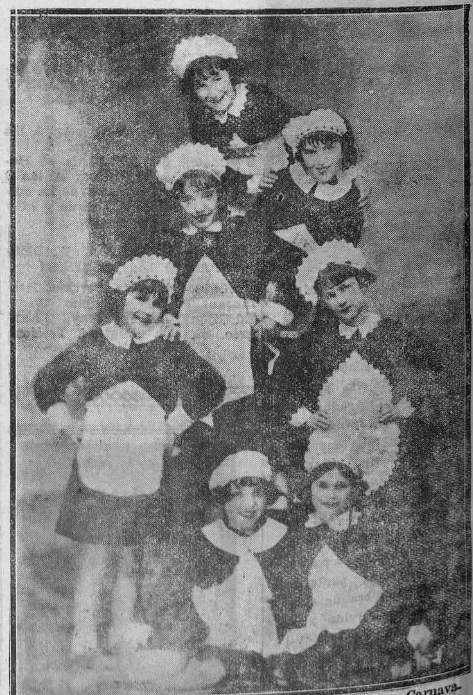
AVILES.—Lindas doncellitas que en los pasados Carnavales recorrieron nuestras calles, llamando poderosamente la atención del público.