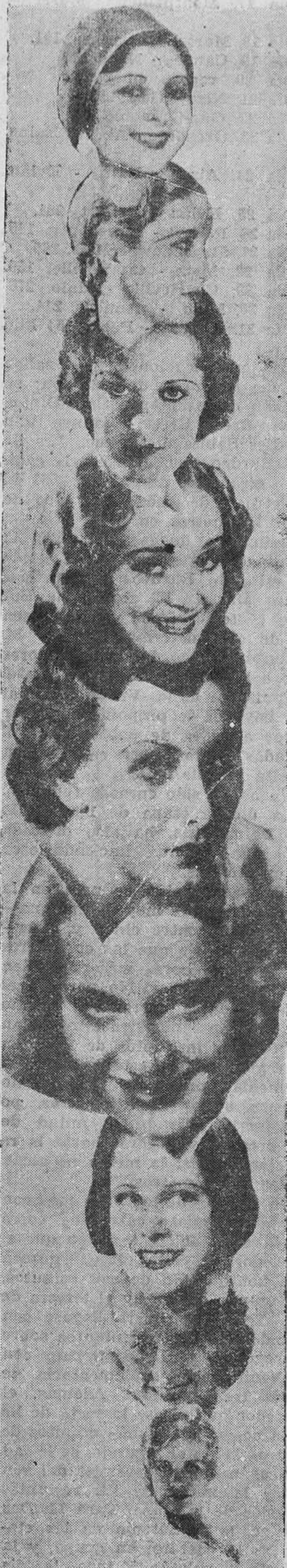
ALGUNAS ARTISTAS DE LA PANTALLA

Lo ponemos en duda, pero por nosotros... que se casen. No creemos que ni Escalante, ni Monte Cristo, pongan el menor pero.