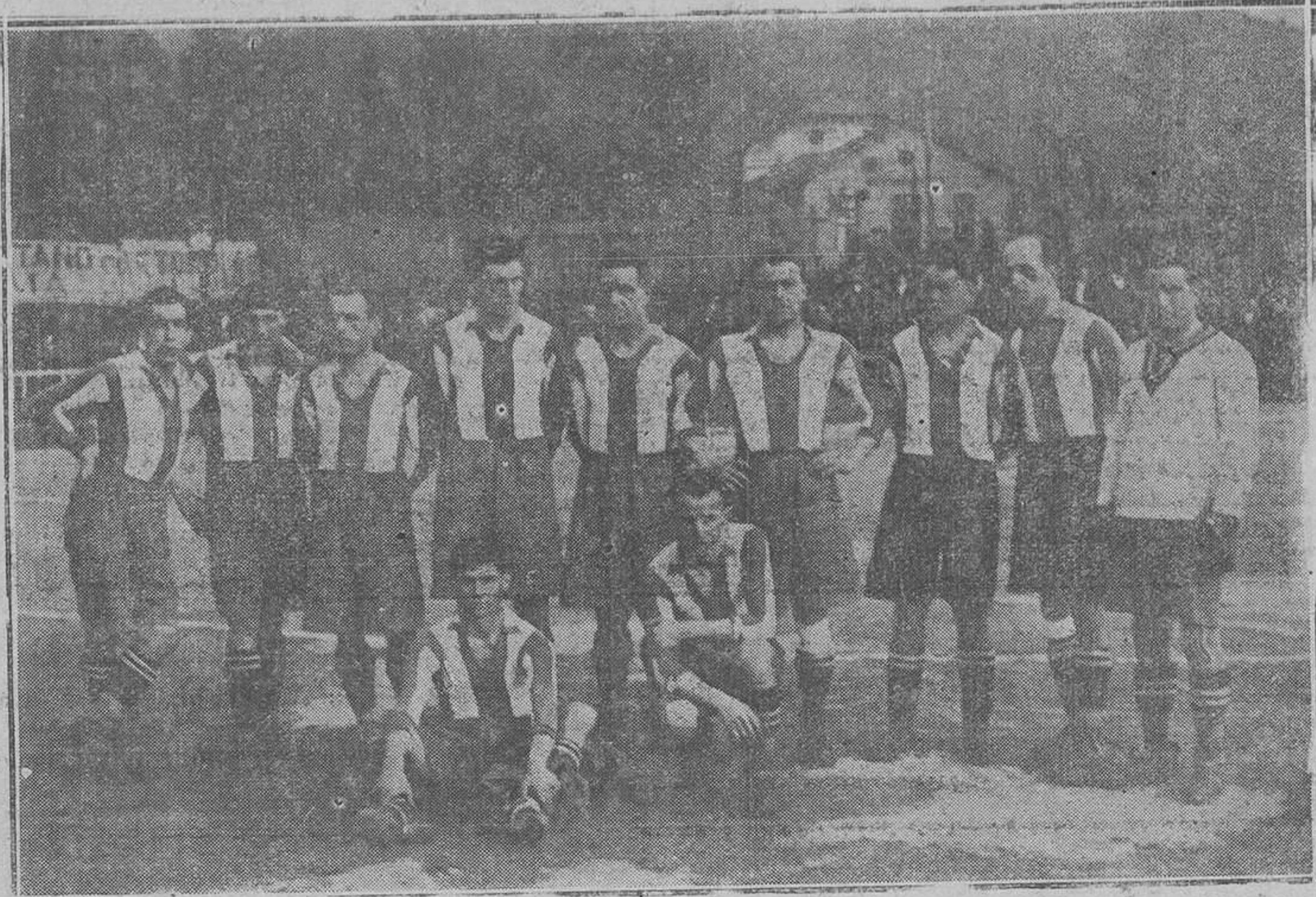
El Deportivo de la Coruña que fué vencido el pasado domingo por el Real Oviedo.

Sin embargo: no queremos que por otra parte, pueda perjudicarse a los que de buena fe van a contribuir al bien general, pues bien puede darse el caso de que el ganado que ofrecen algunas empresas y particulares, reúnan todas las condiciones indispensables a la buena selección."