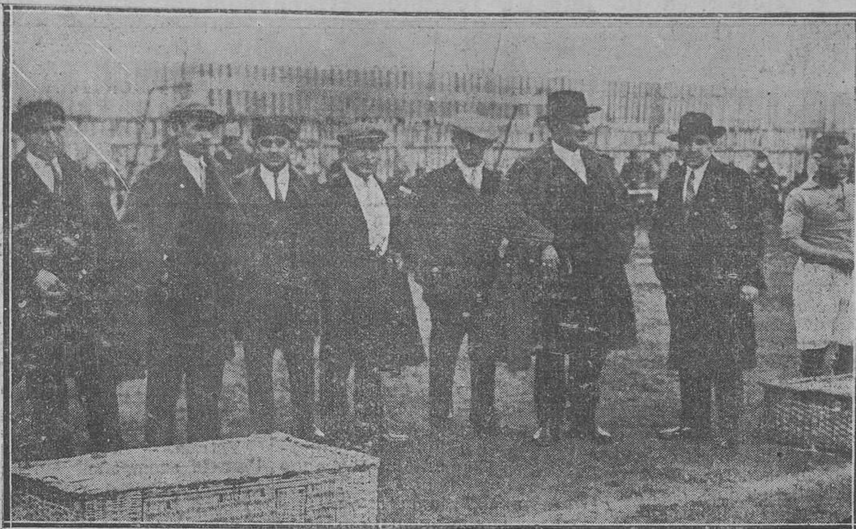
OVIEDO.—Los directivos de Gijón y Oviedo de la Real Sociedad Colombí, que presidieron la suelta de palomas celebrada el domingo último en Teatinos. Esta misma sociedad, y no el Colombí o del Principado de Asturias, como apareció por error, fué la que sugirió la información gráfica que publicamos ayer.