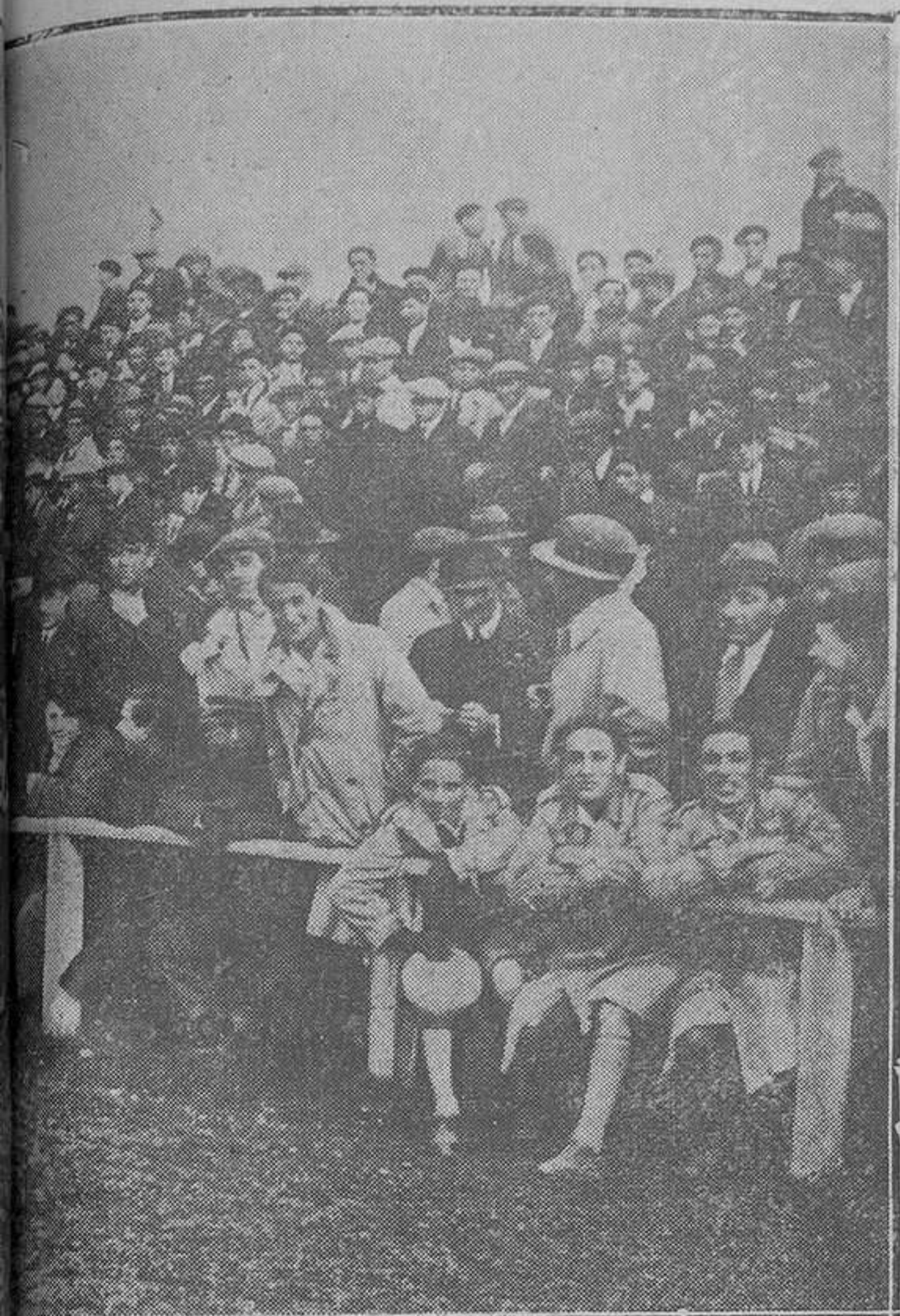
Ante el partido del domingo