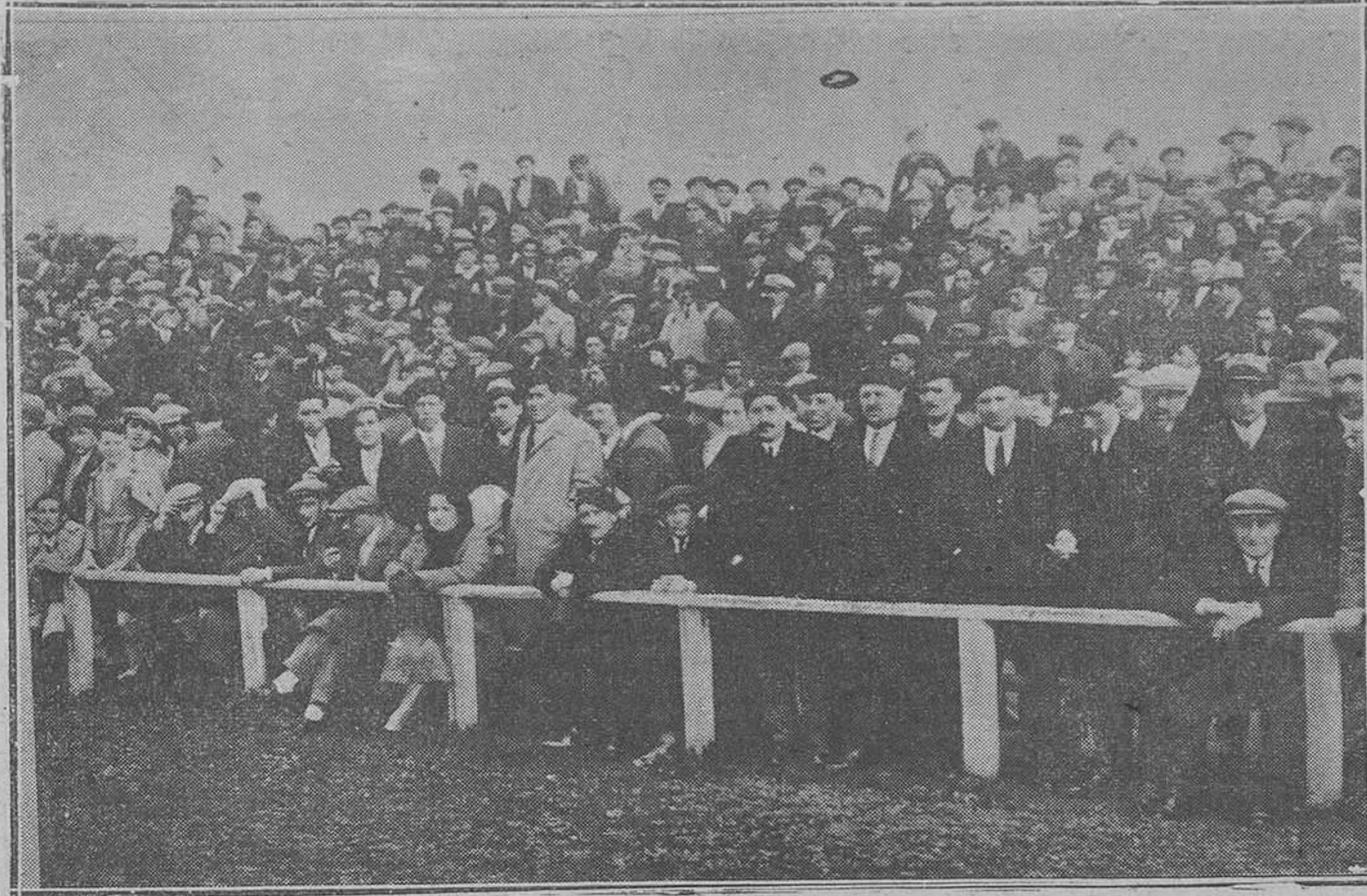
Un aspecto del público en el partido del domingo

La conducción del caráver, a las cuatro de la tarde del domingo, resultó una imponente manifestación de duelo.