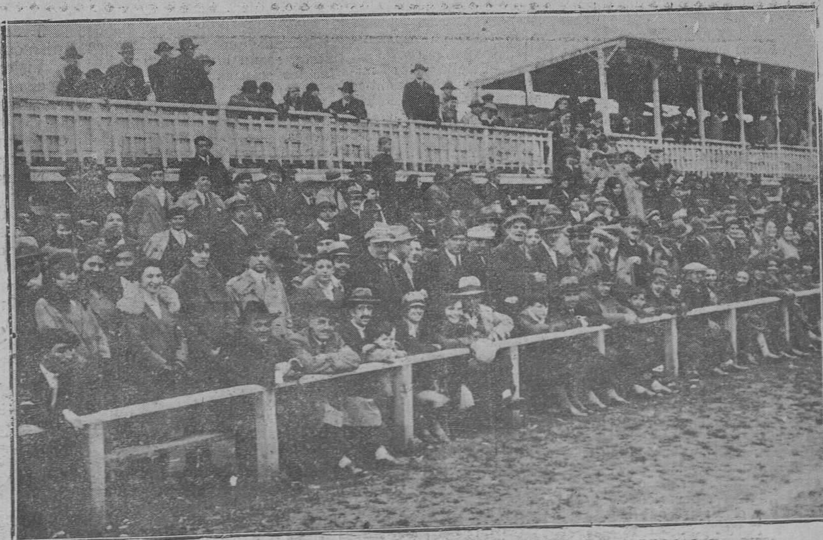
OVIEDO.—Un apunte de la tribuna de preferencia durante el partido del domingo.

Ese es el hombre que el porvenir venerará; el capitalista que muera viejo, retirado de los negocios, dueño de millones disponibles, se irá a la tumba sin recoger una lágrima, honores ni alabanzas.