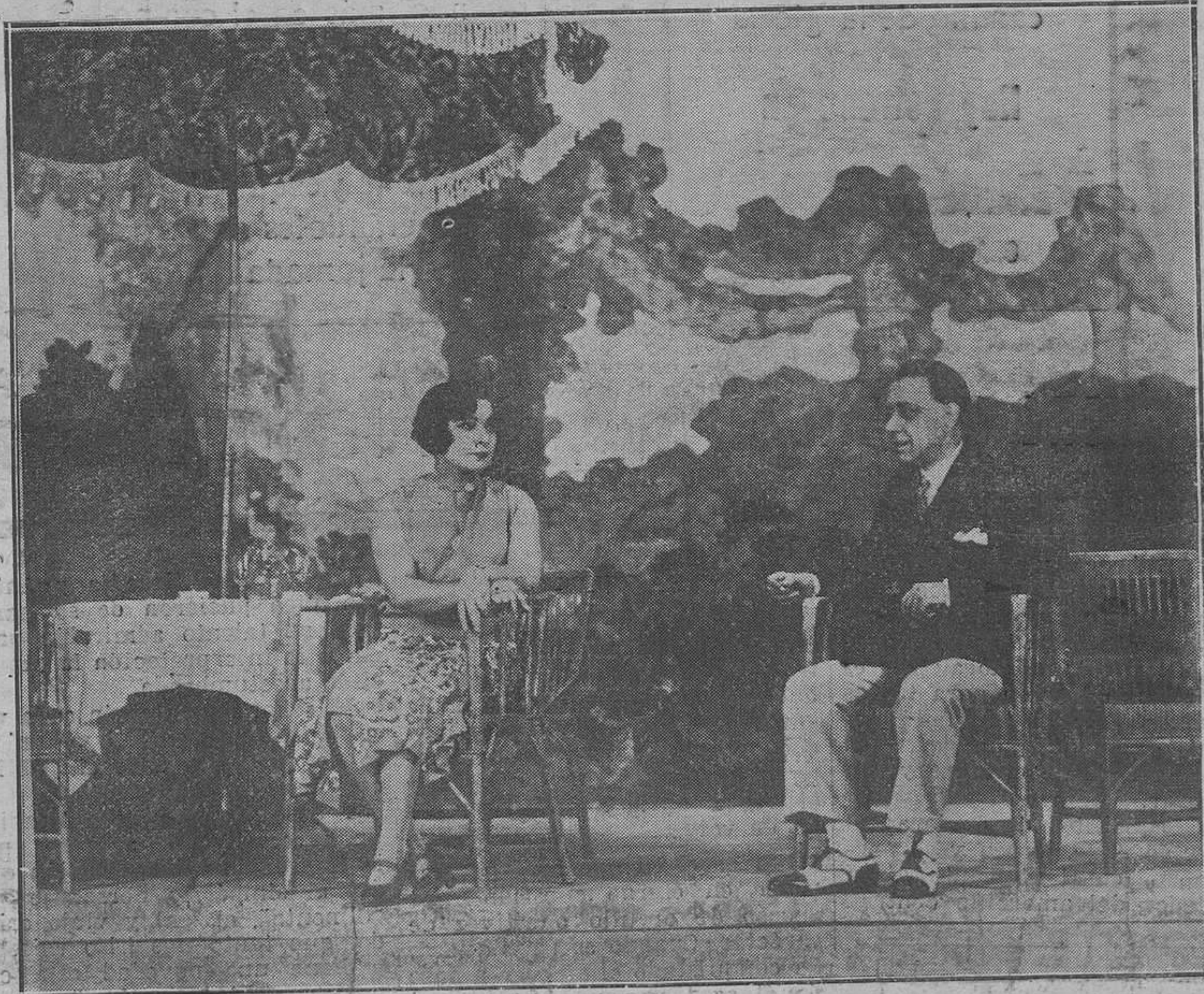
Margarita Xirgu y López Silva en una escena de la nueva comedia de Bauventé NO QUIERO, NO QUIERO...I, estrenada con clamoroso éxito en el teatro Fontalba para beneficio de Margarita Xirgu.

Un mal vecino, porque a nadie gusta escuchar los gritos de los locos, ni las lamentaciones de los enfermos... Ni tampoco es agradable su presencia; familiares unos, amarillos otros, éste con la cabeza vendada, aquel otro colgado de unas muletas... Que no, que no es espectáculo agradable para quien busca en