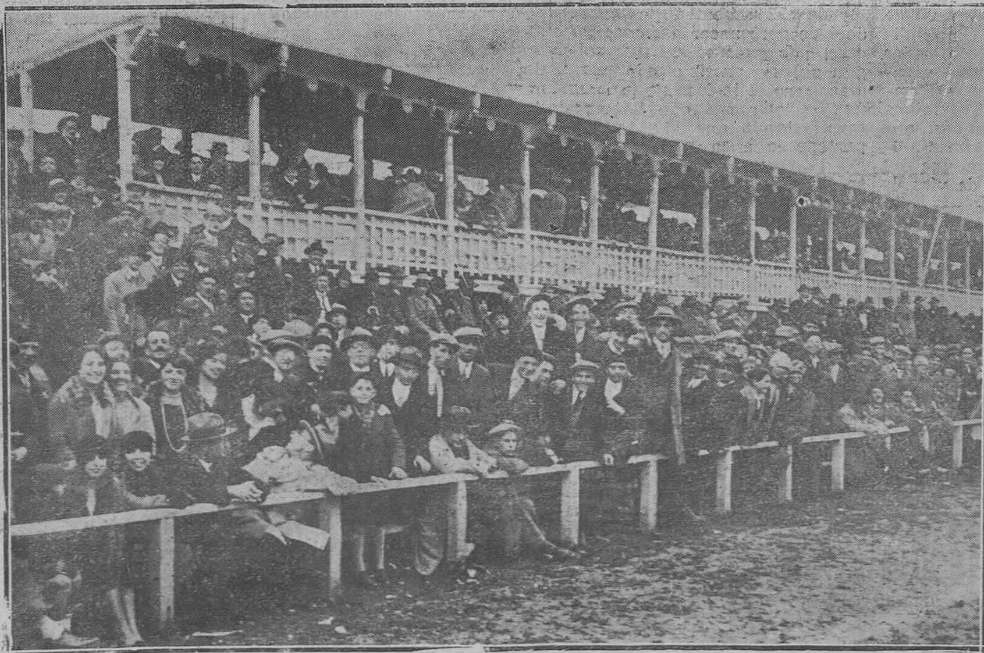
OVIEDO.-Un aspecto de la tribuna de preferencia durante el partido del domingo.

—¿Y no hay quién le facilite trabajo?—le pregunté.