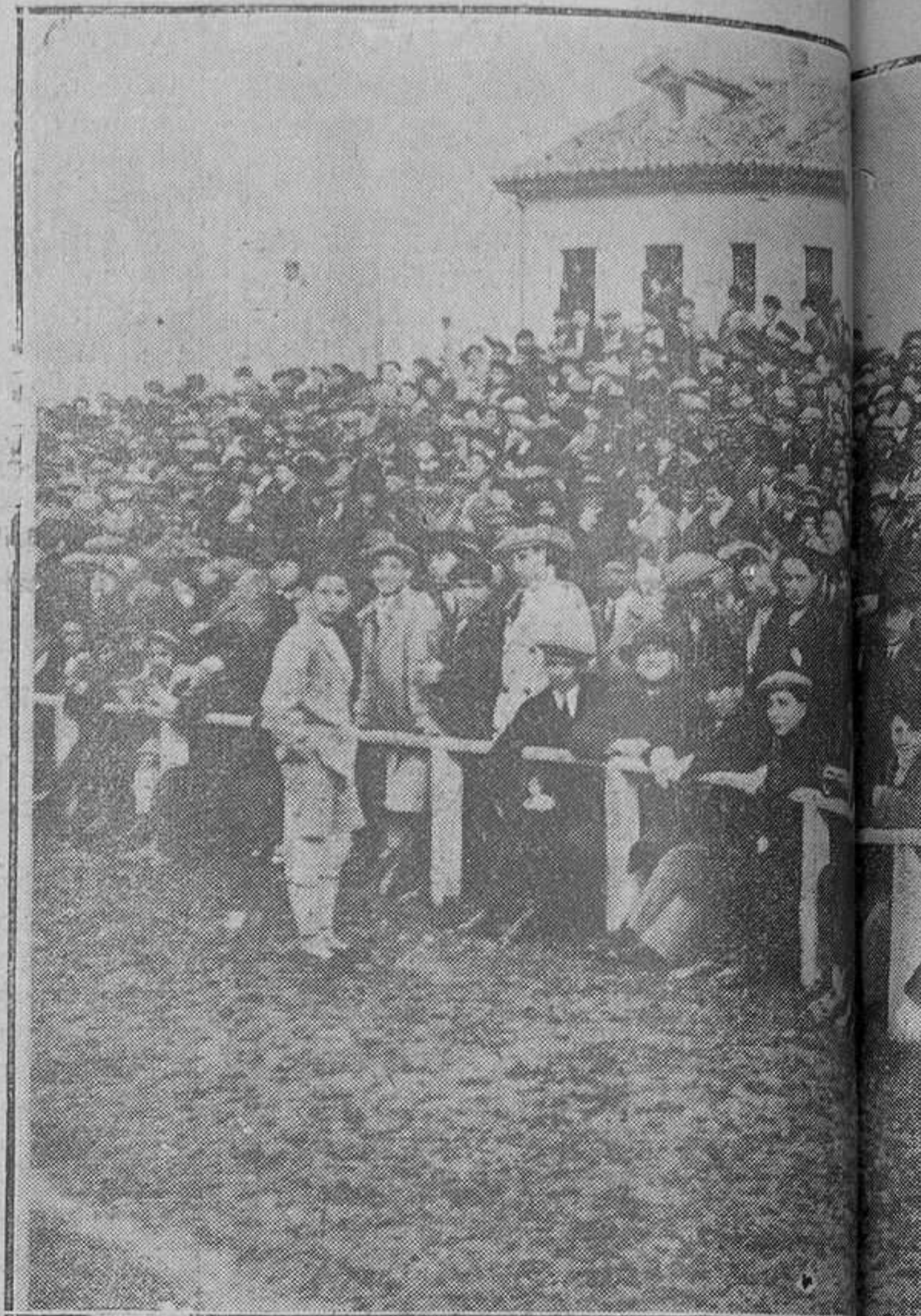
OVIEDO.-Un aspecto de la gran plaza.