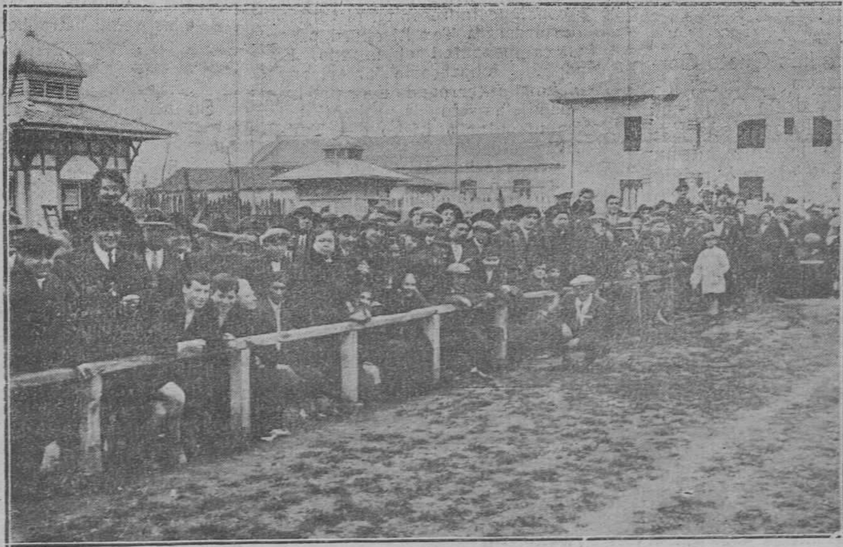
Un aspecto del público en el partido del domingo.