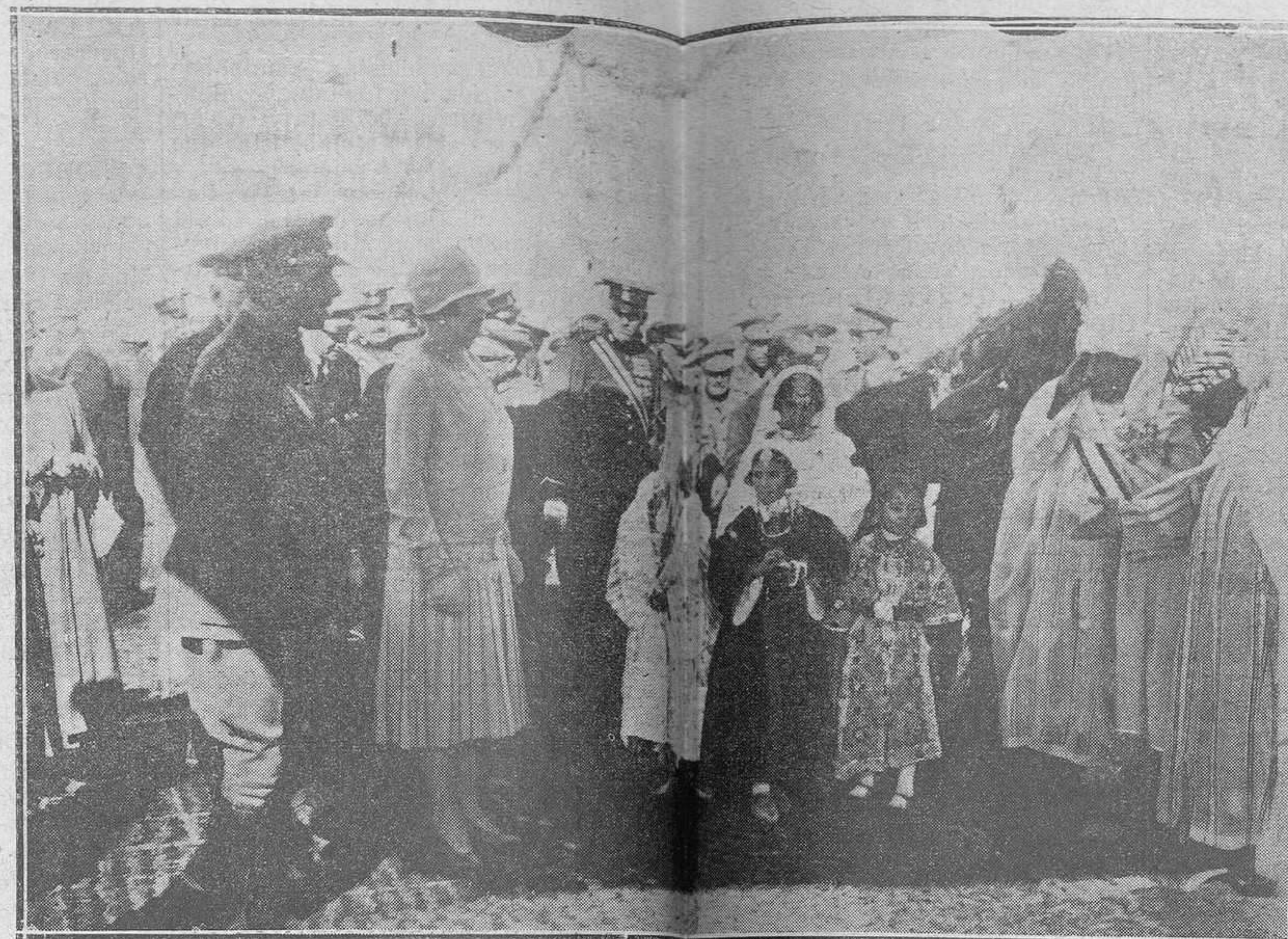
Zeluán: Del viaje de los Reyes a Marruecos. Niños, hijos de los amigos, son presentados a SS. MM.