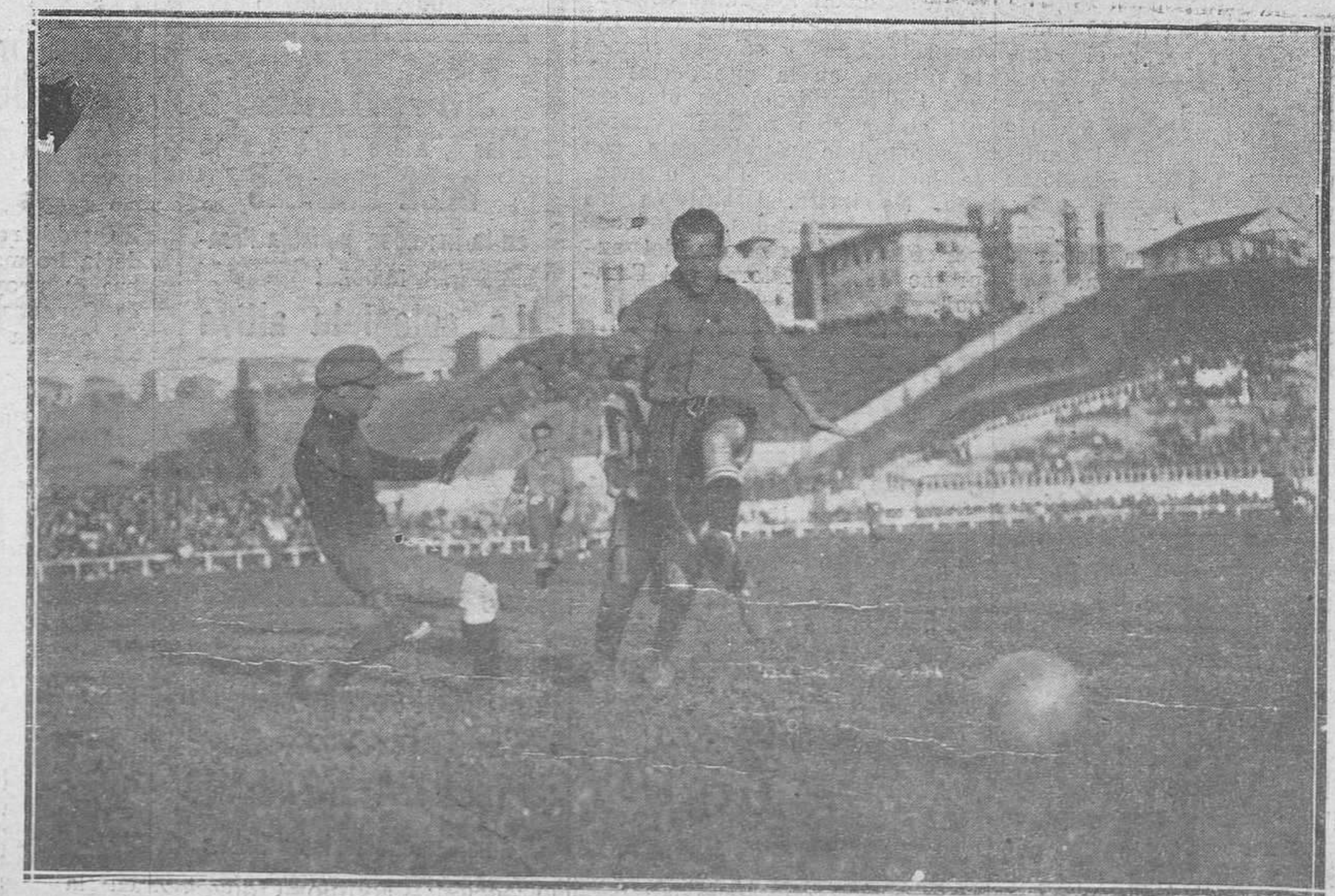
MADRID.-Del partido de foot-ball jugado entre el Sporting de Gijón y el Athletic; empataron a tres tantos.