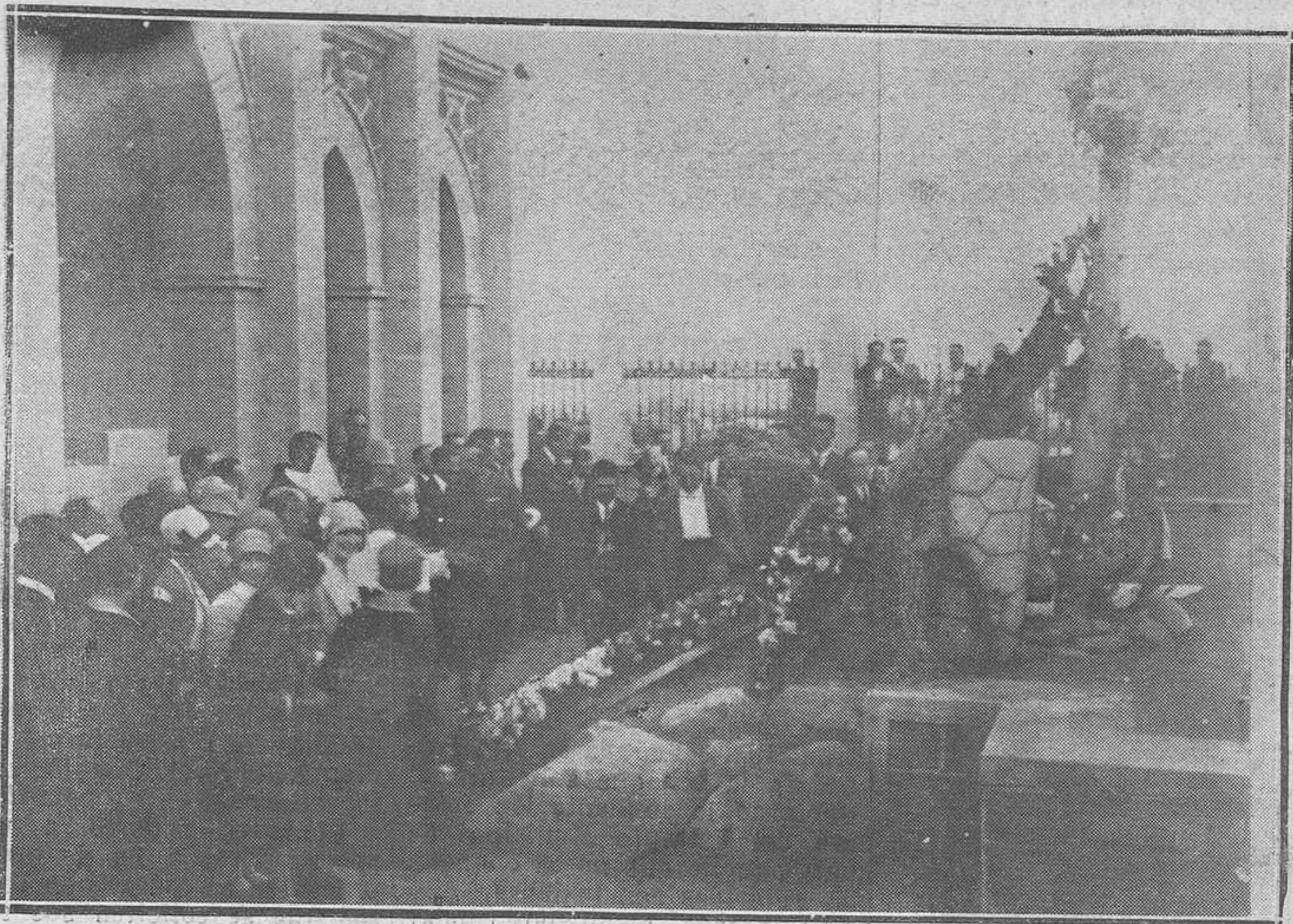
Monte Arruit: Del viaje de los Reyes a Marruecos.—Sus Majestades ante la tumba en que descansan los restos de los que murieron por la Patria.

Esto nos sugiere una consideración: Antes de plantearse este nuevo conflicto, y cuando los obreros mineros perdían se-