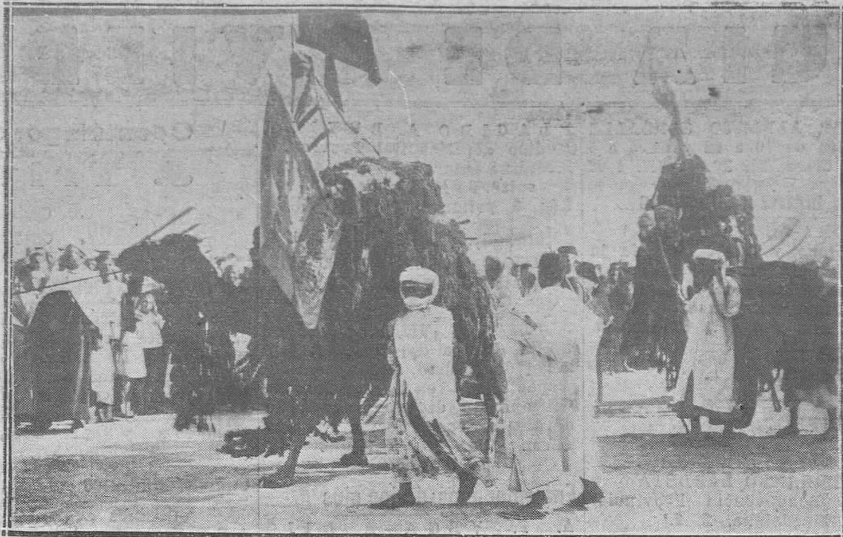
Zeluán: Del viaje de los Reyes a Marruecos.-Llevando regalos a Sus Majestades.

Alguien corrió la noticia de que el autor de las mismas era el señor García. El lo desmiente. Y no debió serlo, porque el señor García escribe bien, y lo demuestran las cartas que nos remite a nosotros. De todos modos, el asunto es baladí, y sólo es de lamentar por quienes se dedican a propalar lo que se les comunica en secreto, faltando así a quien con la mejor buena voluntad escribió las cuartillas, y a nosotros, que con la mejor buena fe le pedimos su reforma.