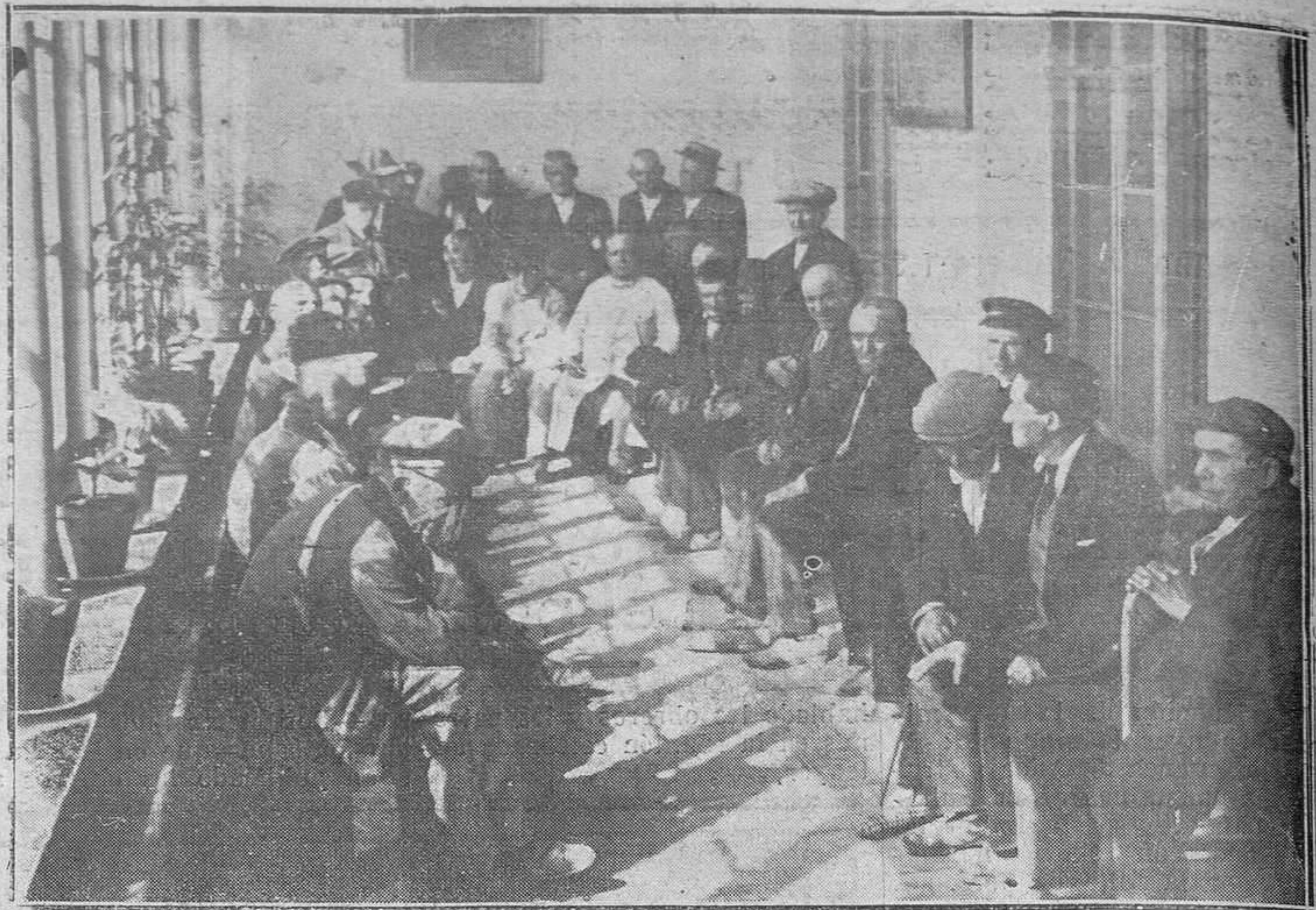
Oviedo: El partid benéfico.-Los ancianitos de las Hermanitas de los Pobres, a cuyo beneficio se celebrará un interesante partido en Teatinos.