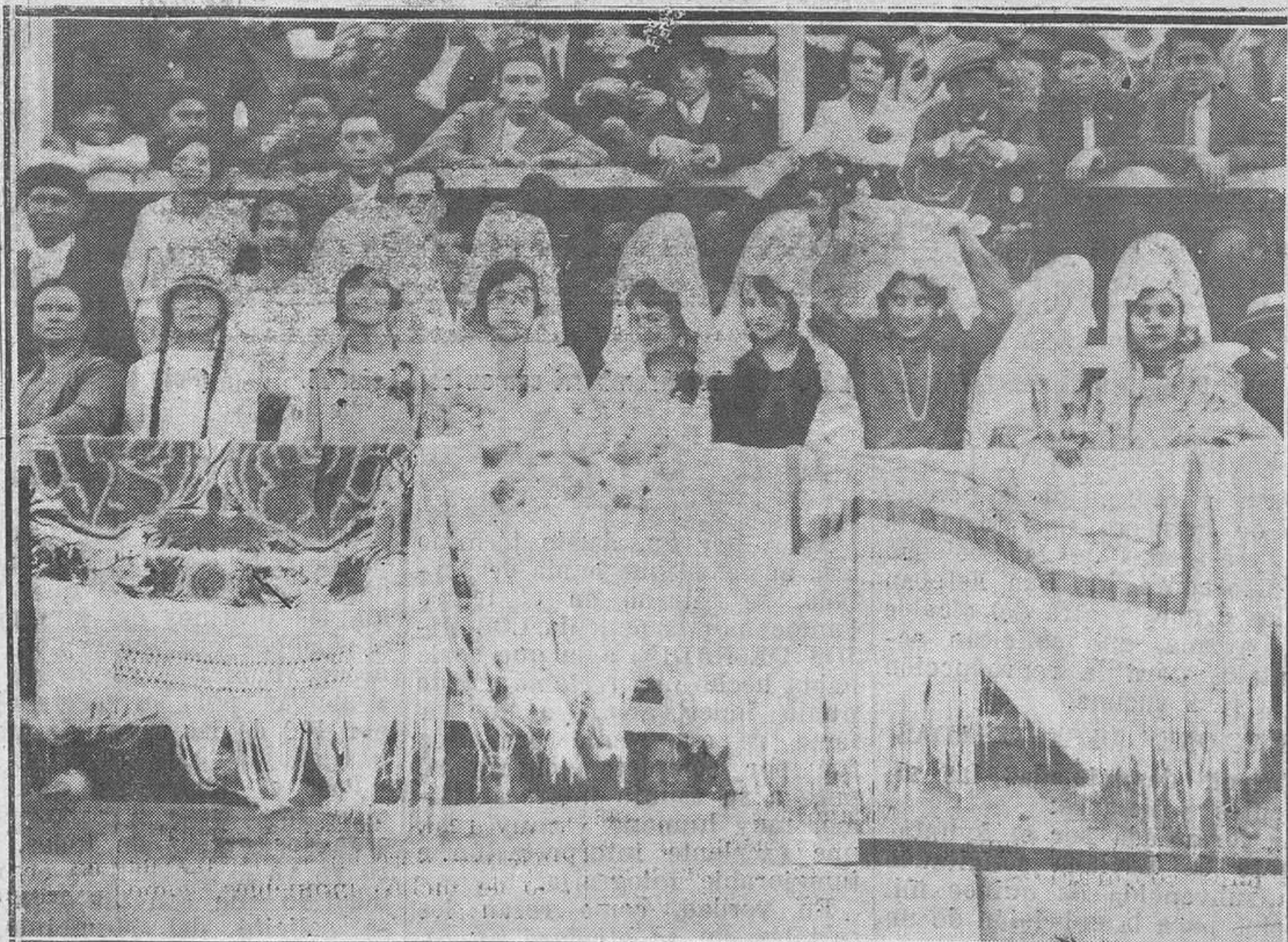
CHAMARTIN DE LA ROSA.-De la becerrada benéfica celebrada con motivo de las fiestas de S. Miguel. La presidencia de la fiesta taurina.

El ministro de Fomento ha dispuesto, como consecuencia de esta entrevista, que el Comité Ejecutivo del Consejo Nacional del Combustible sólido estudie la situación de las disposiciones vigentes con relación a la crisis planteada y propongan al Gobierno en plazo breve las modificaciones que proceda, entendiéndose que estas medidas tendrán carácter general y serán aplicables desde la implantación de la nueva jornada."