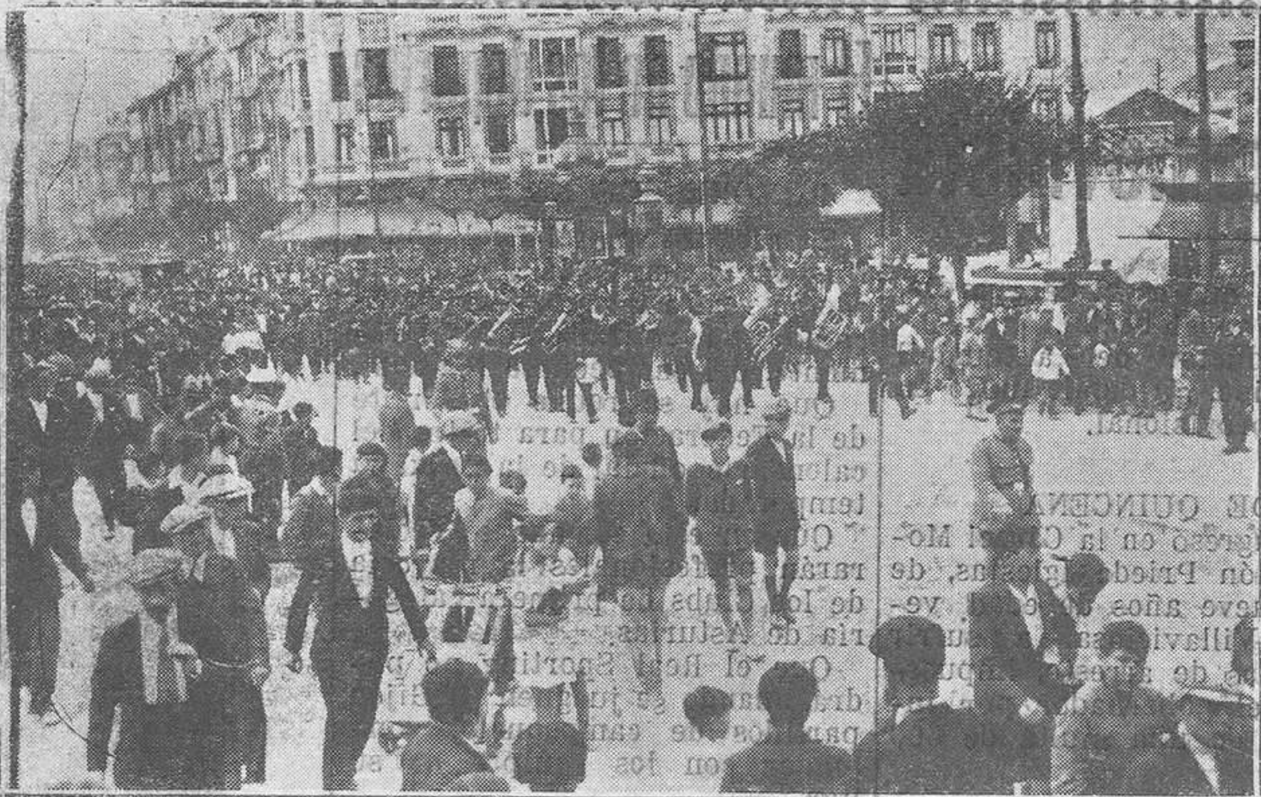
OVIEDO.-El público presenciando el paso de la banda municipal de Santander.