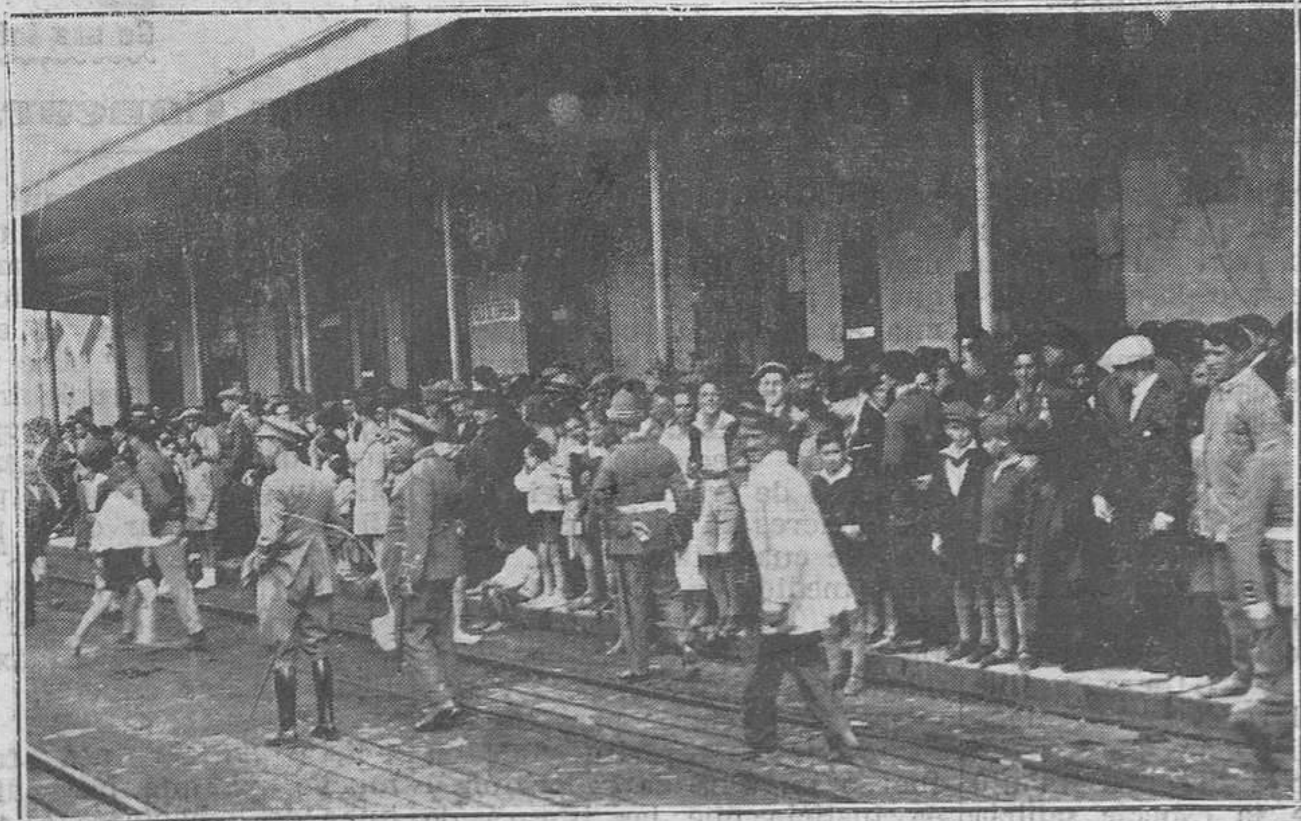
OVIEDO.-Un aspecto del andén de la estación de los Económicos, momentos antes de la llegada del tren, donde era esparada la banda municipal de Santander.

Magdalena, número 26, 1.º izquierda, (antiguo Gobierno Militar)