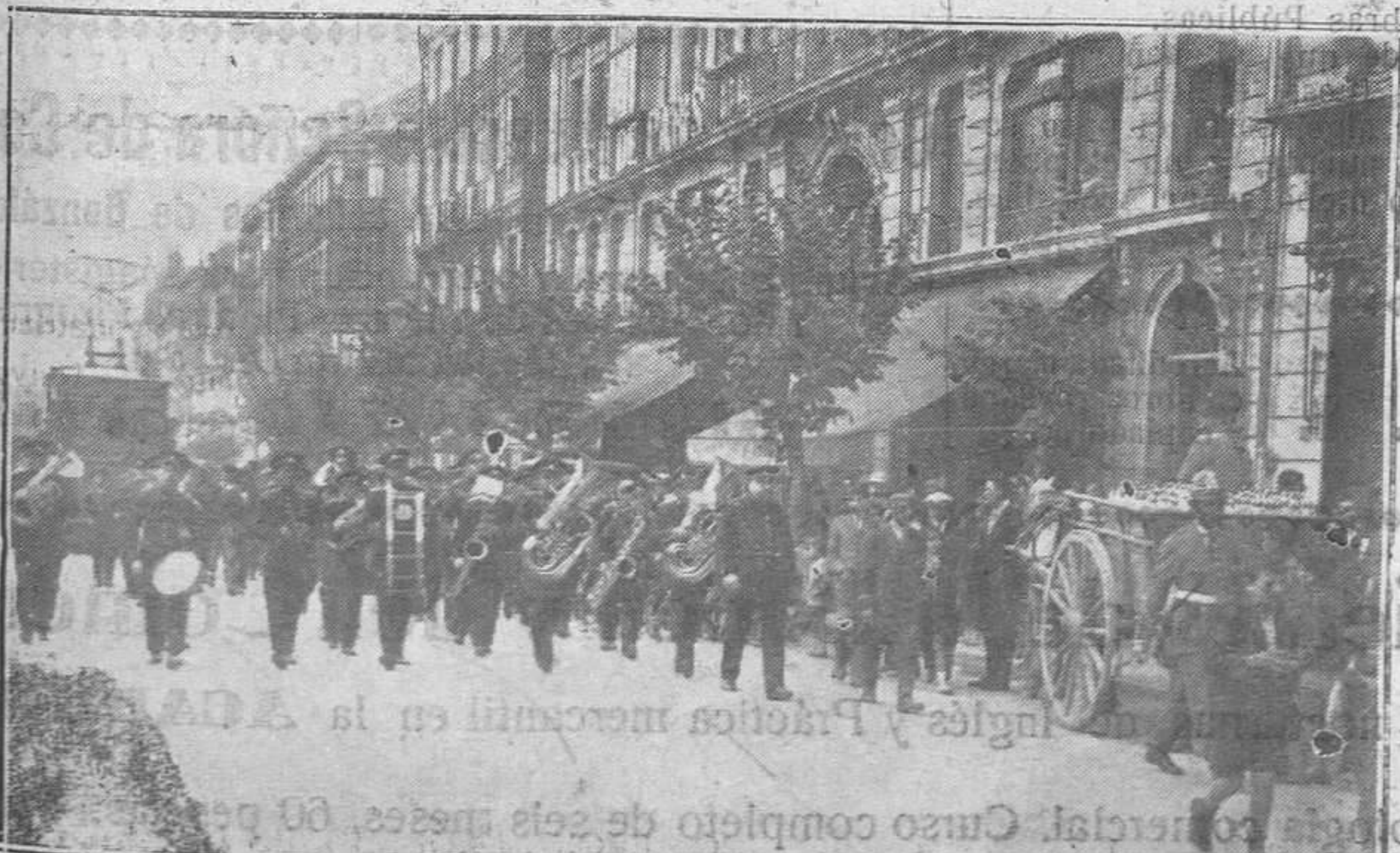
OVIEDO.-La banda municipal de Santander a su paso por la calle de Uria.

galanas, son espejo clarísimo los cantares que reza con fervor verdadero "El Sabor de la Tierra..."