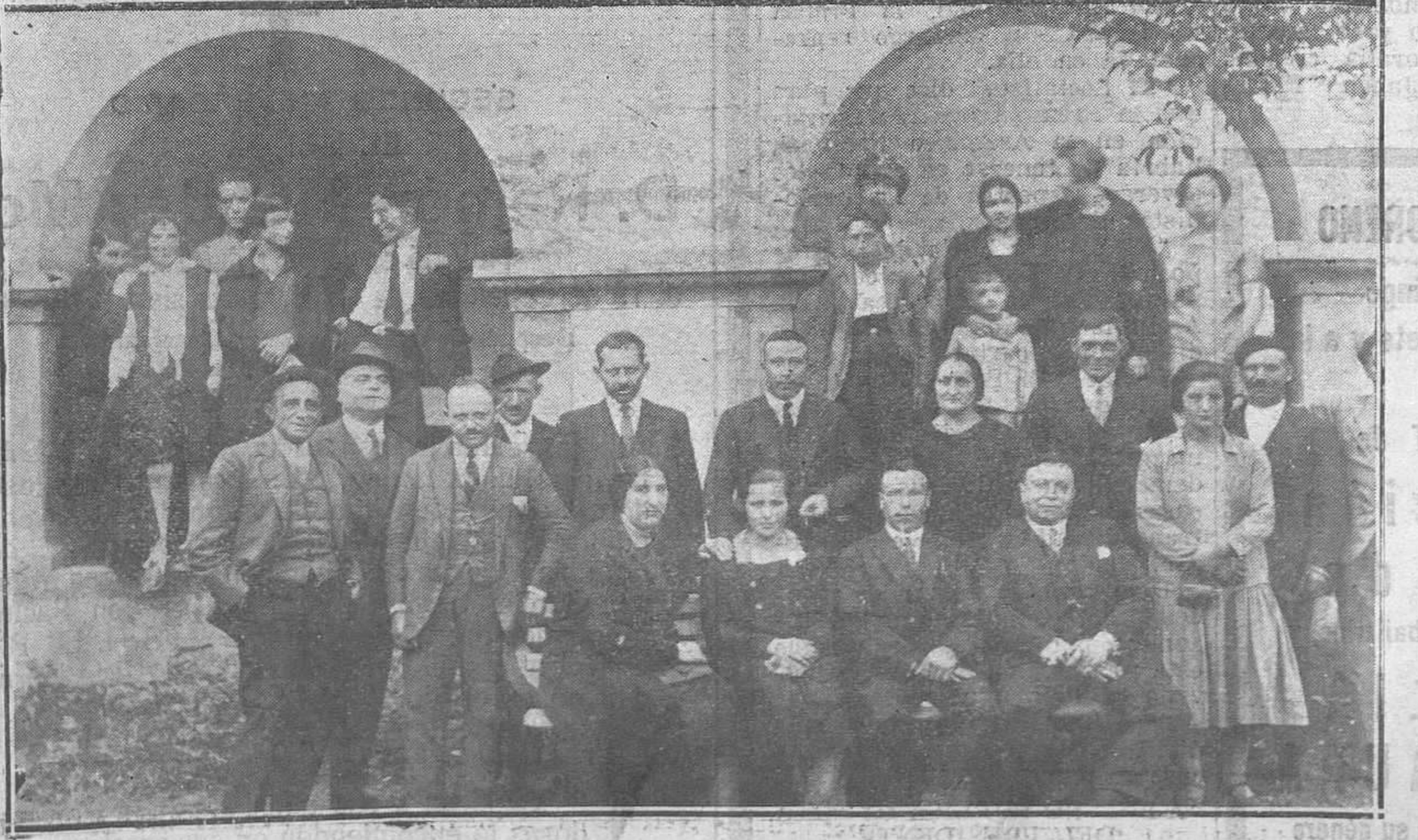
MALLEZA.—Una fiesta de serranos