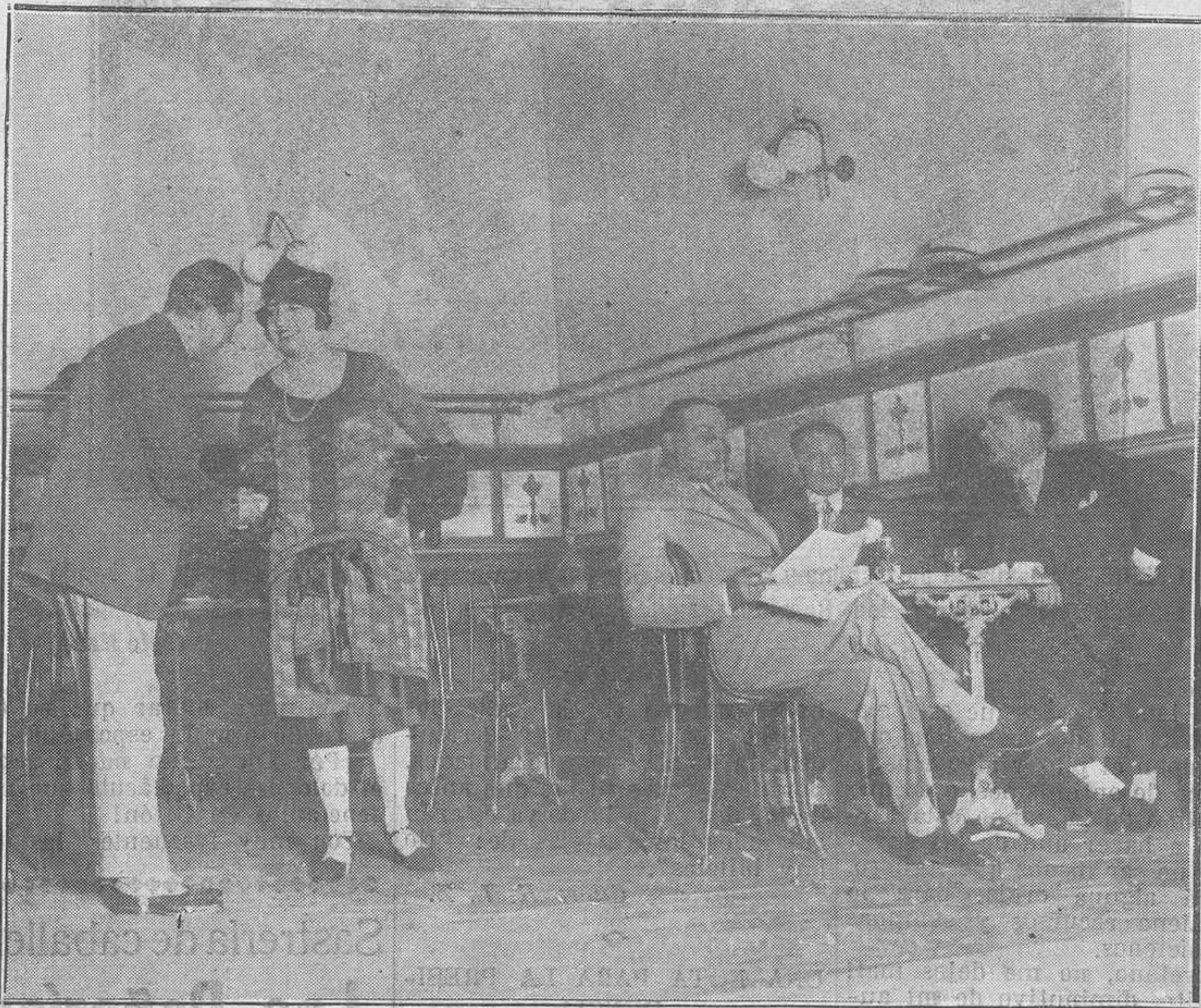
MADRID.-Una escena de la nueva obra de Fernández del Villar, "Don Elemento", que se estrenó para inauguración de temporada del teatro Alkazar.

¡Quiera Dios que ese éxodo español no se traduzca para Cuba en incurable atrofia muscular!"