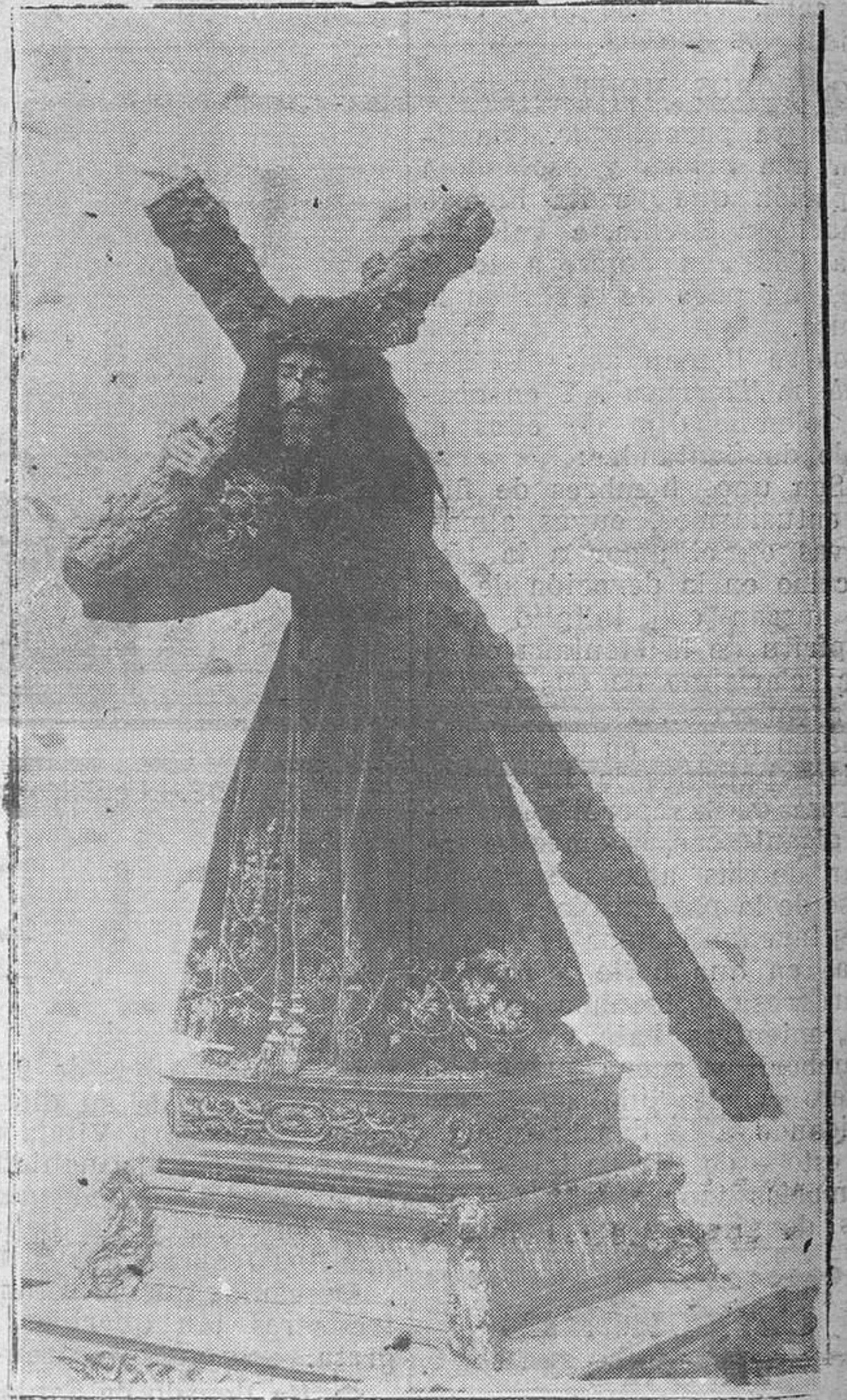
NOREÑA.-Milagrosa imagen del Ecce-Homo de Noreña, cuyas tradicionales fiestas se celebran estos días.

Acreditada marca en libros rayados y copiadore.