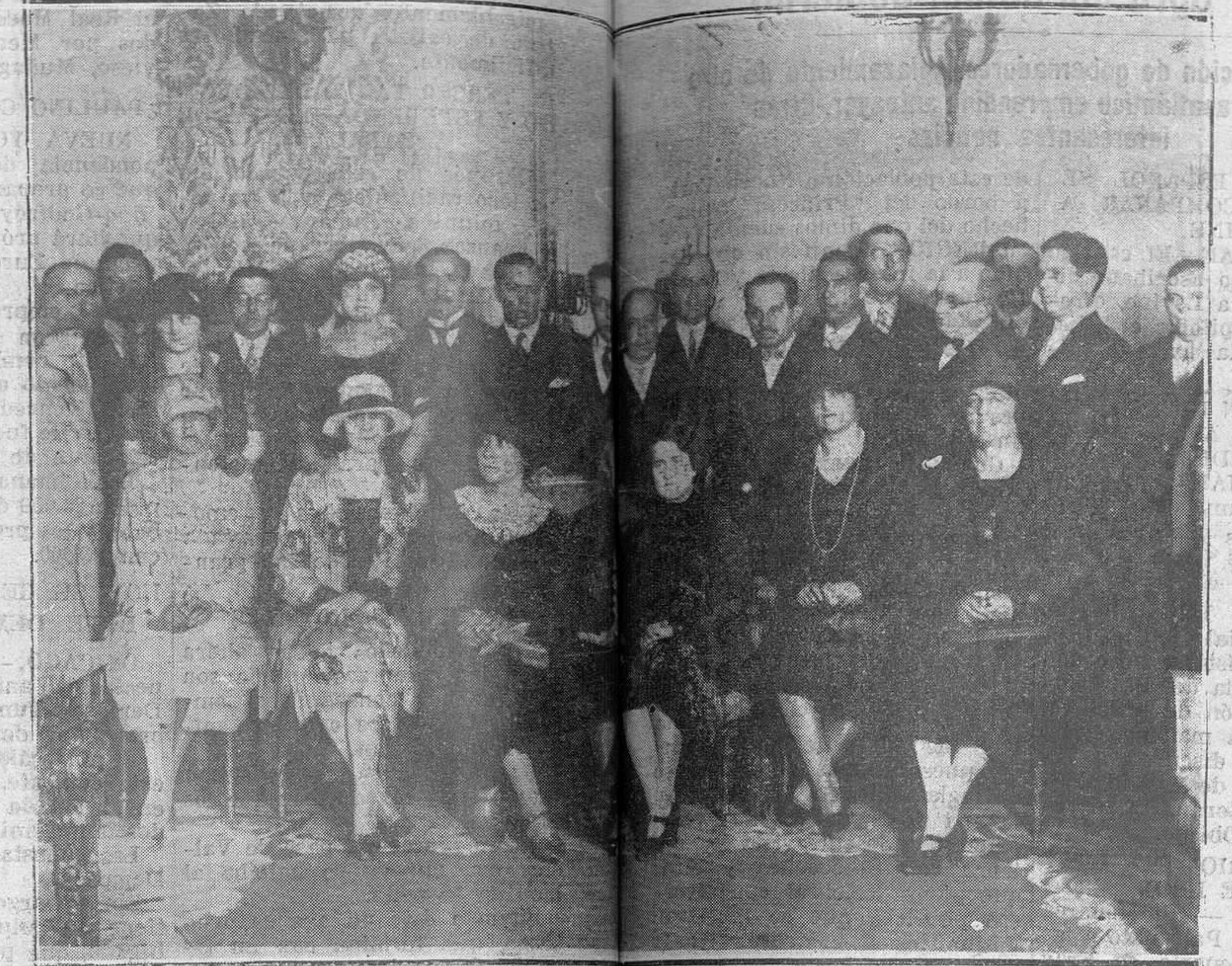
El ministro de Méjico, rodeado de distinguidas personas de la colonia mejicana de Madrid, que han asistido a la recepción celebrada en la Legación de su país con motivo de la celebración de la Fiesta Nacional mejicana.

Al fin, el Santísimo Sacramento, llega frente a él.