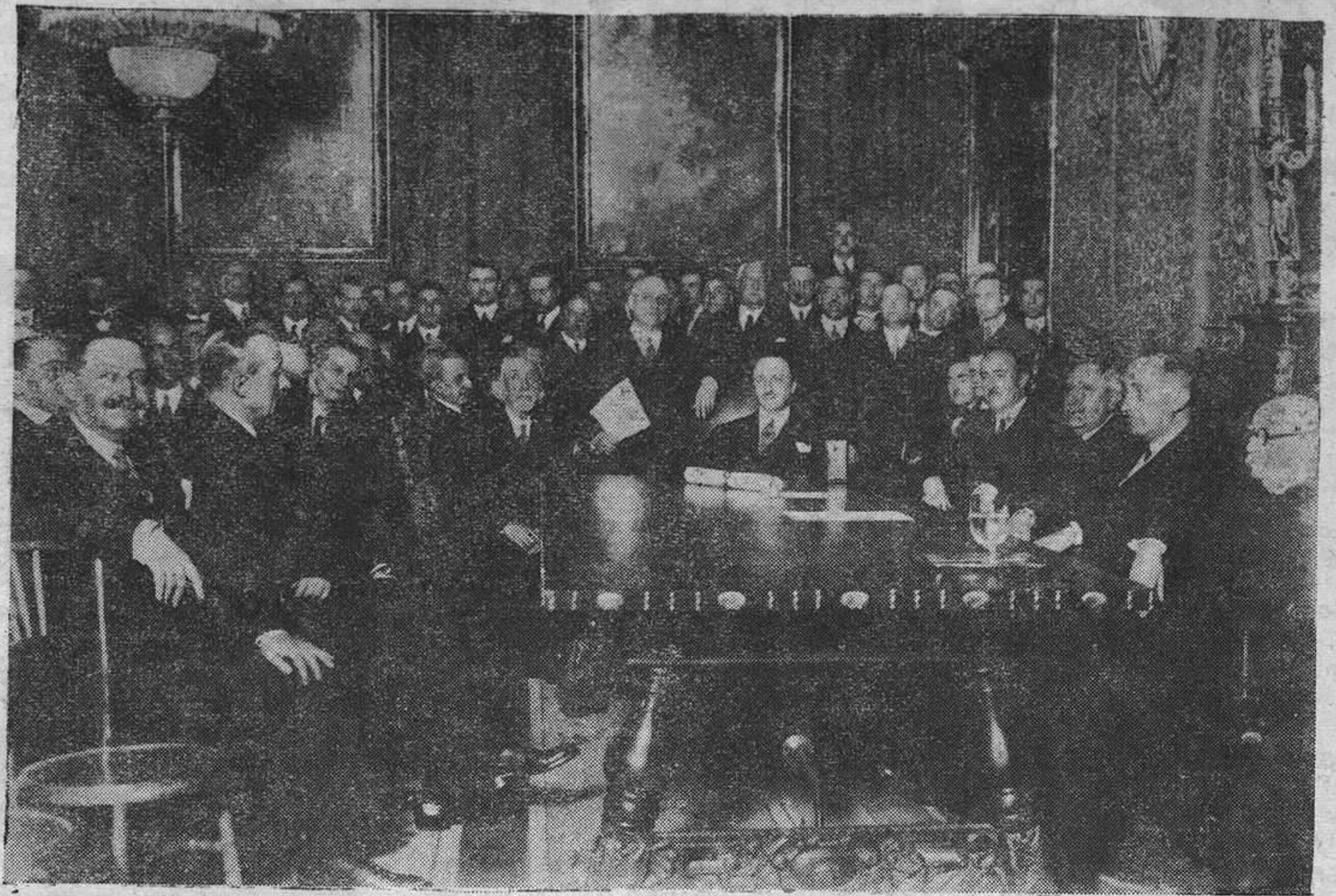
Un salón del Ministerio de Hacienda durante el acto de la entrega de la Medalla de Oro del Trabajo al Cuerpo de Abogados del Estado, acto que fué presidido por los ministros de Hacienda y Trabajo

Logroño.— El Juzgado de Nájera reclamó a los presos políticos que están por las distintas cárceles del partido para acelerar la posibilidad de una libertad provisional.