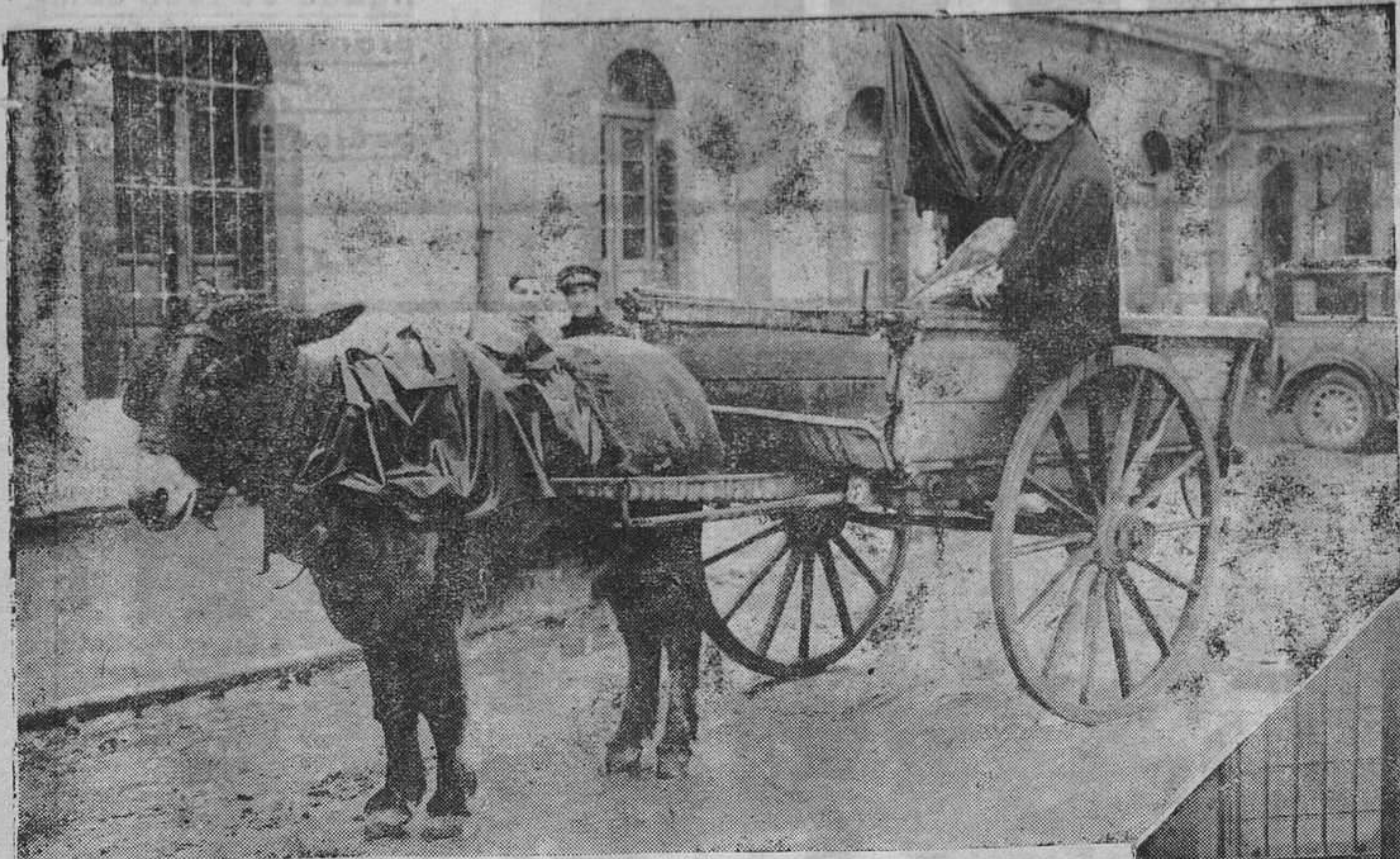
Los sesenta y siete años de "La Bruja", no temen el frío ni la nieve de los crudos inviernos

Todos los días y en las mismas horas, la placa sensible de la retina puede recoger idéntica diapositiva.