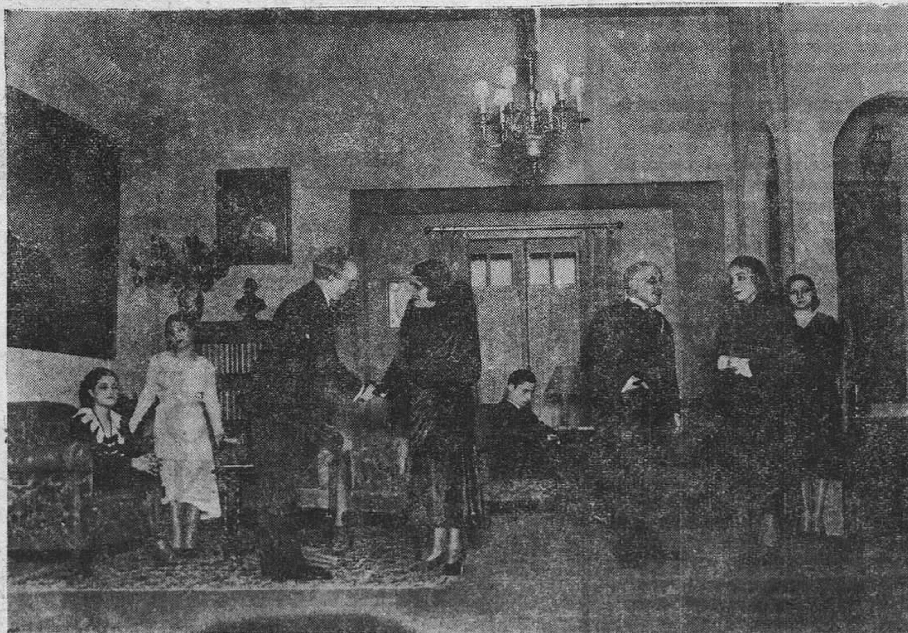
Una escena de la nueva obra de Benavente, "De muy buena familia", estrenada en el "Muñoz Seca", por la Xirgu