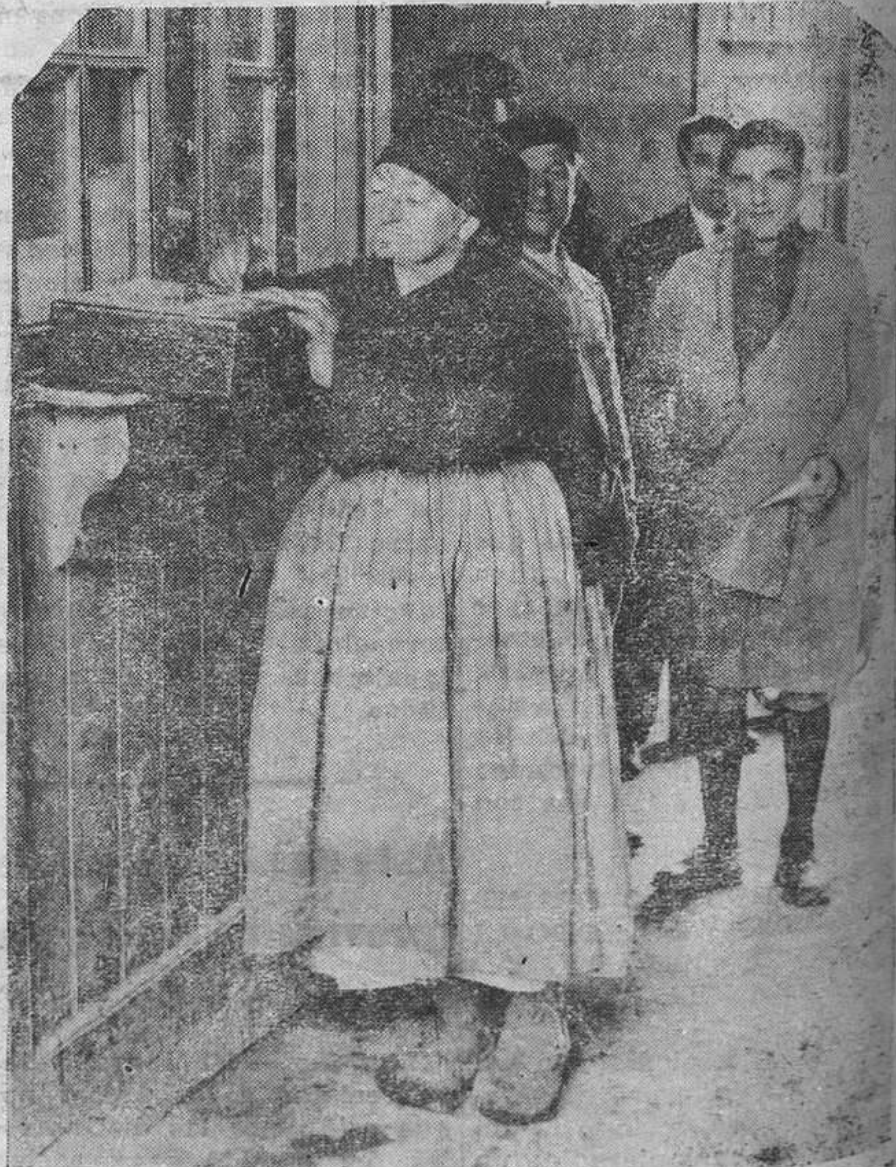
Con el gesto de quien realiza un gran esfuerzo, "La Bruja" dibuja su firma

—¡Ah! Si llegar llega a todo hubieren saltau los guiteyos.