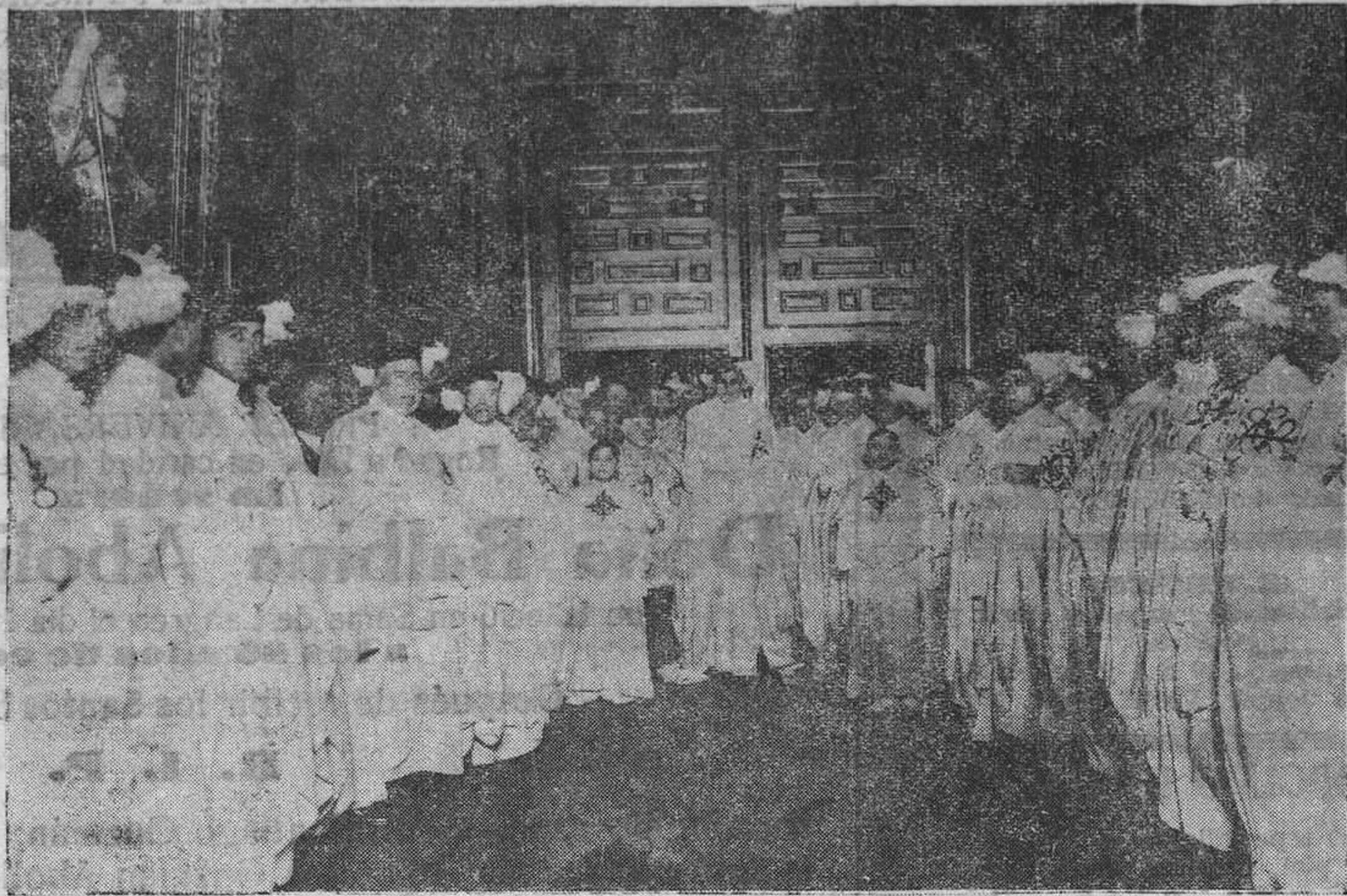
El Capítulo de la Orden de Calatrava, rodeando al Infante don Jaime, después de haberle sido dada posesión de la dignidad de Comendador Mayor de Castilla