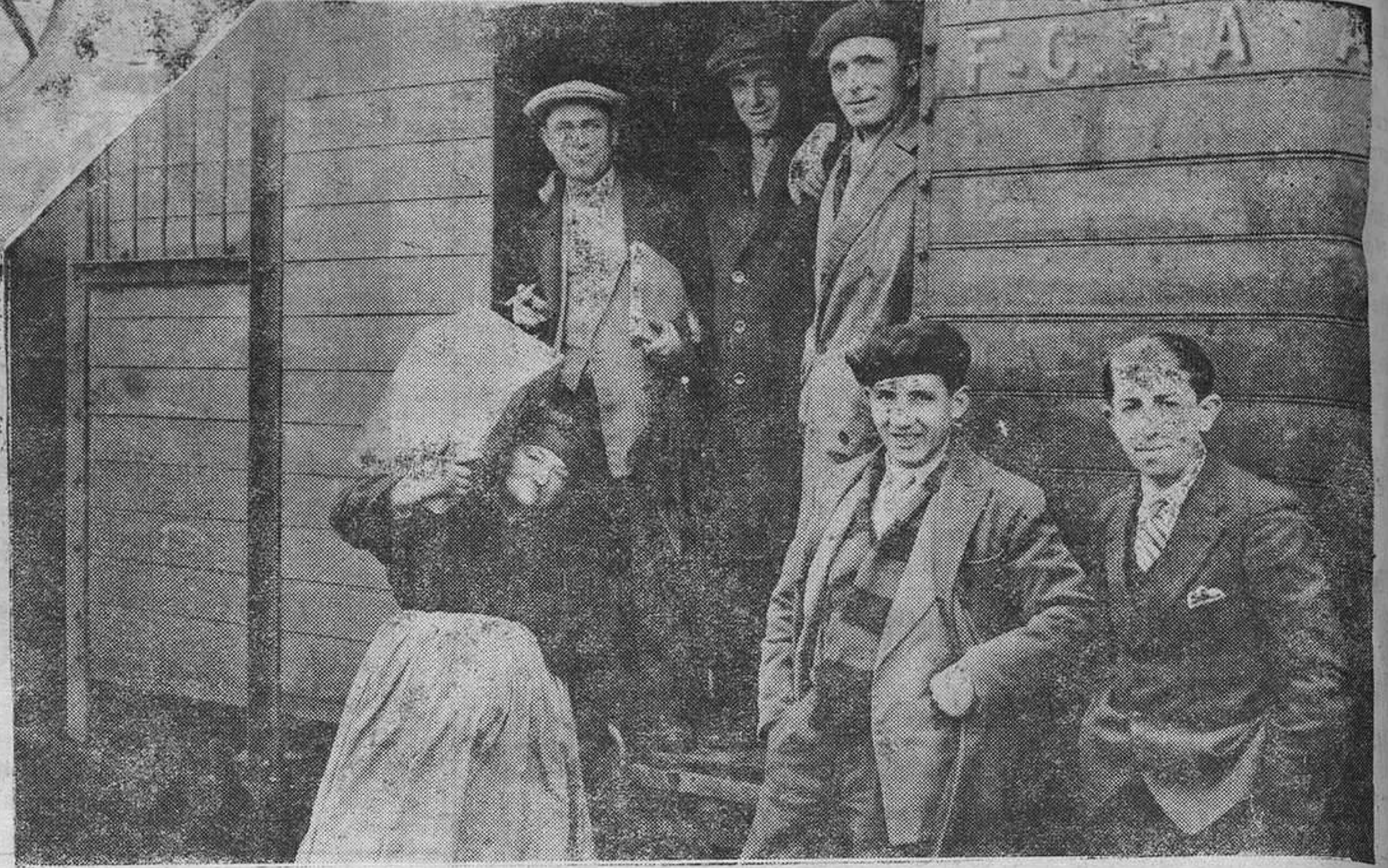
¿"Quier" que me ponga apurriéndoi el talón a ésti?"

—Vamos, "Bruja" que algún ahorrito ya tendrá.