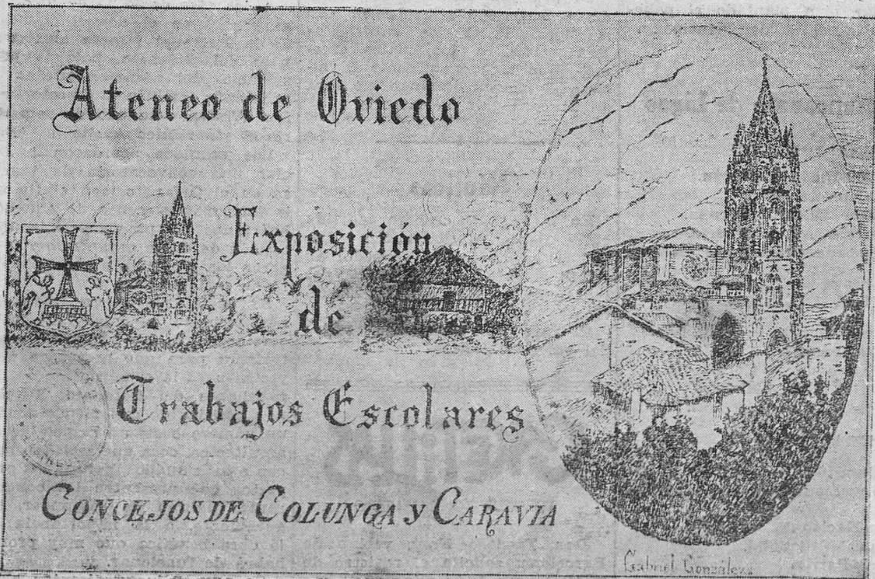
Un hermoso dibujo a pluma, debido a un pequeño participante en la Exposición escolar que se ha inaugurado en el Ateneo de Oviedo