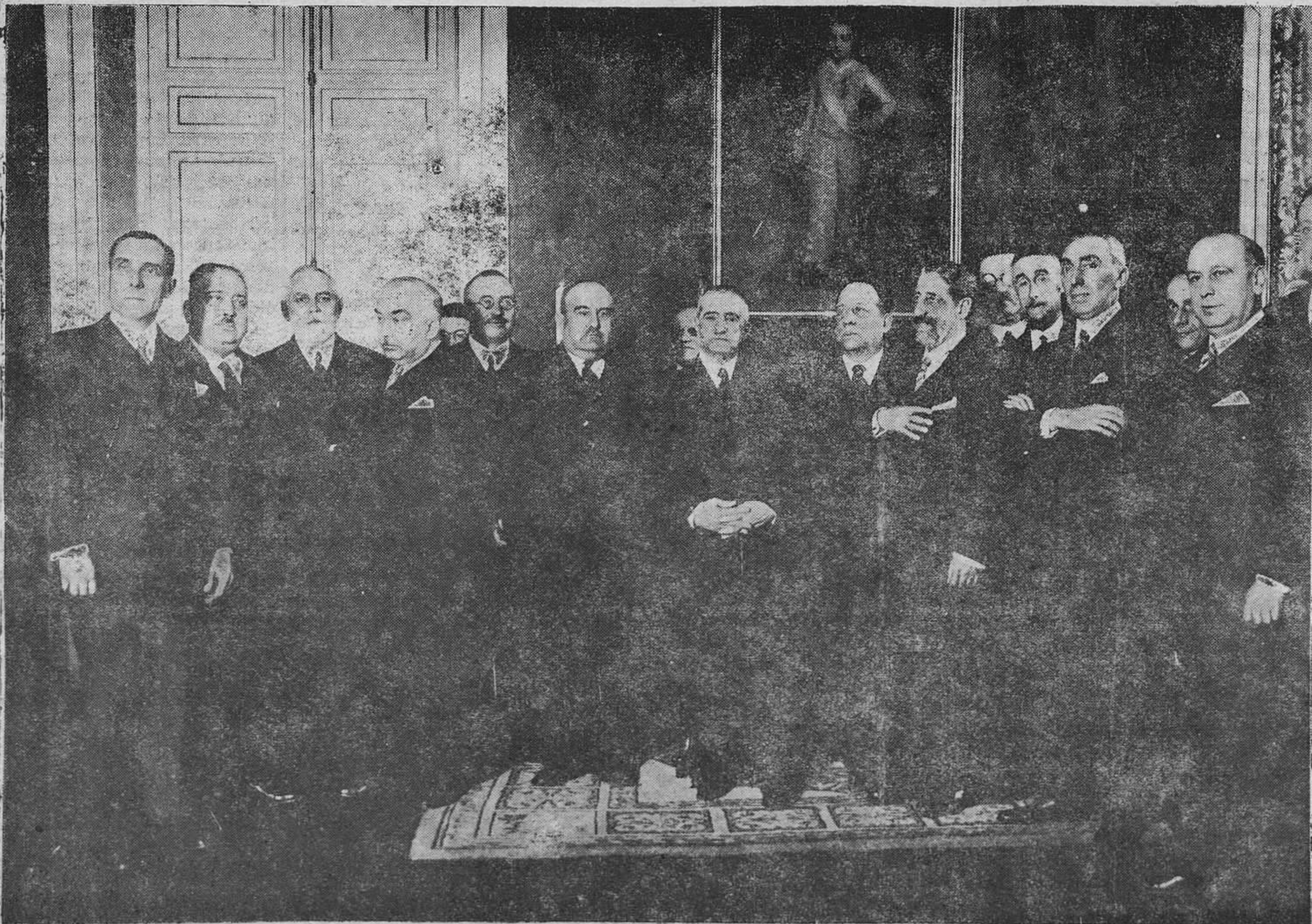
El almirante Aznar con los nuevos Gobernadores civiles que se encuentran actualmente en Madrid, a los que ha recibido en el palacio de la Presidencia