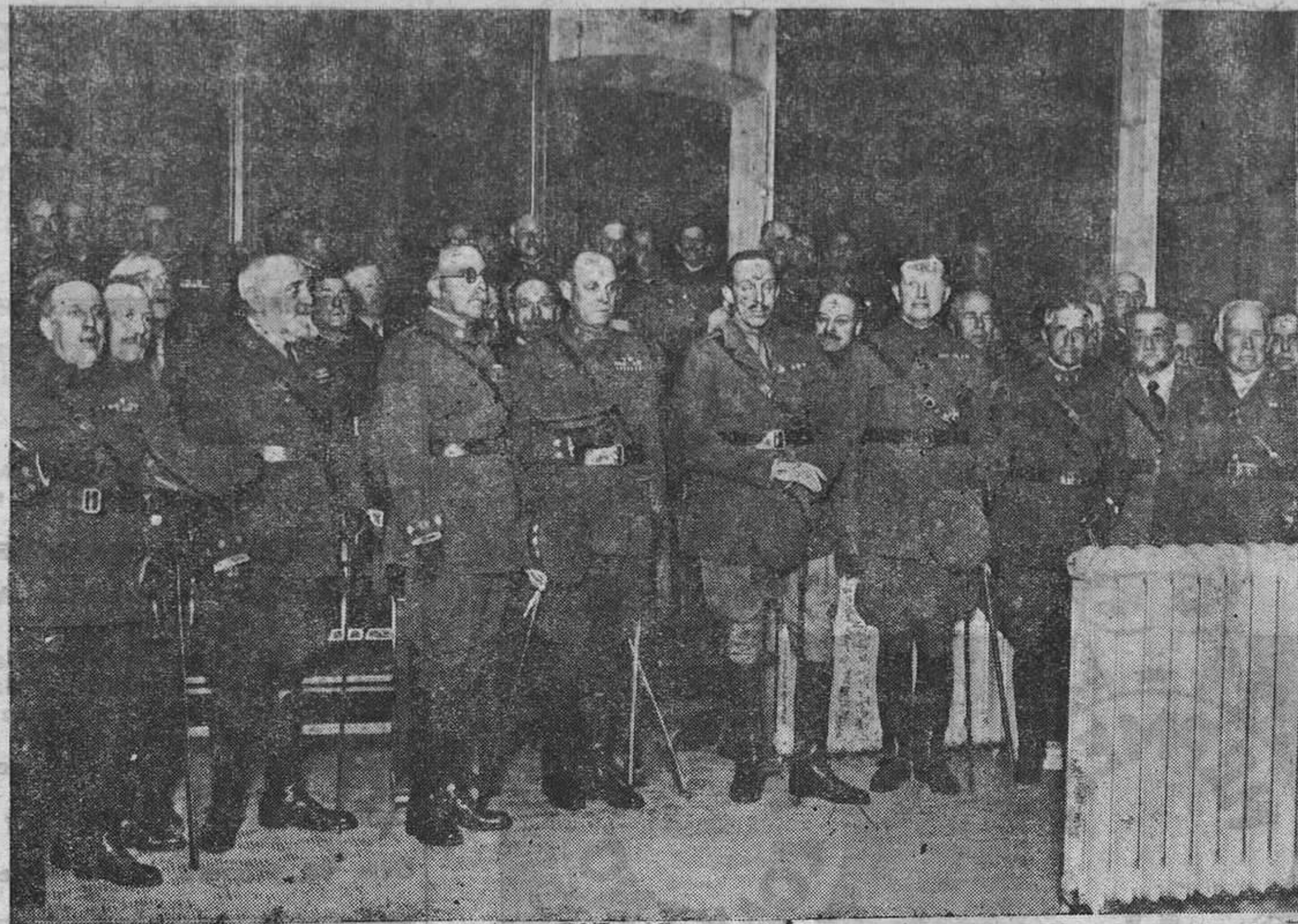
S. M. el Rey don Alfonso, en el Museo de Ingenieros, en donde ha presidido la sesión de clausura del actual "curso de coroneles"

—¿Está aquí mi marido? —Hombre, todavía no; pero si usted quiere esperar, suponemos que no tardará... Era un "incondicional".