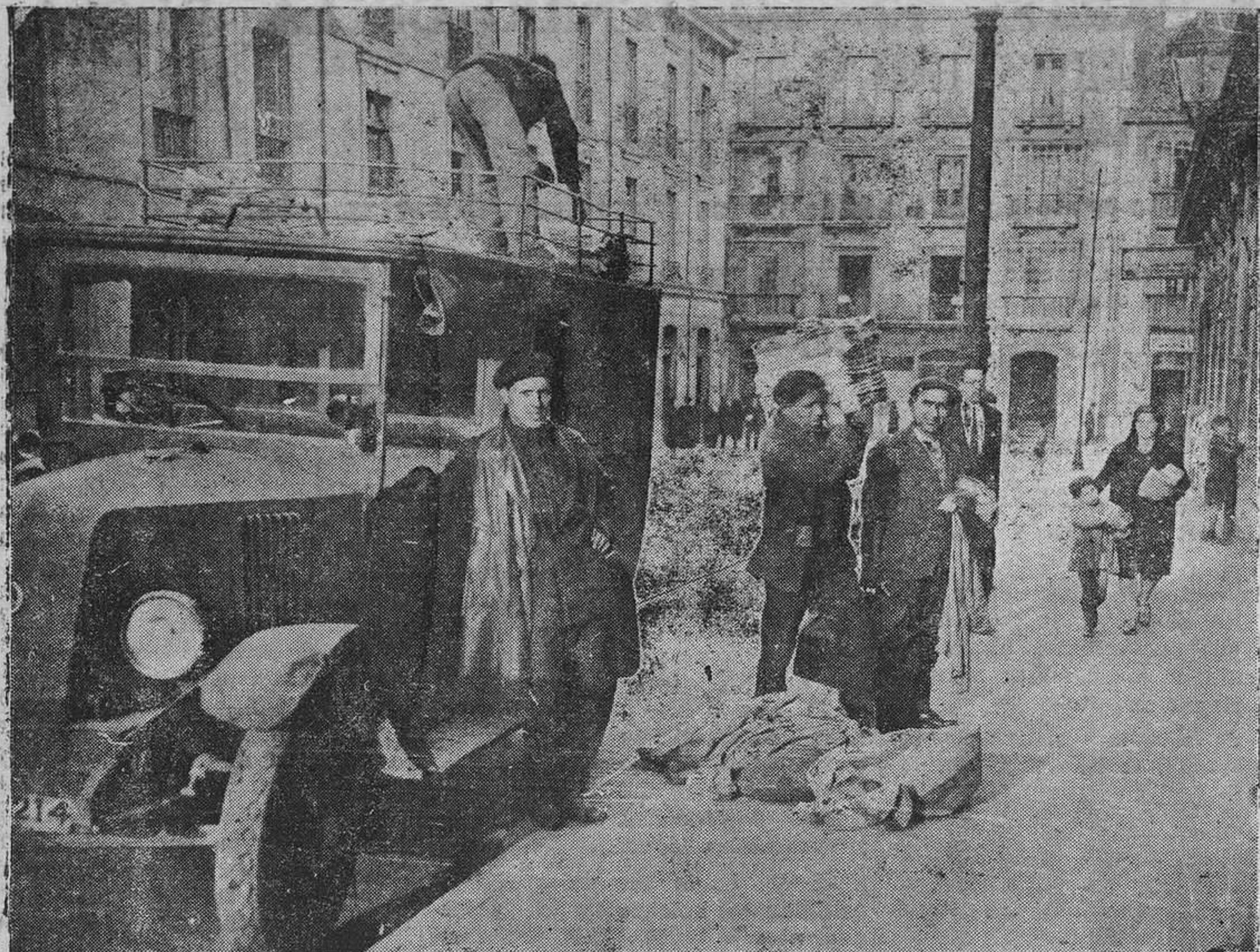
El simpático chofer, que se muestra incansable guiando el "auto" en sus múltiples viajes, sonríe al verse fuera del "vaquet", ansioso de estirar las piernas. Paquetes y sacos de cartas pasan a las pesas en espera de ser clasificados

Movimiento de cartas. - No existe entusiasmo por trasladarse al nuevo local. Expediciones. - Necesidad de buzones clasificadores. - Carencia de personal. - Las estafetas sucursales prestarían grandes servicios