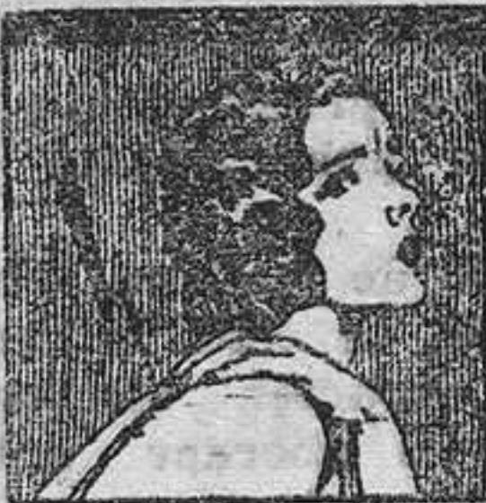
quita esos dolores