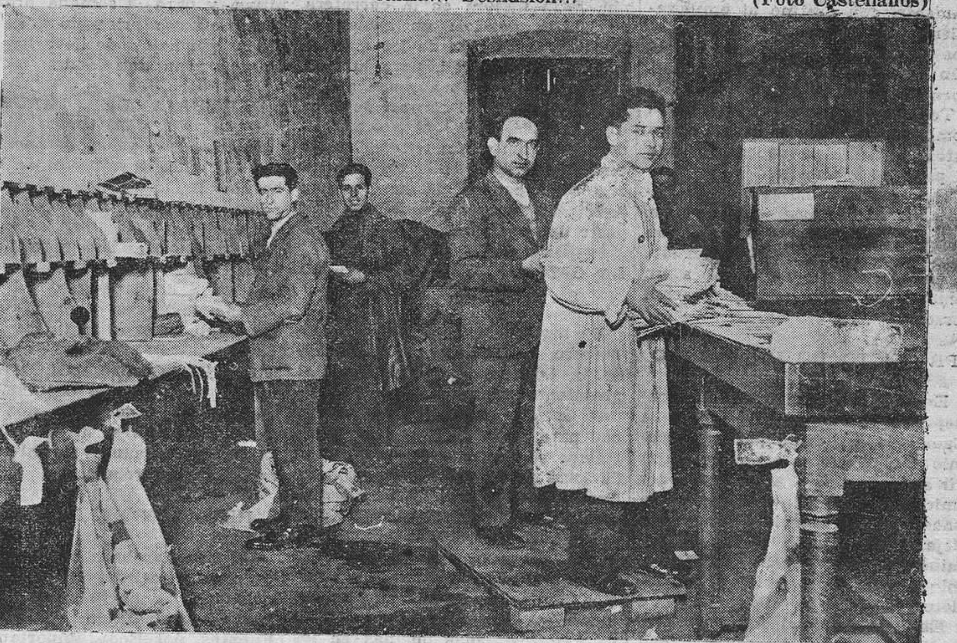
Pasado el momento de apuro, ya los que clasifican la correspondencia, pueden llevar su labor más lentamente, en espera de que llegue una nueva expedición