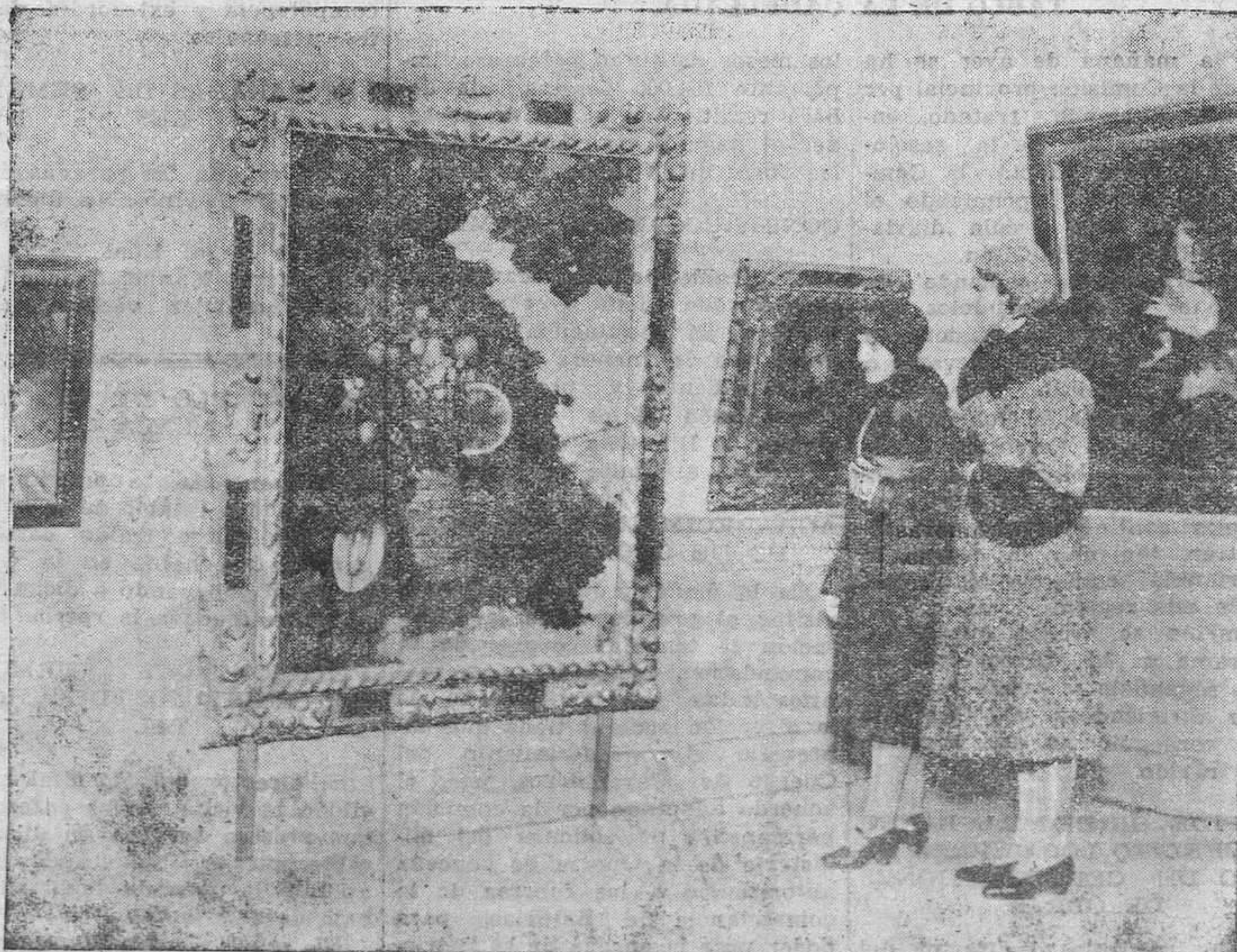
MADRID. — En los salones de la Sociedad de Amigos del Arte, se ha inaugurado la exposición de cuadros originales del notable pintor valenciano Mongrell