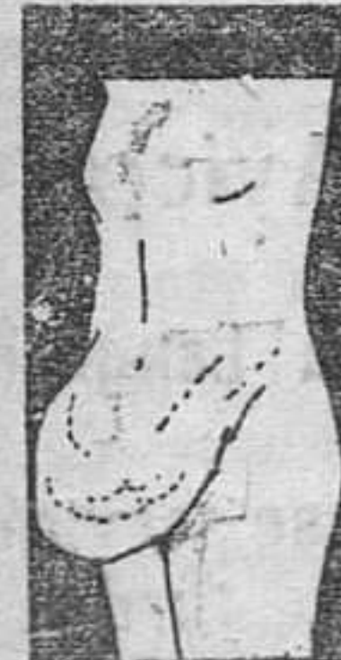
MAL DE POTT