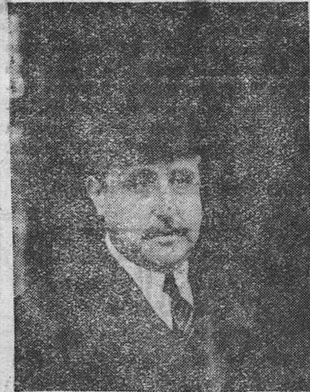
El duque de Maura ha acentuado el relieve político de su figura con motivo de la creación del partido centrista