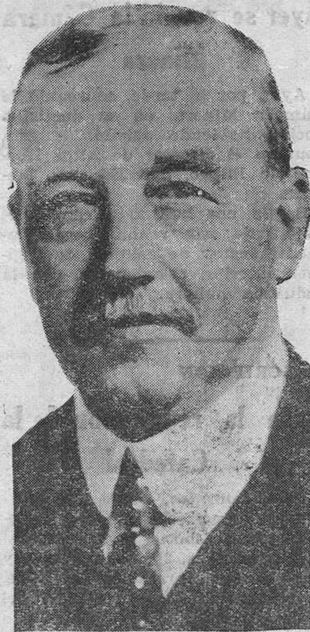
Henderson, ministro inglés que, después de ponerse de acuerdo con Italia acerca de la cuestión del desarme, propondrá la aprobación de él al Gobierno francés

A los novios y sus familiares respectivos damos nuestra más cordial enhorabuena.