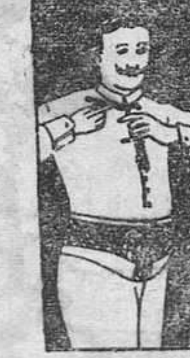
FAJA DE CABALLERO

Visitenos en: Gijón, el 4 marzo, Hotel Malet; Avilés, 5, Hotel la Iberia; Oviedo, 6, Hotel Francés; Santander, 8, Hotel Europa.