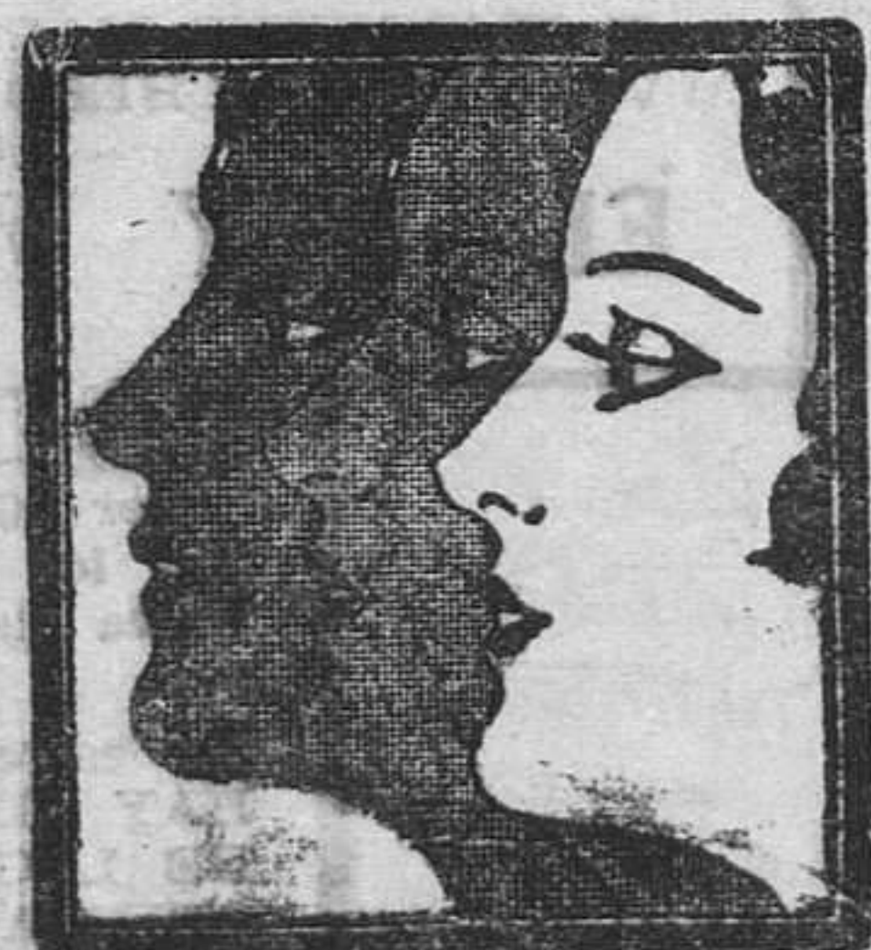
Durante el sueño esta cera, conocida bajo el nombre de Cera Aseptica

Una nueva cera, extraída de flores, asombra a los especialistas de belleza. Hace desaparecer las pecas y las imperfecciones de la piel. Proporciona una tez tan rosada y blanca como la de un niño.