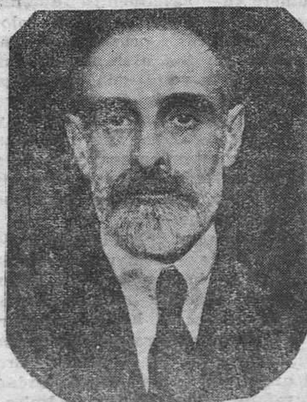
En estos últimos meses toda la actualidad política nacional lleva en cabeza el guiñón de la personalidad relevante de Cambó, el sagaz político catalán que dirige el nuevo poderoso sector de los centristas

Se acuerda, por fin, fijar la fecha de las elecciones para la designación de los cargos del Colegio para el día 15 del mes actual.