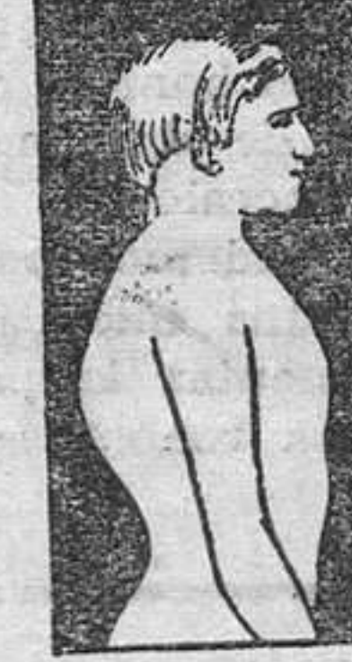
MAL DE POTT