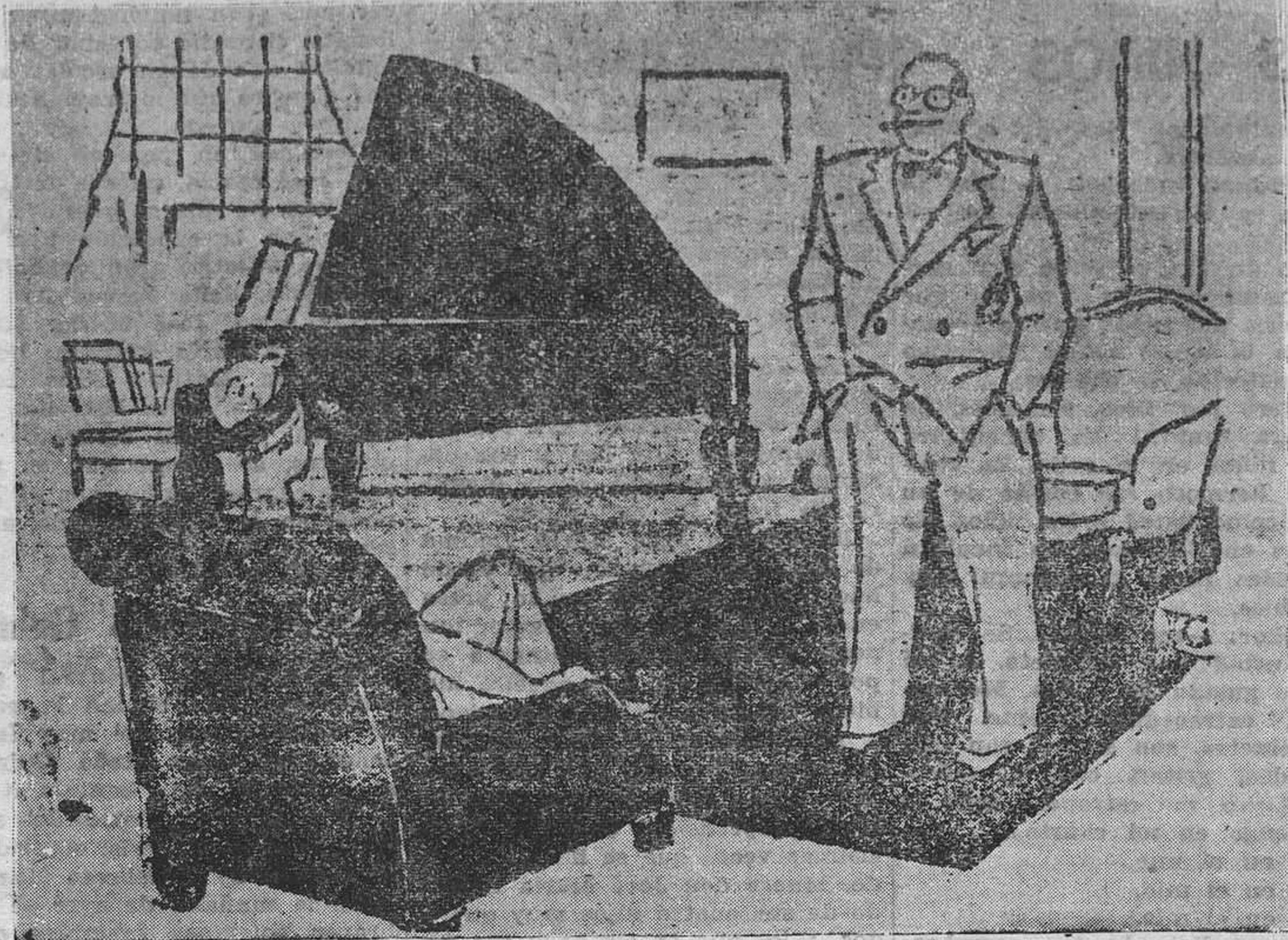
LOS PROGRESOS DE AHORA

Al sentir profundamente tan sensible pérdida, enviamos nues-