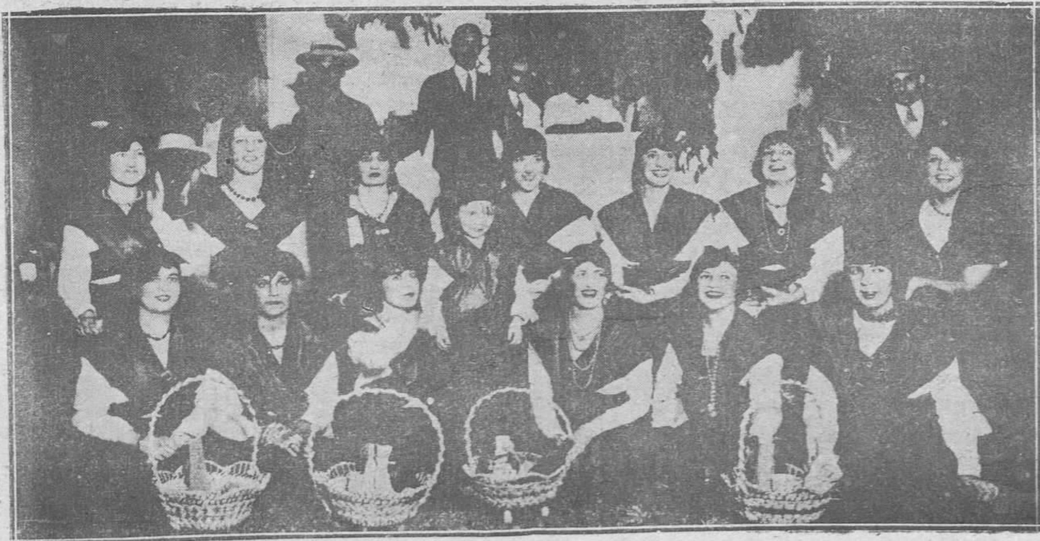
La bella representación femenina del "Kiosco Asturias" de la verbena, hizo honor a Cuba y a la bella región española, llamando la atención de los concurrentes por la propiedad de sus trajes y la armonía del bello conjunto.

Comenzó la fiesta con la misa de campaña, en la oficiaron los sacerdotes Francisco Gayol y el párroco de Puentes Gandes. La cátedra sagrada fué ocupada por el culto padre jesuita Antonio López de Santa Anna, que en su oración elevó un canto a Asturias, a la religión. El ilustre sacerdote cubano, aúno las bellezas naturales de Cuba, con la visión magnífica de la campaña asturiana, y las costumbres del pueblo asturiano con el cual convivió. Describió las maravillas de los problemas sociales, del trabajo agrícola, del rudo gar del minero, al arrancar a la tierra sus tesoros.