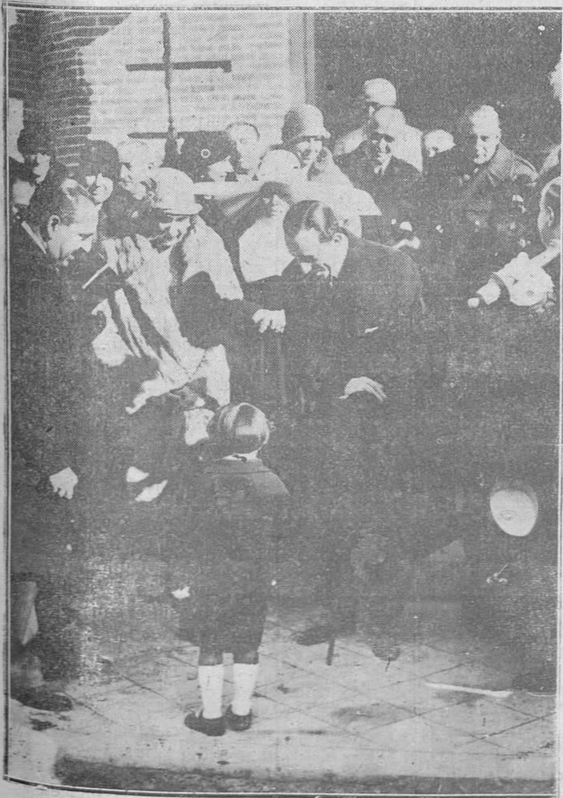
MADRID. Una niña asilada, da la bienvenida a Sus Majestades.

S. M. el Rey don Alfonso acoge a la niña que le ha dado la bienvenida.