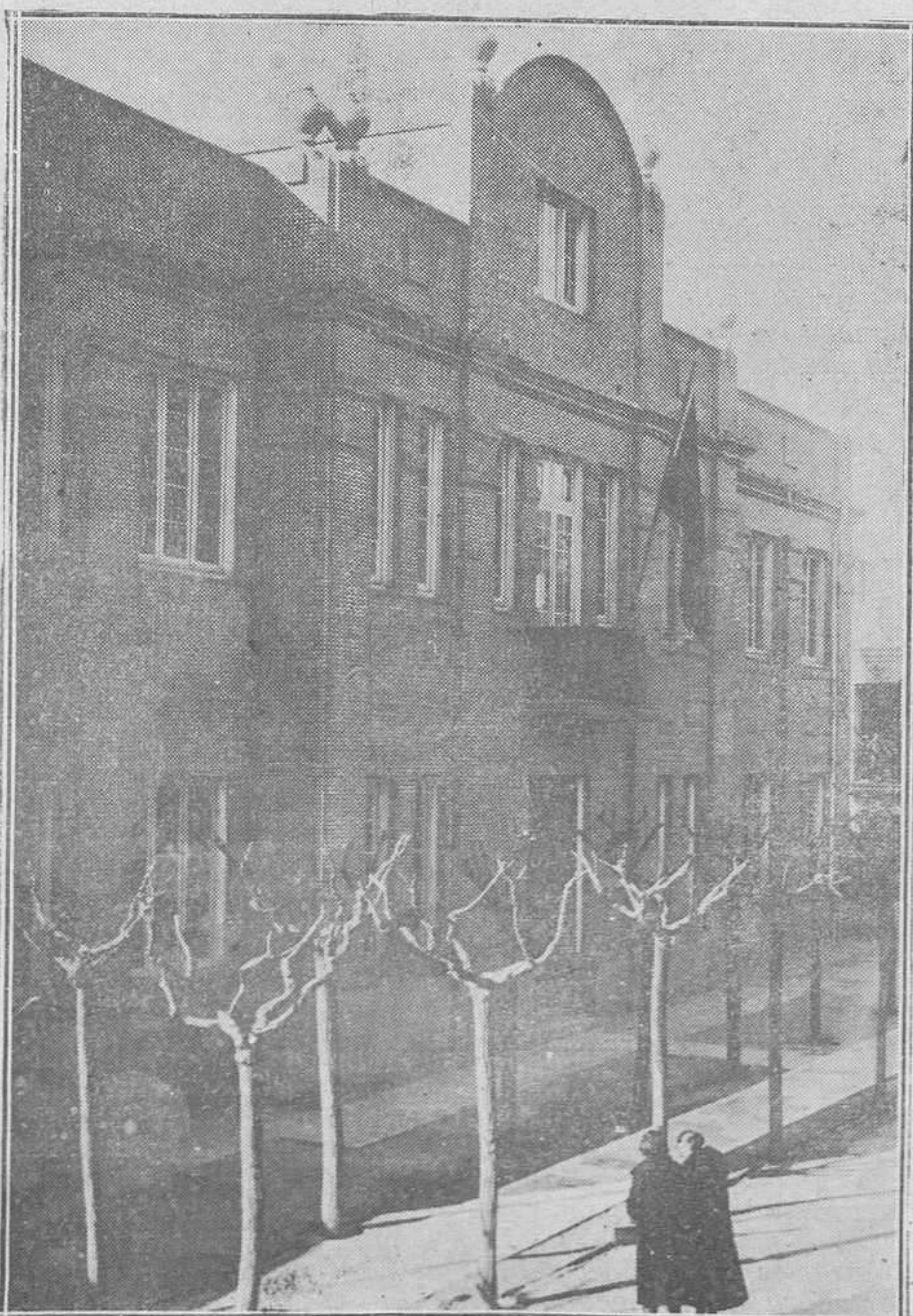
Inauguración de un nuevo pabellón en el grupo escolar "Ruiz Jiménez". Vista del nuevo edificio