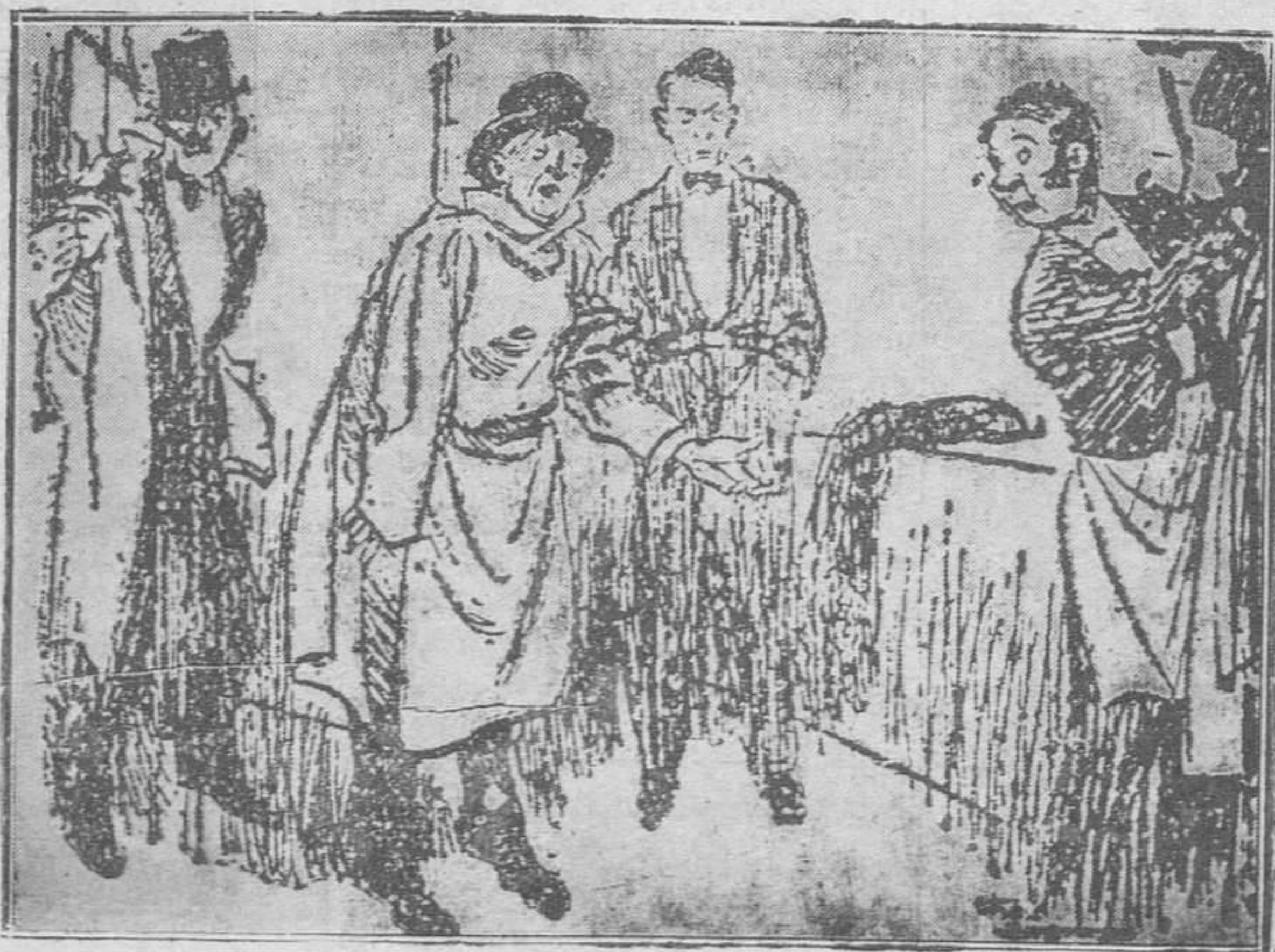
—¡Eh... eh... camarero!... Me ha equivocado usted el gabán... Este que me na dado se abrocha por detrás

De desear es que se terminen pronto las obras de construcción del nuevo Manicomio, para que terminen de una vez los frecuentes envíos de dementes a Valladolid.