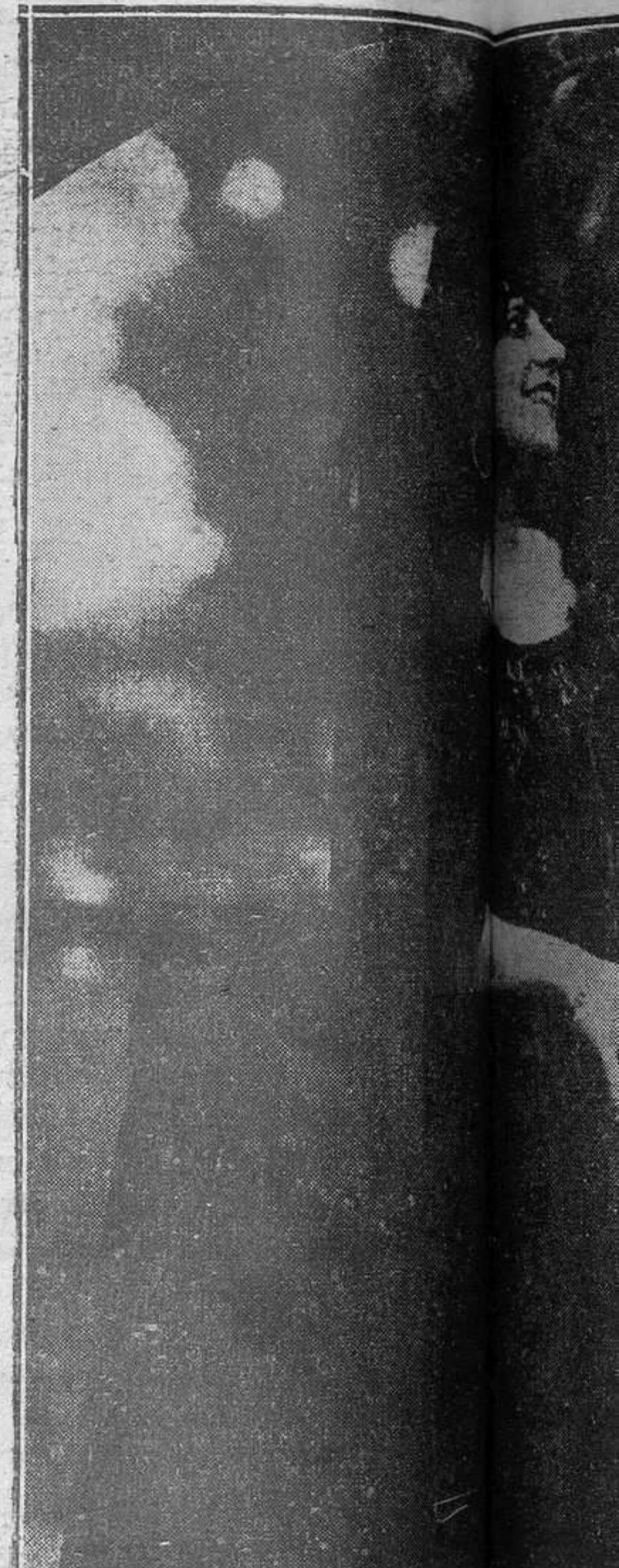
Una interesante concurrente a la Verbena, luciendo el clásico de...

Automovilista, la cual se reunió en la Plaza de la Fraternidad, para desde allí dirigirse a los jardines de "La Polar". En gran número asistieron a la fiesta, siendo llevados los oriflamos brillantes, por las comisiones