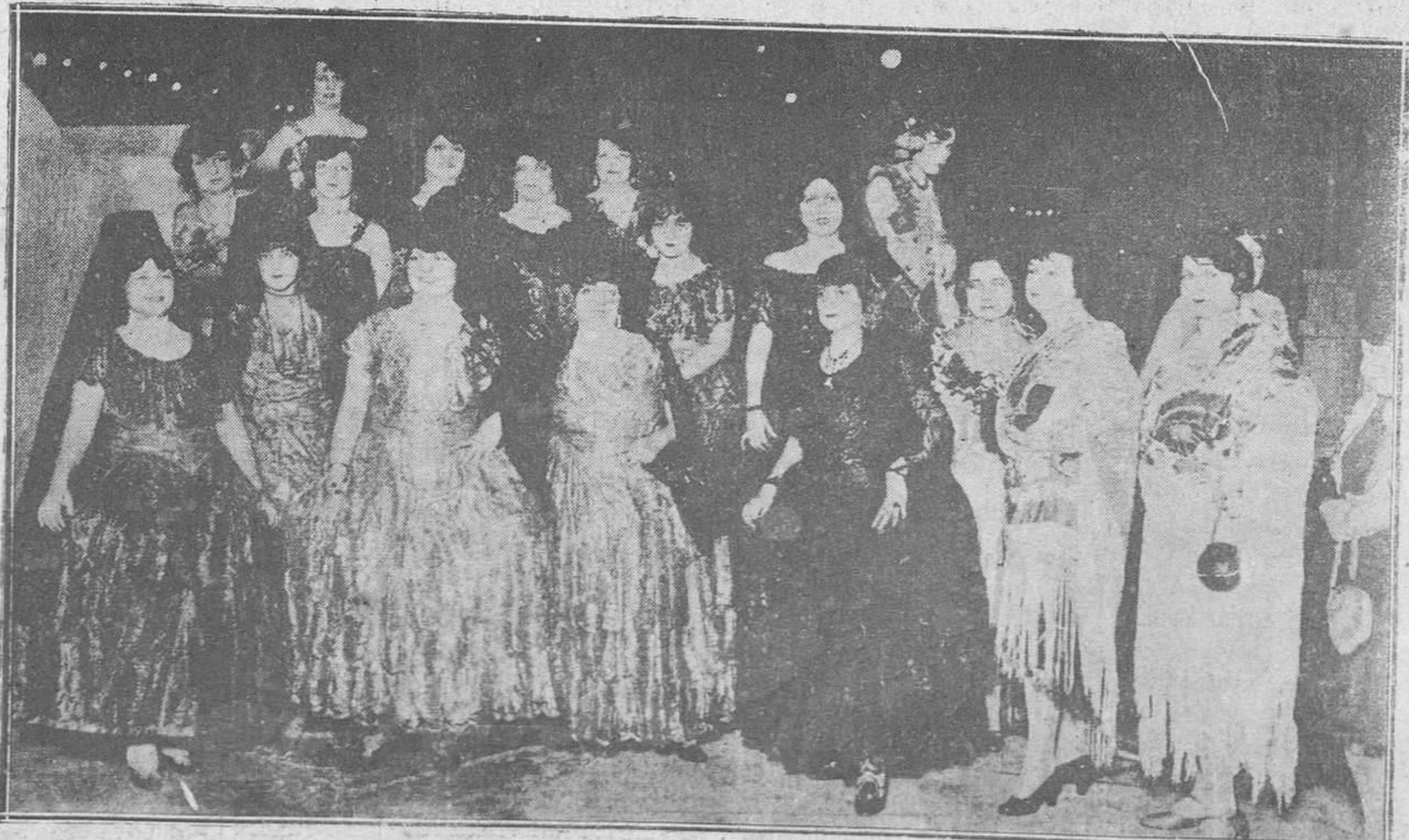
Un bello conjunto de la encantadora representación del "Kiosco Madrid", en que los mantones de Manila, las mantillas de blonda, las peinetas y las flores en la cabeza al modo típico de la Villa del Oso y del Madroño, nos recordaron los barrios de "Maravillas" y Lavapiés, escenario de chulapas y mantas donde el coraje y la ternura viven todavía en el corazón de las mujeres hermosas