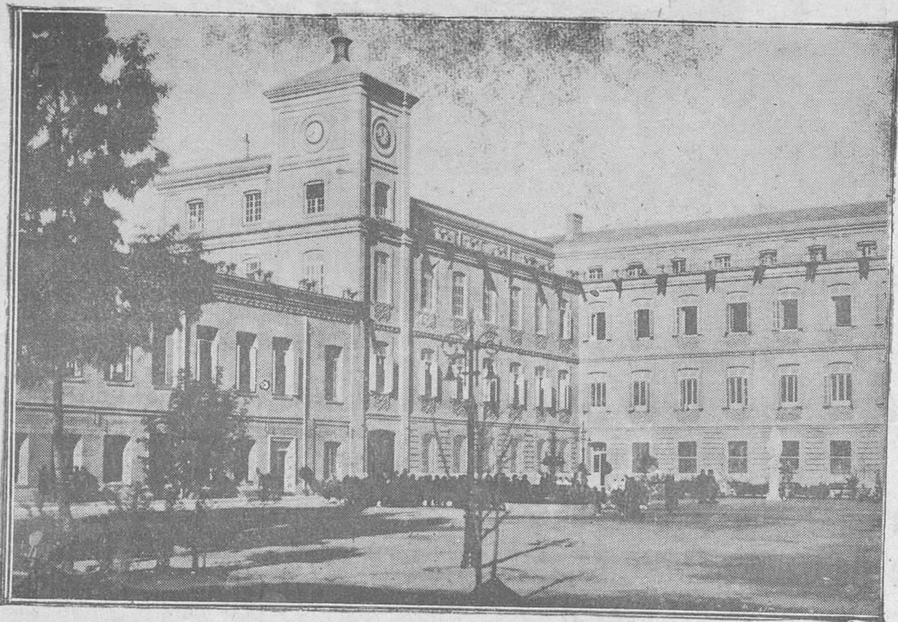
Con asistencia de la Real Familia ha sido inaugurado oficialmente el "Colegio de la Paz" (Inclusa). Vista de uno de los nuevos grandes pabellones del edificio.