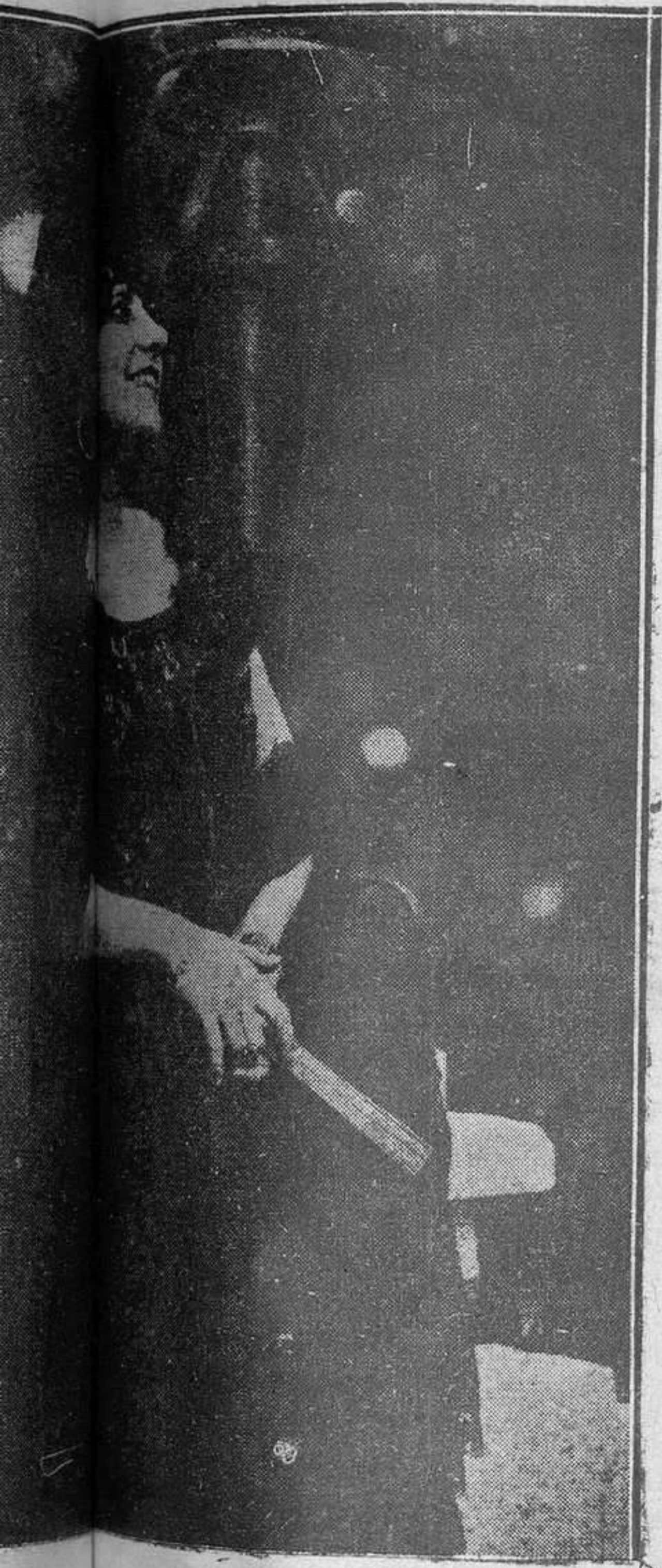
tendo el clásico de las madrileñas de las primeras décadas del...