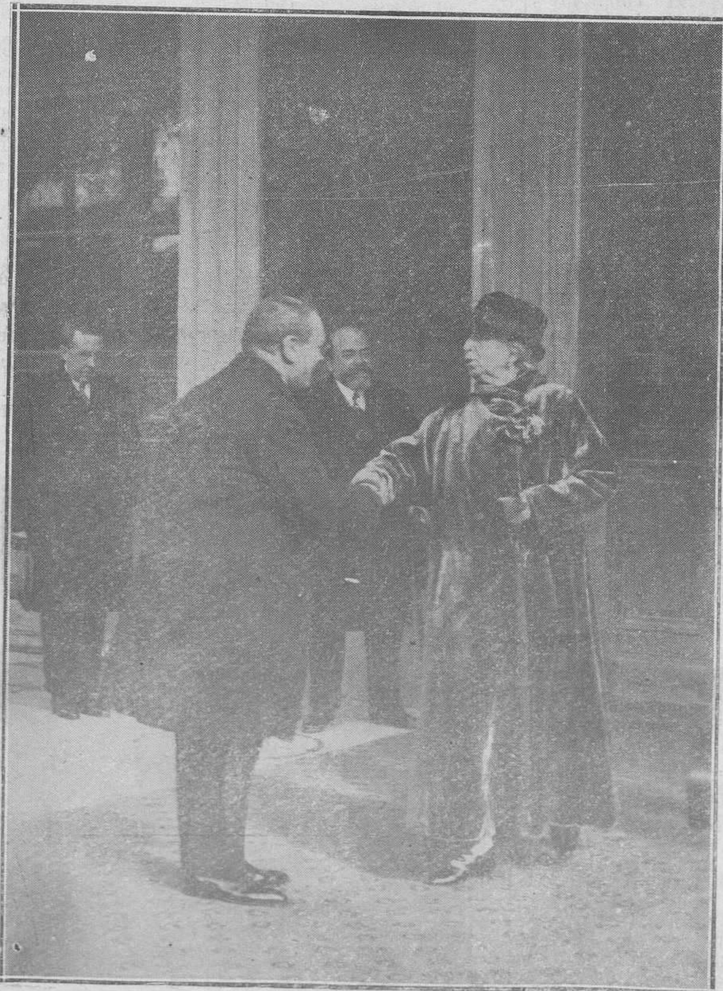
S. M. la Reina doña María Cristina, sa'uda al ministro de la Gobernación, señor Martínez Anido, al llegar a Madrid procedente de San Sebastián.

La cuestión de las permanencias en el Instituto