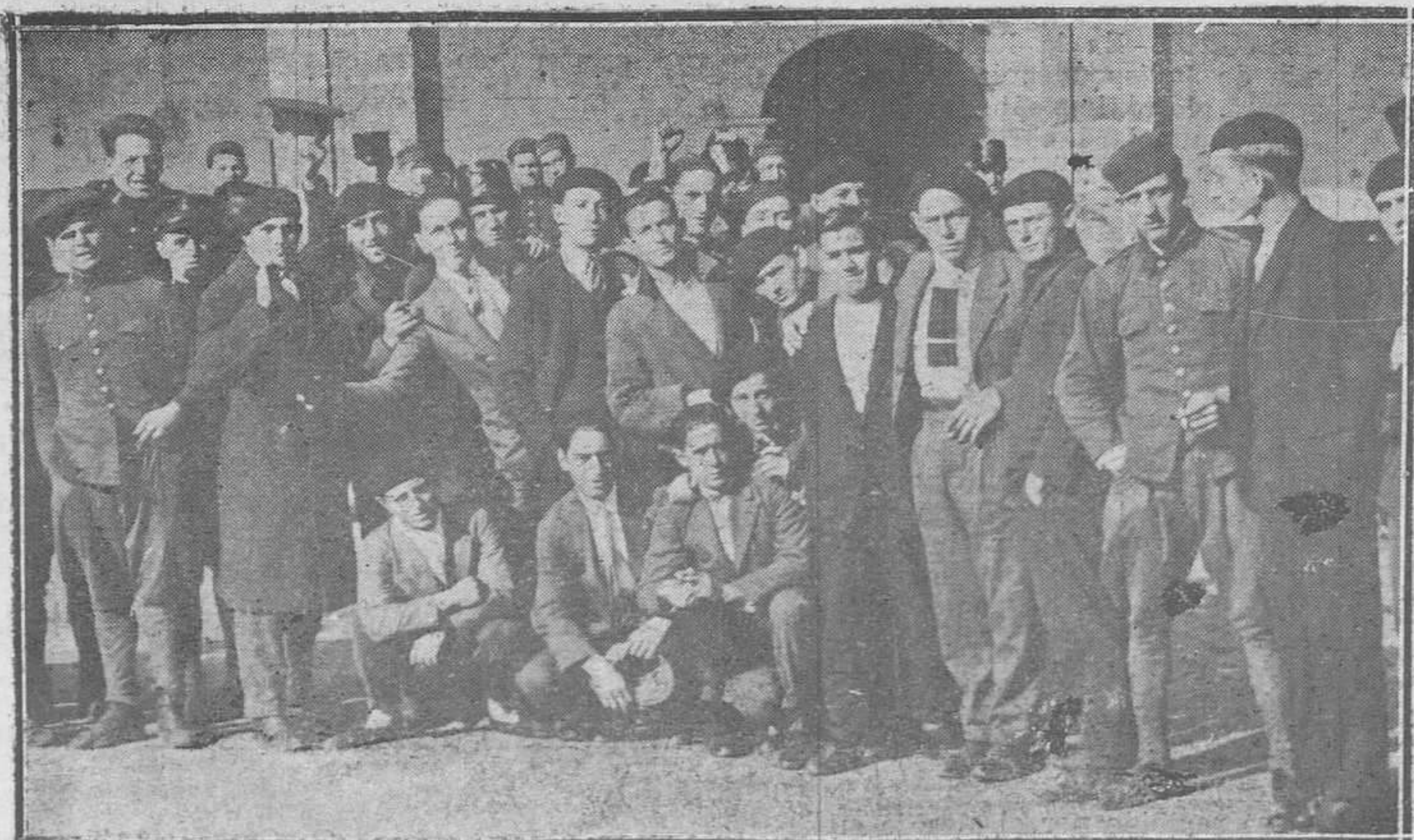
OVIEDO: EL INGRESO DE LOS RECLUTAS DEL ACTUAL REEMPLAZO.—Grupo de quintos en el patio del cuartel.