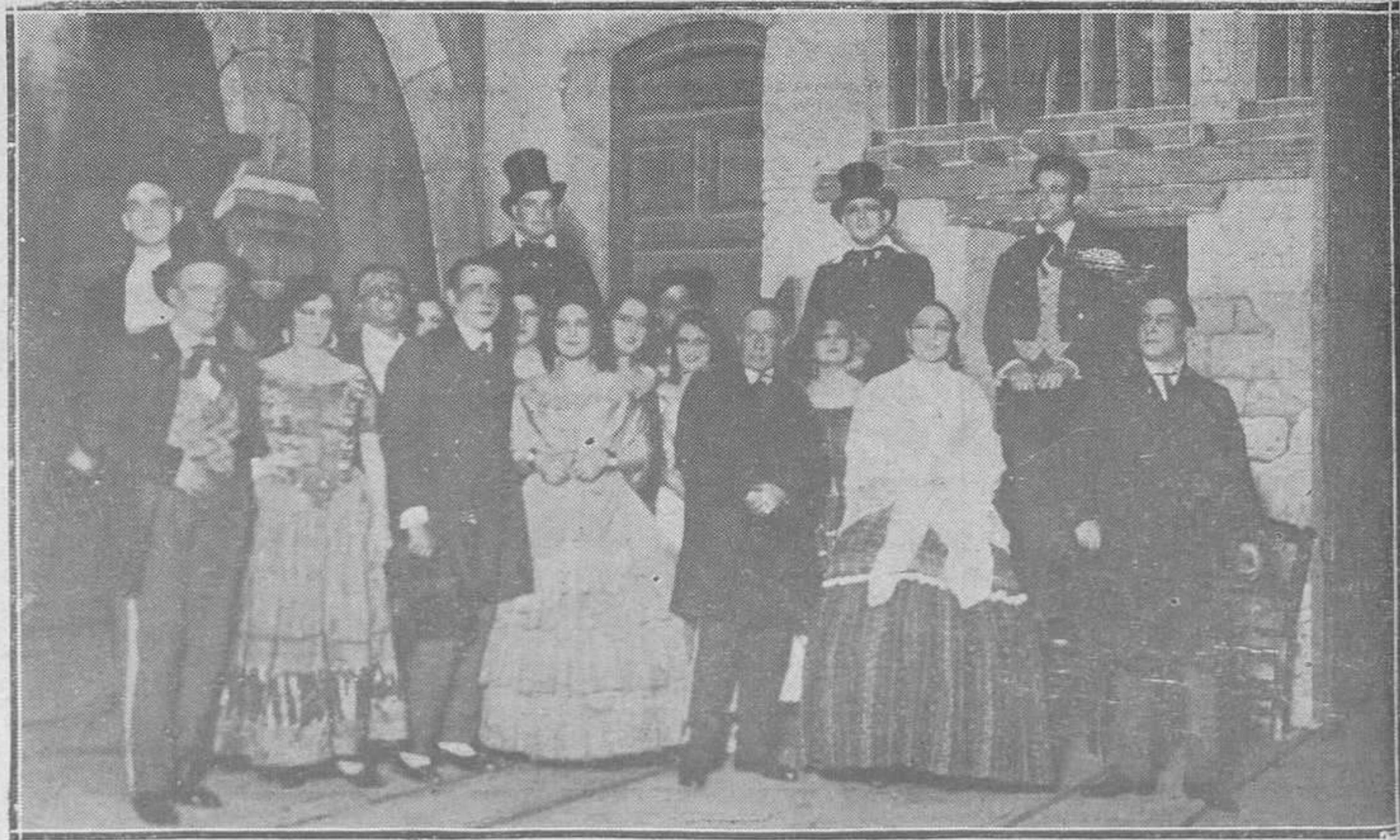
OVIEDO.—Una escena del tercer acto de "La Ca'esera", estrenada el miércoles en el Campoamor con gran éxito.

He aquí otro bello y generoso gesto de un asturiano cuya fortuna y cuyas grandes iniciativas comerciales se forjaron en la tierra antillana que hoy pide socorros para sus damnificados.