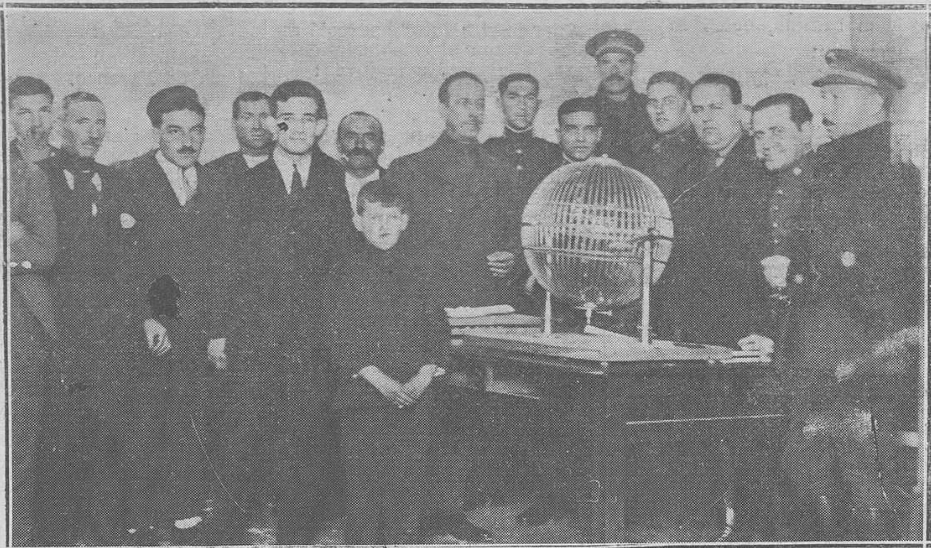
OVIEDO: EL INGRESO DE LOS RECLUTAS DEL REEMPLAZO ACTUAL.-El sorteo de quintos para la Península y África.