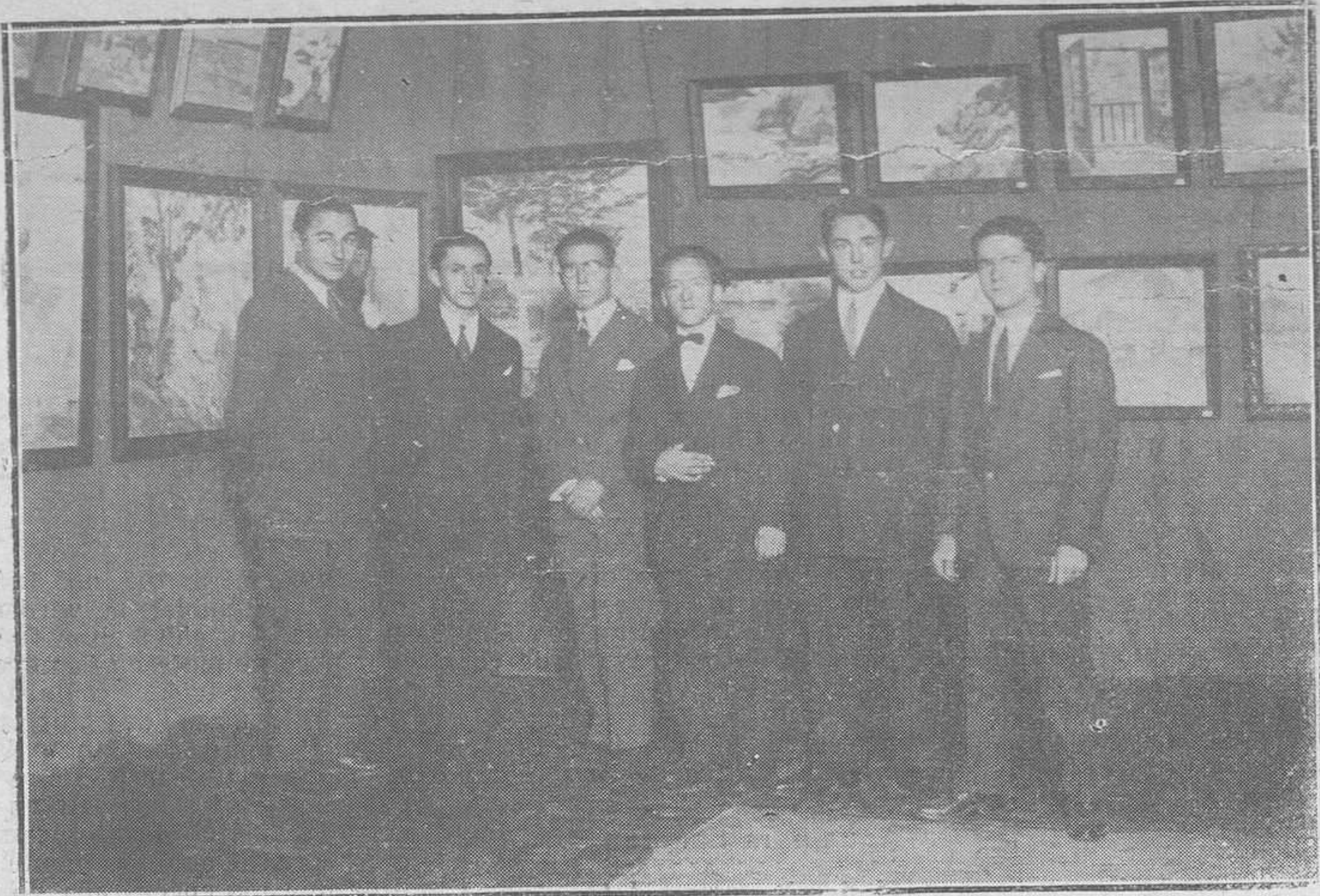
Los alumnos pensionados en El Paular, en la Exposición de sus obras realizadas en su viaje de estudio a Asturias y El Paular.