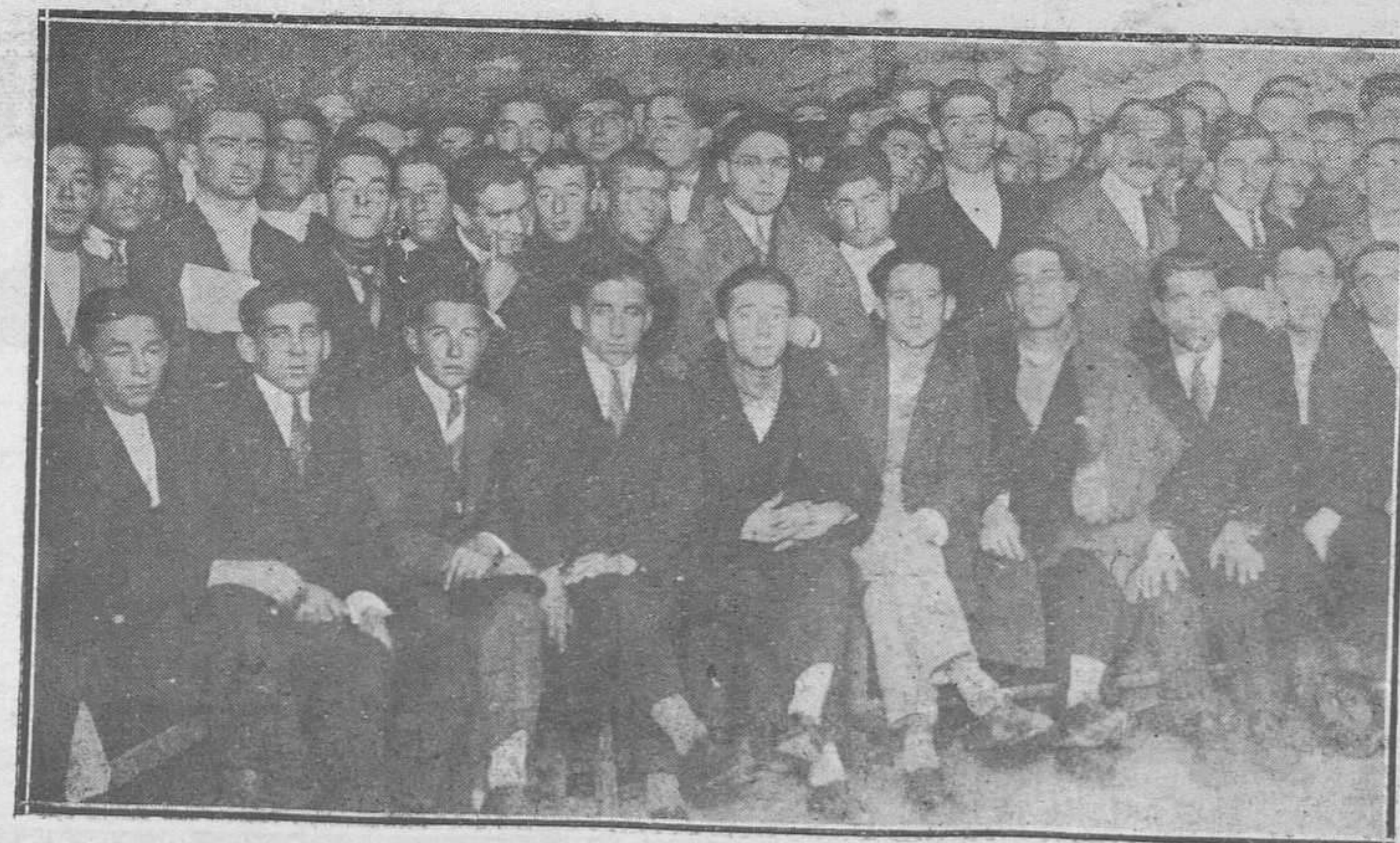
OVIEDO: EL INGRESO DE LOS RECLUTAS DEL ACTUAL REEMPLAZO.—Grupo de quintos presenciando el sorteo.