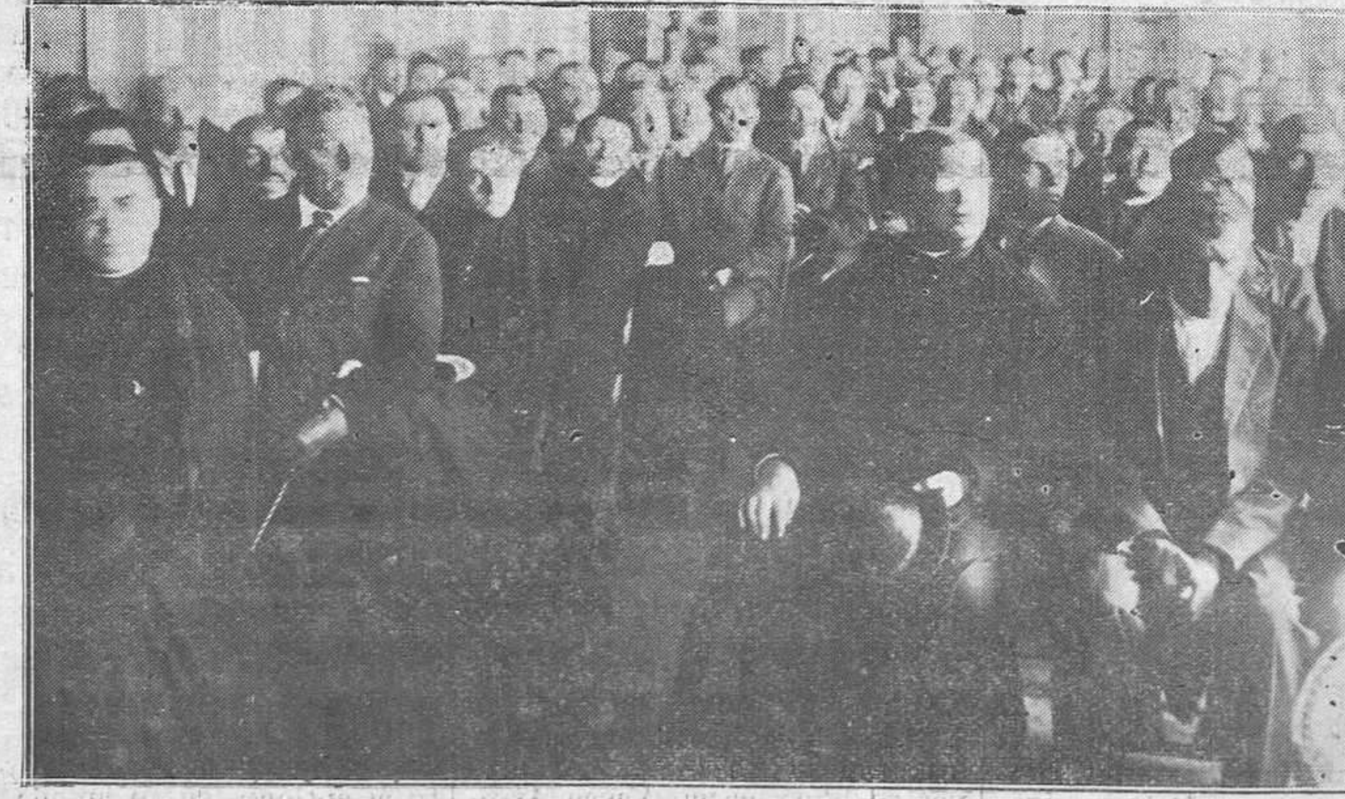
OVIEDO.-En el Centro Diocesano.-Un aspecto del salón de actos durante la primera Asamblea Diocesana celebrada ayer con gran brillantez