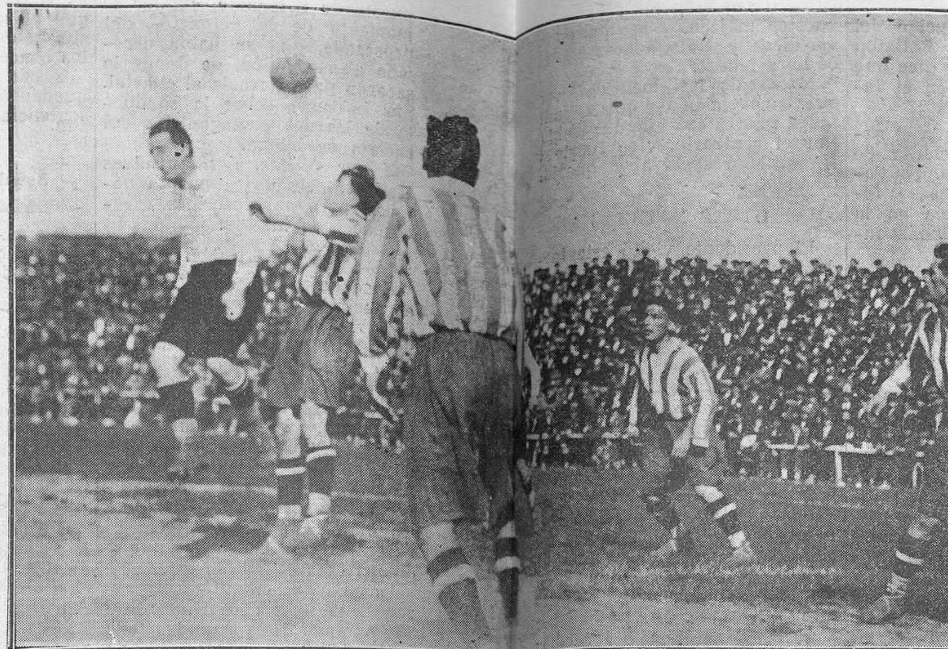
GIJÓN.- El partido del domingo en El Molinón.—Un córner contra el Spórting sin consecuencias

Cuesta-Prida hicieron un partido muy bueno. Sobre