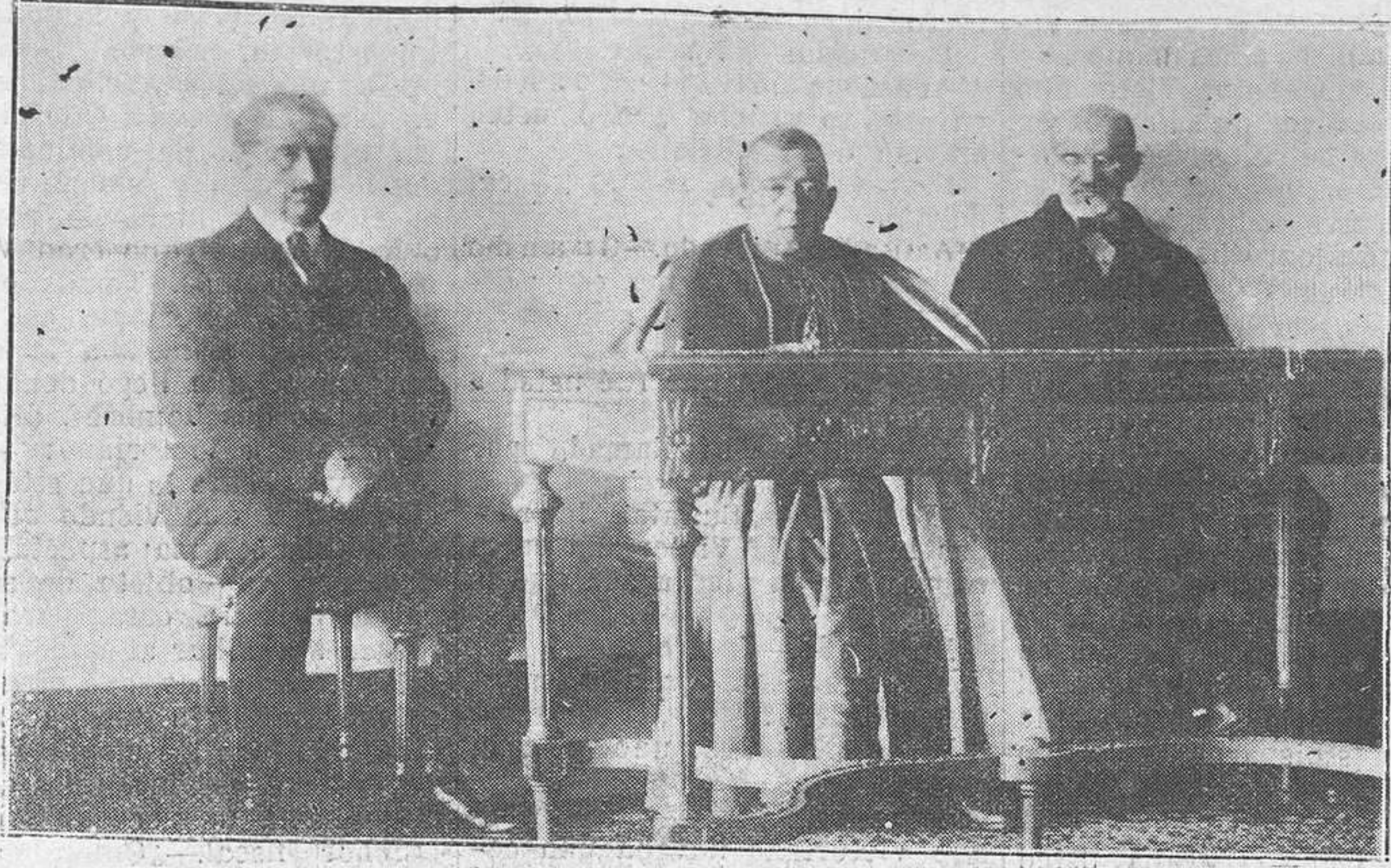
OVIEDO.-La presidencia de la primera Asamblea Diocesana, celebrada ayer en el Centro Diocesano

otros la finalidad de que Cristo sea conocido más y mejor por los hombres. Así lo entiende el Papa y así divinamente inspirado ha trazado el luminoso programa a seguir. Dice el Prelado que no debe ilusionarnos esta paz que tenemos, porque esta paz sólo es quietud, ya que es obra de la fuerza. No debemos dormirnos en esta paz externa. Ahora sufrimos una cruenta persecución manifestada en las malas lecturas y en los estragos que hace la pornografía, especialmente en nuestras mujeres y jóvenes. Todo esto germina entre nosotros. Por esto estamos en tiempos de guerra y de guerra despiadada y cruenta, y debemos trabajar como en tiempos de guerra. Aboga elocuentemente por la organización y por el sacrificio, que son los elementos de salvación. Y termina pidiendo la protección de la Virgen y del Corazón de Jesús para poder dignamente cumplir el precepto de amarnos los unos a los otros. Al terminar su notabilísimo discurso, el Prelado, fué objeto de una cariñosísima y entusiasta ovación. Acto seguido se levanta la sesión y se da por concluida la Asamblea. El exceso de original nos impide dar hasta mañana la lista de las representaciones de la Asamblea y de las adhesiones recibidas.