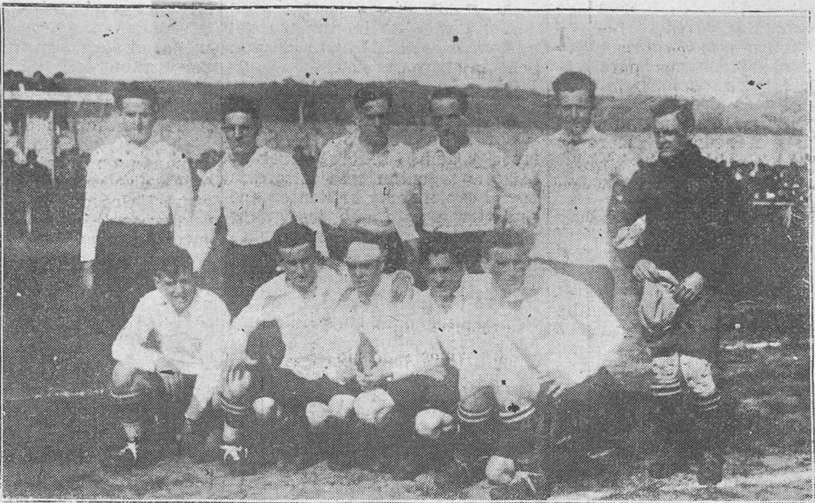
GIJÓN.—El Real Unión de Irún, que el domingo jugó con el Real Spórting un importante partido de campeonato, siendo vencido por este último