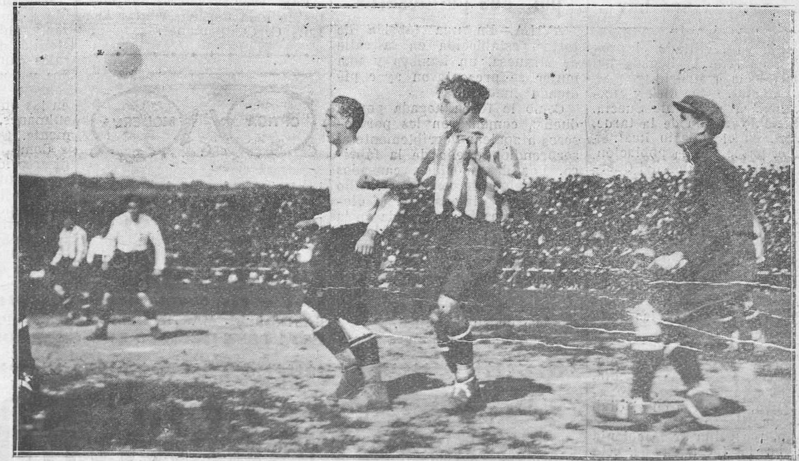
GIJÓN.-El partido del domingo en El Molinón.—Un buen centro de los de Irún que consiguan despejar los de Gijón