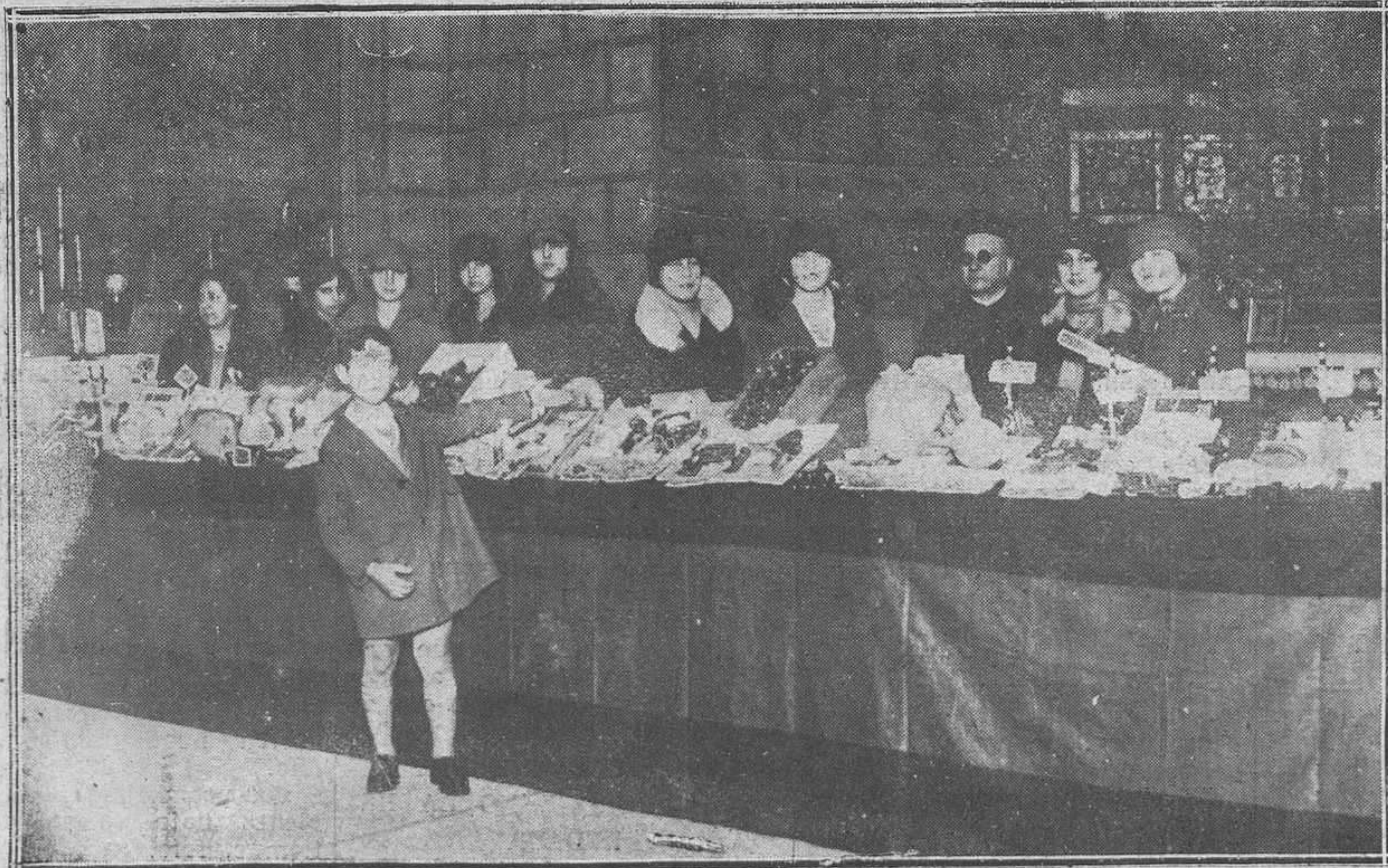
Oviedo: En San Juan el Real.-Reparto de juguetes a los niños de la Hora Santa.

Iba de puntillas; no quería que la sintiesen los fíos de Gertrudis.