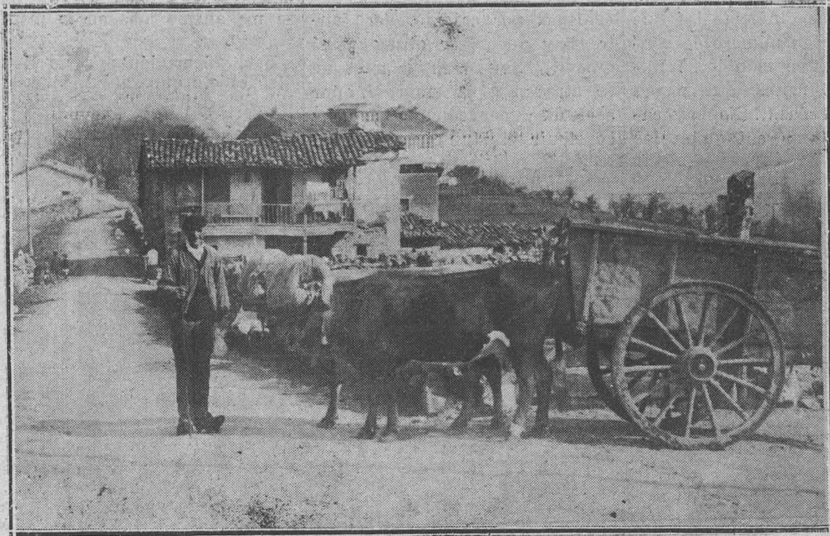
Oviedo: Paisajes asturianos.—Camino de Villafra.

Todos los alcaldes presentes en la reunión recordaron aquellas manifestaciones mías, sobre las cuales habían meditado,