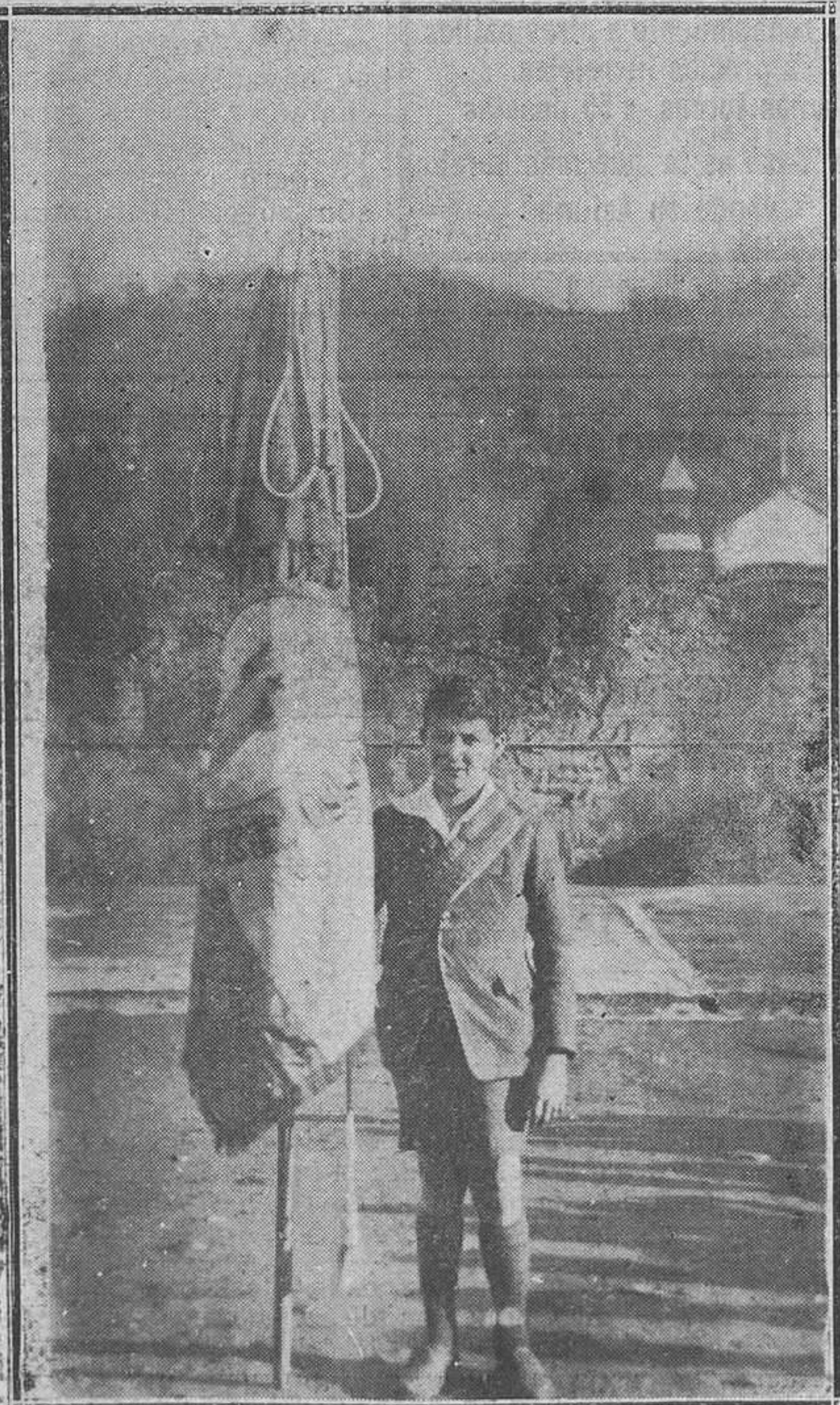
Turón.-La bandera de la Congregación del Niño Jesús, después de su bendición.