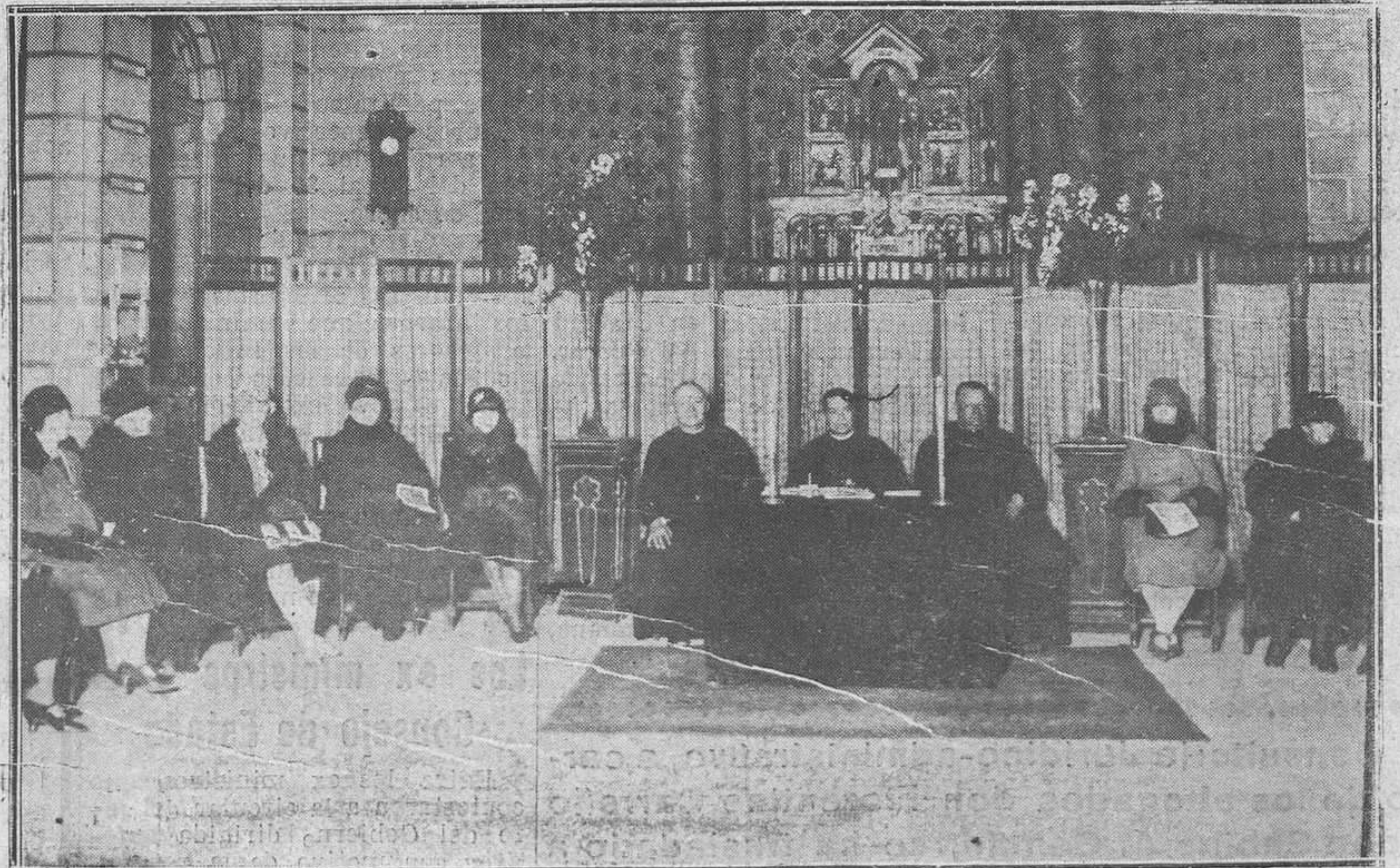
Oviedo: En San Juan el Real.-La presidencia del reparto de premios a los niños de la Hora Santa.