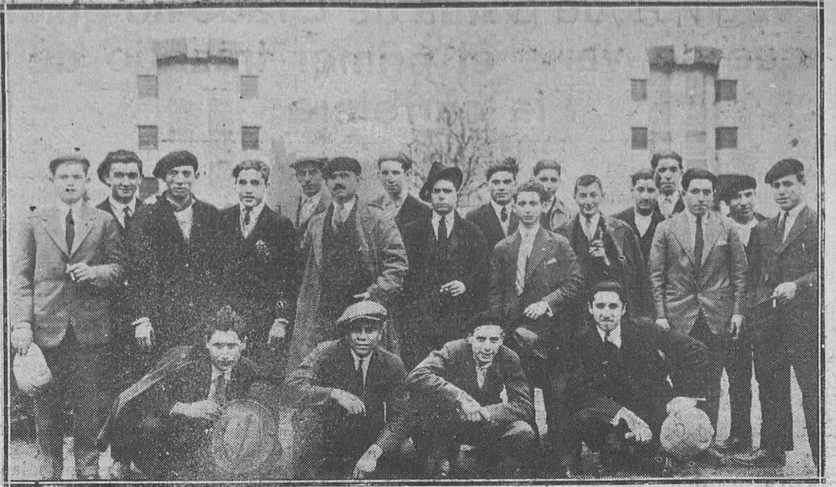
Villaviciosa.-Los excursionistas luanquinos, que el pasado domingo estuvieron en esta villa.

ta el reto que el Lugarín lanzó el domingo, después del partido, para jugar la cantidad de 50 pesetas, en el campo de La Barraca.