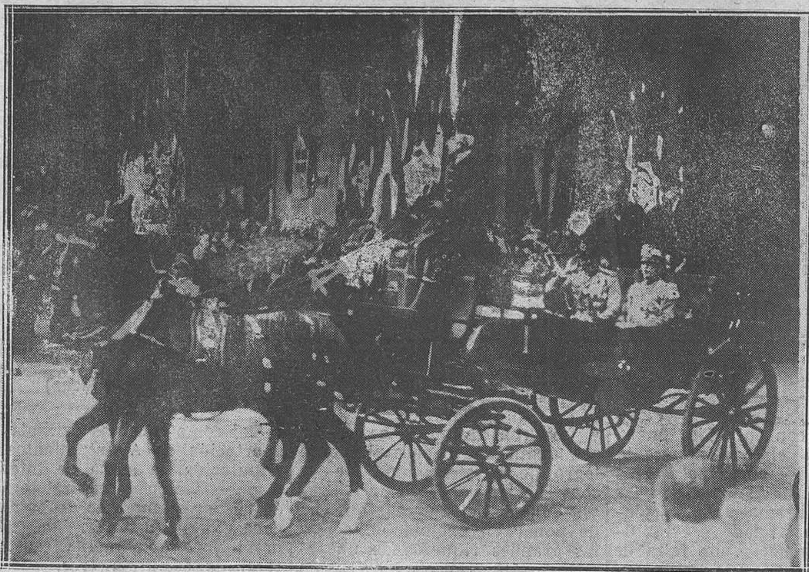
Reina: De la llegada del Rey del Afganistán.—El Emir Amin Ulha, al salir de la estación acompañado del Rey de Italia.

Se deben derribar todas las casas que no puedan habitarse, por caridad, por higiene, por egoísmo, por cálculo. Pero antes hay que alzar otras; y si quienes habitan en palacios no se atreven a la empresa, por caridad y por cálculo las debe construir el Municipio.