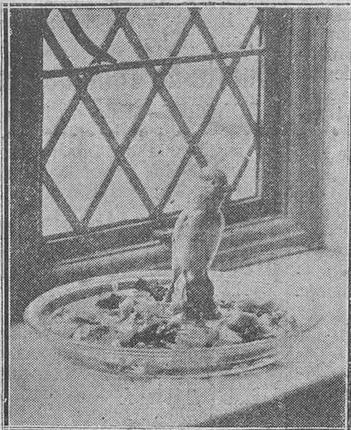
Plato de cristal para colocar capullos flojantes. Un pajarillo que se eleva en su centro comunica una nota primaveral y alegre a la ventana.

Gertrudis insistía. La pobre mujer era una descrio-