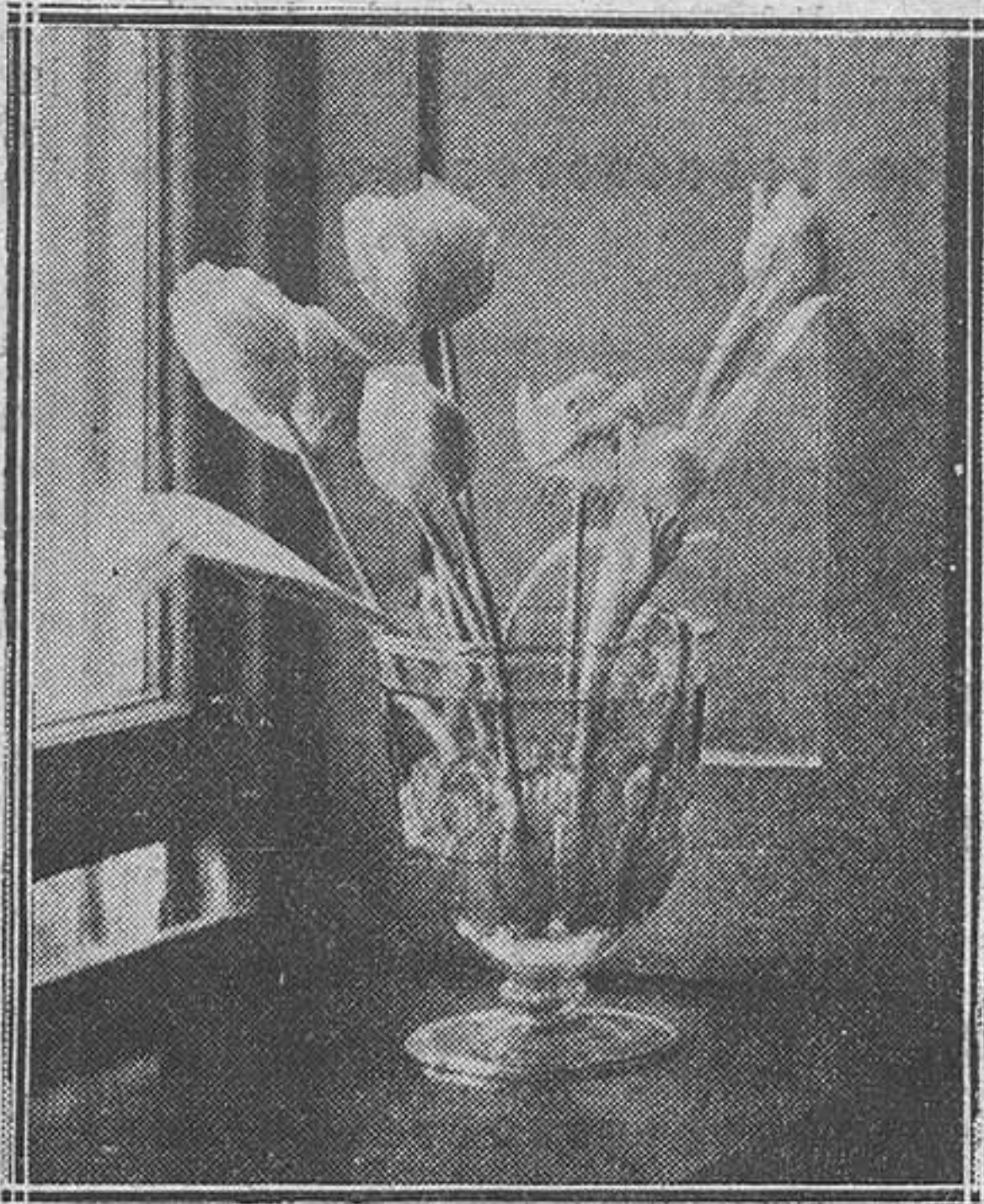
Copa de cristal azul zafiro con asas, en la que se des- tacan maravillosamente tulipanes amarillos.

las más al oír parecidas afirmaciones a autoridades y tutores.