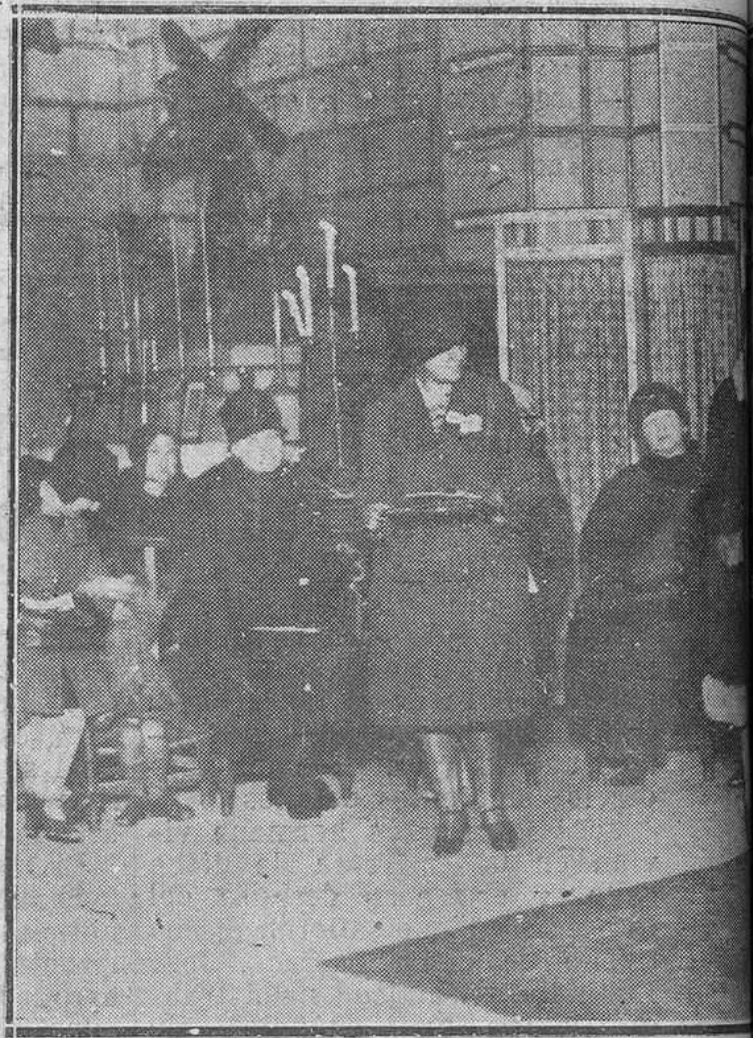
Oviedo: En S. Juan el Real.-El señor Provisor haciendo el

Todos los desgraciados, todos los desheredados, sabían que podían dirigirse con toda confianza a esa oculista, de gran habilidad, que no se contentaba con curarlos, sino también con socorrer sus miserias con más laudable discreción. Su augusta hija parece haber recibido en legado de su venerado padre su