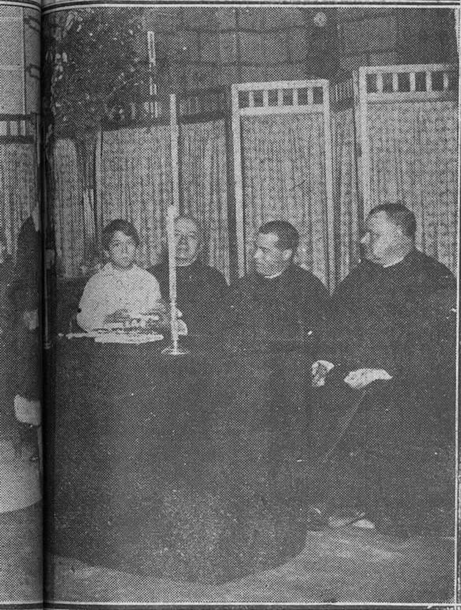
premio a uno de los niños de la Hora Santa. (Mena)

able inteligencia y su bondad perfecta. No hay ardilla en Bruselas que no haya sido esclarecida su sonrisa, ninguna miseria que no haya socorri- ninguna obra pia que no haya fecundado. había una vez en una buhardilla una pobre loca que moría con sufrimientos atroces. Y los médicos ha- declarado que sólo un poco de música, alivia- la enferma. Entonces diariamente, durante varias se vió venir al lado del miserable lecho de la princesa de la caridad, con su violín en mano. Y durante días y días la distrajo, hasta su arte.