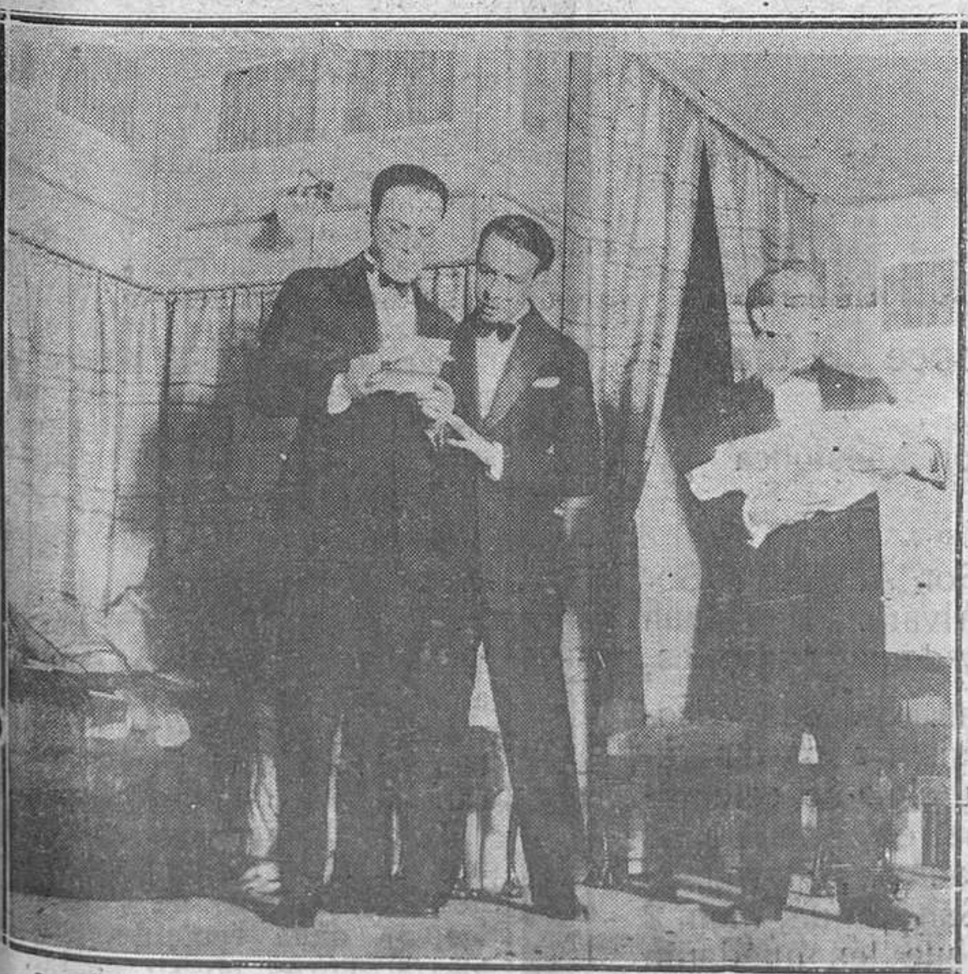
Madrid.—Una escena de la comedia "Dálo un beso a papá", original de don Antonio Suárez, que se estrenó en el teatro Infanta Isabel.