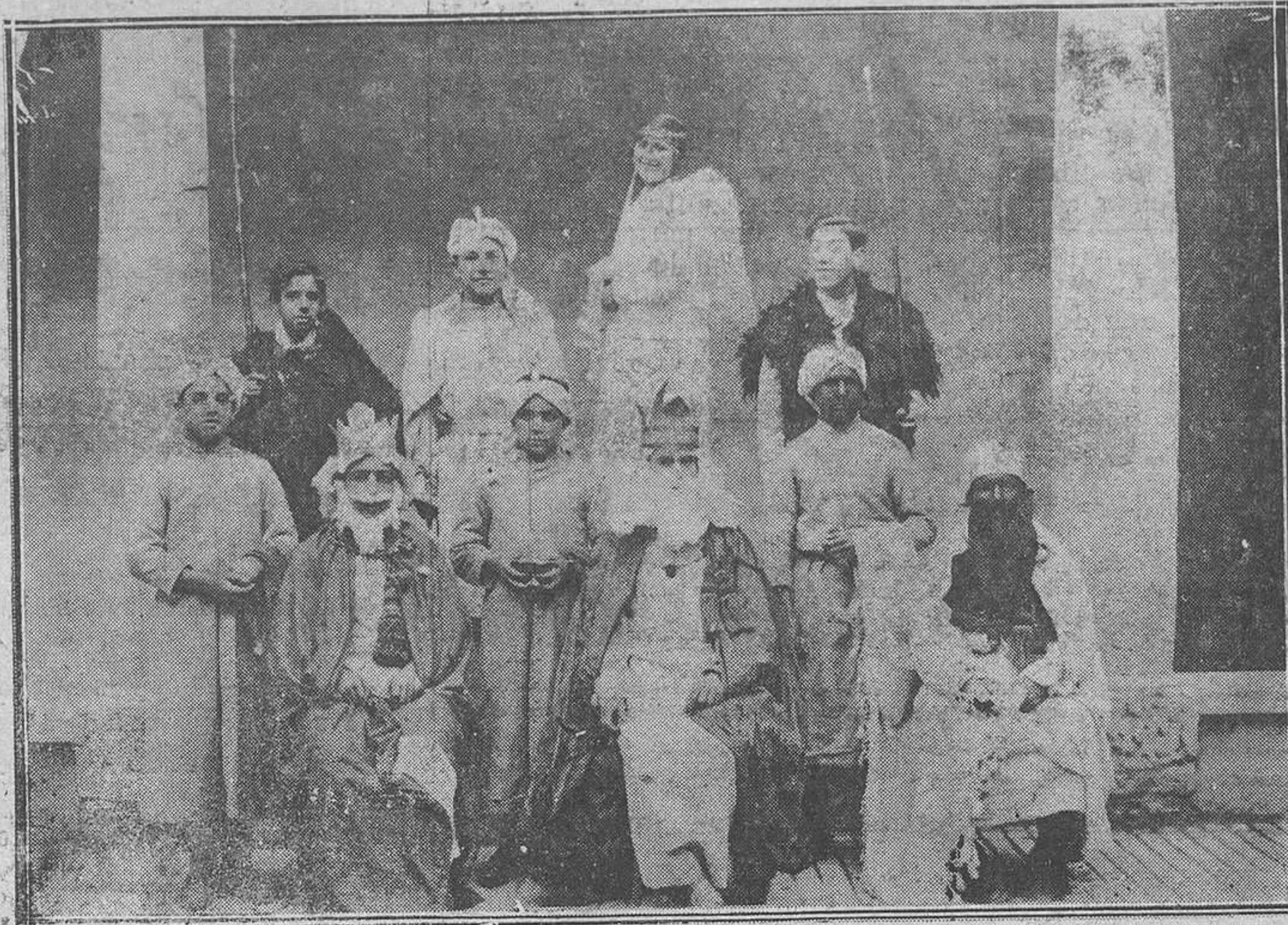
Oviedo: El día de Reyes en el Hospicio.—Un grupo de asilados que presidieron el reparto de juguetes y golosinas con que fueron obsequiados por la Diputación.

Los villalegrinos, que están hoy en muy buena forma, vienen con ánimos de repetir la lección dada recientemente a los de Turón en su campo de "La Caleyá", y como éstos están dispuestos a sacarse la espina, no dudamos que el encuentro resultará interesantísimo. Se juega a todos los jugadores.