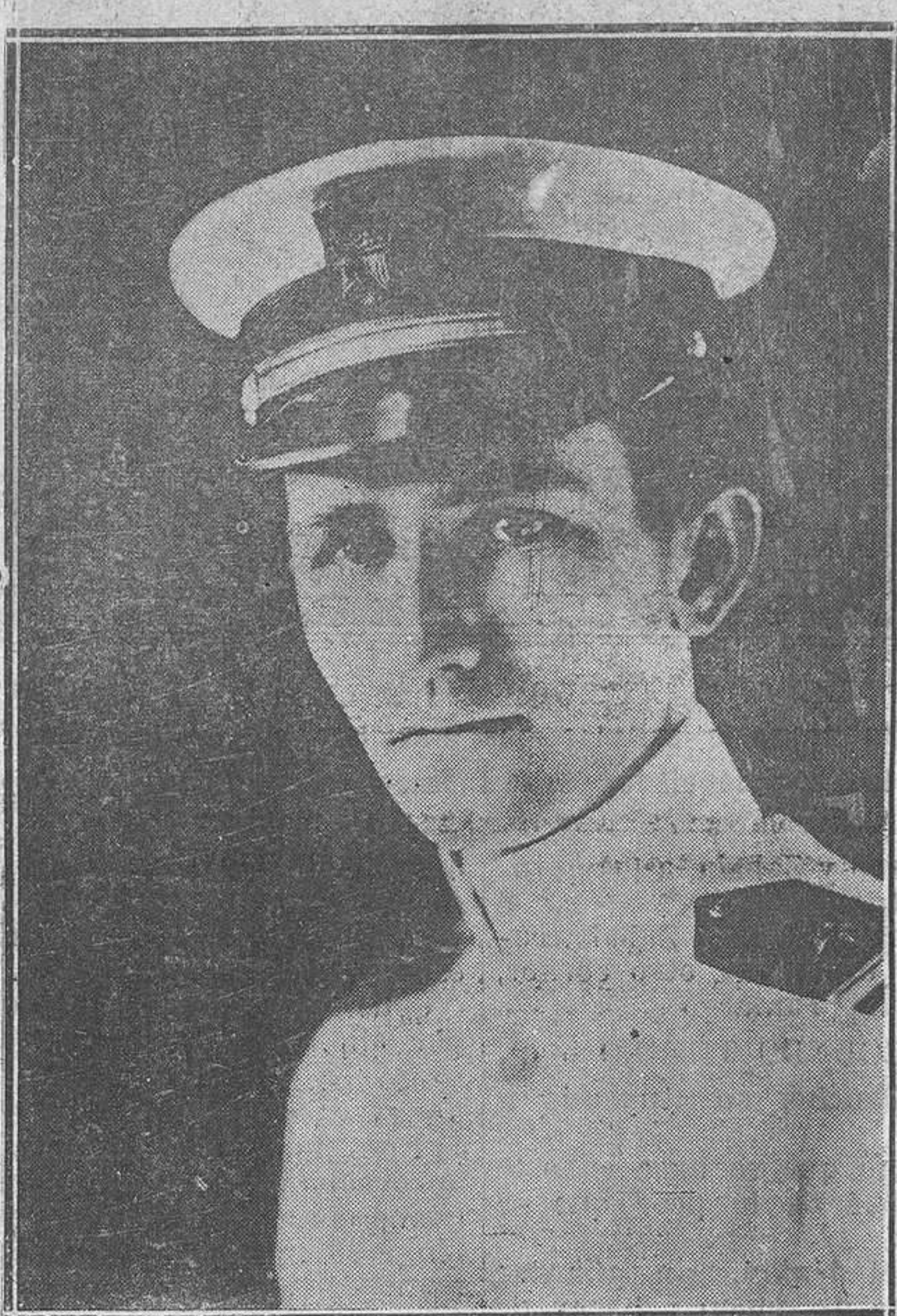
Estados Unidos.—El desgraciado comandante del submarino "S-4", Mr. Roy Kehler Jones, víctima, con los demás tripulantes en aguas de Provincetown.

—Para el buen orden de la Biblioteca, llevamos dos ficheros: uno de autores y otro por números, que permiten la fácil entrega de cualquier obra pedida, si no está en nuestra memoria el encontrarla.