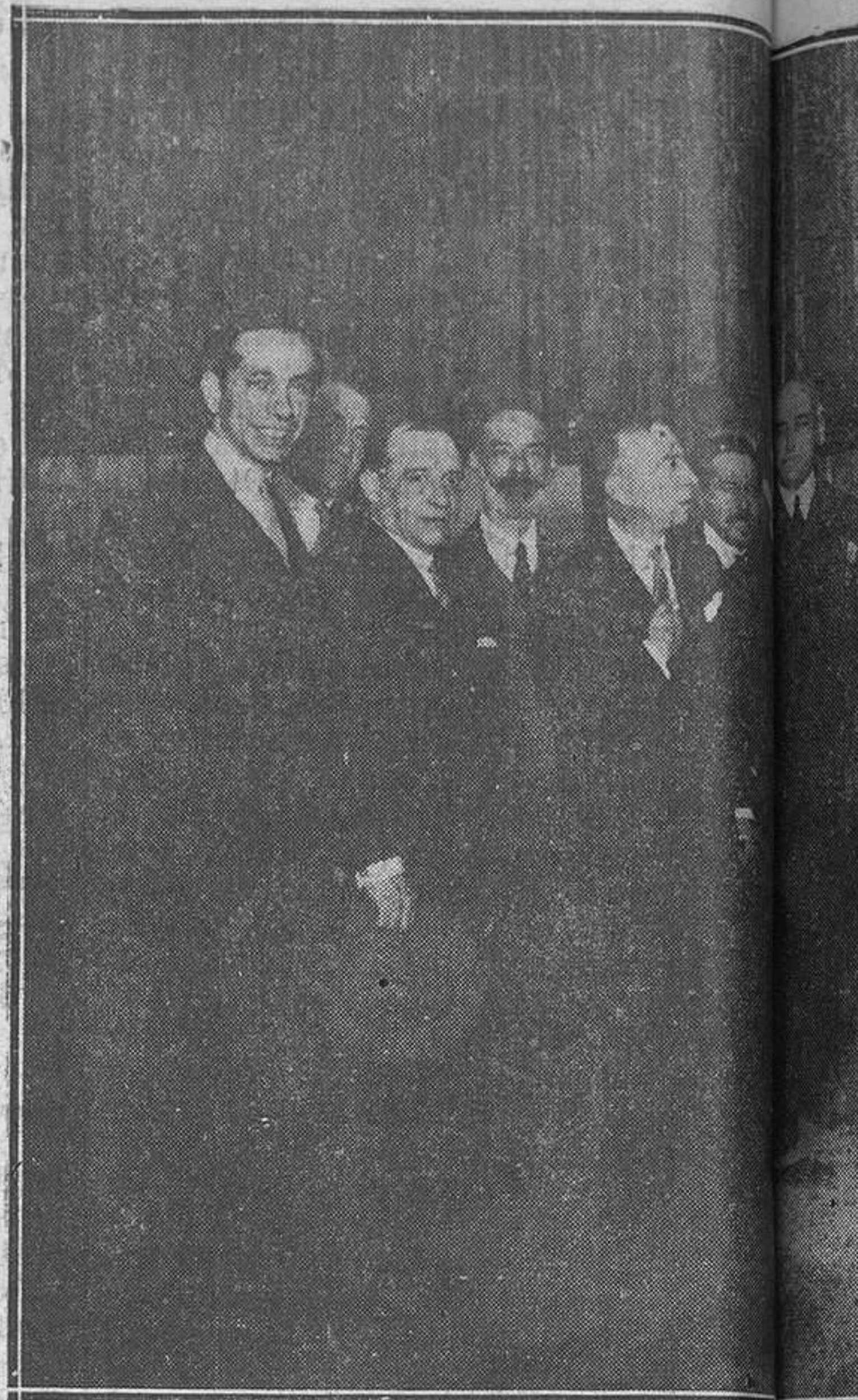
Madrid.—Los autores de los cuadros que figuran en la Exposición de artistas españoles, y que se vió en...

Y de todo ese arte, de toda esa belleza, ¿qué queda? Nada o casi nada: unas cuantas fotografías, unos cuantos recuerdos y... ¡un puñado de cenizas!, pues la Loie Fuller fué incinerada el miércoles 4 del corriente, y sus cenizas reposarán en uno de esos nichos, grandes como armarios de muñecas, que forman el Colombarium del Pere Lachaise y donde su nombre, grabado sobre diminuta lápida, "nos dirá algo", a los que nos acercamos cada día más a las puertas del misterio.