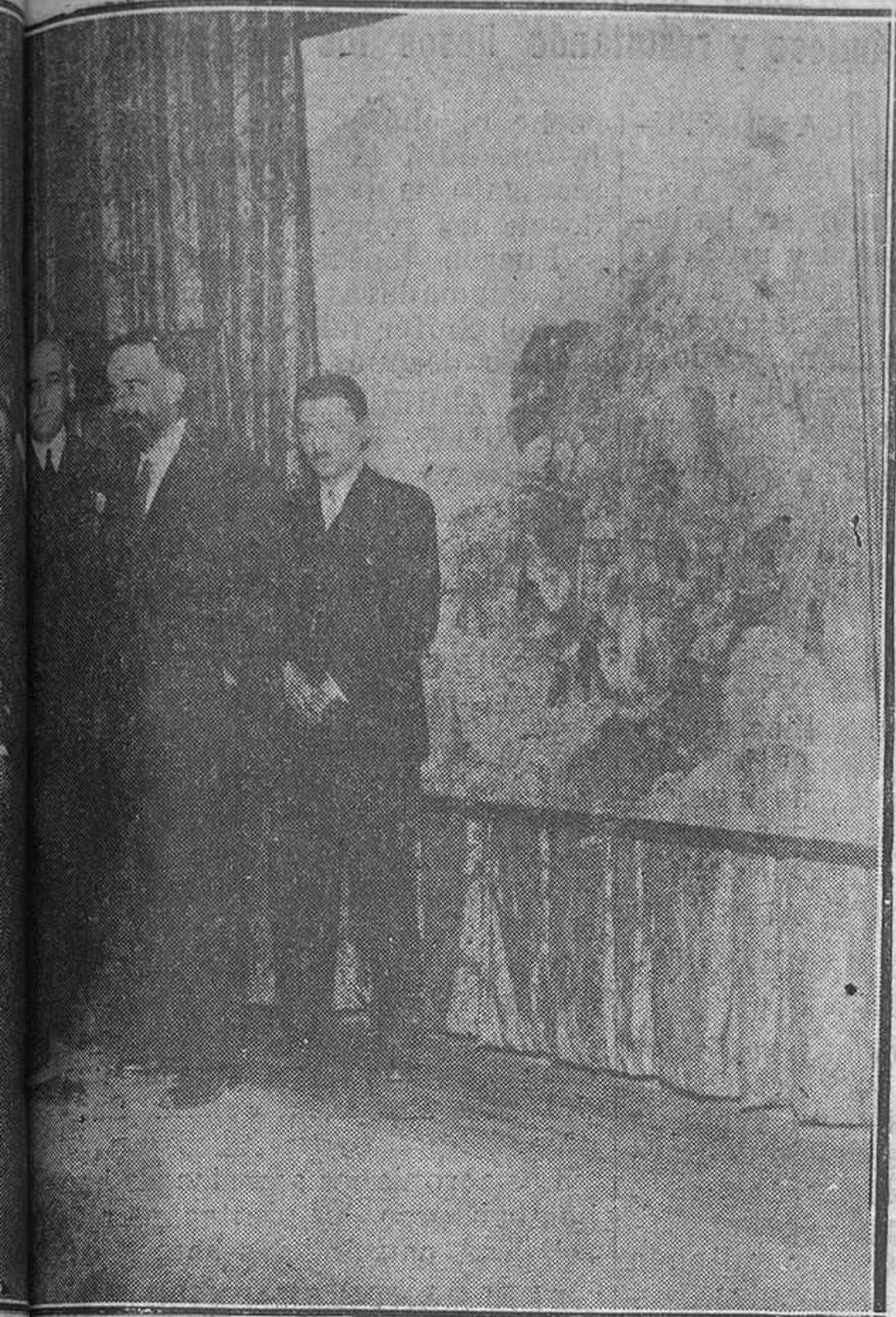
Exposición organizada por la Asociación de paisajistas en el Círculo de Bellas Artes.

En todas las esferas de actividad profesional hay quienes se maravillan de lo que otros adelantan y dicen que la suerte los mimó, pero en realidad su adelanto tiene por causa la mayor suma de conocimientos adecuados a la respectiva profesión, si les acompañan las demás cualidades de carácter que, como la perseverancia y el entusiasmo, son indispensables factores del éxito.