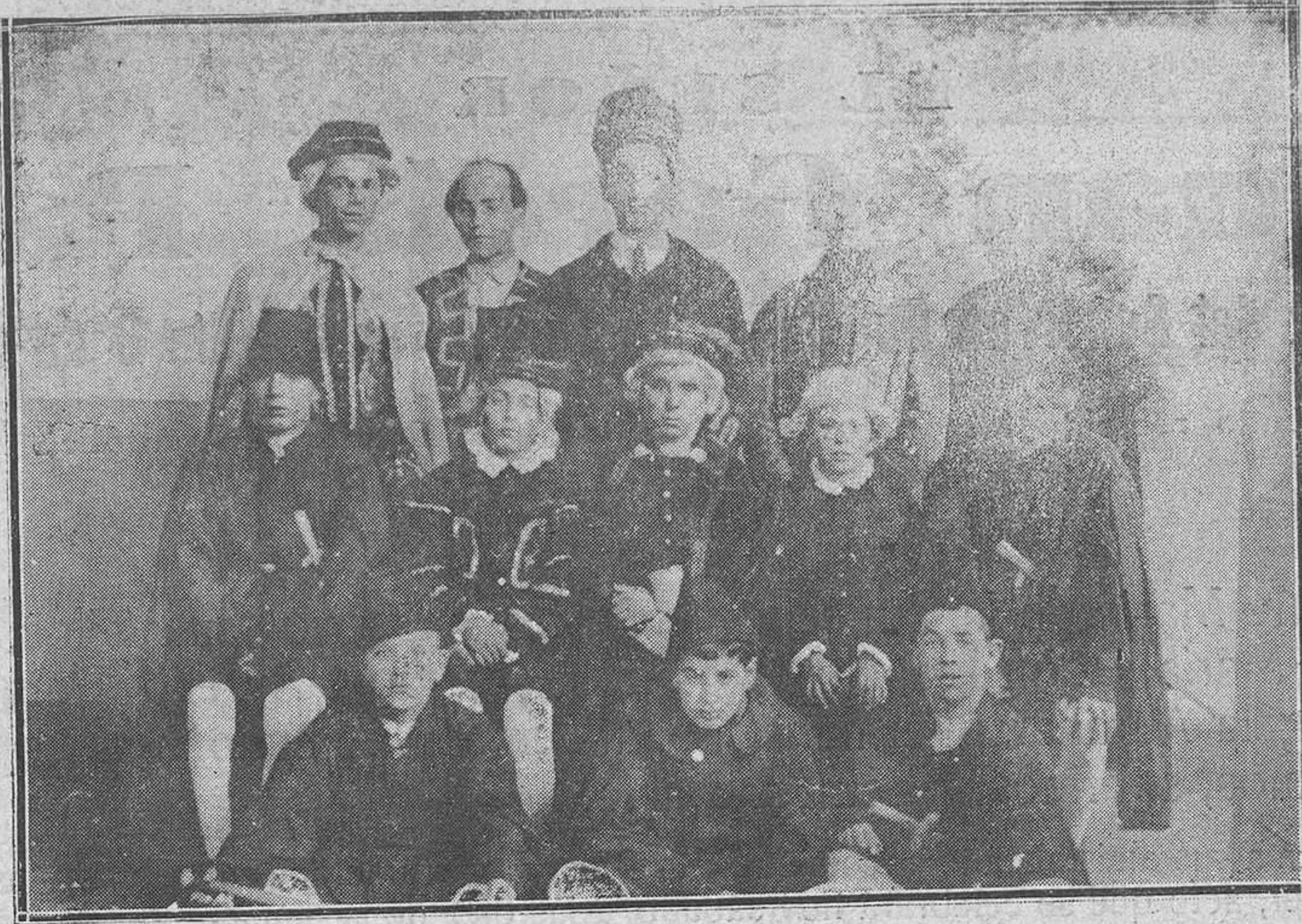
Oviedo: En el Asilo del Fresno.-Jóvenes artistas asilados que pusieron en escena el bonito drama "Ayer y mañana", en honor a sus bienhechores.

debemos abrazar. ¡Asociarse en ella, compañeros! Nada más de engaños, que con la razón, la ley nos defenderá. ¿Qué más útil que esta sociedad que luego de ampararnos procurará buscarnos trabajo? ¿No prevéis lo triste que es el vivir de la caridad pública y, sobre todo, en estos tétricos días de invierno? Hay que precaverse de los lamentos de los hijos del hogar