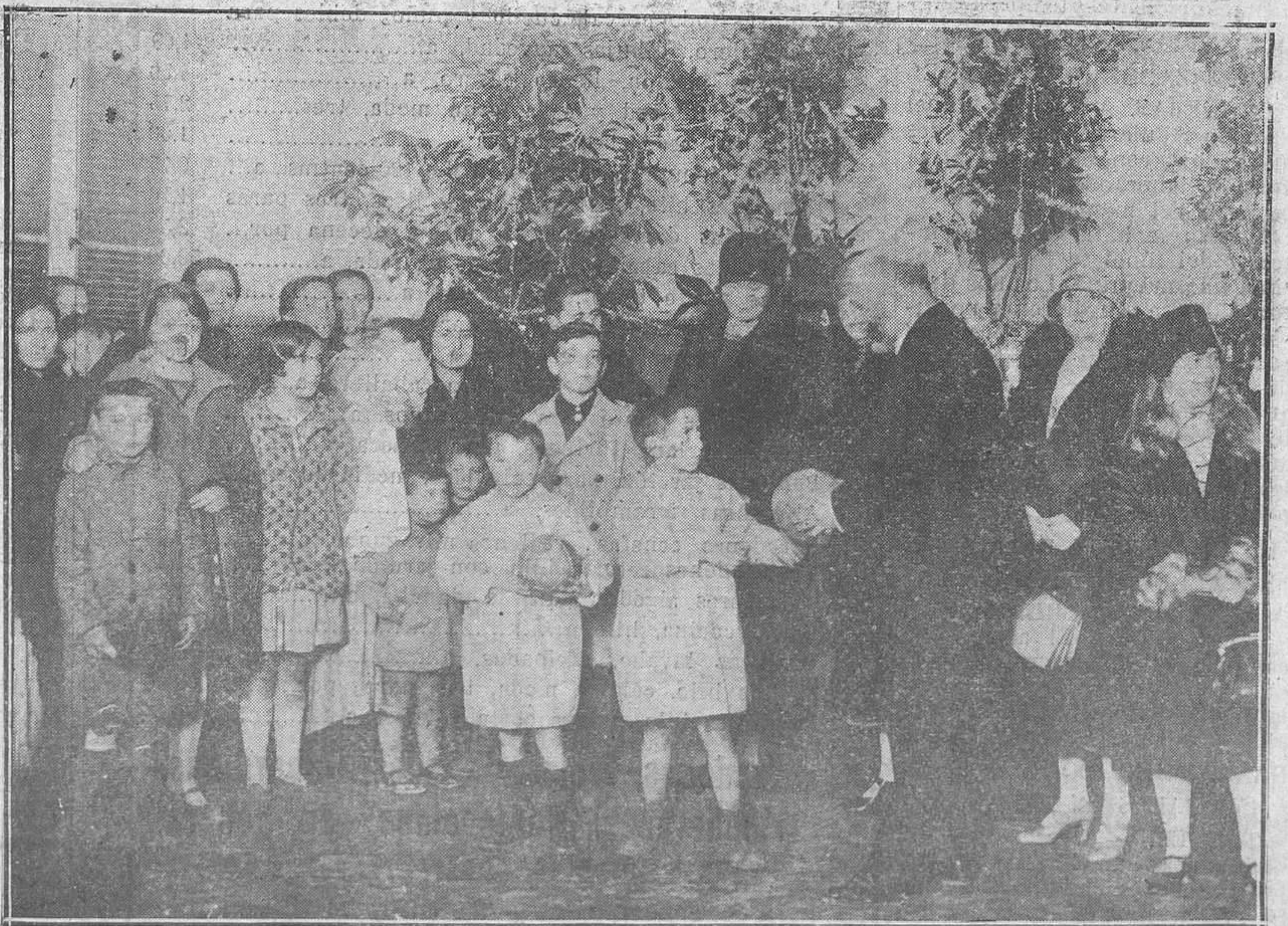
Madrid.-Reparto de Juguetes de Reyes, a los niños, por la Sociedá "Amigos del Niño".