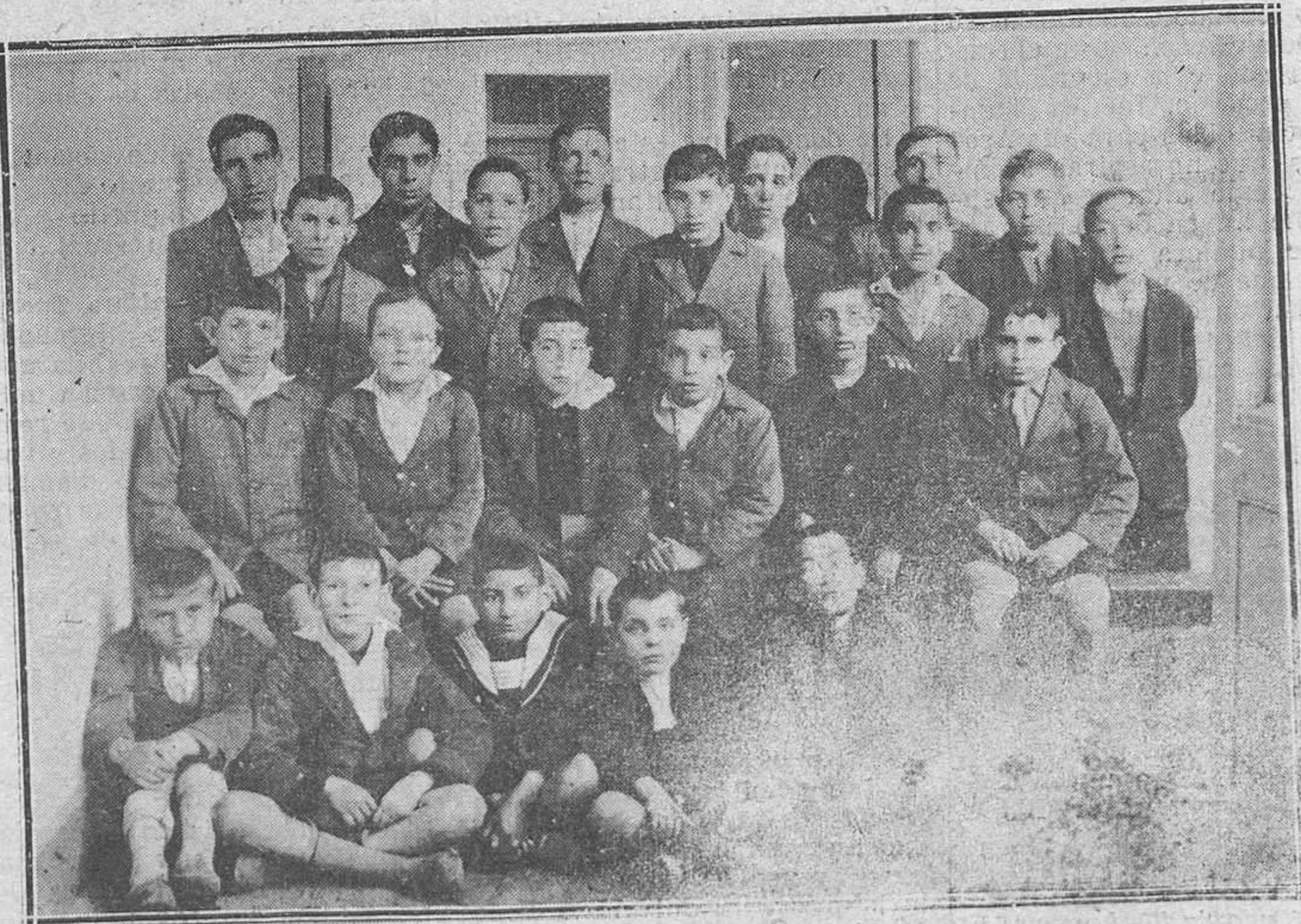
Oviedo: En el Asilo del Fresno.-Grupo de canteres que interpretaron el Himno de los Huerfanitos.