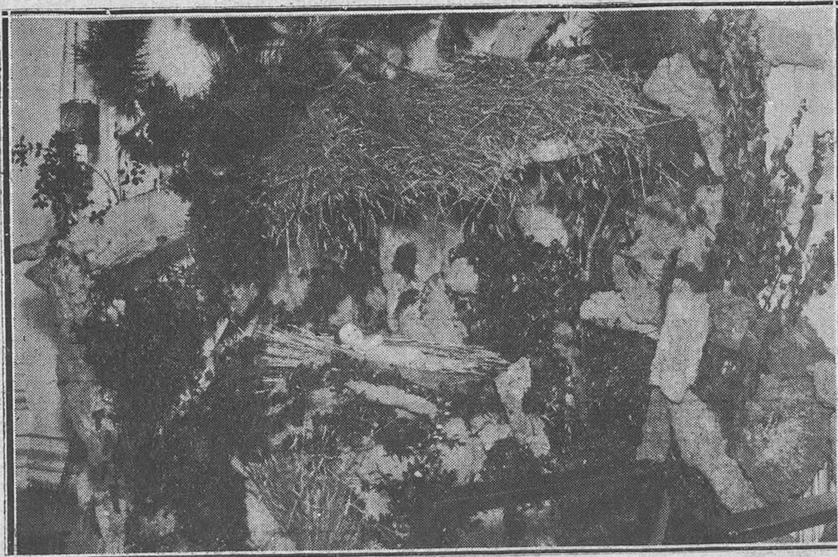
Oviedo.—El Nacimiento expuesto en la Casa de las Damas Catequistas.

mienzo el partido, y son los de San Cristóbal los que avanzan, pero la línea de medios local corta el avance y llega hasta la misma puerta contraria, y cuando la pelota iba a llegar a las mallas un defensa hace una estúpida parada, bloqueando el balón, pitándose el consabido pe-