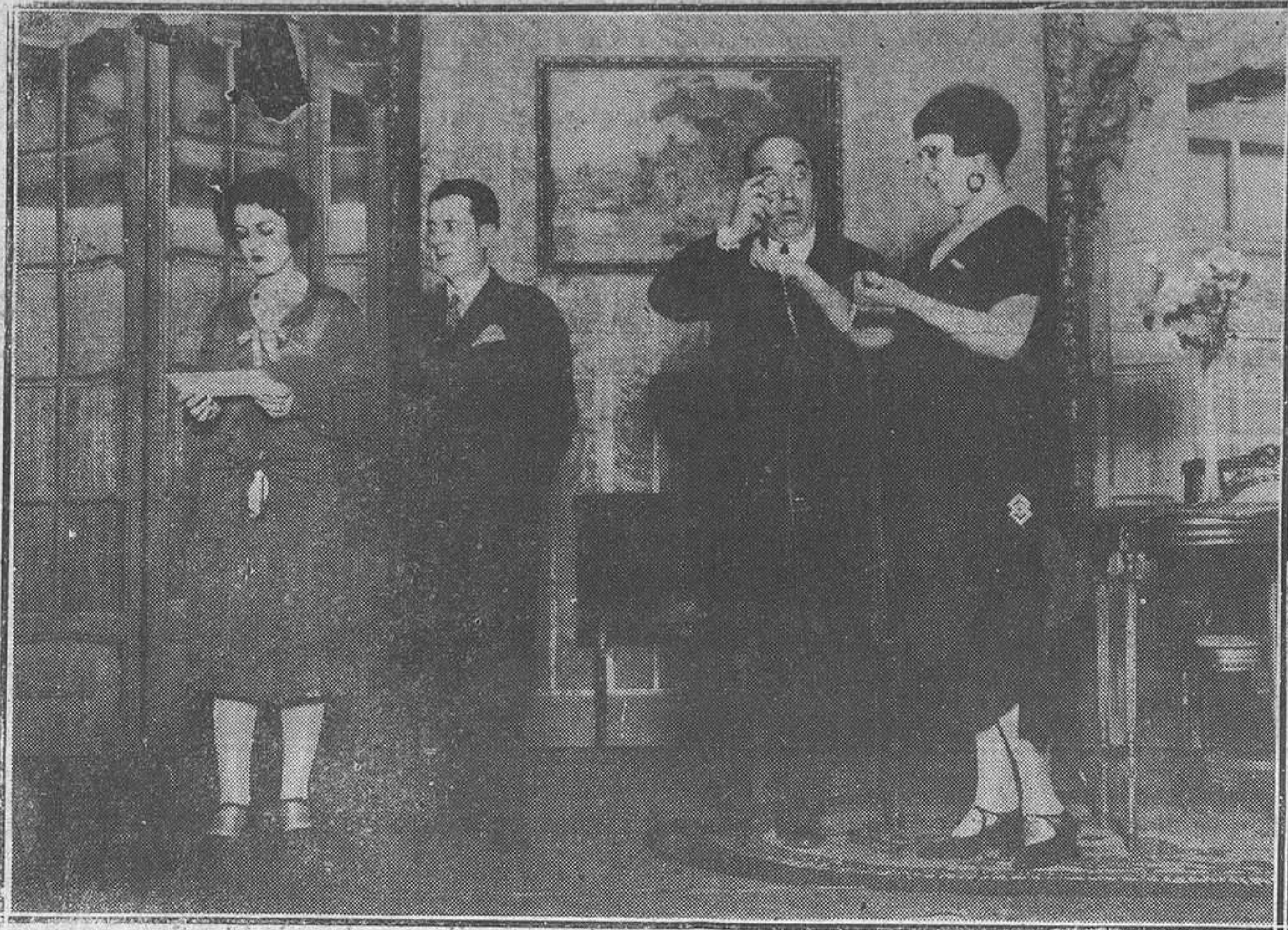
Madrid. Una escena de la comedia frívola "Su mano derecha", original de don Honorio Maufa, que se estrenó en el teatro Infanta Beatriz.

Diputación, y les permite opinar, y les consiente influir, y