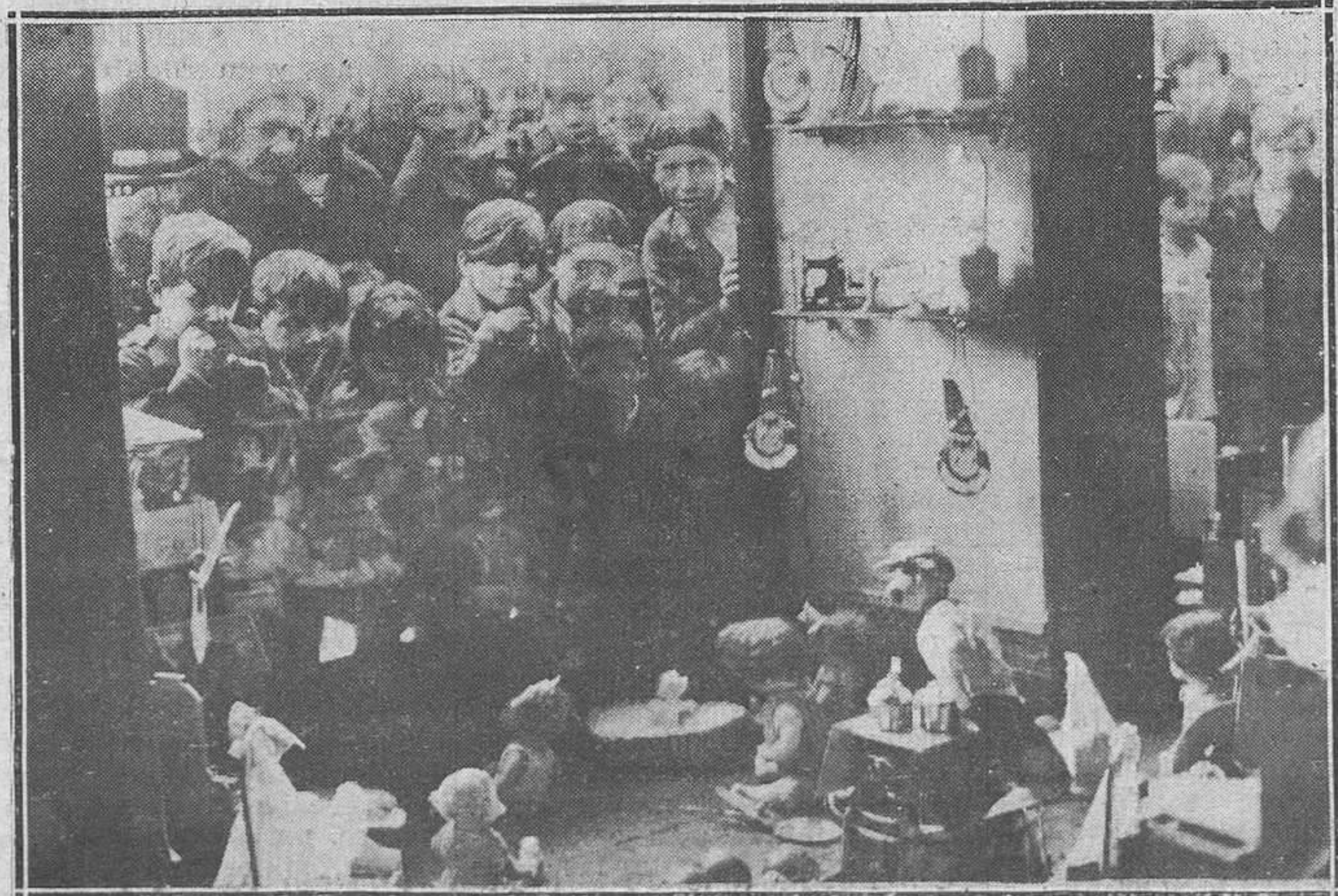
Oviedo.-Un grupo de niños ante los escaparates de la casa Piquero viendo los juguetes de REGION

fabricante de artículos tan útiles como necesarios, le admitiría a usted como Agente vendedor si es culto, inteligente, enérgico, capaz de vencer dificultades por sí mismo y con verdaderos deseos de hacerse un buen porvenir con su trabajo. Exigimos buena presentación y mucha seriedad. Preséntese, si reúne estas condiciones que pedimos, hoy día 5, de once a una de la mañana, al señor Lambás, en el Hotel París, Oviedo, y le expondrá condiciones.